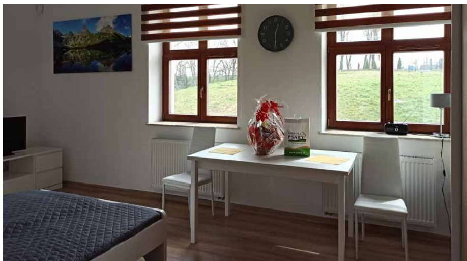
W mieszkaniu chronionym są pokoje dla 3 lokatorów

W ramach projektu pt. „Rozwój oferty usług świadczonych w mieszkaniu chronionym w Goląszy Górnej” współfinansowanego z Europejskiego Funduszu Społecznego, od kwietnia tego roku, przez okres 11 miesięcy, zostanie zapewniony opiekun i asystent osób