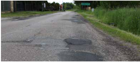
Na ul. Brzowej zostanie wykonana nowa nawierzchnia jezdni

WKRÓTCE ROZPOCZNĄ SIĘ PRACE BUDOWLANE ZWIĄZANE Z PRZEBUDOWĄ DROGI ORAZ BUDOWĄ KANALIZACJI SANITARNEJ NA UL. BRZOWEJ W MALINOWICACH.