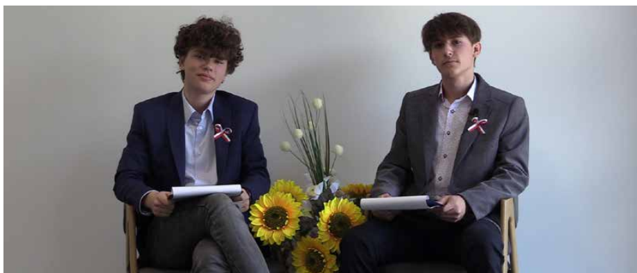
Uczniowie z Dąbia i pracownicy GOK przygotowali montaż słowno-muzyczny