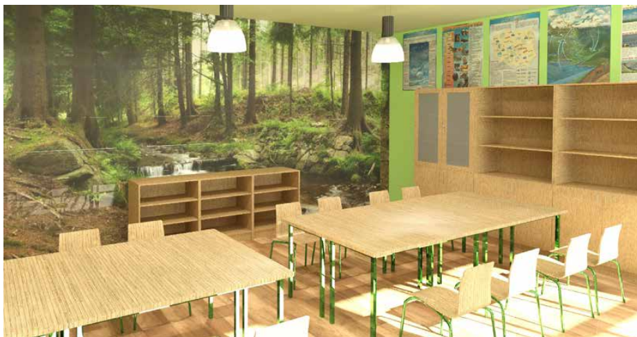
Jedna ze ścian sali pokryta zostanie tapetą przedstawiającą las

SZKOŁA PODSTAWOWA W STRYŻOWICACH ZNALAZŁA SIĘ NA LIŚCIE ZWYCIĘZCÓW KONKURSU „ZIELONA PRACOWNIA’2021”. DZIĘKI ZDOBYTEMU DOFINANSOWANIU W PLACÓWCE ZOSTANIE UTWORZONA PRACOWNIA EKOLOGICZNO-PRZYRODNICZA „NAKRĘCENI NA ZIELONE”, KTÓRA ZOSTANIE WYPOSAŻONA M.IN. W NOWOCZESNY ZESTAW CLASSVR Z OKULARAMI DO WIRTUALNEJ RZECZYWISTOŚCI. DODATKOWO W OKRESIE WAKACYJNYM PLANOWANY JEST KOLEJNY REMONT PLACÓWKI.