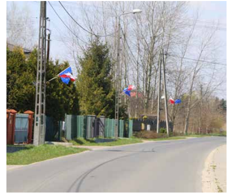
Flagi pojawiły się m.in. przy gminnych drogach

traktowanie uznawane jest jako obrażę narodu i podlega karze. Polskie prawo nie przewiduje jednocześnie kar za brak wywieszanej flagi narodowej w dniu świąt lub uroczystości państwowych. Intencją ustawodawcy było, aby gest ten wynikał z woli samych obywateli, a nie z przymusu. Red.