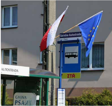
Gminę ozdobiło ponad 1100 flag

W TYM ROKU OBCHODZILIŚMY 230. ROCZNICĘ UCHWALENIA KONSTYTUCJI 3 MAJA ORAZ 17. ROCZNICĘ WSTĄPIENIA POLSKI DO UNII EUROPEJSKIEJ. Z TYCH OKAZJI PRACOWNICY ZAKŁADU GOSPODARKI KOMUNALNEJ W PSARACH ZAWIESILI W NASZEJ GMINIE PONAD 1100 POLSKICH I EUROPEJSKICH FLAG.