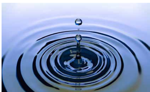
s. 2 CENY ZA WODĘ I ŚCIEKI NA NAJBLIŻSZE LATA s. 4-5