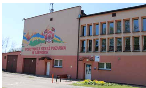
NOWY WÓZ ORAZ ROZBUDOWA GARAŻU OSP W SARNOWIE