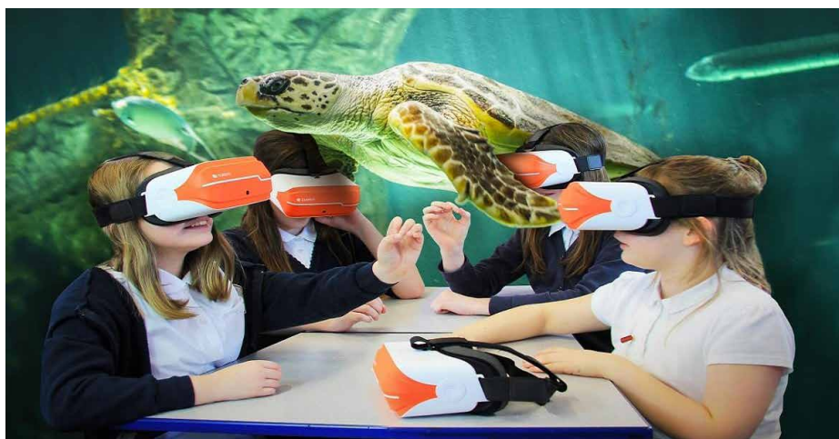
W sali pojawi się zestaw ClassVR, który pozwoli uczniom na wirtualne wycieczki

Przedsięwzięcie zakłada m.in. wykonanie we wszystkich pomieszczeniach gładzi gipsowych oraz malowanie ścian i sufitów. Stare podłogi zostaną zastąpione nowymi: z płytek gresowych oraz z wykładziny PCV. Ponadto planowana jest wymiana drzwi wewnętrznych i części instalacji technicznych. Red.