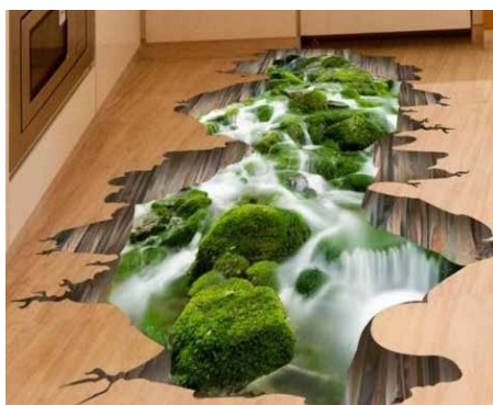
Na podłodze pojawi się naklejka 3D

Pracownia utrzymana zostanie w odcieniach zieleni, a jedną z jej ścian pokryje wielkoformatowa tapeta przedstawiająca las. Nie zabraknie również plansz dydaktycznych związanych ze środowiskiem i przyrodą, w tym o: etapach recyklingu, odnawialnych źródłach energii i atmosferze. Na podłodze pojawi się naklejka imitująca przepływający przez salę strumień.