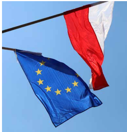
Psarski samorząd dekoruje ulice flagami już od 2016 r.

wieszali flagi przy swoich domach, nadający tym samym należyłą rangę ważnym wydarzeniom w naszym kraju. Przypominamy jednak, że flaga państwowa podlega ochronie prawnej, a jej zniszczenie lub obelżywe