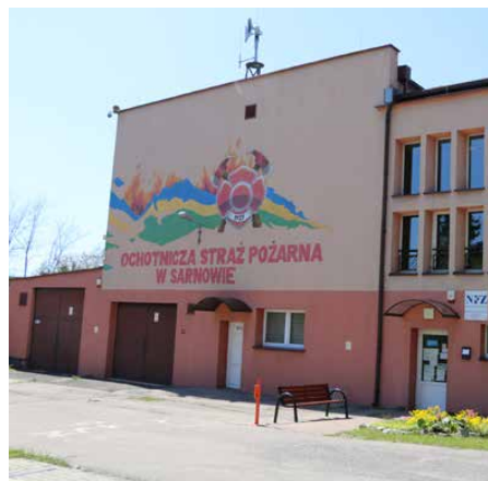
Budynek OSP zostanie zmodernizowany

400 tys. zł potrzebne na zakup pojazdu zabezpieczone zostało w budżecie Gminy Psary na rok 2021, a na początku marca, Mateusz Smoczyński złożył wniosek do Państwowej Straży Pożarnej o dofinansowanie zakupu średniego samochodu ratowniczo-gaśniczego. 5 maja decyzja o przyznaniu środków została zatwierdzona przez Komendanta Głównego Państwowej Straży Pożarnej. Na liście jednostek OSP przewidzianych do dofinansowania zakupu samochodu ratowniczo-gaśniczego znalazła się jednostka OSP Sarnów, która otrzyma 400 tys. zł dotacji z KSRG. Zaplanowane i zdobyte w ten sposób środki umożliwią nabycie nowego wozu.