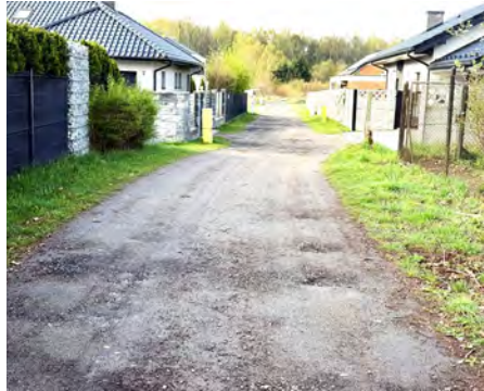
Wkrótce ruszy przebudowa drogi na cmentarz w Preczowie

Zakres planowanych prac przewiduje przebudowę 323 metrowego odcinka ulicy Świerkowej. Powstanie na nim jezdnia o nawierzchni asfaltowej wraz z krawężnikami, a także pobocza wykonane z kruszywa. W ramach inwestycji zaplanowano również m.in. przebudowę istniejącego rowu, budowę kanalizacji deszczowej oraz oświetlenia ulicznego. Przewidziano także przebudowę infrastruktury technicznej kolidującej z inwestycją, w tym sieci wodociągo-