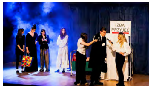
Spektakl bawił i skłaniał do refleksji

Liczne wybuchy śmiechu oraz entuzjastyczne reakcje widzów potwierdziły, że spektakl nie tylko bawił, ale również skłaniał do refleksji nad codziennymi relacjami i społecznymi rolami. GOKiS