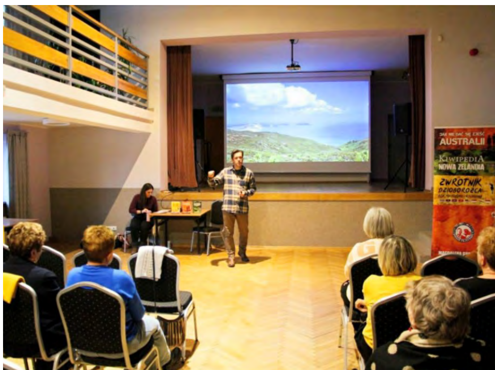
Podróżnicy opowiedzieli o prawdziwym obliczu Nowej Zelandii

Nie zabrakło również opowieści o zjawiskach geotermalnych. Kolorowe jeziora siarkowe i bulgoczące błota w rejonie Wai-O-Tapu pokazują, że ziemia wciąż tam „żyje” – od-