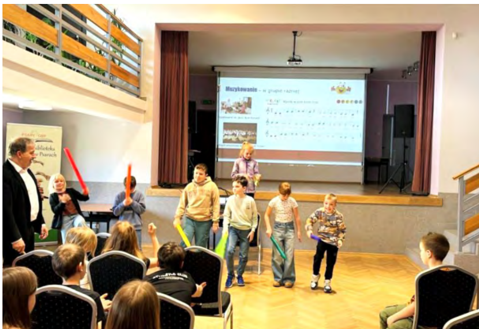
Młodzi studenci spotkali się z muzyką

uczestników i być może stanie się początkiem ich pięknej muzycznej przygody. GBP