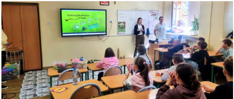
Warsztaty połączyły naukę z praktyką i zabawą

można śmiało powiedzieć, że rośnie nam świadome i odpowiedzialne pokolenie.