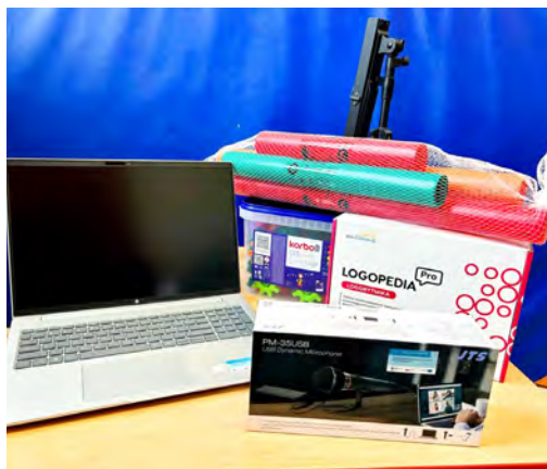
Do placówki trafił profesjonalny sprzęt

Placówka jest systematycznie wyposażana w wysokiej jakości pomoce dydaktyczne, wspierające rozwój dzieci w wielu obszarach. Istotnym wsparciem w tym zakresie jest projekt „Aktywny rozwój przedszkoli