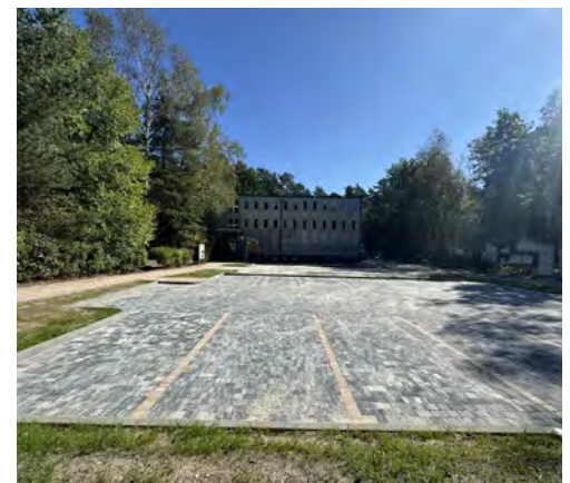
Miejsca parkingowe są też dostępne przy urzędzie

Parkingi Park&Ride w Gminie Psary powstały w ramach projektu „Wdrożenie systemu multimodalnej mobilności miejskiej w Gminie Psary”. Inwestycja została współfinansowana w ramach Funduszy Europejskich dla Śląskiego 2021-2027. Wartość projektu wynosi 12 830 701,48 zł, a wysokość wkładu z Funduszy Europejskich sięga 6 439 187,99 zł. Red.