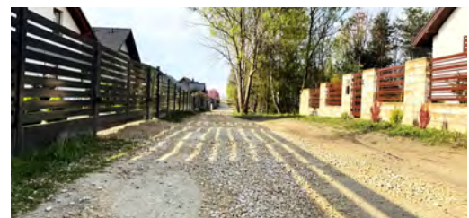
Ulica Kasztanowa w Psarach przejdzie kompleksową modernizację

niu inwestycji infrastruktura w tym rejonie będzie w pełni nowoczesna. Red.