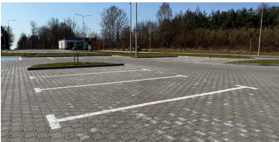
Parking Park&Ride dostępny jest przy Centrum Przesiadkowym w Psarach

Współczesne wyzwania związane z ochroną środowiska sprawiają, że coraz częściej zwracamy uwagę na codzienne nawyki – także te związane z transportem. Jednym z prostych i skutecznych sposobów na ograniczenie negatywnego wpływu komunikacji na środowisko jest korzystanie z systemu Park&Ride dostępnego w Gminie Psary. Jedno centrum Park&Ride jest już dostępne przy dworcu autobusowym, a w następnych dwóch latach powstaną kolejne 3 w: Psarach, Strzyżowicach i Dąbiu.