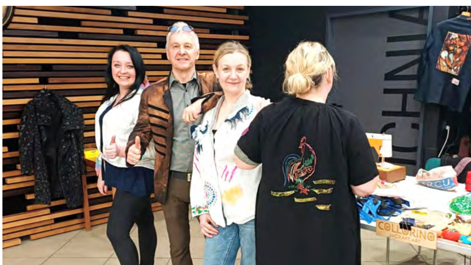
Podczas warsztatów powstały oryginalne stylizacje

Nie tylko warsztaty dają możliwość nadania ubraniom drugiego życia – warto również korzystać z dostępnych form zbiorów odzieży. Przyniesione ubrania w dobrym stanie mogą zostać ponownie wy-