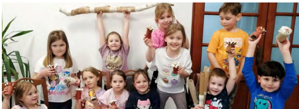
Dzieci brały udział w różnych warsztatach

Jednym z najważniejszych punktów programu był Festiwal Piosenki Ekologicznej „Muzyka Lubi Eko”, który odbył się 15 kwietnia. Wydarze-