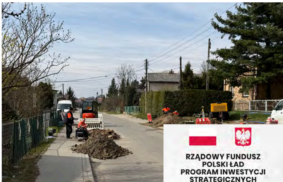
Trwają prace związane z wykonaniem przyłączy

Całkowity koszt zadania wynosi 8 594 445,12 zł, z czego 8 mln zł pochodzi z Programu Inwestycji Strategicznych „Polski