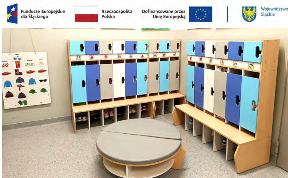
W przedszkolu w Strzyżowicach wyremontowano szatnię

w Gminie Psary”, współfinansowany ze środków Unii Europejskiej w ramach programu Fundusze Europejskie dla Śląskiego na lata 2021–2027, realizowany we wszystkich przedszkolach na terenie gminy.