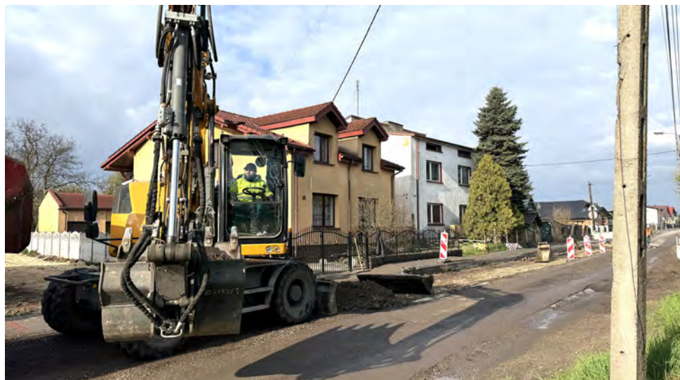
Prace prowadzone są w okolicy biblioteki i OSP w Psarach

Gmina realizuje inwestycje w sposób kompleksowy – tam, gdzie to możliwe, prace obejmują jednocześnie kanalizację, odwodnienie, wodociągi oraz modernizację dróg. Dzięki temu mieszkańcy zyskują większy komfort, a infrastruktura jest bardziej funkcjonalna i trwała. Red.