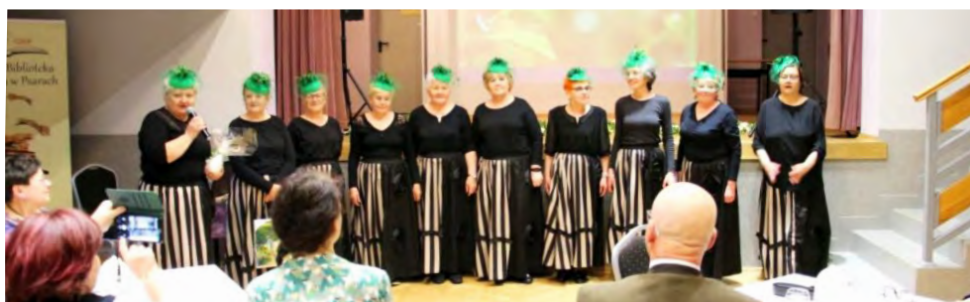
Wydarzenie wzbogacił występ strzyżowickiego teatru "Wszystko Przed Nami"

Wiosna była motywu przewodnim Kawiarenki Literackiej, która odbyła się w naszej bibliotece pod koniec marca. Jak co roku, spotkanie wzbogaciła wspólna lektura tekstów – tym razem poświęconych właśnie tej porze roku.