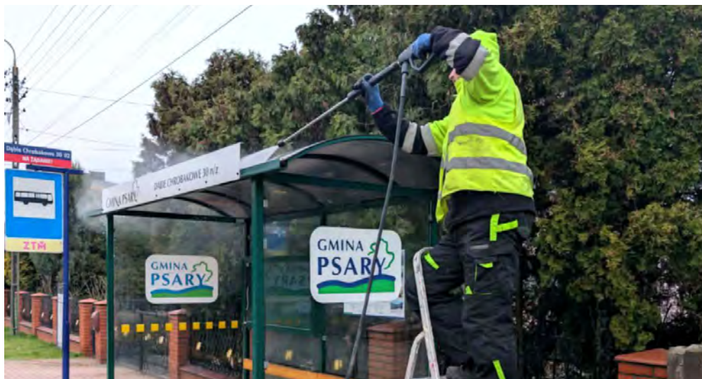
Wiaty przystankowe są starannie myte