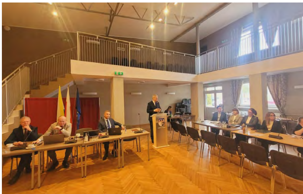
Efekt prac został zaprezentowany podczas marcowego spotkania

Przyjęte podejście jasno pokazuje, że bezpieczeństwo lokalnej społeczności to zadanie wspólne. Opracowana strategia stanowi nowoczesne narzędzie zarządzania kryzysowego, które pozwoli Gminie Psary skuteczniej reagować na zagrożenia oraz budować odporność na sytuacje nadzwyczajne. Red.