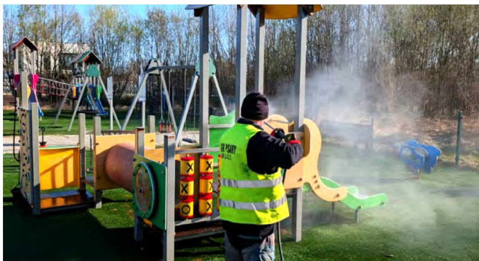
Pracownicy ZGK przygotowują m.in. place zabaw do sezonu letniego

- Wiosenne porządki to nie tylko kwestia estetyki. Przegląd placów zabaw czy siłowni plenerowych to