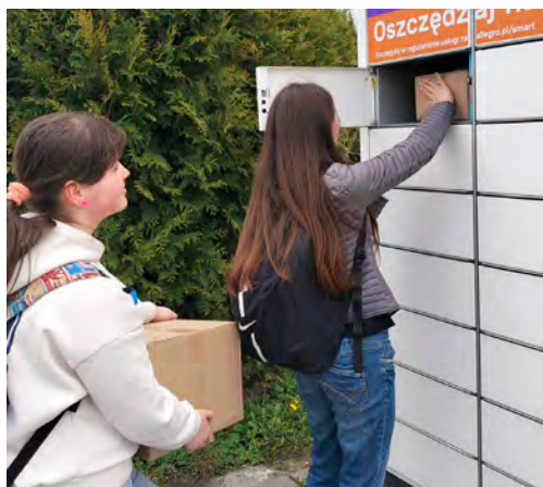
Młodzież włączyła się w akcję EKOzwroty

Takie działania pokazują, że troska o środowisko może iść w parze z prostymi, codziennymi decyzjami. Każdy może włączyć się w ideę ponownego obiegu rzeczy – wystarczy odrobina dobrej woli. Red.