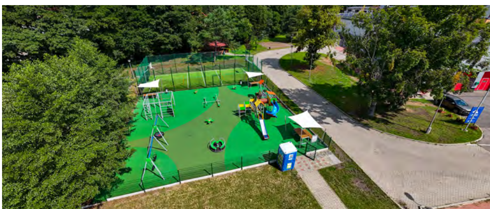
Trwa przygotowanie projektu oświetlenia boiska przy CUS w Strzyżowicach

Rok 2026 rozpoczął się nowym, rekordowo wysokim gminnym budżetem inwestycyjnymi nowymi wyzwaniem. Nie zwalniamy tempa – przed nami zarówno realizacja inwestycji wieloletnich, jak i wiele nowych projektów. To także czas przetargów oraz opracowań dokumentacji projektowych. W sumie plan zamówień publicznych na 2026 rok przewiduje przeprowadzenie 68 przetargów.