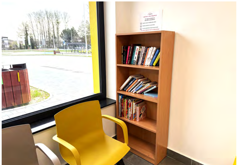
Każdy może zabrać wybraną książkę, przeczytać i przekazać dalej

Zachęcamy wszystkich do aktywnego udziału - wystarczy przyjść, wybrać coś dla siebie i zostawić inną książkę dla kolejnych osób. Dzięki temu wspólnie można stworzyć żywą, stale zmieniającą się bibliotekę dostępną dla każdego. Red.