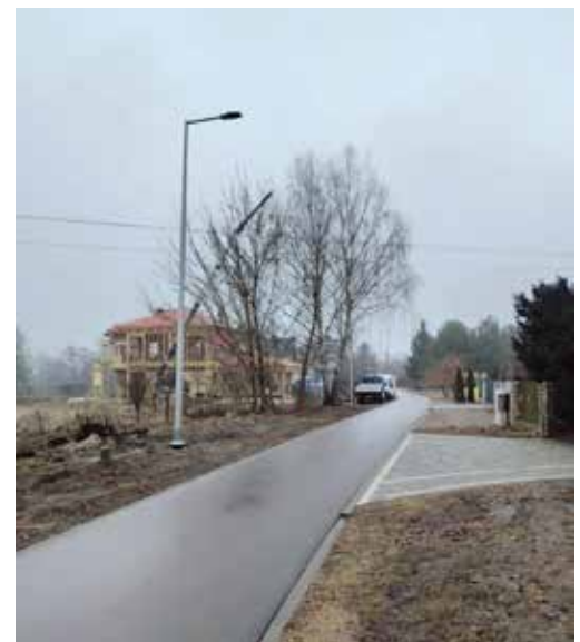
Inwestycja była prowadzona również na ulicy Brzeźnej w Preczowie