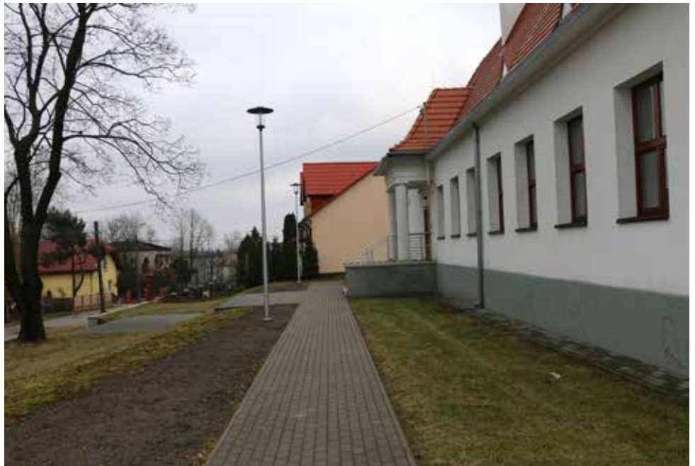
Nowe oświetlenie uliczne przy Ośrodku Kultury w Gołąszy Górnej

W ramach kolejnej umowy o wartości 240 465,0 zł przewidziany jest montaż 6 słupów na odcinku ok. 306 metrów ulicy Sportowej w Strzyżowicach, 8 słupów na odcinku 406 metrów ulicy Polnej w Psarach, 5 słupów na odcinku ok. 255 metrów w Dąbiu Górnym, 6 słupów na odcinku ok. 213