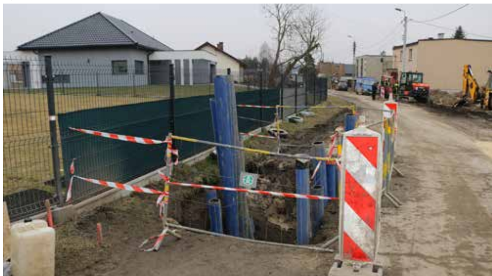
W 2025 roku kontynuowane są prace rozpoczęte w roku ubiegłym

Ponadto, ekipy wybranych już wykonawców przystąpią wkrótce do realizacji kolejnych inwestycji. W ulicy Belnej w Strzyżowicach oraz 1 Maja w Strzyżowicach wybudowane zostanie około 1700 metrów sieci kanalizacji wraz z odejściami do działek prywatnych w granicach pasa drogowego. Wartość przedsięwzięcia wynosi ponad 3,2 mln złotych, a planowany termin realizacji to kwiecień 2026 roku. Warto również wspomnieć tutaj remont ulicy Wolności w Psarach, podczas którego wybudowanych zostanie także 450 metrów sieci kanalizacji ciśnieniowej. Termin realizacji inwestycji to wrzesień 2025 roku, a jej całkowity koszt to 850 tysięcy złotych.