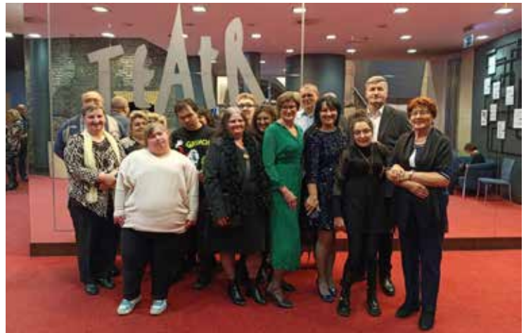
Stowarzyszenie wspiera nie tylko osoby z niepełnosprawnością, ale również ich rodziny

Wspólne wyjazdy i spotkania pokazują, że można pokonać własne słabości i są motywacją do walki z trudnościami i przeciwnościami losu. Dostarczają wiele emocji i wzruszeń. Wszystkie te chwile mogły stać się rzeczywistością, dzięki pomocy jaką otrzymaliśmy ze strony Urzędu Gminy w Psarach. Red. Stowarzyszenie „Tańczące Motyle”