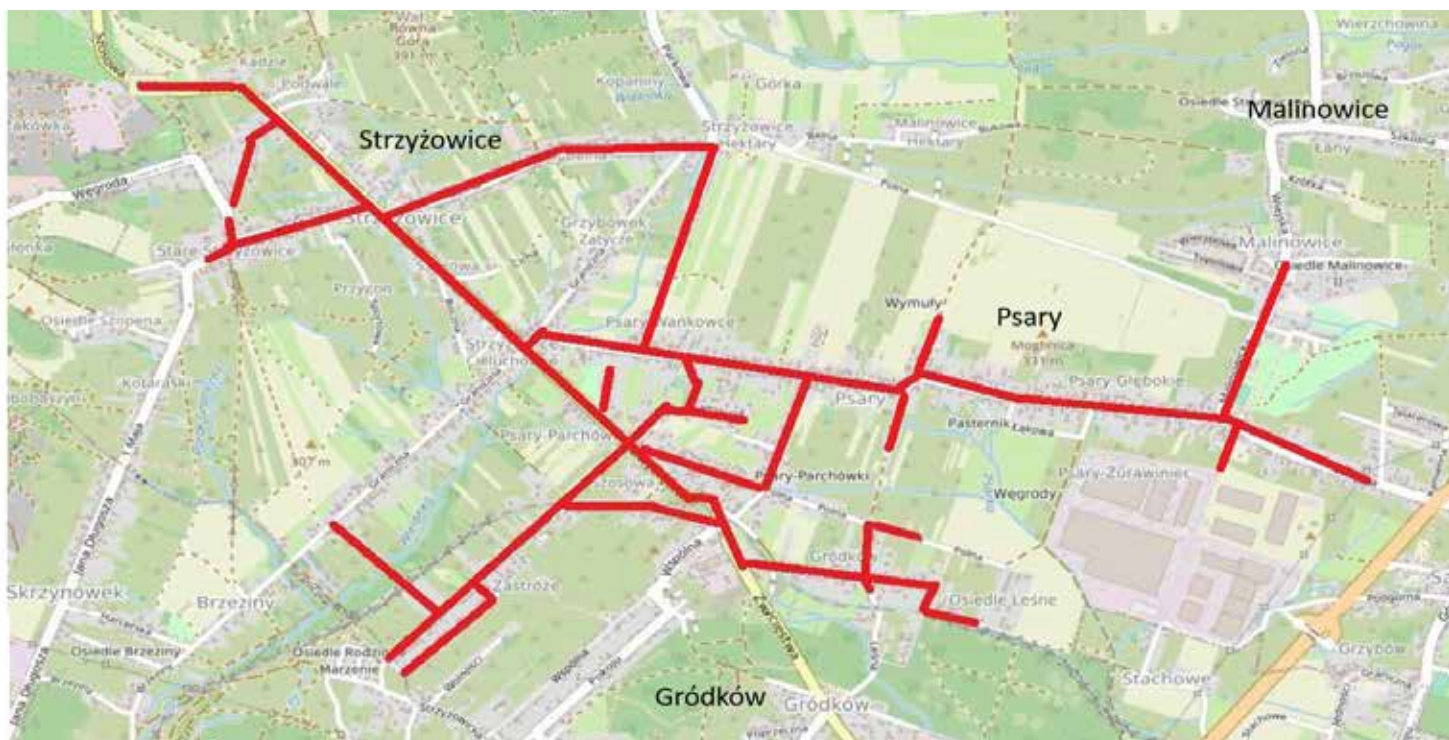
Budowane w 2025 roku odcinki kanalizacji sanitarnej

Dodatkowo, trwa wybór wykonawcy na wybudowanie około 200 metrów sieci kanalizacji wraz z odciami do działek prywatnych w ulicy Grabowej w Psarach. Szacowany koszt zadania to około 400 tysięcy złotych. Red.