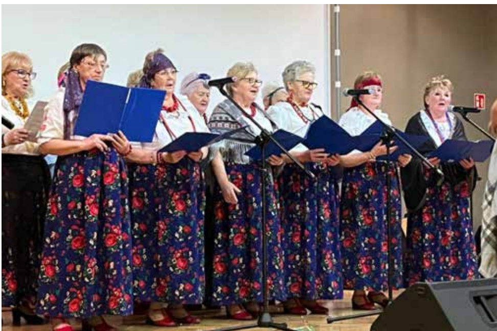
Wydarzenie odbyło się w Ośrodku Kultury w Dąbiu

4 marca w Ośrodku Kultury w Dąbiu odbyły się huczne zapusty. Na scenie zaprezentowały się lokalne zespoły, które przygotowały barwne i różnorodne występy.