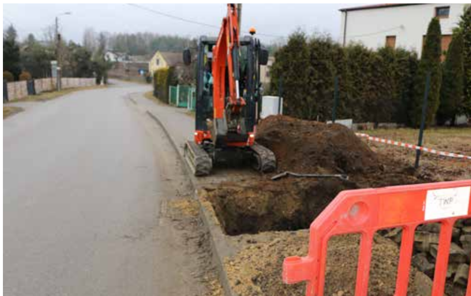
Prace prowadzone są w granicach posesji

Rozbudowa sieci kanalizacji sanitarnej w gminie Psary w roku 2025 nie zwalnia tempa. W sumie w bieżącym roku planujemy wydać na ten cel blisko 30 mln złotych. Poza kontynuacją obecnie realizowanych zadań, Zakład Gospodarki Komunalnej Sp. z o.o. przystępuje do ogłoszenia przetargów na kolejne odcinki modernizacji sieci wodociągowej oraz budowy kanalizacji sanitarnej. Zapraszamy do zapoznania się ze streszczeniem planowanych przedsięwzięć.