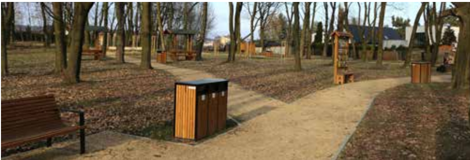
Leśny Park Przygód jest chętnie odwiedzany przez mieszkańców

niu czystości. Sprzątanie po swoich pupilach to nie tylko obowiązek, ale także wyraz szacunku do innych i wspólnej przestrzeni, z której korzystają wszyscy. Ponadto, w przypadku zauważenia jakichkolwiek śmieci lub zanieczyszczeń, pomimo regularnego sprzątania przez pracowników ZGK Sp. z o.o., zachęcamy mieszkańców do kontaktu z nami. Numery telefonów, pod którymi można się z nami skontaktować, znajdują się na tabliczkach informacyjnych przy naszych obiektach rekreacyjnych. Wspólnymi siłami – gminy i mieszkańców – możemy uczynić te tereny jeszcze bardziej atrakcyjnymi i przyjaznymi do spędzania czasu na świeżym powietrzu. Red.