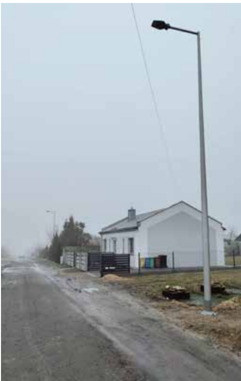
Prace były prowadzone we wszystkich sołectwach gminy

się 4 nowe słupy oświetleniowe za kwotę 63 960 zł, podczas gdy montaż 4 latarni na odcinku około 152 metrów ulicy Jaworowej w Preczowie pochłonię 49 064,70 zł. Red.