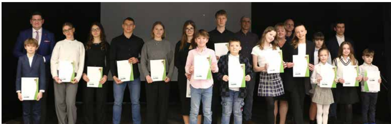
Wyróżnionych zostało 33 mieszkańców naszej gminy