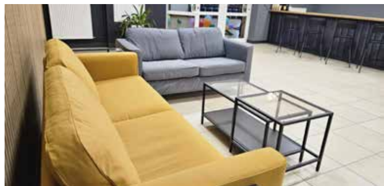
Nowy hol w Ośrodku Kultury w Gródkowie