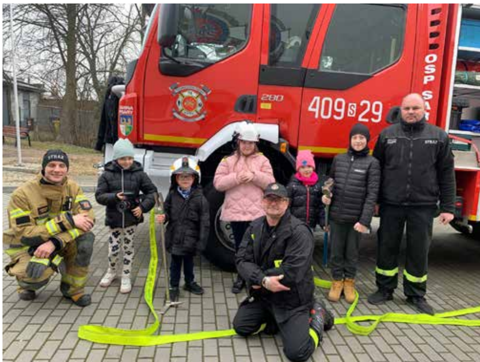
Ferie były pełne atrakcji dla dzieci i młodzieży

Podczas tegorocznych ferii nie zabrakło również edukacyjnych akcentów. W Ośrodku Kultury w Sarnowie odbyły się spotkania z policjantem i strażakiem z OSP Sarnów, podczas