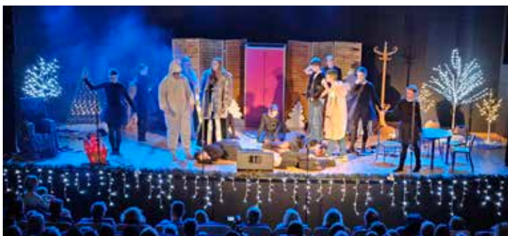
Spektakl cieszył się dużym zainteresowaniem

6 lutego w Ośrodku Kultury w Strzyżowicach oczom publiczności ukazała się magiczna kraina Narnii, a wszystko to za sprawą dziecięcego i młodzieżowego Teatru „Kurtyna” z Ośrodka Kultury w Dąbju, który zaprezentował spektakl „Opowieści z Narnii - Na Ratunek Bajkom!”.