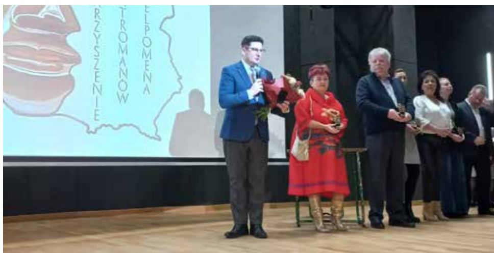
Stowarzyszenie Melpomena działa już od ponad roku

diowy, jak „Historie Łózkowe” w Teatrze Nowym w Zabrzu czy „Nerwicę namiętną” w Teatrze Korez. Obok dużych, dynamicznych widowisk scenicznych, takich jak musical „Nędznicy” w Teatrze Muzycznym w Łodzi czy „Poławiaczce pereł” w Operze Śląskiej, teatromani mogli obejrzeć na małej scenie Teatru Polskiego w Bielsku-Białej teatr jednego aktora, czyli monodram „Wanda”, poświęcony himalaistce Wandzie Rutkiewicz. Jednym z bardziej wyczekiwanym wydarzeń kulturalnych, nie tylko teatralnych, był grudniowy dzień spędzony w Otrębusach, siedzibie zespołu „Mazowsze”. Grupa zwiedziła tam centrum Folkloru Polskiego Karolin, wzięła udział w jarmarku bożonarodzeniowym, a na koniec obejrzała niezwykle widowiskowe muzyczne ze 150-osobową obsadą, oparte na dramacie Lucjana Rydla „Betlejem Polskie”. Warto też dodać, że podróż przez sztukę teatru staje się dla członków stowarzyszenia okazją do poznawania kultury i historii odwiedanych miejsc. W minionym roku były to: Warszawa, Łódź, Kraków, Bielsko-Biała i podwarszawskie Otrębusy.