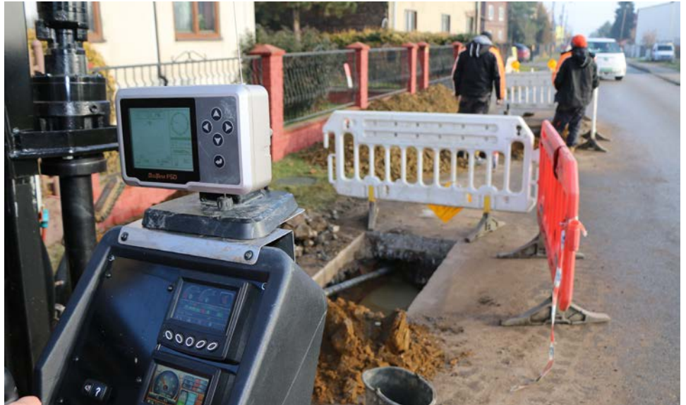
Prace prowadzone są przewiertem sterowanym

BS: Nasza firma buduje kanalizacje ciśnieniowe od szeregu lat. Metodą przewiertu sterowanego realizujemy nie tylko budowę kanalizacji, ale także innych mediów takich jak: sieć wodociągowa, sieć telekomunikacyj-