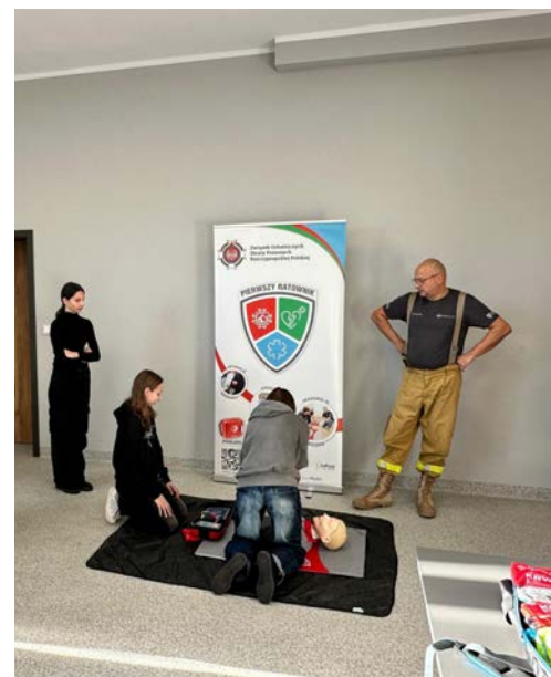
W szkoleniach biorą udział również uczniowie

Zapraszamy do śledzenia informacji o kolejnych wydarzeniach i działaniach Centrum, które będą publikowane w lokalnych mediach. Inwestycja w edukację z zakresu ratownictwa to krok w stronę bezpieczniejszej i bardziej świadomej społeczności! WK