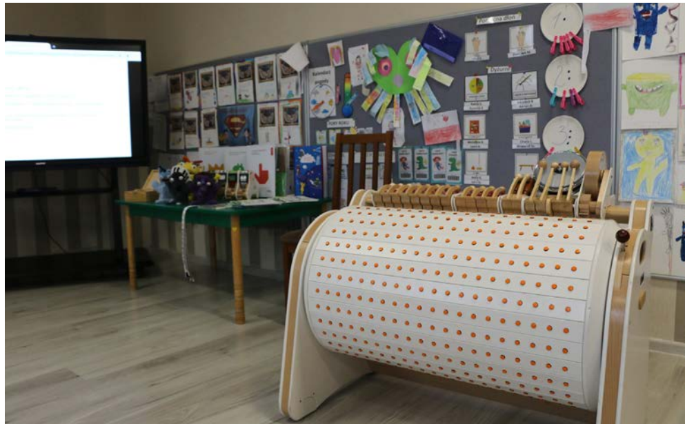
Musicon to nowoczesne urządzenie edukacyjne i terapeutyczne

Musicon to wszechstronne, rewolucyjne urządzenie edukacyjne i terapeutyczne, ale także autorska metoda pracy. To innowacyjny sposób na ćwiczenie kreatywności, wielozmysłową edukację, rozwój funkcji poznawczych. Dzięki sile muzyki uruchamia emocje i skutecznie zwiększa zaangażowanie. Wspiera dzieci w zakresie rozwoju funkcji poznawczych, mowy, umiejętności społecznych,