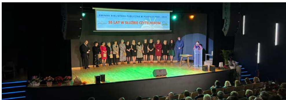
55-lecie GBP było okazją do wspólnego świętowania