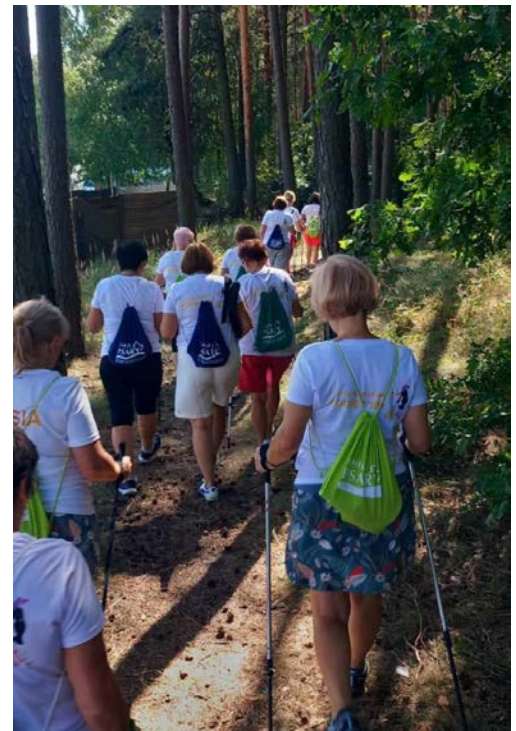
Członkinie wspólnie brały udział w warsztatach