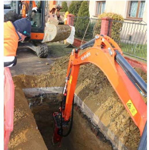
Budowa zakończy się w 2025 roku

Bogusław Szymoniak: Horyzontalne przewiertu sterowane to nowoczesna technologia bezwykopowa polegająca na wykonywaniu poziomych przewiertów kierunkowych, które są w pełni sterowalne. Pozwala ona na omijanie przeszkód, takich jak fundamenty, kable, czy media co ma szczególne znaczenie na terenach silnie zurbanizowanych. Pierwszym krokiem jest wykonanie wiercenia pilotażowego głowicą wierzącą z sondą - nadajnikiem po zaplanowanej trasie, w trakcie którego podawana jest specjalna mieszanina, która stabilizuje otwór wiertniczy. Następnie do żerdzi montowana jest głowica rozwiercająca, do której podczepiona zostaje rura, która wraz z obrotami