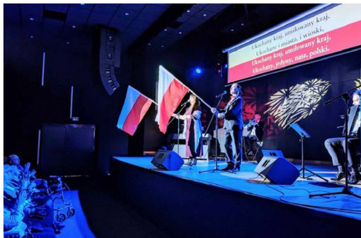
Tradycyjnie 11 listopada odbył się koncert patriotyczny

Na koniec wszyscy zebrani uroczystie odśpiewali Hymn Polski - Mazurka Dąbrowskiego. GOK