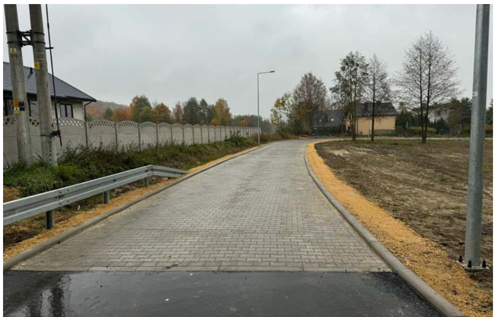
Gminna ulica Parkowa w Strzyżowicach została wybudowana

Głównym Wykonawcą tego zadania była firma GENERAL DEVELOPMENT Sp. z o.o. z Tarnowskich Gór, która złożyła najkorzystniejszą ofertę w przetargu. Wartość umowy wynosiła 1 080 965,88 zł. Warto wspomnieć, że projekt ten został dofinansowany z Rządowego Funduszu Rozwoju Dróg, z którego gmina ma zagwarantowane 396 405 złotych dotacji. Red.