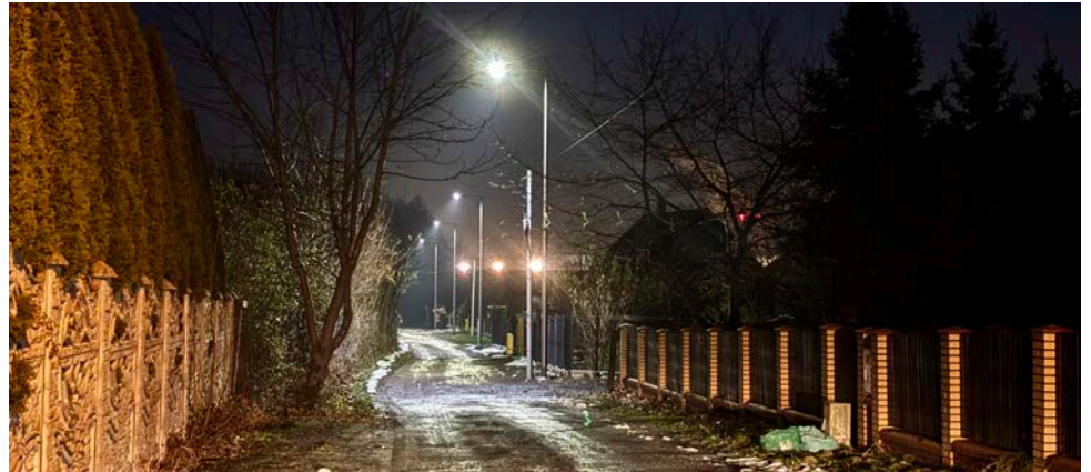
W Gródkowie na ulicy Wschodniej pojawiło się nowe oświetlenie

Dolnych, Psarach, Malinowicach oraz budynku Ośrodka Kultury w Goląszy Górnjej. Red.