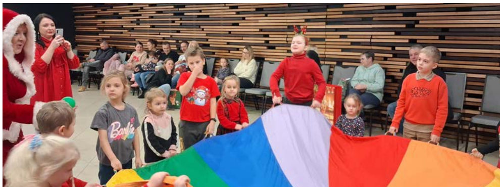
W Ośrodku Kultury w Preczowie odbyła się zabawa mikołajkowa