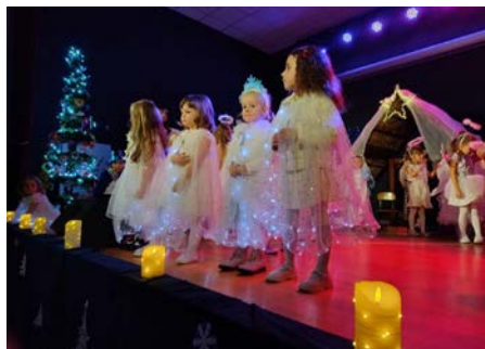
Jasełka odbyły się w przedszkolu w Sarnowie

Po powitaniu przyszedł czas na prezentację programu artystycznego. Najmłodsi przypomnieli zgromadzoną historię narodzin Jezusa. Przedszkolaki z ogromnym zaangażowaniem i przejęciem wcieliły się w