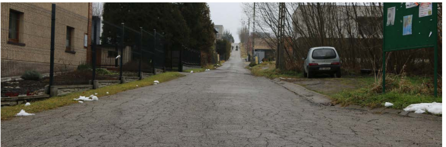
Na 450 mb drogi pojawi się nowa nawierzchnia asfaltowa

nosi 850 565,51 zł. Inwestycja będzie współfinansowana z dotacji Rządowego Funduszu Rozwoju Dróg w kwocie 463 000 zł. Termin realizacji zadania to wrzesień 2025. Red.