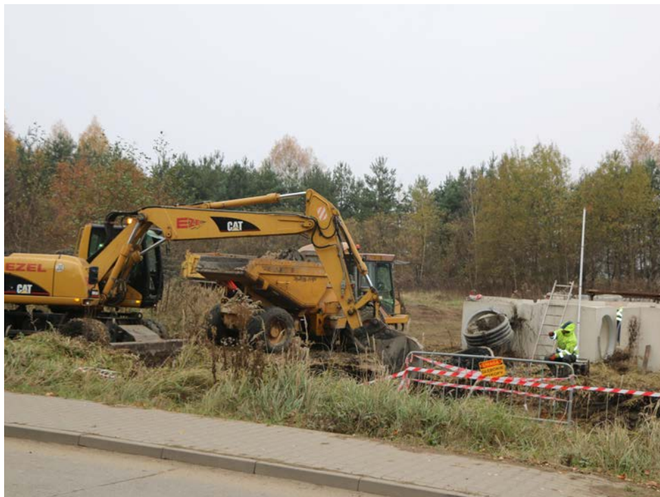
Wkrótce w Psarach powstanie centrum przesiadkowe