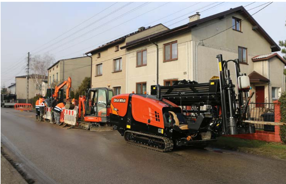
Technologia budowy pozwala na mało inwazyjną budowę

BS: Metoda ta jest mało inwazyjna i można przyjąć, że odejścia do granic