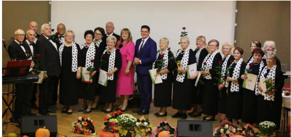
W listopadzie zespół „Dąbie” obchodził swoje 35-lecie

Zespół „Dąbie” ma na swoim koncie liczne występy w przeglądach i konkursach folklorystycznych, zarówno na poziomie gminnym, jak i ogólnopolskim. Brał udział w takich wydarzeniach jak: „Regionalny Festiwal Pieśni Zalotnych i Miłosnych” w Preczowie, Przegląd Wiejskich Zespołów