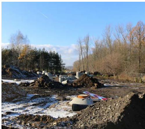
Planowany termin zakończenia prac to koniec listopada 2025 roku