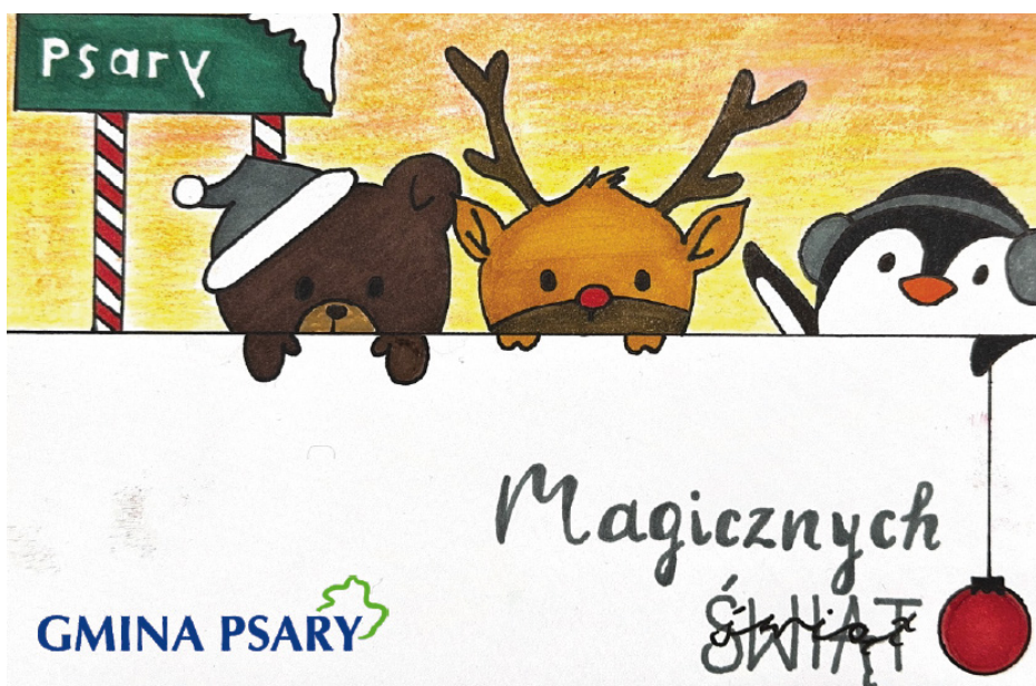
Oficjalna kartka Gminy Psary na święta Bożego Narodzenia