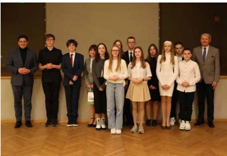
Młodzieżowa Rada Gminy Psary kadencji 2024-2029

2 grudnia w Ośrodku Kultury w Dąbiu odbyła się pierwsza sesja Młodzieżowej Rady Gminy Psary kadencji 2024-2029, podczas której nowo wybrani przedstawiciele złożyli ślubowania.