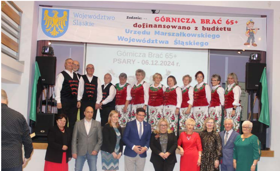
Stowarzyszenie „Aktywny Senior” wspólnie świętowało Dzień Górnika

Stowarzyszenie Emerytów i Rencistów „Aktywny Senior” w Psarach po raz kolejny uczciło Dzień Górnika.