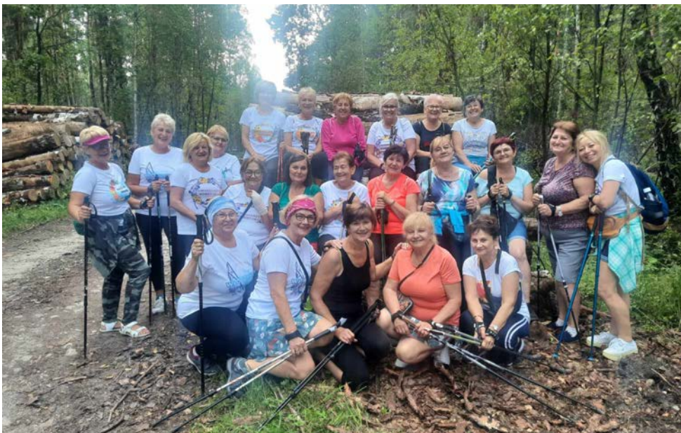
Warsztaty odbyły się na Jurze Krakowsko-Częstochowskiej