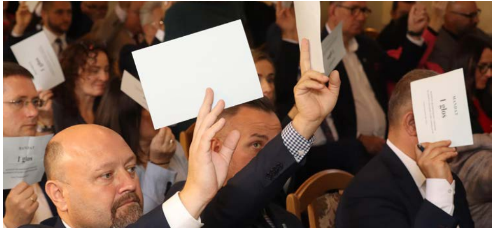
Podczas konwentu odbyły się wybory do Prezydium

Następnie uczestnicy mieli okazję wysłuchać wystąpień ekspertów, którzy przedstawili konkretne