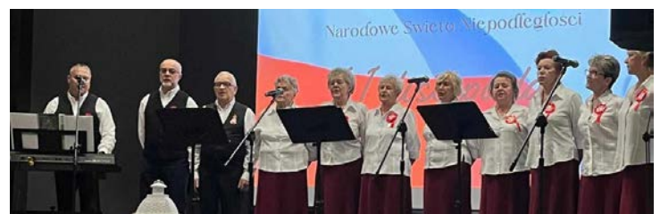
Na scenie zaprezentowały się gminne zespoły śpiewacze

Na scenie zaprezentowały się zespoły śpiewacze z gminy, które swoją muzyką wprowadziły publiczność w atmosferę głębokiego patriotyzmu. Wśród wykonawców znalazły się grupy takie jak: Górzanie, Kapela Grodków, Strzyżowiczanki, Tęcza oraz Zagłębianki. Każdy z zespołów zaprezentował bogaty repertuar pieśni patriotycznych, które od pokoleń towarzyszyły Polakom w trudnych chwilach historii, jak również w chwilach radości z odzyskiwania wolności. GOK