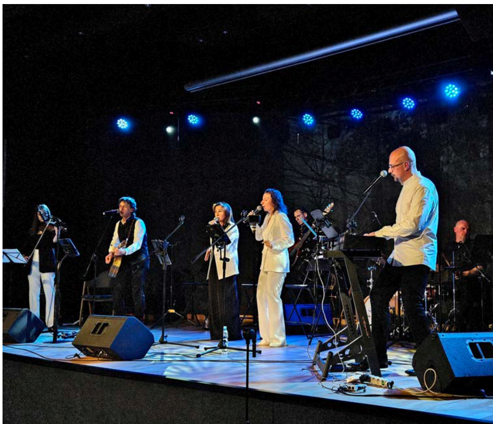
Jubileuszowy koncert odbył się na scenie Ośrodka Kultury w Strzyżowicach

rza spocząć na laurach. W planach mają intensyfikację działań charytatywnych oraz kolejne koncerty, które – jak sami podkreślają – będą kontynuacją ich misji dzielenia się