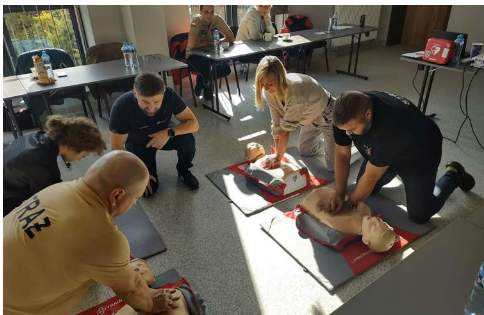
W Preczowie działa Centrum Szkoleniowe Programu Pierwszy Ratownik

Na budynku remizy przy garażach OSP w Preczowie został zamontowany w kapsule defibrylator AED. To urządzenie może być użyte przez każdego w sytuacji zagrożenia życia,