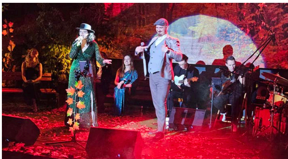
Koncert cieszył się dużym zainteresowaniem

Repertuar koncertu obejmował największe hity, które na przestrzeni dekad zapisały się w pamięci Polaków. Publiczność mogła usłyszeć utwory takich artystów jak Anna Jantar, Krzysztof Krawczyk, Czesław Niemen, Wojciech Młynarski, czy An-