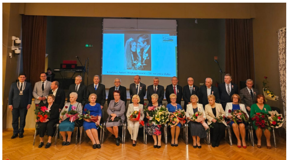
Uroczystość odbyła się w Ośrodku Kultury w Dąbiu