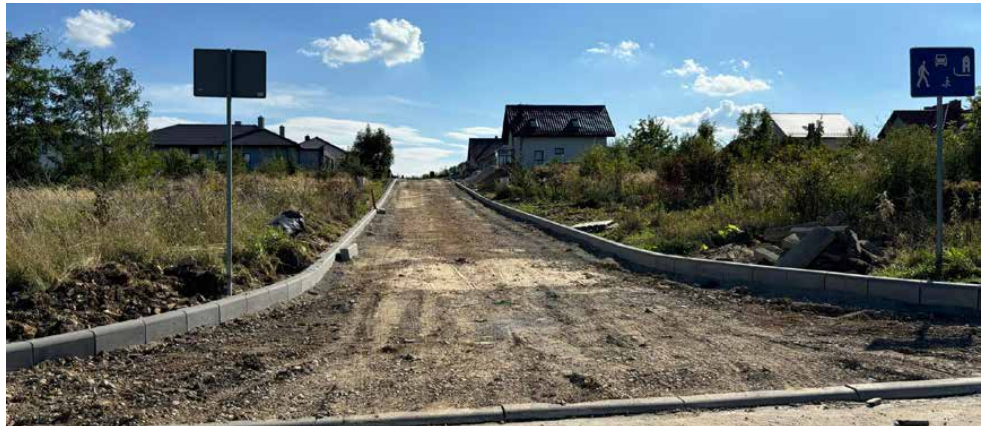
Wkrótce na ulicy Dolomitowej w Górze Siewierskiej pojawi się nawierzchnia z kostki brukowej

Wykonawcą przedsięwzięcia jest firma KRUZ Budownictwo Sp. z o.o. z Mysłowa. Koszt inwestycji wynosi 437 739,88 zł. Planowany termin zakończenia prac to 30 listopada 2024 r. Red.