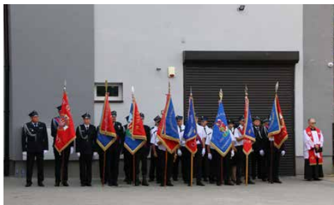
OTWARCIE NOWEGO BUDYNKU OSP W PRECZÓWIE s.5