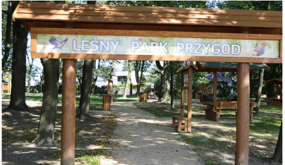
Leśny Park Przygód to miejsce pełne edukacyjnych ciekawostek

Koszt realizacji projektu wynosi 781 770,60 zł, z czego 250 000 stanowi dofinansowanie w ramach konkursu „Zielona Przestrzeń” Wojewódzkiego Funduszu Ochrony Środowiska i Gospodarki Wodnej w Katowicach. Dodatkowo gmina stara się też o unijną dotację w wysokości 252 530,03 zł. Prace wykonała firma