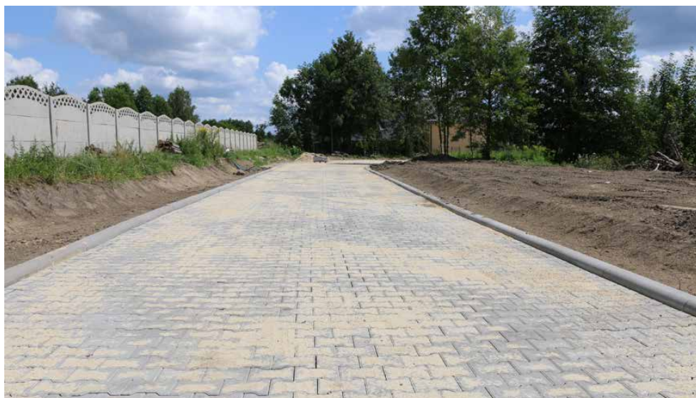
Budowa ulicy Parkowej w Strzyżowicach dobiega końca

Całkowity koszt przedsięwzięcia wynosi 859 278,59 zł, a jego wykonawcą jest firma General Development Sp. z o.o. z Tarnowskich Gór. Red.