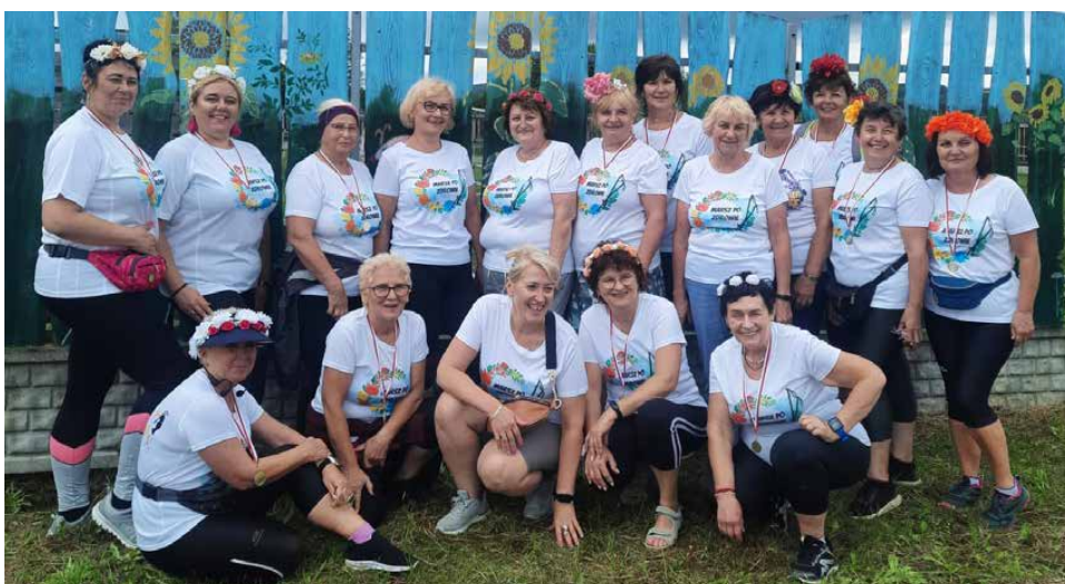
Członkinie Stowarzyszenia tradycyjnie wzięły udział w Marszu

W rajdzie „Marsz na Zdrowie z Wiankiem na głowie 2024” uczestniczyły zorganizowane grupy nordic walking: Bobry Walking z Dobieszowic, Stadion