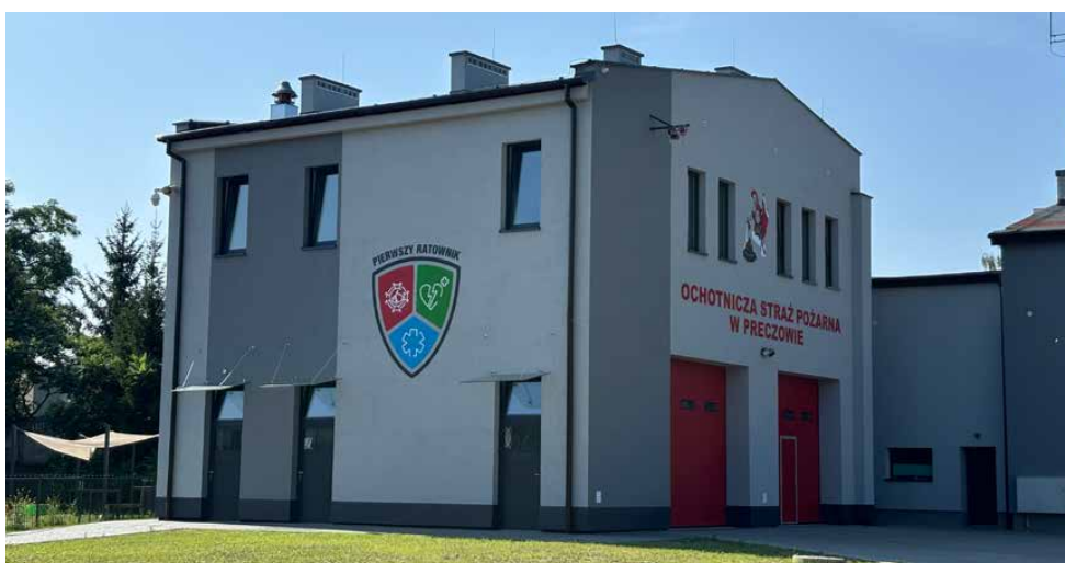
Otwarcie nowej siedziby OSP i OK w Preczowie odbyło się na początku września

Uczestnicy wydarzenia byli również świadkami inauguracji Śląskiego Centrum Szkoleniowego Programu