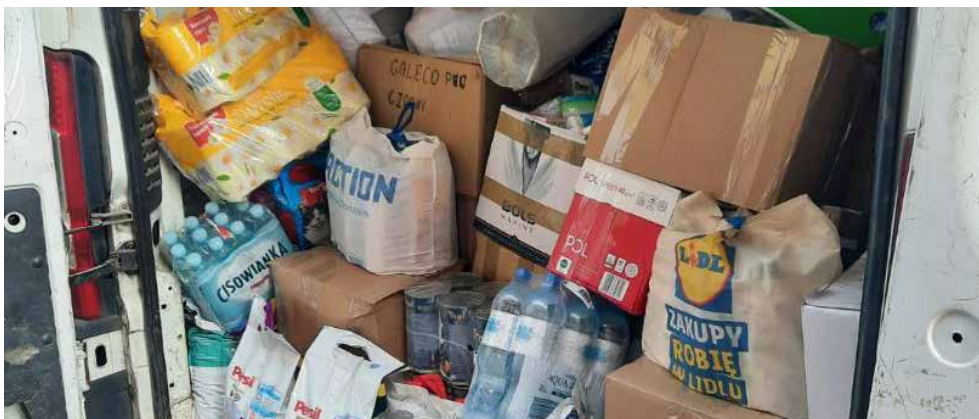
Mieszkańcy włączyli się w zbiórkę dla osób dotkniętych skutkami powodzi

W ostatnich tygodniach wiele obszarów Polski zostało dotkniętych powodzią. Żmudna walka z żywiołem wymaga nie tylko ogromnego wsparcia finansowego, ale również sporych nakładów fizycznej pracy. Na szczęście pomoc wobec osób poszkodowanych napływała z całej Polski. Organizowano zbiórki najpotrzebniejszych rzeczy, a specjalistyczne jednostki zostały oddelegowane do wsparcia usuwania skutków powodzi.