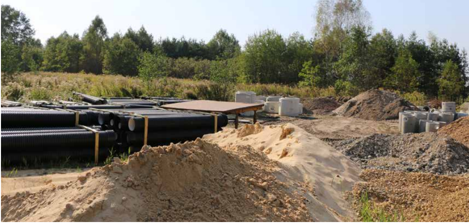
Na granicy Psar i Malinowic powstaje centrum przesiadkowe

kładów budżetowych oraz funduszy celowych gminy. Budżet jest uchwalany w formie uchwały na rok budżetowy. Uchwalenie budżetu należy do wyłącznej kompetencji rady gminy, a opracowanie projektu budżetu jest wyłączną kompetencją wójta.