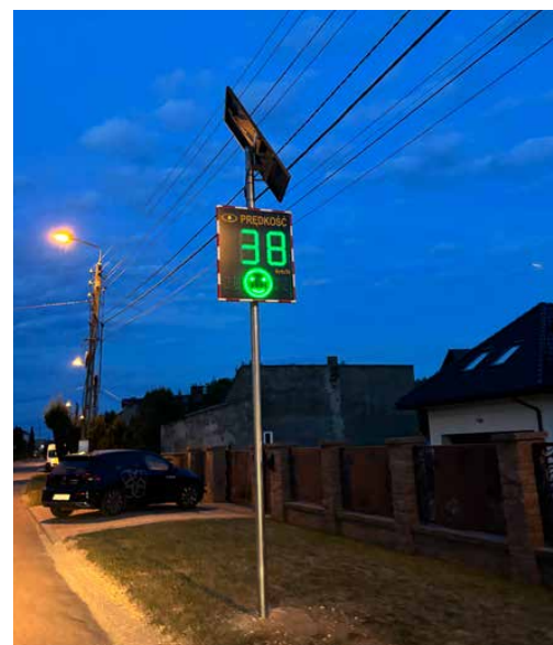
Kolejne wyświetlacze zostały zamontowane w Sarnowie i Preczowie

Wykonawcą zadania było Wielobranżowe Przedsiębiorstwo „3D” Sp. z o.o. z siedzibą w Bydgoszczy, a koszt całego przedsięwzięcia wyniósł 28 044 złotych. Red.