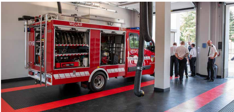
W nowo wybudowanym garażu stanął wóz strażacki

Koszt zadania wyniósł 3 031 516,55 zł, z czego 2 000 000 zł stanowiła dotacja z Programu Polski Ład. Wykonawcą przedsięwzięcia była firma Z.P.H.U. Mar-Bud Sp. z o.o. z Częstochowy. Red.