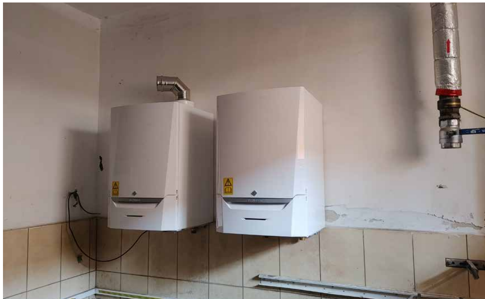
W szkole w Psarach zamontowan nowy kocioł grzewczy

ściany w kilku salach lekcyjnych, dyżurce, toalecie dla chłopców, małej szatni i przedsionku oraz na klatce schodowej. W trzech salach położona została wykładzina termozgrzewalna. Odnowiono także ławeczki przy szafkach szatniowych. Z czasem wymiany wymagają również sprzęty elektroniczne. Z tego powodu zakupiono nowe klawiatury i myszki do sali komputerowej oraz zamonto-