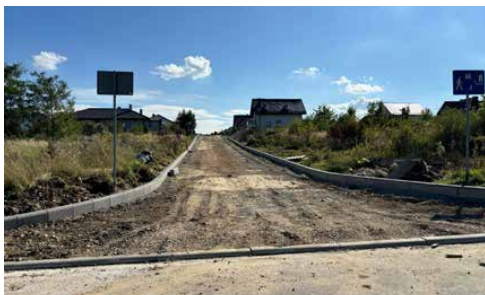
BUDUJEMY 5 GMINNYCH DRÓG W 2024 ROKU s.2