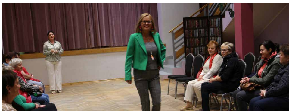
Pokaz mody odbył się tradycyjnie na sali bankietowej w Psarach