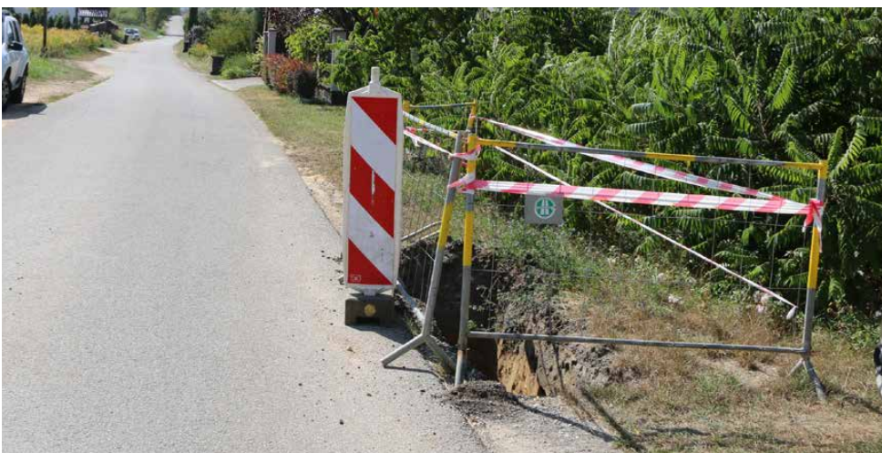
Na terenie naszej gminy budowana jest kanalizacja sanitarna i sieć wodociągowa

Budżet gminy jest rocznym planem jej dochodów i wydatków oraz przychodów i rozchodów gminy, a także przychodów i wydatków za-