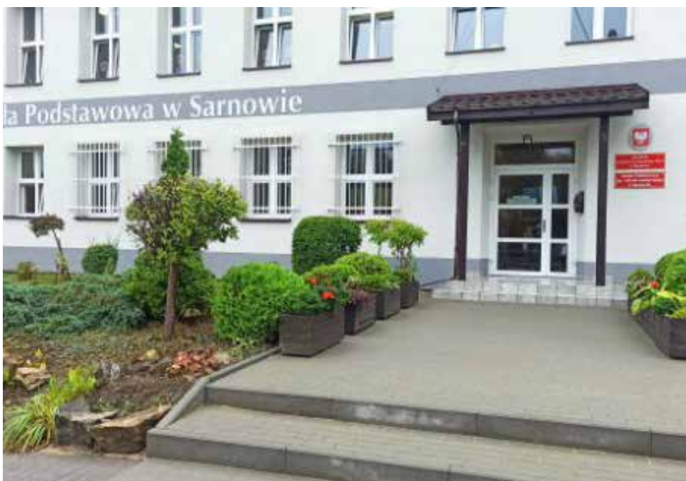
Nowy bruk przy wejściu do szkoły w Sarnowie

W Szkole Podstawowej w Sarnowie zagipsowano i pomalowano