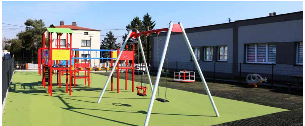
Plac zabaw w Malinowicach, którego budowa zakończyła się w 2024 roku

Po przygotowaniu i akceptacji przez Kierownika Zamawiającego projektu specyfikacji wraz z kryte-