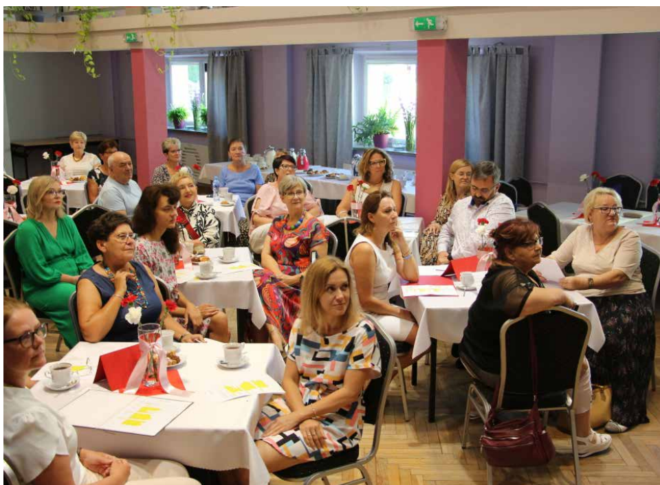
Miłośnicy literatury odczytali „Kordiana” Juliusza Słowackiego