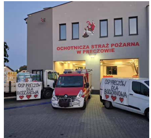
W pomoc dla powodzian zaangażowali się m.in. strażacy z Preczowa

Druhny i druhowie Ochotniczej Straży Pożarnej w Preczowie.