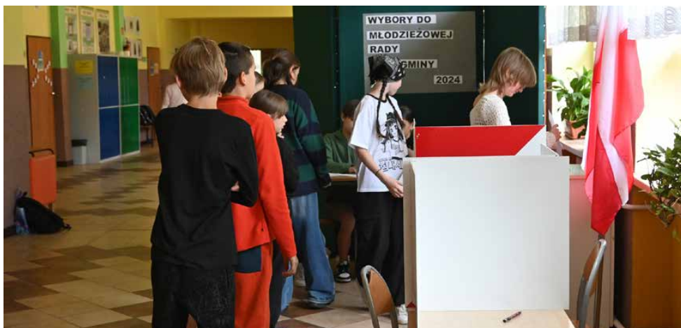
Wybory do Młodzieżowej Rady odbyły się w każdej szkole