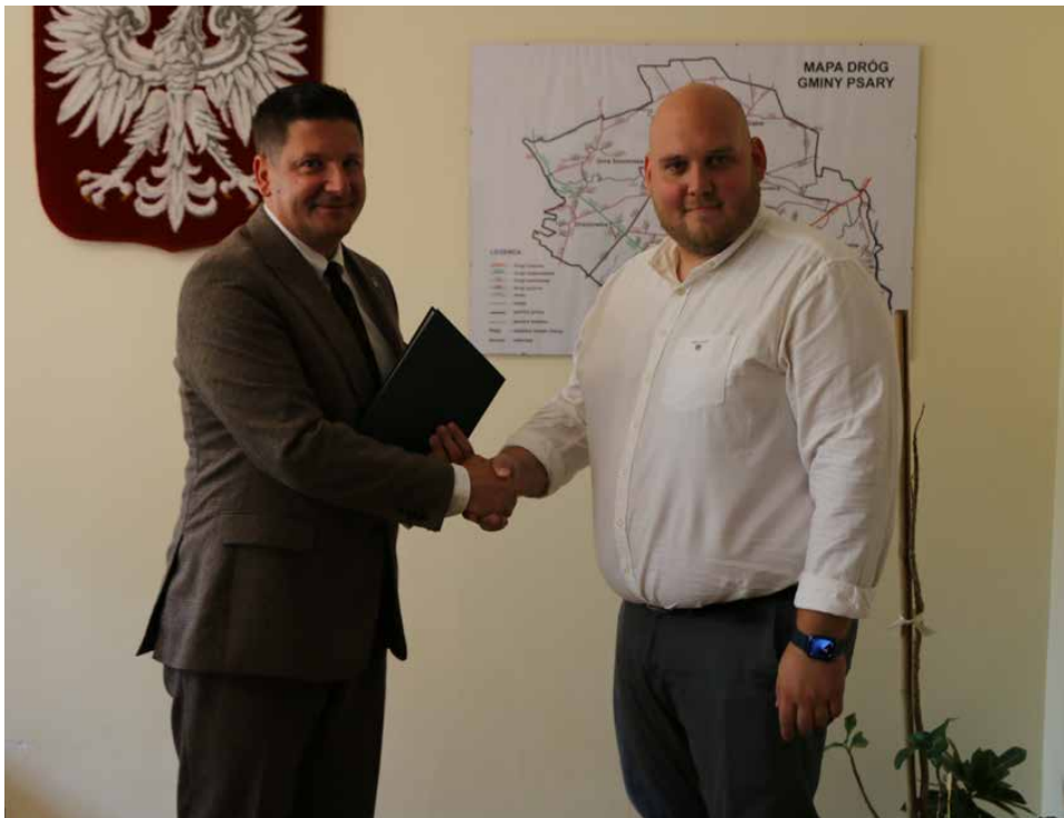
Uroczyste podpisanie umowy odbyło się w Urzędzie Gminy Psary

Wykonawcą przedsięwzięcia jest firma SILESIA TRANS SERVICE Sp. z o.o. z Katowic. Koszt inwestycji to 9 592 572,92 zł, z czego 4 205 190 zł stanowi dofinansowanie z Rządowego Funduszu Rozwoju Dróg. Red.