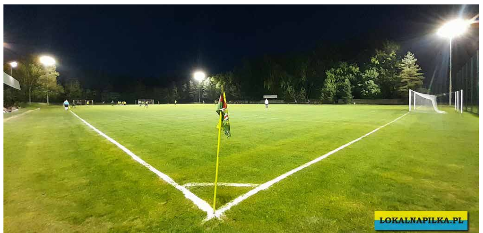
Sportowcy mogą teraz trenować i rozgrywać mecze również po zmroku

Prace związane z budową oświetlenia na stadionie sportowym w Psarach zakończyły się w marcu. Dzięki czterem 18 m masztom stalowym z oprawami oświetleniowymi piłkarze mogą trenować i rozgrywać mecze również po zmroku. Red.