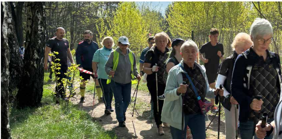
W tym roku odbyła się 3. edycja Zabieganego Powiatu w Psarach

Za nami kolejna edycja Zabieganego Powiatu. Tym razem entuzjaści biegania i nordic walking spotkali się w sobotni poranek 13 kwietnia w Psarach, by wspólnie pokonać trasę biegnącą przez Park Żurawiniec.