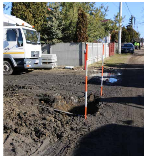
Prace prowadzone były zarówno wykopem otwartym jak i przewiertem sterowanym