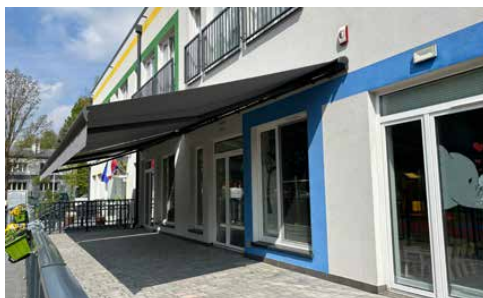
PRZEGLĄD ZAKUPÓW Z FUNDUSZU SOŁECKIEGO