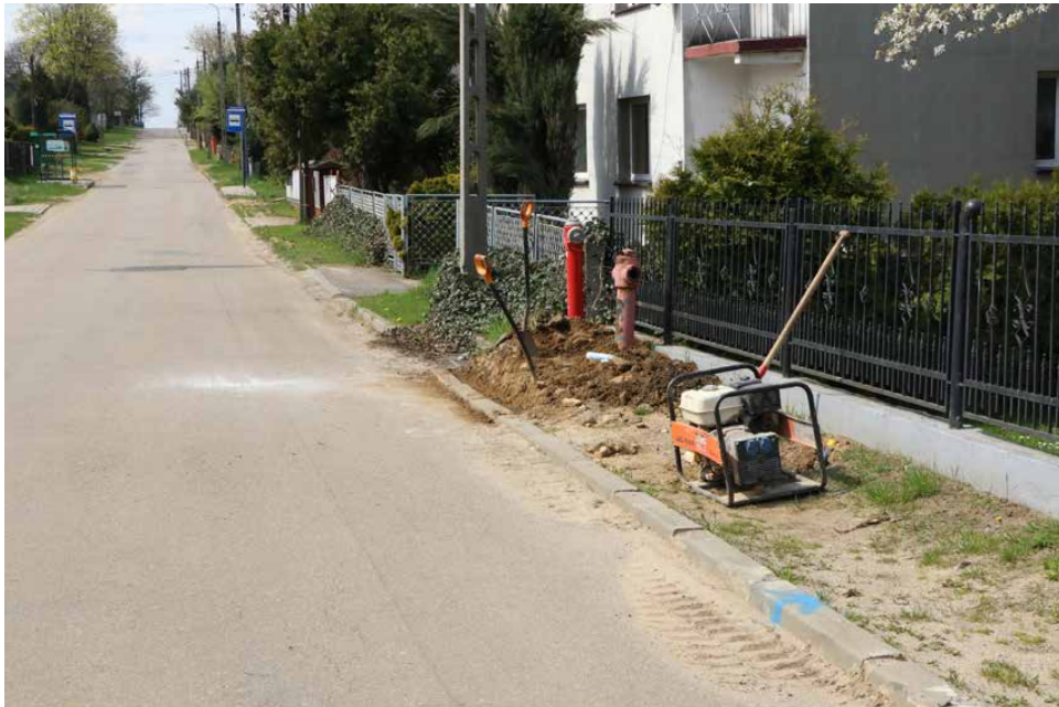
Koszt budowy sieci wodociągowej w Brzękowicach Górnych, Gołąszy Górnej i Dąbiu Górnym wyniósł ponad 2,3 mln zł

Zakończyły się prace związane z budową 3,6 km nowej sieci wodociągowej na ulicy Kościelnej w Dąbiu oraz w Brzękowicach Górnych, Gołąszy Górnej i Dąbiu Górnym. Inwestycje, których wartość wyniosła ponad 4,2 mln zł zostały w 90% pokryte pozyskanymi dotacjami.