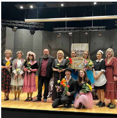
Spektakl zaprezentował autorski teatr MIRACulum

12 kwietnia na deskach sceny w Ośrodku Kultury w Stryżowicach miała miejsce premiera pierwszego spektaklu w wykonaniu amatorskiego teatru MIRACulum. Scenariusz spektaklu oparty na motywach tragifarsy Gabrieli Zapolskiej pt. „Moralność Pani Dulskiej”, przeplatał w sobie elementy komedii i tragedii, ukazując między innymi ludzką głupotę, pazerność, skąpstwo oraz hipokryzję wypaczającą stosunki społeczne.