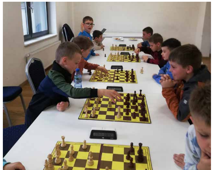
Uczestnicy zajęć szachowych rozegrali miniturniej

Ta królewska gra mimo, iż wymagająca dużo skupienia i opanowania, przyniosła naszym graczom mnóstwo emocji i pozytywnych wrażeń. Wszystkim uczestnikom gratulujemy i życzymy sukcesów w kolejnych szachowych utarczkach, a serdeczne podziękowania kierujemy w stronę instruktora Ireneusza Witasa-Tryjańskiego za pomysł i mobilizację swoich uczniów. GOK