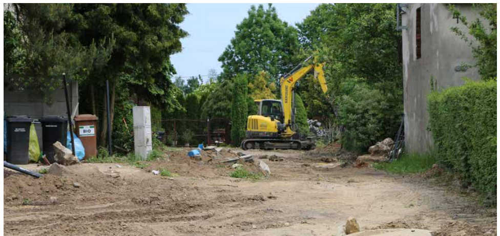
Ulica Parkowa w Strzyżowicach powstaje po nowym śladzie

Przypominamy, że dzięki inwestycji powstanie 185-metrowy odcinek jezdni z kostki betonowej po nowym śladzie. Wykonawcą przedsięwzięcia jest firma General Development Sp. z o.o. z Tarnowskich Gór, a jego koszt wynosi 859 278,59 zł. Planowany termin zakończenia prac to 24 września 2024 roku. Red.