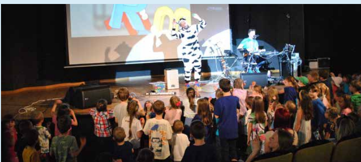
Artysta zaangażował dzieci do wspólnej zabawy