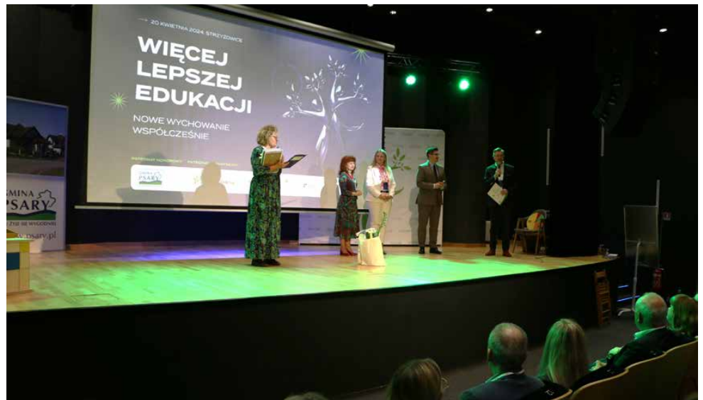
W Strzyżowicach odbyła się ogólnopolska konferencja naukowa