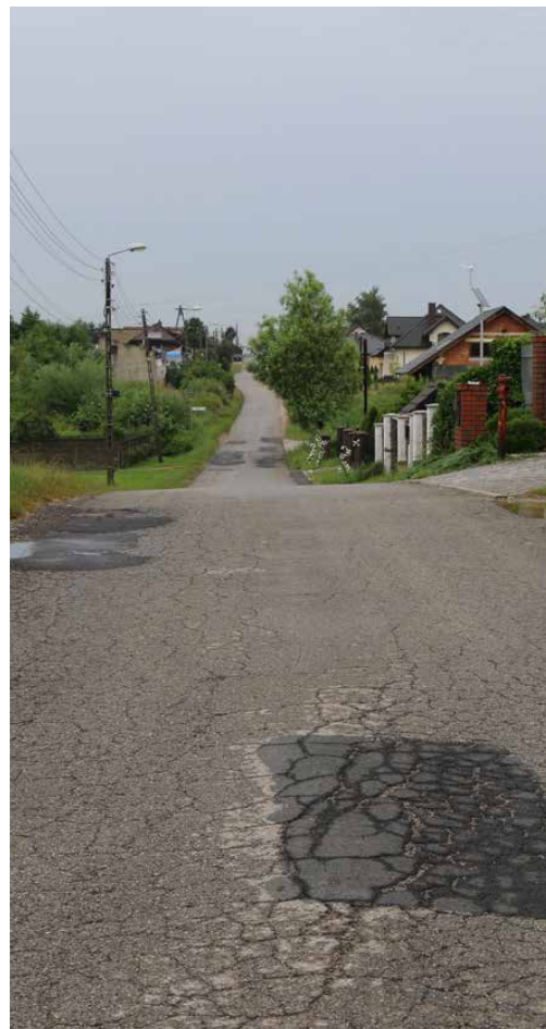
Inwestycja zakłada m.in. poszerzenie jezdni

Warto wspomnieć, że to nie jedyna planowana inwestycja na ulicy Kolejowej. Najpierw prowadzone będą również prace związane z wymianą sieci wodociągowej i budową kanalizacji sanitarnej, co wymagać będzie precyzyjnej koordynacji działań. Red.