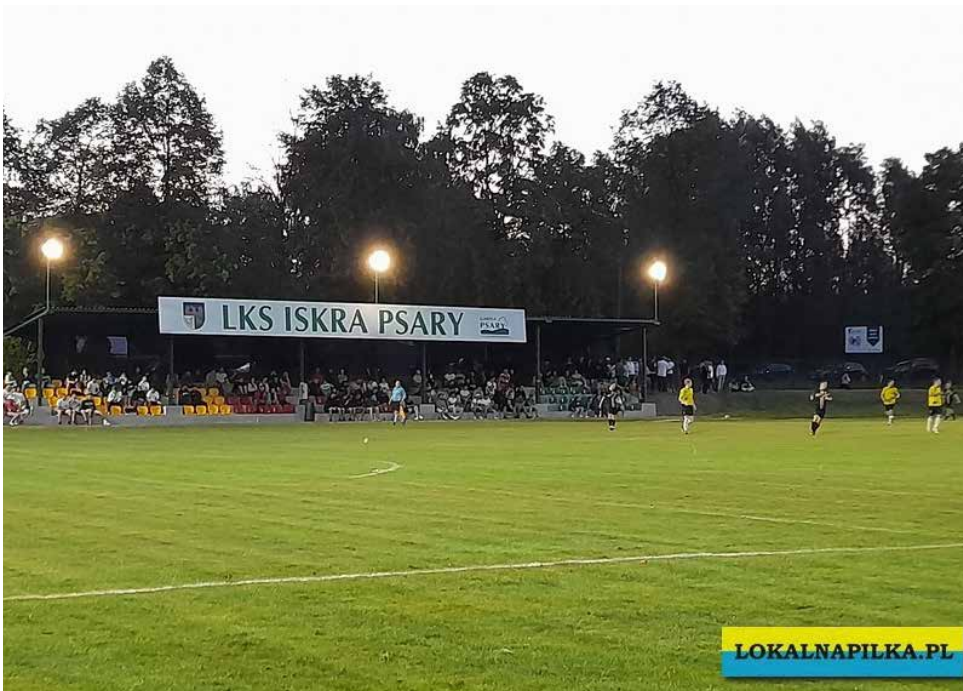
Wydarzenie zgromadziło wielu miłośników piłki nożnej

Pełne trybuny i niesamowita atmosfera – za nami pierwszy mecz na stadionie LKS Iskra Psary przy sztucznym oświetleniu. Sobotnie rozgrywki, które odbyły się 4 maja na długo pozostaną w naszej pamięci.