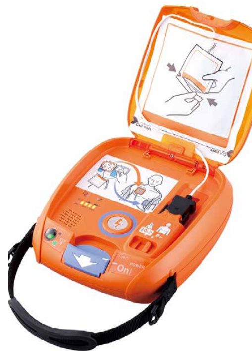
Uczestnicy warsztatów zapoznali się m.in. z defibrylatorem AED

Takie ćwiczenia mają wielkie znaczenie, ponieważ uczą nas konkretnych zachowań, wpajają automatykę przeprowadzania niezbędnych czynności. Mamy świadomość, że jeszcze nie jesteśmy perfekcyjnymi ratownikami, ale zrobimy wszystko, aby nimi być – więc będziemy szkolić się dalej! GBP