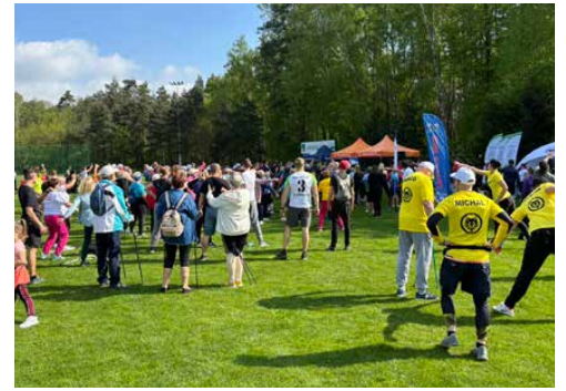
Sportowcy rozgrzali się na stadionie LKS Iskra Psary

Za nami sportowe wydarzenie, cieszące się z roku na rok coraz większym zainteresowaniem miłośników sportu. Trasa, podobnie jak w latach ubiegłych wynosiła około 1 km i przebiegała przez Park Żurawiniec. Biegacze oraz Ci, którzy wybrali nordic walking udowodnili, że sport, bez względu na wiek, może być nie tylko pasją, ale także pomysłem na spędzenie wolnego czasu. Na zakończenie każdy uczestnik otrzymał pamiątkowy medal. Na wszystkich czekała również woda od Zakładu Gospodarki Komunalnej w Psarach Sp. z o.o. oraz gorący poczęstunek. Red.