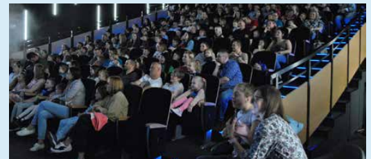
Sala podczas koncertu była wypełniona do ostatniego miejsca