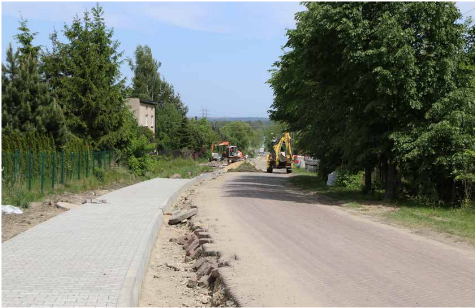
Na ulicy Głównej trwają prace przy budowie chodnika

W tym roku wiele z realizowanych inwestycji dotyczy poprawy infrastruktury drogowej. Jedną z nich jest przebudowa ulicy Głównej w Sarnowie, gdzie na 840-metrowym odcinku jezdni powstanie nowa droga z chodnikiem.