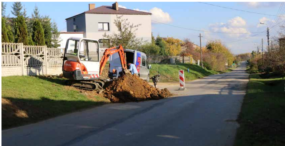
Na ulicy Kościelnej w Dąbiu powstały prawie 2 km nowej sieci wodociągowej

Dzięki realizacji tych dwóch inwestycji oraz budowie wodociągu od zbiornika wyrównawczego w Górze Siewierskiej przy ul. Złotej do Brzękowic Górnych, która zakończyła się w 2023 roku, została wymieniona cała sieć wodociągowa w północnej części naszej gminy. Woda płynie już nowym wodociągiem do Brzękowic Górnych, Gołąszy Górnej i Dąbia Górnego oraz ulicy Kościelnej w Dąbiu. Red.