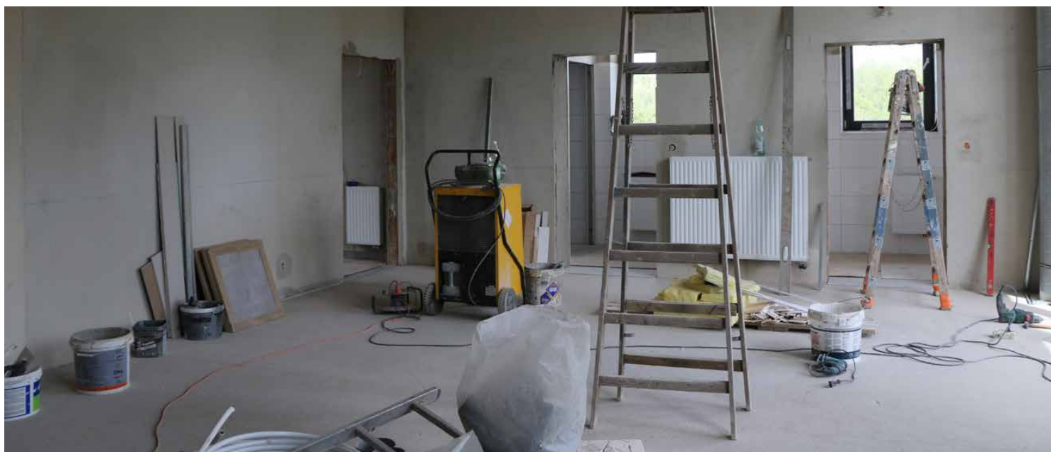
Wewnątrz budynku prowadzone są prace wykończeniowe

Koszt zadania wynosi 3 031 516,55 zł, z czego 2 000 000 zł stanowi dofinansowanie w ramach Polskiego Ładu. Wykonawcą przedsięwzięcia jest firma Z.P.H.U. Mar-Bud Sp. z o.o. z Częstochowy, a planowany termin zakończenia prac to koniec lipca 2024 roku. Red.