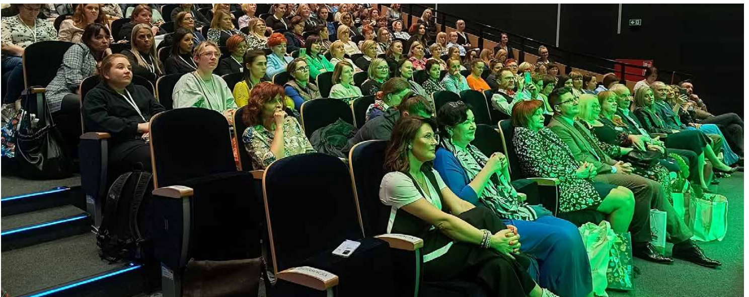
Na widowni zasiedli głównie nauczyciele