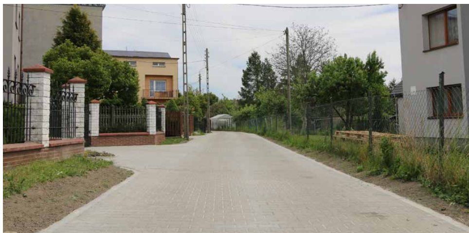
Na ulicy Cichej pojawiła się nawierzchnia z kostki betonowej

Po miesiącach intensywnej prac na ulicy Cichej w Strzyżowicach pojawiła się nowa nawierzchnia. Inwestycja objęła blisko 170-metrowy odcinek jezdni.