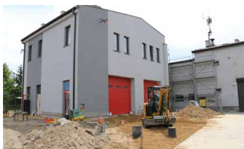
ROZBUDOWA OŚRODKA KULTURY I REMIZY OSP W PRECZOWIE DOBIEGA KOŃCA