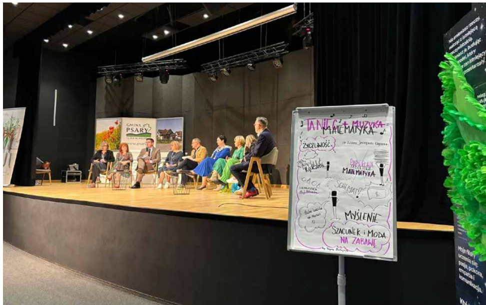
Jedną z części spotkania była debata