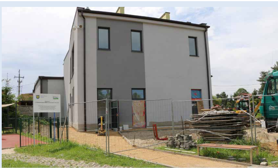
Mieszkańcy będą mogli korzystać z budynku od drugiej połowy roku

Przypominamy, że dzięki inwestycji w drugiej połowie tego roku mieszkańcy i strażacy będą mieli do swojej dyspozycji nowoczesną i funkcjonalną przestrzeń. Na parterze pojawią się ogólnodostępne toalety, pomieszczenia na sprzęt ogrodniczy i dwa garaże OSP. Na piętrze pojawi się