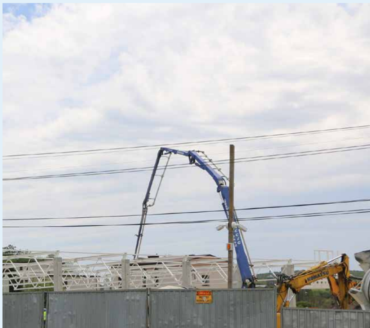
Otwarcie sklepu w Psarach planowane jest na jesień

Sieć sprzedaży Lidl Polska liczy w tej chwili ponad 850 sklepów, ulokowanych na terenie całego kraju. Wczesną jesienią planowane jest otwarcie kolejnego z nich, tym razem w Psarach.