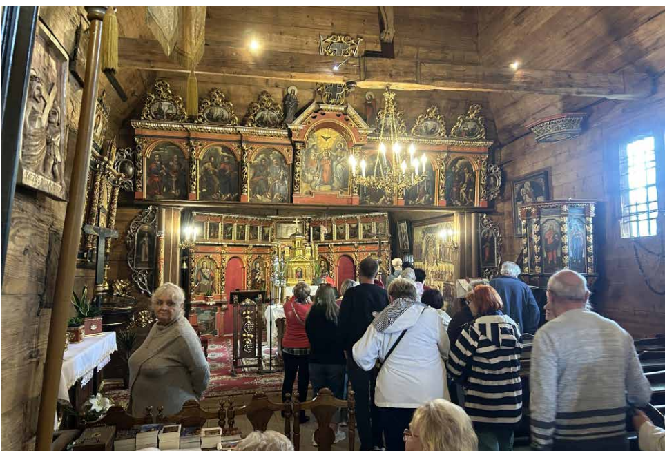
W ramach wyjazdu słuchacze UTW mieli okazję odwiedzić cerkiew