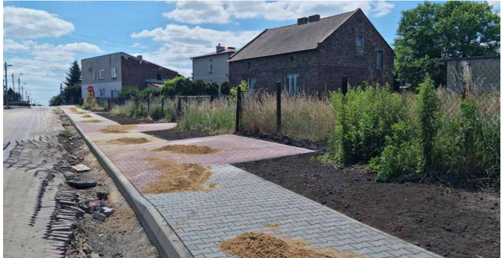
Powstały już zjazdy na posesje prywatne i chodnik

Koszt zadania wynosi 2 457 700 zł, z czego prawie 95% zostanie pokryte z dotacji pozyskanych z Programu Rozwoju Obszarów Wiejskich na lata 2014-2020 oraz Rządowego Funduszu Rozwoju. Zgodnie z umową prace mają potrwać do 8 grudnia 2024 roku. Inwestycja ta ma na celu poprawę bezpieczeństwa oraz jakości poruszania się zarówno zmotoryzowanych, jak i pieszych. Red.