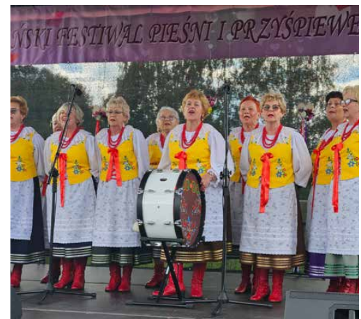
Na scenie zaprezentowało się wiele zespołów

zabawa taneczna, którą poprowadził zespół Four Band. GOK