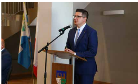
WÓJT OTRZYMAŁ ABSOLUTORIUM I WOTUM ZAUFANIA