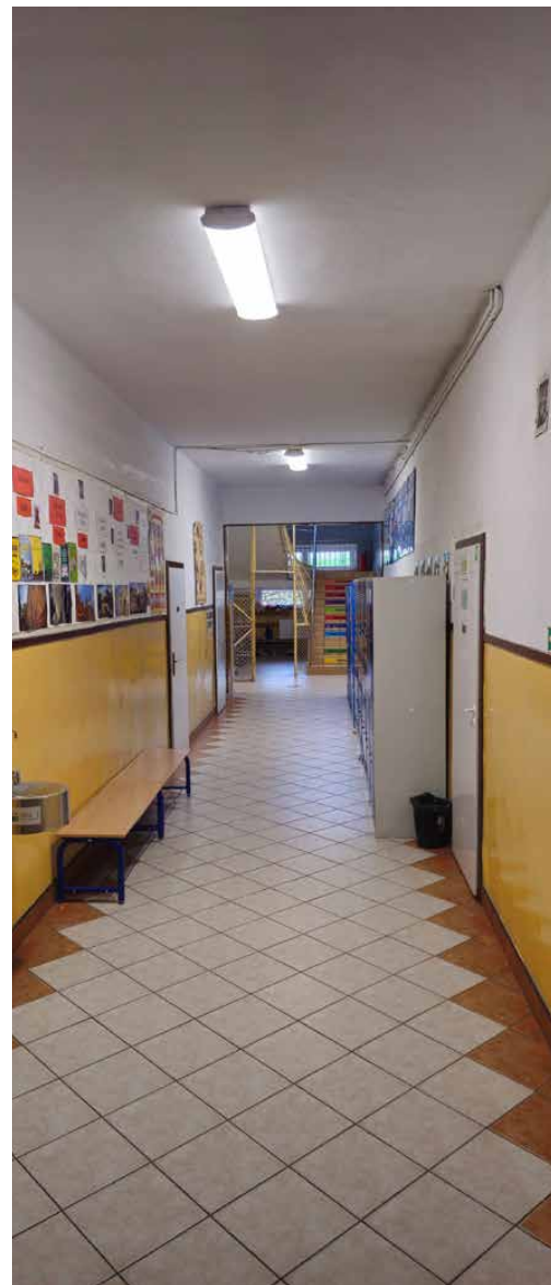
W Strzyżowicach remont obejmuje pomieszczenia znajdujące się w przyziemiu

Obecnie trwa procedura przetargowa pozwalająca na wyłonienie wykonawcy tego zadania. Red.