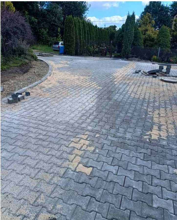
Na ulicy Parkowej powstaje droga po nowym śladzie