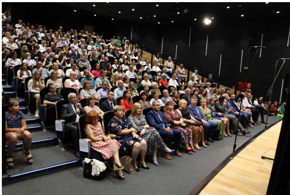
W połowie czerwca odbyło się Gminne Zakończenie Roku Szkolnego

Tradycją w naszej gminie jest rywalizacja sportowa pomiędzy poszczególnymi szkołami. Przez cały rok uczniowie brali udział w różnych zawodach, dzięki czemu poznaliśmy najbardziej