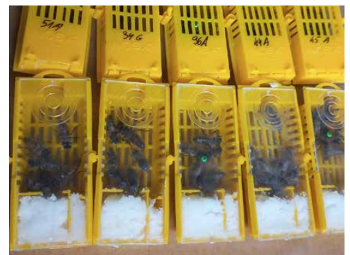
Na spotkaniu nie mogło zabraknąć pszczół

ciwgrzybiczych i wzmacniających organizm ze względu na występujące w nim przeciwutleniające. Jednak możliwość poznania procesu powstawania tej niezwyklej substancji, to już zupełnie inna, wyjątkowa przygoda, która dla niektórych okazuje się być stylem życia w bliskości z naturą. MB