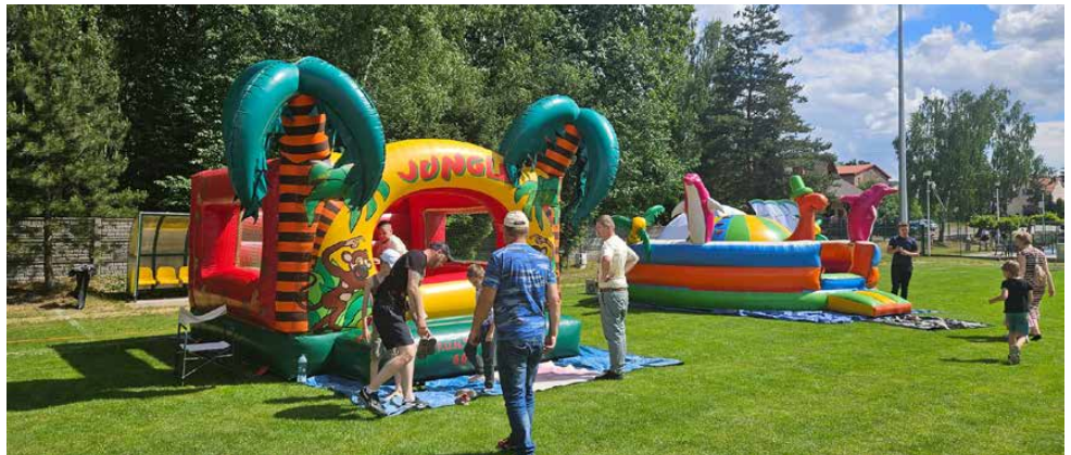
Na najmłodszych czekało wiele atrakcji

festynu mieli okazję spotkać swoich ulubionych bohaterów i wziąć udział w kreatywnych zabawach i konkursach. GOK