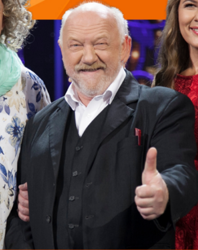
KABARET „KOŃ POLSKI”