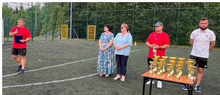
Sportowcy zostali nagrodzeni pucharami