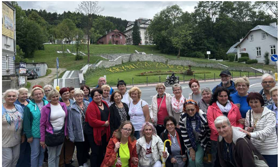
Studenci UTW odwiedzili m.in. Krynice-Zdrój

To jeden z najcenniejszych zabytków drewnianej architektury sakralnej w Polsce. Powstała w XVIII wieku i stanowi doskonały przykład łemkowskiego budownictwa cer-