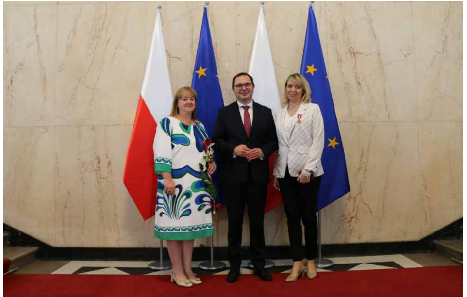
Uroczystość odbyła się w Śląskim Urzędzie Wojewódzkim w Katowicach

Medale za Długoletnią Służbę stanowią nagrodę za wzorowe i wyjątkowo sumienne wykonywanie obowiązków służbowych wynikających z pracy zawodowej w służbie państwa polskiego. W zależności od przepracowanych lat nadawane są złote, srebrne i brązowe medale. Złoty przyznawany jest osobom po 30 latach pracy zawodowej, srebrny po 20 latach, a brązowy po 10 latach. Red.