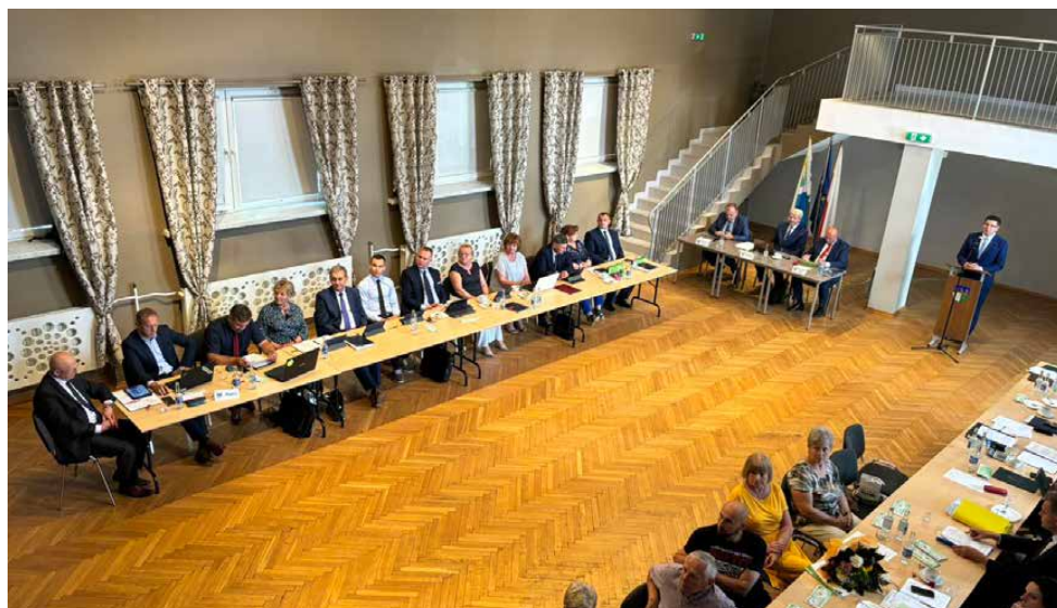
Radni podjęli uchwały o udzieleniu wójtowi absolutorium i wotum zaufania

Mimo znaczącego ubytku dochodów bieżących z podatku dochodowego, dotyczącego wszystkie samorządy, w 2023 roku udało nam się utrzymać wysoką jakość świadczonych przez nas usług i zrealizować zaplanowane inwestycje. Nadwyżka operacyjna, chociaż według pierwotnego planu miała sięgnąć jedynie 200