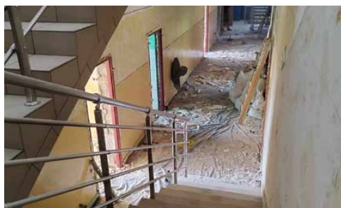
WAKACYJNE REMONTY W SZKOŁACH W STRYZÓWICACH I SARNOWIE

PRACE W GÓRZE SIEWIERSKIEJ ZAKOŃCZONE! s. 3