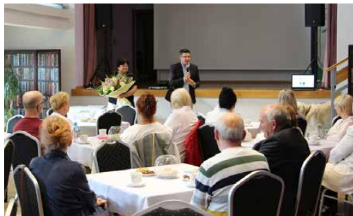
Studenci zakończyli kolejny rok akademicki

Wykładem o dogoterapii zakończył się rok akademicki 2023/2024 Uniwersytetu Trzeciego Wieku w Psarach. Absolwenci odebrali pamiątkowe dyplomy i mieli okazję wysłuchać ciekawego wykładu, którego głównym bohaterem był golden retriever o imieniu William.