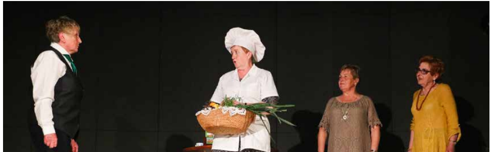
Spektakl odbył się w sali widowiskowej Ośrodka Kultury w Strzyżowicach