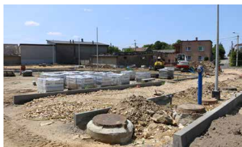
POSTĘPY W GÓRZE SIEWERSKIEJ

UCZNIOWIE I PRZEDSZKOLAKI Z DĄBIĄ KORZYSTAJĄ Z NOWEGO PLACU ZABAW s. 2