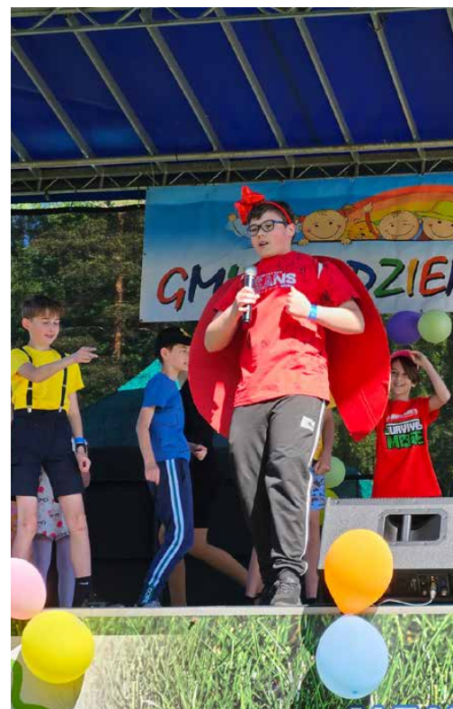
Na scenie zaprezentowali się uczniowie z Dąbia

Dzieci miały okazję pobawić się z ulubionymi postaciami, takimi jak Kermit, Wielki Ptak, Pysia i Elmo. Występy na scenie zakończył mini koncert zespołu wokально-instrumentalnego z Ośrodka Kultury w Sarnowie pod kierownictwem Grzegorza Bochenka.