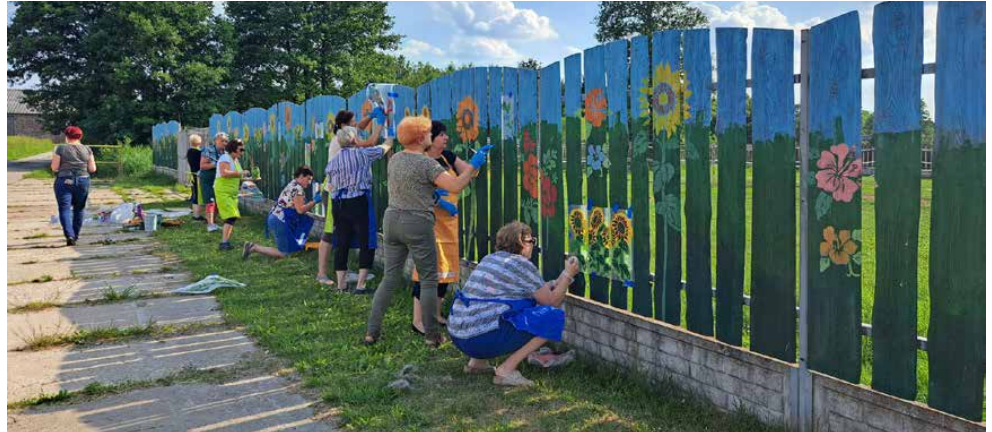
W ramach projektu ogrodzenie zdobią barwne kwiaty

Projekt aktywizuje ponad 20 kobiet wokół wspólnego działania, integruje społeczność lokalną do pracy na rzecz budowania dobra wspólnego w środowisku lokalnym, zagospodarowania lokalnej przestrzeni publicznej. Daje radość ze wspólnego działania, poczucia sprawstwa w kreowaniu nietuzinkowego i satysfakcjonującego rezultatu. Jeszcze kilka tygodni dobrej pogody i efekt będzie można podziwiać. Zapraszamy! SK 18+