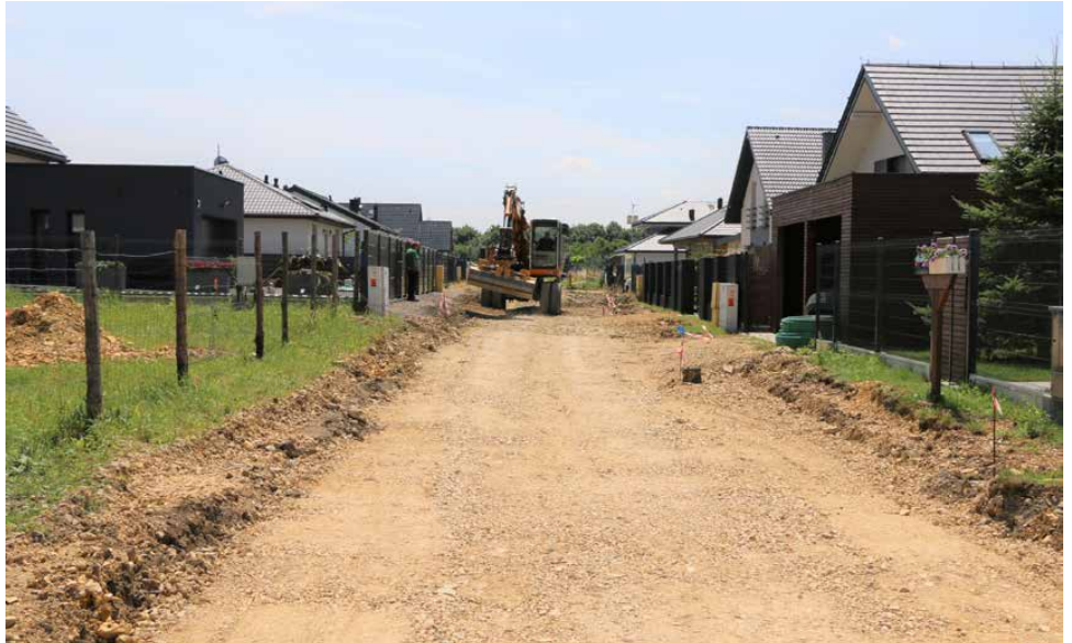
Wykonawca rozpoczął korytowanie drogi