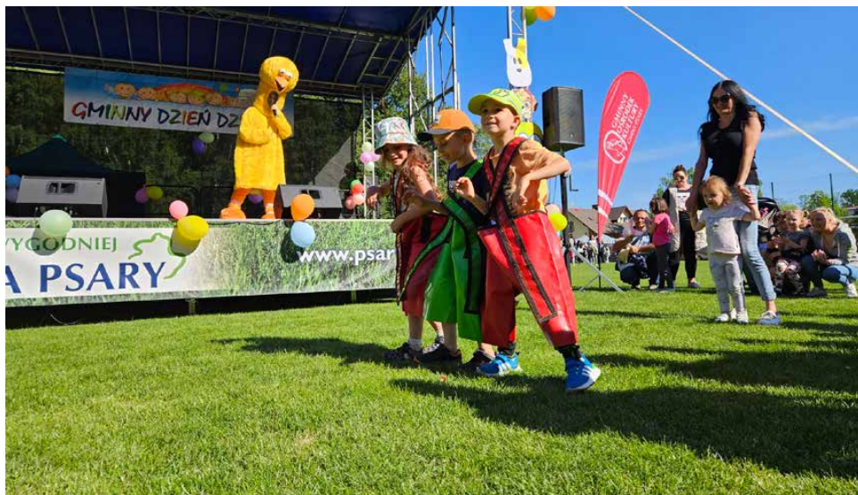
Stadion w Psarach zmienił się w ulicę Sezamkową

3 CZERWCA NA STADIONIE LKS ISKRA PSARY ODBYŁ SIĘ GMINNY DZIEŃ DZIECKA. IMPREZĘ JAK CO ROKU PRZYGOTOWAŁ GMINNY OŚRODEK KULTURY GMINY PSARY.