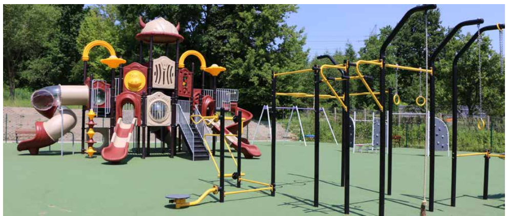
Z myślą o starszych powstała strefa streetworkout

starszych jak i młodszych. Uczniowie chętnie korzystają ze strefy street workout, zestawu składającego się ze ścianki wspinaczkowej, przejścia ze sprężynami, przepłotni linowej i pajęczyny z lin, potrójnej huśtawki i karuzeli tarczowej. Najmłodszy najwięcej czasu spędzają na kolorowym, wielopoziomym urządzeniu ze zjeżdżał-