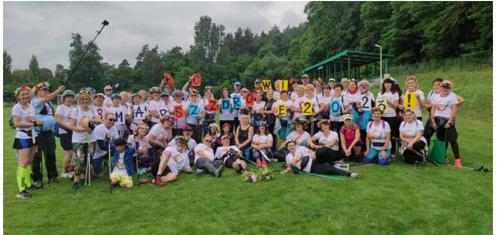
Stowarzyszenie Kobiet 18+ zorganizowało już po raz 8. marsz po zdrowie

24 czerwca bieżącego roku, odbył się doroczny 8. Marsz po Zdrowie z Wiankiem na Głowie w malowniczych, naturalnych plenerach gminy Psary, w sołectwie Brzękowice Dolne. Przyjechali entuzjaści nordic walkingu ze śląsko-zagłębiowskich formacji: Stadion Śląski z Chorzowa, Bobry Walking z Bobrownik, Chodzę bo Lubię i Harpagan z Sosnowca, Ekipa na Kijach z Rudy Śląskiej, Włóczykijki 18+ z Dąbia, oraz niezrzeszeni. Kolorowa grupa niespełna 80 osób przeszła dystans 9 km, promując zdrowy styl życia, aktywność ruchową i czerpiąc wiele dobrego ze wspólnej aktywności. I aby wspólnie, zaliczyć standardową 9-tkę, delektując się przy okazji uroczymi, kwiecistymi ścieżkami gminy Psary. Jest pełna integracja międzypokoleniowa - dzieci, osoby młode, w średnim i mocno dojrzałym wieku. Wszyscy wyjeżdżają uśmiechnięci,