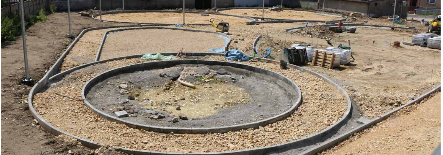
Teren za remizą OSP i Ośrodkiem Kultury w Górze Siewierskiej nabiera kształtów

Z DNIA NA DZIEŃ ZMIENIA SIĘ PRZESTRZEŃ PRZY OŚRODKU KULTURY I REMIZIE OSP W GÓRZE SIEWIERSKIEJ. ZAKOŃCZONA ZOSTAŁA BUDOWA ULICY OGRODOWEJ, TRWAJĄ PRACE PRZY BUDOWIE CHODNIKA ŁĄCZĄCEGO ULICĘ OGRODOWĄ I SZOPENA, A JUŻ JESIENIĄ MIESZKAŃCY BĘDĄ MOGLI KORZYSTAĆ Z NOWEGO SPORTOWO-REKREACYJNEGO MIEJSCA W NASZEJ GMINIE.