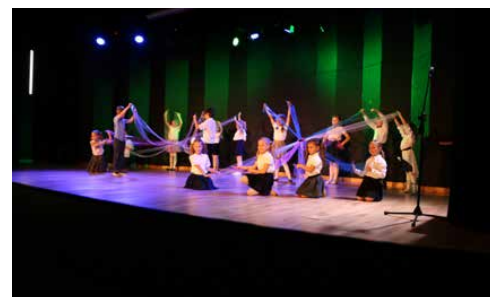
ZAKOŃCZYLIŚMY ROK SZKOLNY 2022/2023