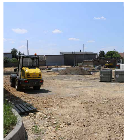
Przed garażami OSP powstaje plac manewrowy

Planowany termin zakończenia inwestycji to październik tego roku. Wykonawcą prac jest firma Silesia Trans Service Sp. z o.o. z Katowic, a ich wartość sięga 4 884 475,78 zł. Red.