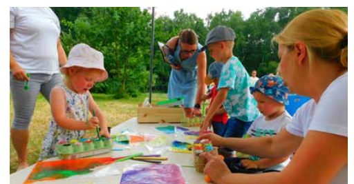
Podczas pikniku na dzieci czekała cała masa atrakcji