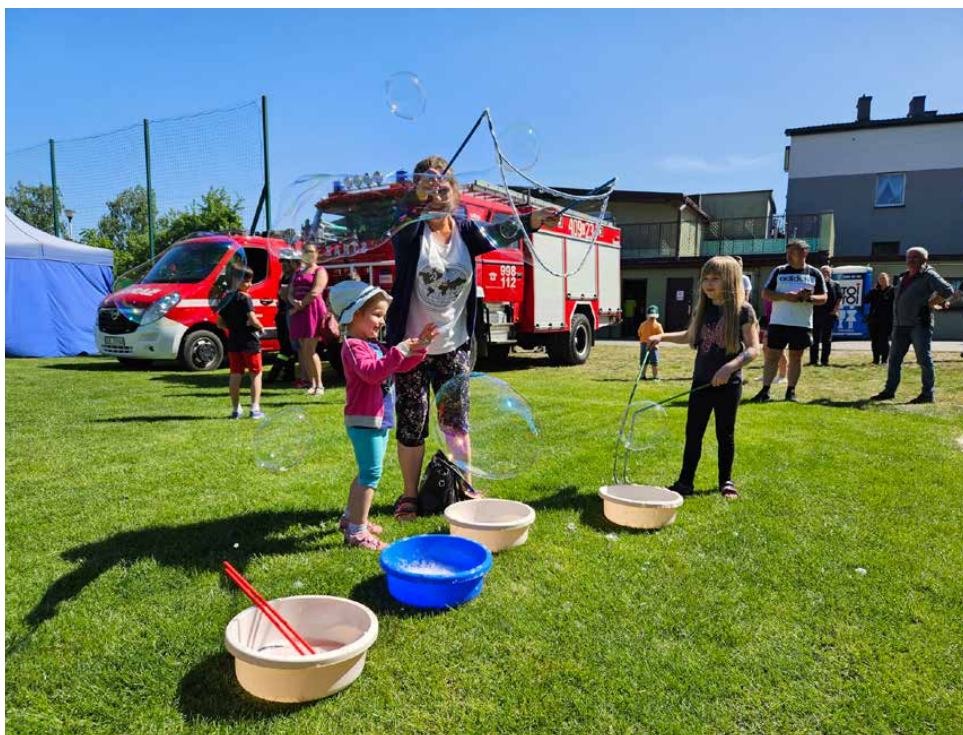
Wozy strażackie i bańki mydlane to tylko część z atrakcji, które czekały na najmłodszych

O godzinie 16:00 rozpoczęła się najbardziej interaktywna część programu - „Kolorowa Ulica Sezamkowa”.