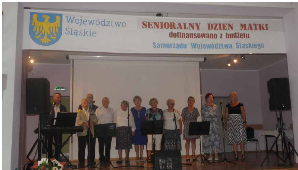
Emeryci z Psar świętowali do białego rana rzy przez całą noc. Motto uroczystości brzmiało „Psarski emeryt nie starzeje się”, zatem do zobaczenia w tym samym gronie za rok!