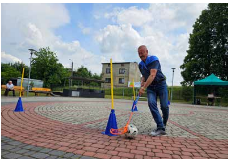
Uczestnicy zmierzali się w różnych konkurencjach

W tegorocznej seniorskiej imprezie wzięły udział 4 kluby seniora, które rywalizowały w różnorodnych konkurencjach. Każda drużyna miała możliwość zgłoszenia do udziału maksymalnie 20 uczestników.