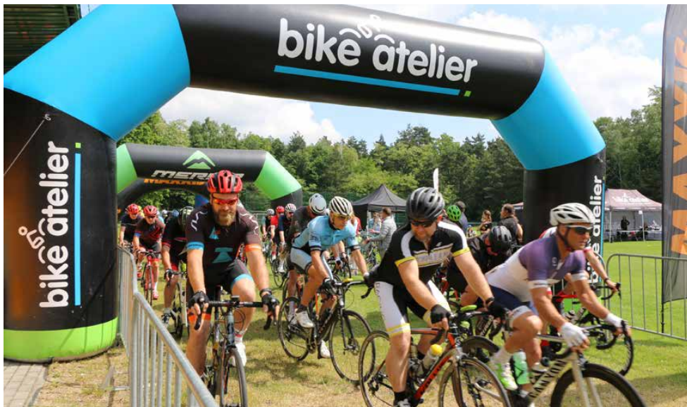
Start zawodów odbył się na stadionie Iskry Psary