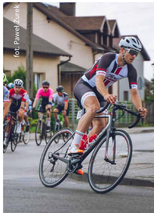
Na najdłuższym z dystansów zawodnicy pokonali ponad 85 kilometrów