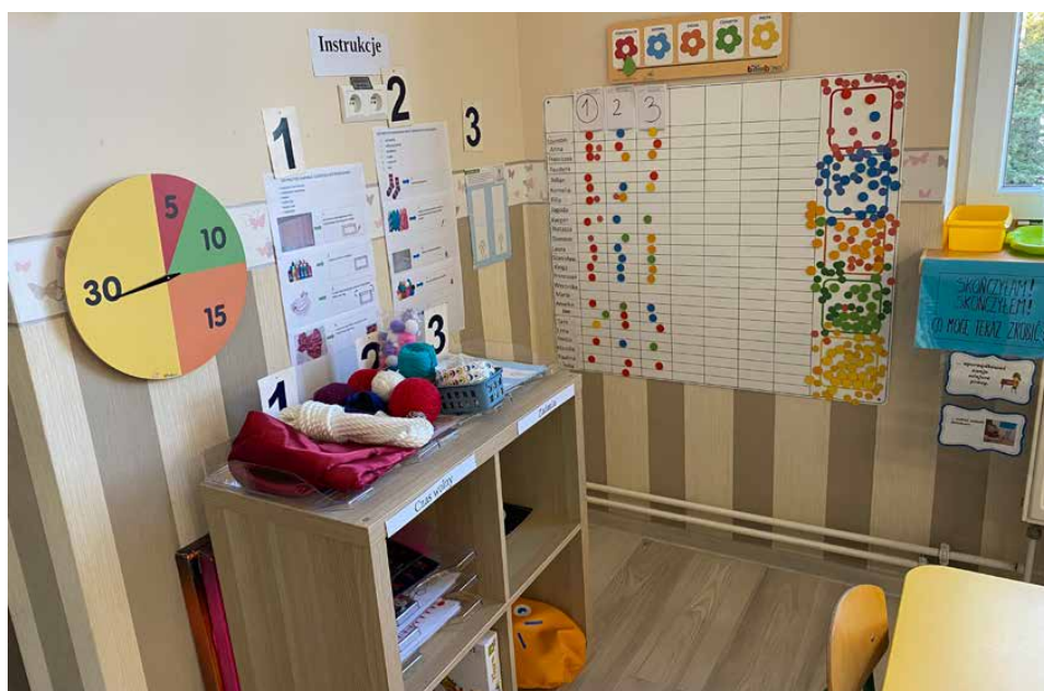
Jednym z elementów planu daltońskiego jest odpowiednio zorganizowana przestrzeń

Nauczyciel daltoński to nauczyciel kierujący się sercem, który w pełni akceptuje i szanuje dziecko, jego indywidualizm i potrzeby. Pozwala na „naturalny” rozwój. Daje dziecku wolność wyboru, możliwość decydowania o sobie i bycia współtwórcą procesu edukacji. Pozwala na samodzielność, bo wie, że w dziecku tkwi ogromny potencjał i siła. Pragnie być towarzyszem dziecka w jego drodze, który jest gotowy wesprzeć, motywować i inspirować. ZSP Strzyżowice