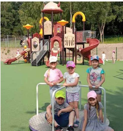
Najmłodszy chętnie korzystają z wielofunkcyjnego urządzenia

W czerwcu została zakończona budowa placu zabaw przy Szkole Podstawowej w Dąbiu. Na około 550 m 2 bezpiecznej nawierzchni pojawiły się nowe urządzenia zarówno dla dzieci