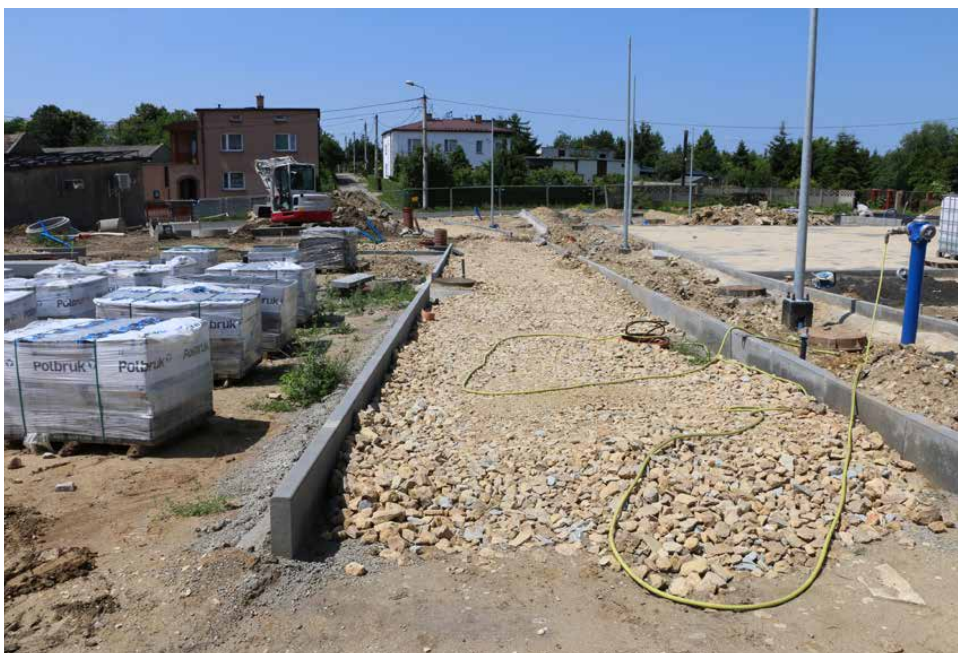
W ramach inwestycji powstaje chodnik łączący ulice Ogrodową i Szopena

plac zabaw, minirampa i kolej szynowa został już utwardzony. Wybudowano także miejsce gdzie stanie scena mobilna. Obecnie trwają prace nad budową altany oraz grilla terenowego z kołem ogniskowym i ławeczkami.