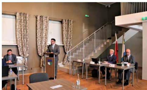
JEDNOGŁOSNE ABSOLUTORIUM I WOTUM ZAUFANIA DLA WÓJTA