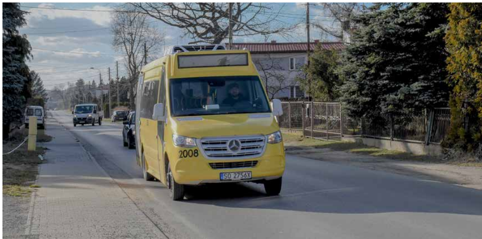
Linia M103 zatrzymuje się na terenie 5 sołectw w naszej gminie