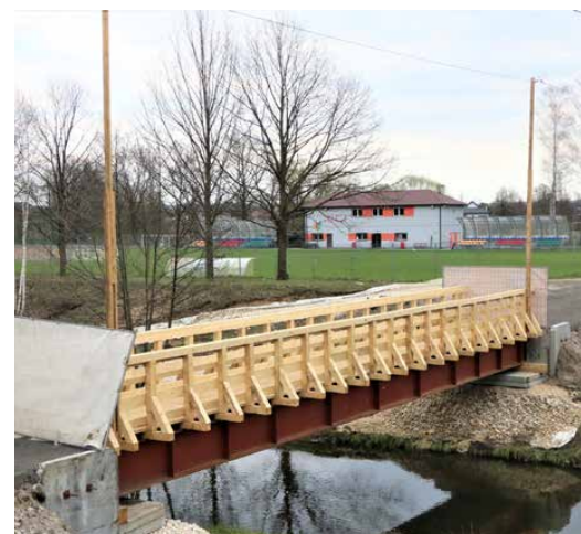
Pod koniec marca wybudowano tymczasową kładkę dla pieszych i rowerzystów

wysokie środki na to przedsięwzięcie. - mówi Jarosław Nowak, radny z Preczowa. Red.