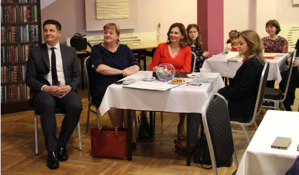
Zaproszeni goście przeczytali swoje ulubione wiersze

SWOJE ULUBIONE WIERSZE CZYTALI GOŚCIE KAWIARENKI POETYCKIEJ, KTÓRZY ODWIEDZILI NASZĄ BIBLIOTEKĘ 23 MARCA BYŁA POEZJA MIŁOSZA, SZYMBORSKIEJ, TUWIMA I KILKU INNYCH, MNIEJ LUB BARDZIEJ ZNANYCH POETÓW.