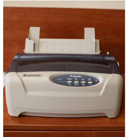
Nowa drukarka pozwala wydrukować brajlowskie dokumenty

Warto wspomnieć, że powyższe zadanie jest kontynuacją zakupionych w ubiegłym roku tablic tyflograficznych z planem budynku Urzędu Gminy Psary, które odzwierciedlają przestrzeń danej kondygnacji oraz jej najważniejsze elementy. Teraz osoba niewidoma lub niedowidząca będzie mogła swobodnie i szybko odnaleźć interesujący ją pokój w budynku naszego urzędu.