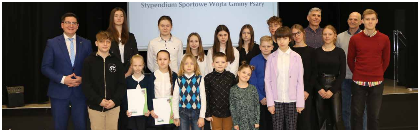
W tym roku stypendia otrzymało aż 25 najzdolniejszych sportowców

13 MARCA W SALI BANKIETOWEJ W OŚRODKU KULTURY W PRECZOWIE ODBYŁA SIĘ UROCZYŚĆ WRĘCZENIA STYPENDIÓW SPORTOWYCH WÓJTA GMINY PSARY. WŚRÓD LAUREATÓW ZNALEŻLI SIĘ MIESZKAŃCY, KTÓRZY W 2022 ROKU WYKAZALI SIĘ NAJWIĘKSZYMI OSIĄGNIĘCIAMI W TEJ DZIEDZINIE.