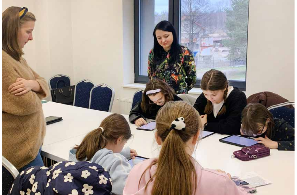
Młodzież poznała podstawowe pojęcia związane z dziennikarstwem

Bardzo ważnym aspektem zajęć było też przekazanie uczestnikom wiedzy na temat tego, jak można bezpiecznie korzystać z urządzeń informatycznych i aplikacji internetowych, czego nie wolno robić w sieci i jaka spoczywa odpowiedzialność na każdym, kto publikuje materiały w sieci. Młodzież poznała podstawowe gatunki dziennikarskie