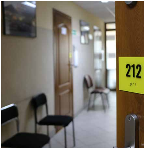
Na drzwiach do pokoi pojawiły się tabliczki informacyjne w brajlu

Gmina zgodnie z obowiązującymi przepisami prawa zobowiązana jest do zapewnienia dostępności architektonicznej, cyfrowej oraz informacyjno-komunikacyjnej osobom ze szczególnymi potrzebami, dlatego też nasz urząd działa w tym kierunku. Red.