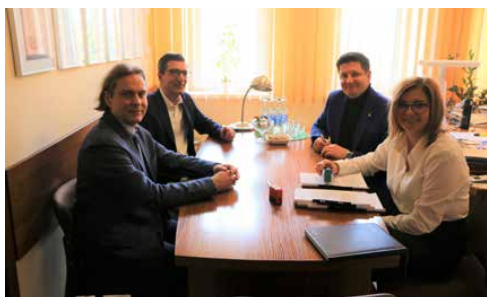
UMOWA NA BUDOWĘ CENTRUM PRZESIADKOWEGO PODPISANA