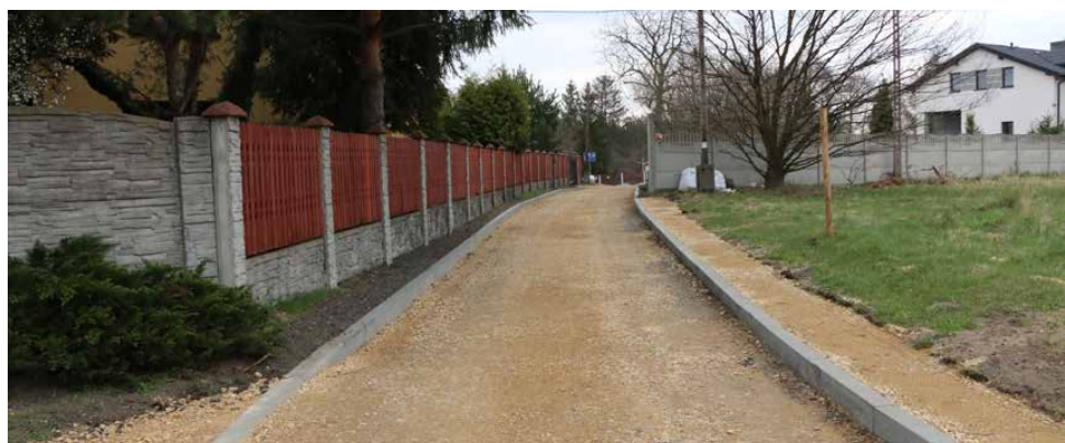
Zakończenie prac zaplanowano na kwiecień

Roboty prowadzone są aktualnie na całej długości ulicy Brzeżnej. Wykonawca zakończył już korytowanie i profilowanie oraz zagęszczanie podłoża, a na całej długości drogi położył krawężniki. W najbliższych dniach rozpocznie prace związane z położeniem warstw wiążącej i ścieralnej. Wykonawcą zadania jest firma P.P.U.H LIBUD Spółka Jawna z Czeladzi, a koszt inwestycji wyniesie 299 636,98 zł. Planowany termin zakończenia prac to kwiecień tego roku. Red.