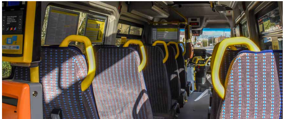
Linie metropolitalne ułatwiają podróżowanie po Górnośląsko-Zagłębiowskiej Metropolii

- Mieszkańcy mojej gminy mają teraz możliwość dotarcia tym samym autobusem na lotnisko w Pyrzowicach i do centrum Sosnowca z możliwością przesiadki na inne linie miejskie, wy-