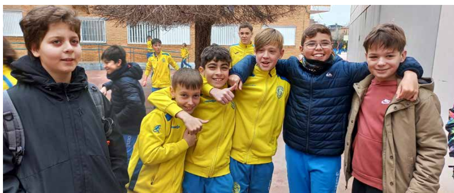
Wyjazd był doskonałą okazją do zawarcia nowych, międzynarodowych znajomości