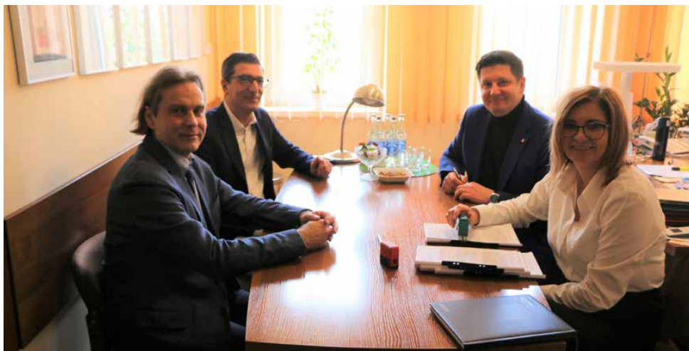
Pod koniec lutego podpisano umowę na budowę Centrum Przesiadkowego

Inwestycja na pewno poprawi komfort i szybkość podróżowania mieszkańców naszej gminy. Uruchomione już 3 połączenia metropolitalne na terenie gminy Psary, ułatwiają przemieszczanie się między pobliskimi gminami i miastami. To właśnie M19,