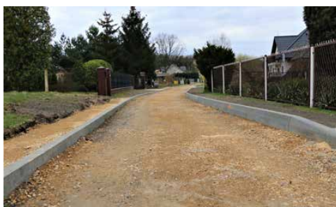
TRWAJĄ PRACE NA ULICY BRZEŃNEJ W PRECZOWIE