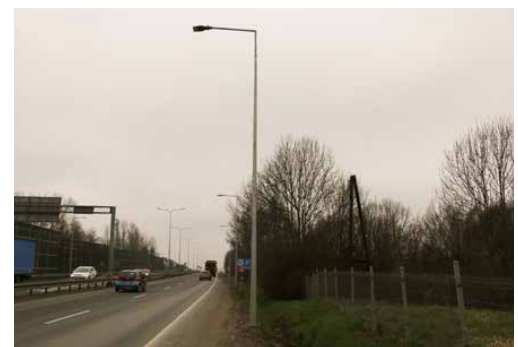
Oświetlenie zwiększa bezpieczeństwo kierowców i pieszych

odcinku DK86 w Sarnowie, w rejonie skrzyżowania z ulicą Wiejską oraz ulicą Jasną. W ramach prac, GDDKiA zabudowało dodatkowe słupy oświetleniowe, które poprawią bezpieczeństwo pieszych znajdujących się na pasach. Zostało również wykonane doświetlenie przejścia dla pieszych, skrzyżowania oraz fragmentów chodnika na ulicy Odkrywkowej w Będzinie, które poprawią bezpieczeństwo pieszych i pasażerów wyjeżdżających na DK86 od strony Gródkowa. Red.