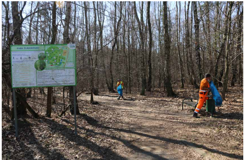
Prace porządkowe objęły także Park Żurawiniec

z dnia na dzień. Dlatego apelujemy po raz kolejny do wszystkich, by nie zostawiali po sobie papierków, tylko wyrzucali je do koszy, a jeśli nie ma ich w pobliżu zabierali ze sobą i wyrzucali w innym, przeznaczonym do tego miejscu. Problem bardzo często pojawia się w Parku Żurawiniec oraz w skateparku w Psarach, a zwłaszcza