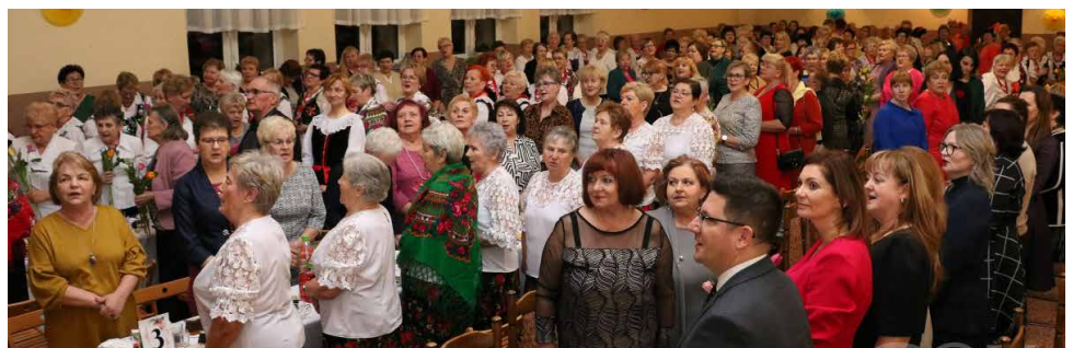
W uroczystości wzięły udział reprezentantki organizacji społecznych z gminy Psary

dowodem na to był bis występujących artystów. GOK