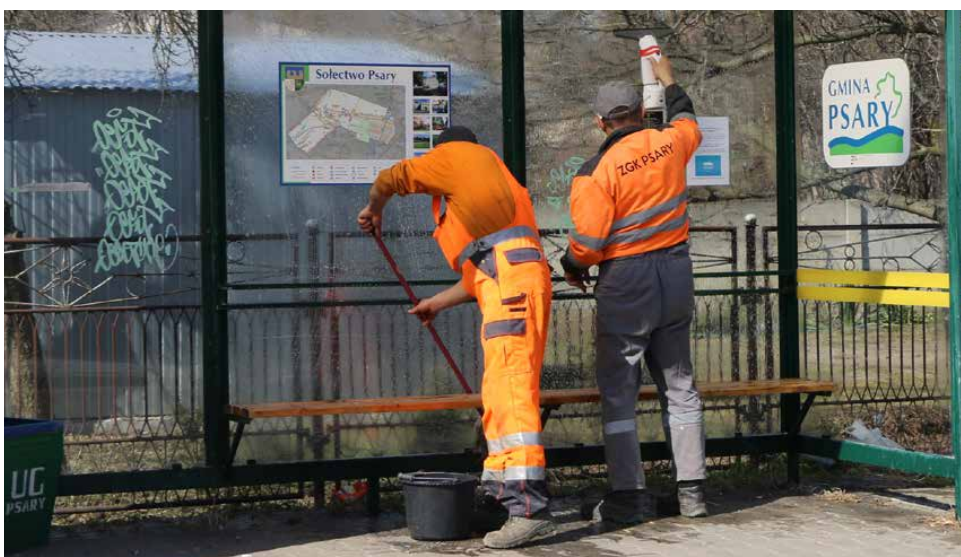
Pracownicy ZGK myją wiaty przystankowe na terenie gminy

w znajdującej się na tym terenie altanie, która bardzo często jest użytkowana niezgodnie z przeznaczeniem i dewastowana. Zarówno teren parku należący do Gminy jak i altana w Psarach przy OSP sprzątany jest regularnie przez pracowników ZGK. Jednak bardzo często uprzątnięte w jeden dzień miejsce publiczne w kolejnym dniu pełne jest porzucanych śmieci i butelek. Przypominamy, że zgodnie z obowiązującym regulaminem w parku obowiązuje zakaz zaśmiecania, spożywania napojów alkoholowych i palenia tytoniu, a za każde jego uprzątnięcie płacą mieszkańcy. Tylko wspólnie dbając o porządek możemy żyć w czystej i zadbanej gminie. ZGK