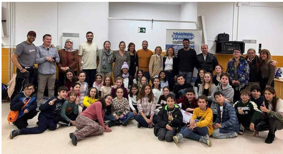
Uczniowie i nauczyciele z Psar odwiedzili hiszpańską szkołę w Cordobie

OD 6 DO 10 MARCA UCZNIOWIE SZKOŁY PODSTAWOWEJ W PSARACH WZIĘLI UDZIAŁ W KOLEJNEJ, PIĄTEJ JUŻ MOBILNOŚCI, W RAMACH PROJEKTU „OPEN MIND SKILLFUL HANDS”, KTÓRA ODBYWAŁA SIĘ W HISZPANII. W MOBILNOŚCI WZIĘLI UDZIAŁ UCZNIOWIE Z KLASY VI ORAZ NAUCZYCIELKI JĘZYKA ANGIELSKIEGO I EDUKACJI WCZESNOSZKOLNEJ.