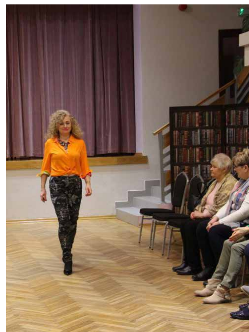
Pokazy mody w naszej gminie to już tradycja