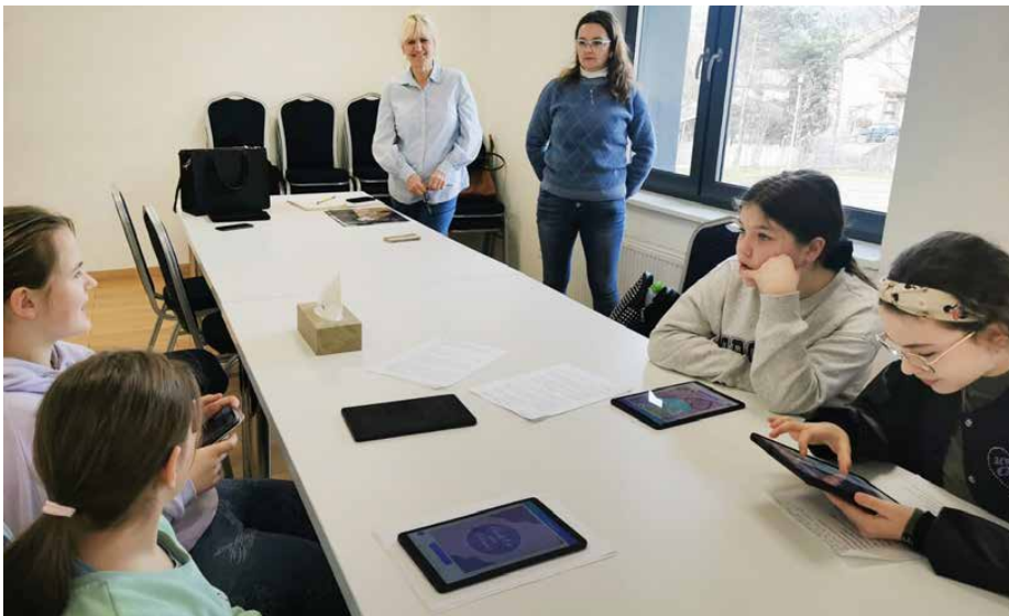
Zajęcia odbywały się w ramach projektu „Cyfrowi Eksperti”

i publicystyczne oraz zaznajomiła się z podstawowymi pojęciami związanymi z mediami. Sporo miejsca poświęcono także na zajęciach omówieniu zasad tworzenia infografiki oraz aplikacjom do tworzenia i montażu filmów.