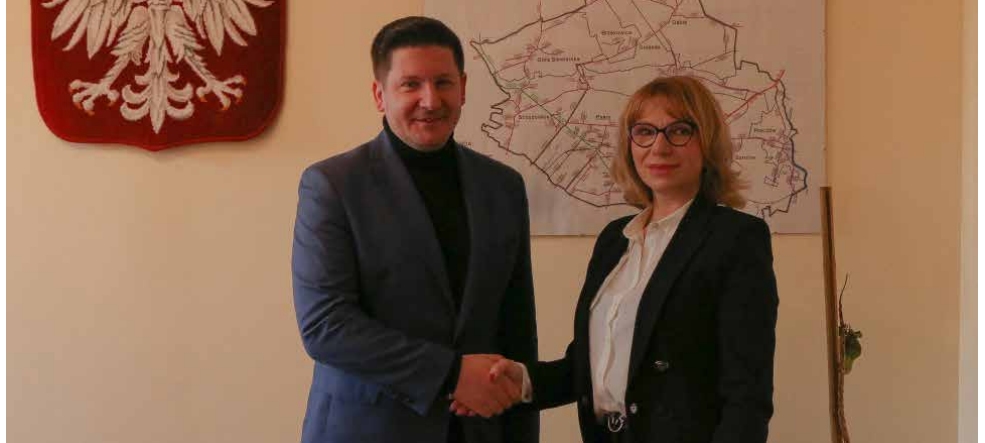
W marcu wójt podpisał umowę na rozbudowę OK i OSP w Preczowie

W ubiegłym roku psarski samorząd otrzymał dofinansowanie w ramach „Polskiego Ładu” w wysokości 2 mln zł na rozbudowanie Ośrodka Kultury i OSP w Preczowie. Inwestycja zakłada rozbudowę istniejącego budynku o nowy segment, którego powierzchnia użytkowa wyniesie 305 m 2 . Na parterze pojawią się ogólnodostępne toalety, pomieszczenie na sprzęt ogrodniczy i dwa garaże strażackie. Boksy garażowe będą na tyle duże, że bez problemu zmieści się w nich w przyszłości nowe średnie auto pożarnicze. Na piętrze powstanie ogólnodostępna sala, pomieszczenia gospodarcze, pomocnicze i socjalne, spiżarnia, aneks kuchenny, zmywalnia oraz przechowalnia dla sprzętu muzycz-