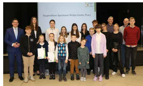
WRĘCZONO STYPENDIA SPORTOWE WÓJTA GMINY PSARY