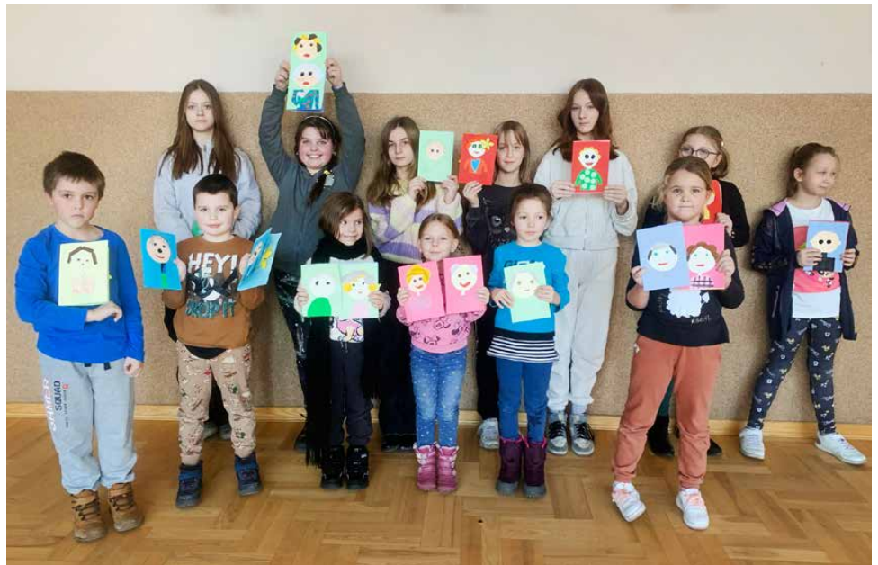
Podczas zajęć powstało wiele pięknych prac

Ośrodek Kultury w Sarnowie na dwa zimowe tygodnie zamienił się w centrum szkolenia młodych dziennikarzy. Młodzież na zajęciach szkoliła się