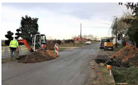
s. 4 BUDŻET PSAR NA 2023 ROK