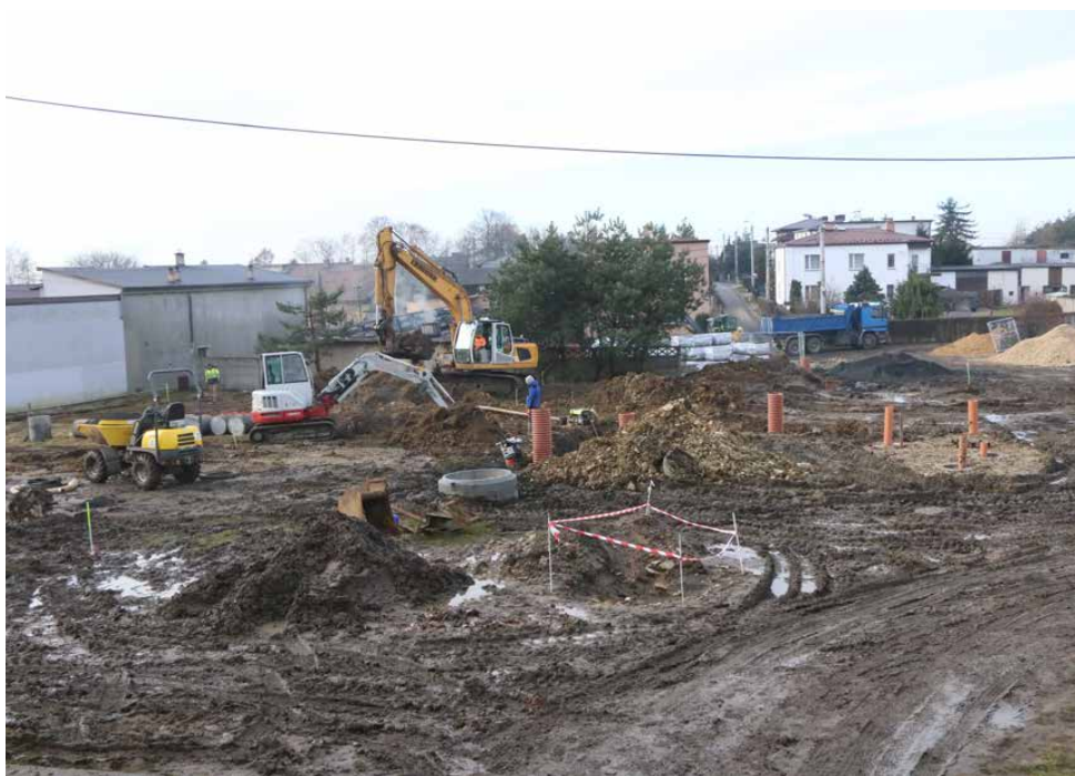
Na placu za ośrodkiem kultury i OSP trwają prace ziemne

Wykonawcą inwestycji jest firma Silesia Trans Service Sp. z o.o. z Katowic, a jej wartość sięga 4 860 841,44 zł. Zgodnie z umową prace potrwać do listopada tego roku. Red.