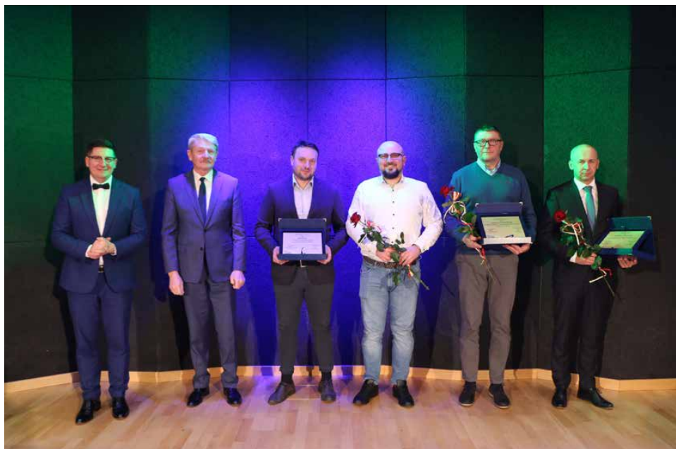
Tradycją Noworocznego Spotkania jest wręczenie podziękowań wspierającym nasz samorząd