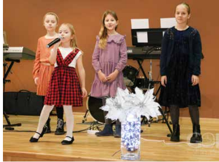
Na scenie wystąpili utalentowani artyści z naszej gminy