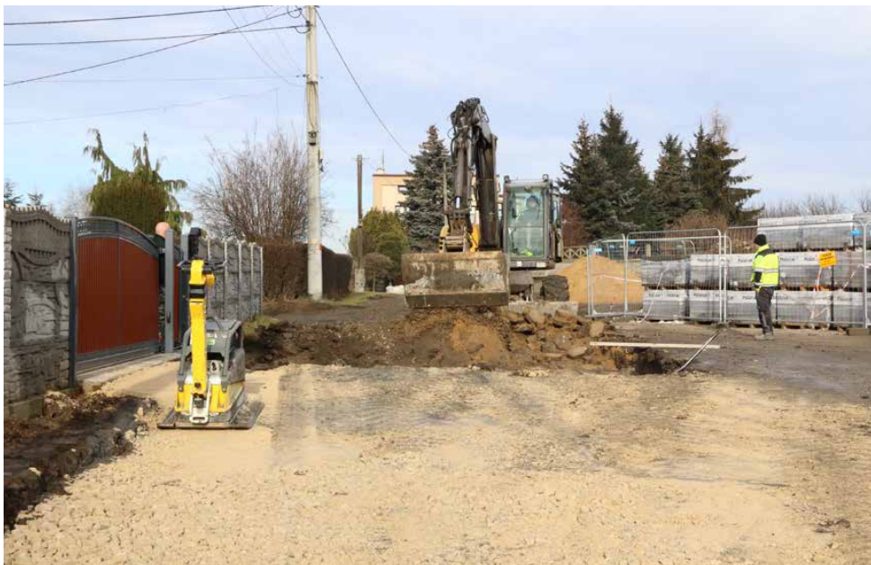
Zadanie obejmuje m.in. budowę odwodnienia ul. Ogrodowej

Równocześnie trwają prace związane z budową kanalizacji deszczowej, przebudową sieci gazowej i odwodnieniem terenu za ośrodkiem kultury i remizą OSP. Lada dzień rozpocznie się także budowa placu manewrowego przed garażami strażaków i drogi wjazdowej między ośrodkiem kultury, a Zakładem Gospodarki Komunalnej, dzięki której wyjazdy druhów będą szybsze i bezpieczniejsze. Warto dodać, że w ramach inwestycji zostanie także obniżona posadzka w jednym z garaży OSP, by dostosować jego wysokość do parametrów nowych wozów pożarniczych.