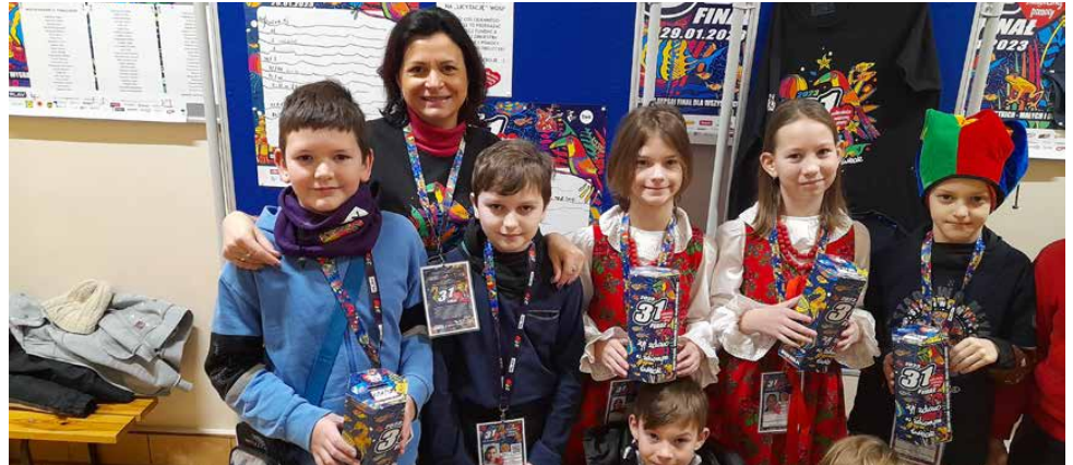
Po raz kolejny niezawodni okazali się uczniowie i nauczyciele

W tym roku zagraliśmy pod hasłem „Chcemy wygrać z sepsą! Gramy dla wszystkich – małych i dużych!”, a zebrane środki zostaną przeznaczone na zakup urządzeń ułatwiających szybszą diagnostykę zakażeń, a co za tym idzie