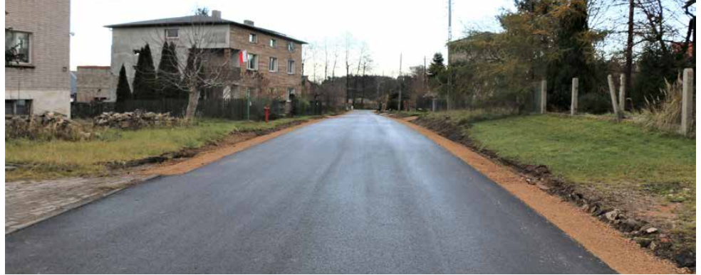
W ubiegłym roku zakończono przebudowę drogi w Dąbiu Chrobakowym

Poprawa infrastruktury drogowej to jedno z najważniejszych zadań dla mieszkańców. Dlatego w zeszłym roku przebudowaliśmy drogę w Dąbiu Chrobakowym, wykonaliśmy nakładki asfaltowe w Sarnowie, przebudowaliśmy ul. Krótką w Malinowicach, wybudowaliśmy odcinek gminnej drogi ul. Leśnej w Gródkowie i odwodnienie ul. Leśnej w Sarnowie. Część środ-