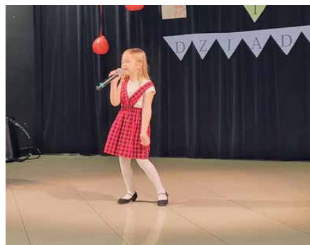
Mali wokaliści umilili czas spotkania

Każda babcia i dziadek otrzymali drobne upominki ufundowane dzięki