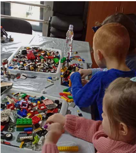
Dzieci tworzyły niezwykle budowle z klocków

Placówka w Preczowie przyciągała pojedynkami na Xboxie, tańcami z wykorzystaniem kinecta i zajęciami plastycznymi. GOK