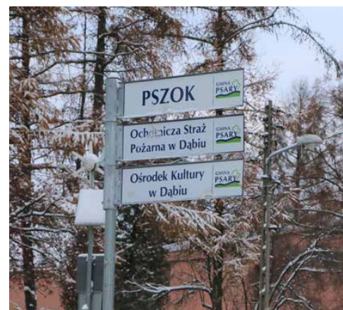
Na terenie gminy pojawiło się 331 tabliczek

gowa „Krupińscy II” Sp. Jawna z Dą- browy Górniczej, a jego koszt wyniósł 97 984,26 zł. Red.