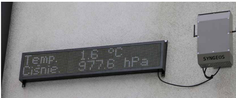
Stacja pomiarowa na elewacji Urzędu Gminy

Projekt zintegrowany LIFE „Śląskie. Przywracamy błękit”. Kompleksowa realizacja Programu ochrony powietrza dla województwa śląskiego realizowany jest przy dofinansowaniu z Programu LIFE Unii Europejskiej oraz Narodowego Funduszu Ochrony Środowiska i Gospodarki Wodnej. LIFE20 IPE/PL/000007 - LIFE-IP AQP-SILESIA-SKY