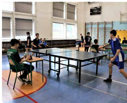
Mistrzostwa odbyły się w szkole w Dąbiu

W zawodach rozegranych przez dziewczyny I miejsce zajęła szkoła w Dąbiu, II miejsce w Gródkowie, na III uplasował się Sarnów, IV Strzy-