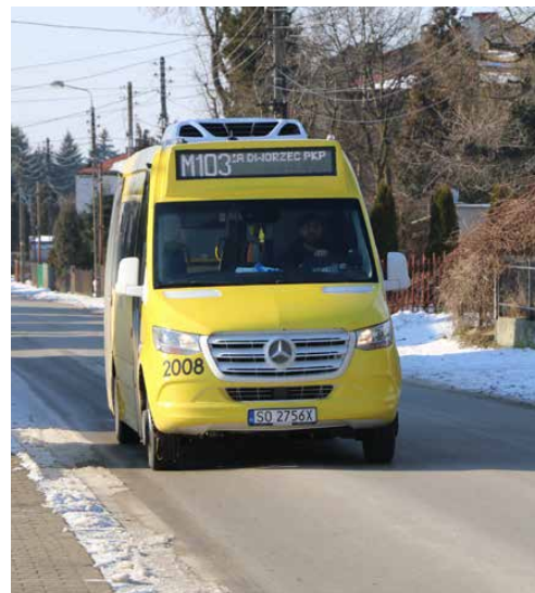
Linia M103 można dojechać do Dąbrowy Górniczej