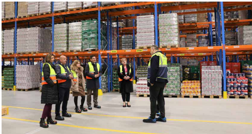
Przedstawiciele gminy odwiedzili nową halę w Gródkowie

Ponad 13 tys. m 2 powierzchni magazynu zajmuje zaawansowana technologicznie chłodnia, która składa się z czterech stref chłodniczych. W centrum zastosowano system monitoringu procesów magazynowych, który polega na rejestracji wideo on-line przygotowania zamówień za pomocą kamer znajdujących się na wózkach widłowych. W procesie multikomplektacji - przygotowania towaru do róż-