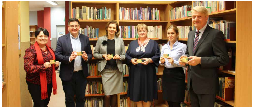
Pierwsze elektroniczne karty trafiły do władz samorządowych

biblioteczne „życie”. Czytelnicy będą mogli ze swoich domowych komputerów rezerwować czy zamawiać interesujące ich tytuły, a następnie odbierać je w placówkach. Red.