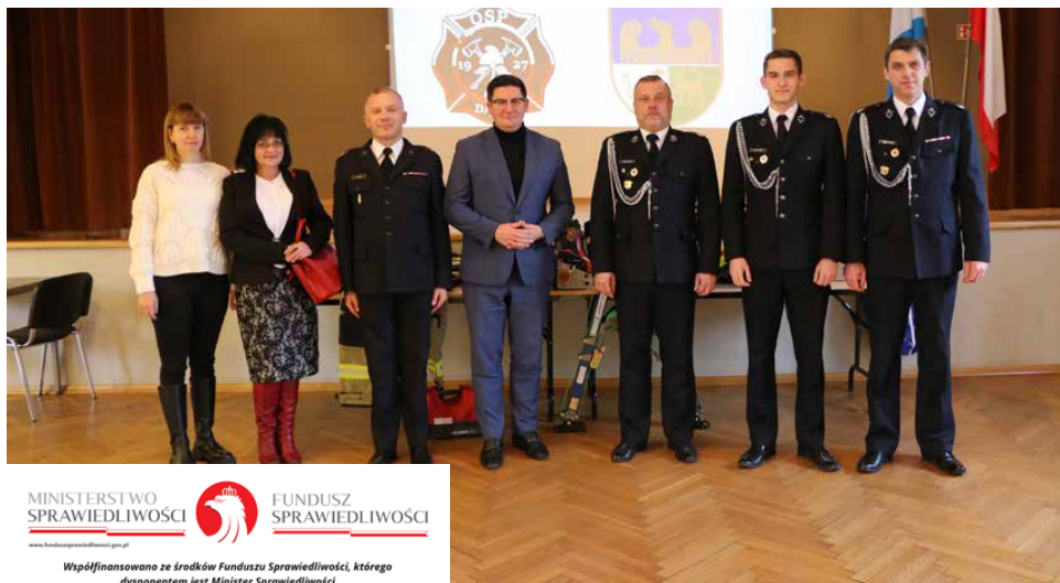
Strażacy w grudniu odebrali nowe wyposażenie i sprzęt

30 GRUDNIA W SALI BANKIETOWEJ W DĄBIU PRZEKAZANO WYPOSAŻENIE I SPRZĘT RATOWNICZY DLA OCHOTNICZEJ STRAŻY POŻARNEJ W DĄBIU. ZAKUP, KTÓREGO WARTOŚĆ TO PONAD 50 TYSIĘCY ZŁOTYCH, BYŁ MOŻLIWY DZIĘKI ŚRODKOM FINANSOWYM PRZEKAZANYM Z FUNDUSZU POMOCY POKRZYWDZONYM ORAZ POMOCY POSTPENITENCJARNEJ – FUNDUSZU SPRAWIEDLIWOŚCI.