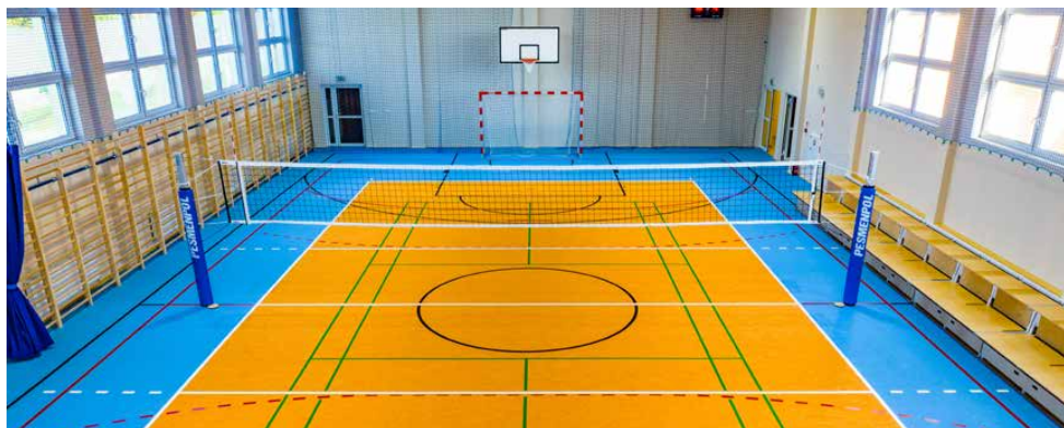
Jesienią otwarto nową salę gimnastyczną w Gródkowie

O podsumowanie ostatnich 12 miesięcy poprosiliśmy wójta Tomasza Sadłonia. - Bardzo się cieszę, że przez ostatni rok udało nam się zrealizować tak wiele. 24,1 mln zł to realizacja aż 56 inwestycji. Szczególnie cieszy mnie fakt, że cały czas utrzymujemy to wysokie tempo rozwoju. Udział wydatków na inwestycje we wszystkich wydatkach budżetu Gminy w 2022 roku sięgnął prawie 27%. Za cały okres mojej pracy na stanowisku wójta średnia wynosi ponad 24%, co jest rzadko spotykanym wskaźnikiem dynamicznego rozwoju. Tylko w tej kadencji do końca zeszłego roku na rozwój wydaliśmy 76,8 mln zł, a jeśli dodamy do tego jeszcze to co mamy w planach na rok 2023 to osiągniemy niebywały wynik 99,9 mln zł, czyli o ponad 16 mln zł więcej niż łącznie w dwóch poprzednich kadencjach. Przed nami jeszcze wiele ważnych dla mieszkańców zadań, które zamierzamy w najbliższej przyszłości zrealizować. Red.