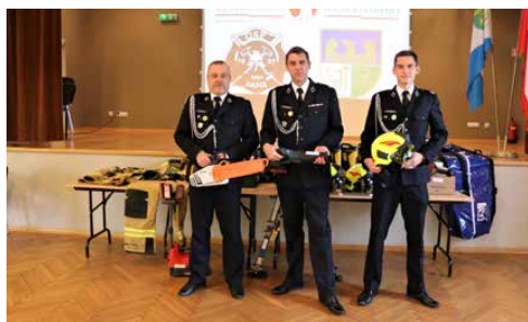
OSP DĄBIE Z NOWYM SPRZĘTEM