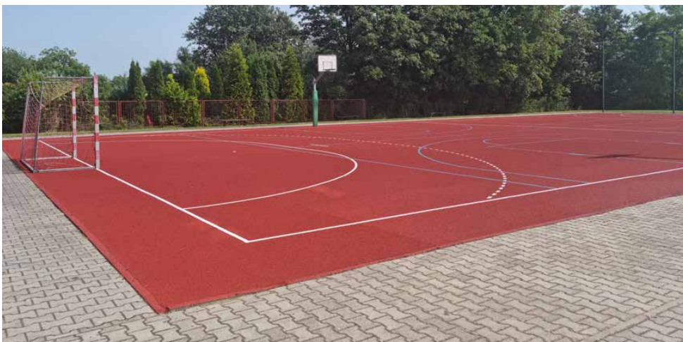
Boisko wielofunkcyjne w Strzyżowicach zostało wyremontowane

Tegoroczne remonty i modernizacje to kontynuacja działań, które systematycznie podejmuje psarski samorząd. Dzięki nim, z roku na rok poprawia się komfort i bezpieczeństwo w naszych placówkach oświatowych. Wiadomo, że przez długi okres eksploatacji niektórych obiektów, potrzebna jest ich wymiana czy naprawa i tak się właśnie dzieje w gminie Psary. Dzięki temu, najmłodsi mieszkańcy mogą zdobywać wiedzę i rozwijać swoje umiejętności w coraz lepszych warunkach. Red.