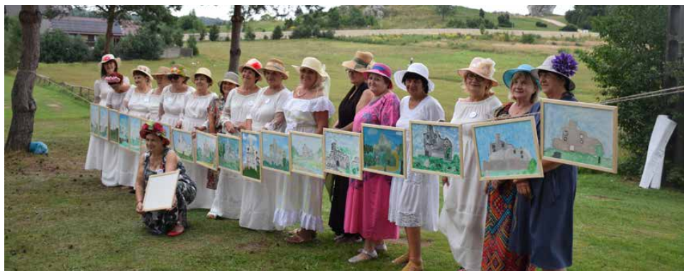
Członkinie Stowarzyszenia Kobiet 18+ wzięły udział w warsztatach w Mirowie

tywne emocje. Dawały sobie wsparcie, bezcenny śmiech i poczucie, że są razem. A wszystko to w bliskim kontakcie z naturą, wśród urzekających plenerów Jury i bezcennych śladów historii Orlich Gniazd. Uczestniczki bardzo wysoko oceniły organizację warsztatów. Projekt był szeroko promowany z pomocą różnorodnych mediów. W imieniu wszystkich uczestniczek warsztatów, wyrażamy podziękowanie za wsparcie finansowe. SK 18+