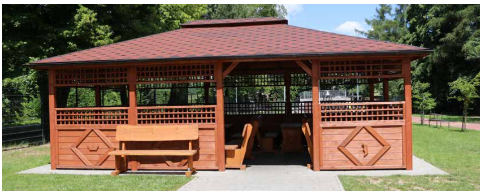
Już wkrótce podobne altany pojawią się w Psarach, Dąbiu i Strzyżowicach

JUŻ WKRÓTCE W GMINIE PSARY POWSTANĄ KOLEJNE MIEJSCA DO ODPOCZYNKU I WSPÓLNYCH SPOTKAŃ TOWARZYSKICH. TYM RAZEM DREWNIANE ALTANY POJAWIĄ SIĘ PRZY ŻŁOBKU I PRZEDSZKOLU W PSARACH, REMIZIE OSP I OŚRODKU KULTURY W DĄBIU ORAZ CENTRUM USŁUG SPOŁECZNYCH W STRYŻOWICACH.