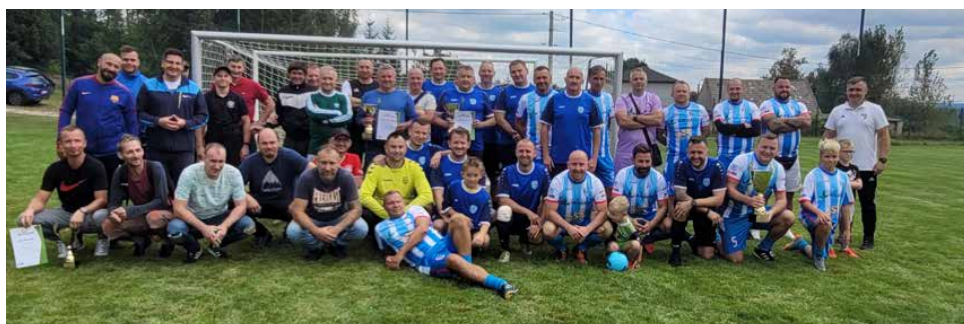
W turnieju wzięły udział 4 zespoły z naszej gminy