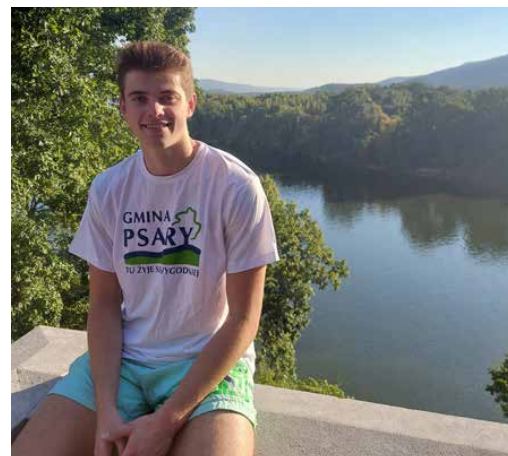
Kuba zaczyna drugi rok w szkole Baylor

Mam trzy rady: 1. Ucz się j. angielskiego, ale tak serio – bo to co w szkole to za mało, 2. Miej cel i nie bój się marzyć, bądź odważny, 3. Pracuj ciężko każdego dnia.