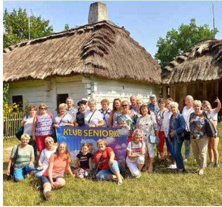
Seniorzy odwiedzili wiele ciekawych miejsc

Kolejna wycieczka przybliżyła przemysłowe dziedzictwo wielokulturowej Łodzi - miasta, które zachowując pofabryczną „duszę”, nadało rewitalizowanym obiektom nowe funkcje. Swoją przygodę seniorzy rozpoczęli od krótkiego pobytu w centrum Manufaktura i spaceru najdłuższym deptakiem w Polsce, jakim jest ulica Piotrkowska. Chwilą wytchnienia dla utrudzonych gorącym lipcowego dnia turystów, były spotkania w ulicznej Galerii Wielkich Łodzian - na ławeczce z Tuwimem czy przy fortepianie z Rubinsteinem oraz czas wolny na terenie Manufaktury. Grupa odwiedziła też Księżę Młyn, ważny zabytek architektury przemysłowej, gdzie znajdują się tzw. famuły - łódzkie domy wielorodzinne, będące odpowiednikiem śląskich familoków, a na