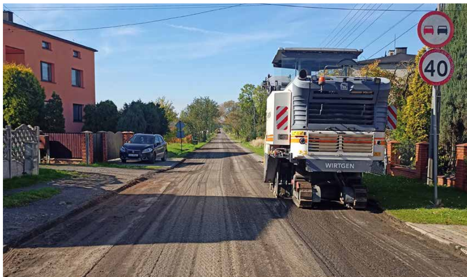
Nowa nawierzchnia pojawi się na blisko 1,5 km odcinku jezdni