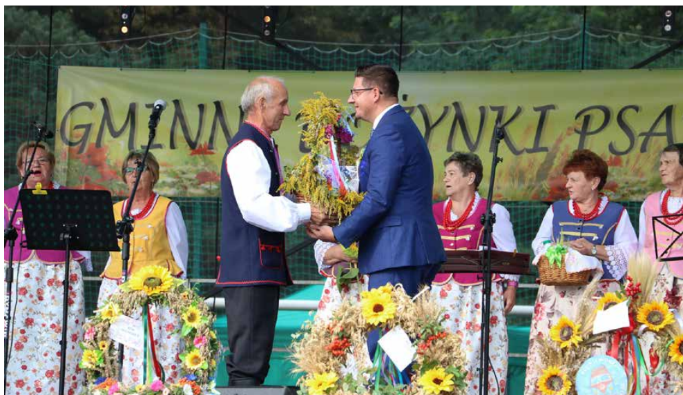
Obrzęd dożynkowy poprowadził zespół śpiewaczy Dąbie

PO DWULETNIJ PRZERWIE SPOWODOWANEJ PANDEMIA, DO PSAR WRÓCIŁA NAJWIĘKSZA GMINNA IMPREZA KULTURALNA – DOŻYŃKI, KTÓRE SĄ UHONOROWANIEM CIĘŻKIEJ PRACY ROLNIKÓW I PODZIĘKOWANIEM ZA ZEBRANE ŻNIWA. W TYM ROKU ŚWIĘTO PŁONÓW ODBYŁO SIĘ 4 WRZEŚNIA NA STADIONIE LKS ISKRA PSARY.