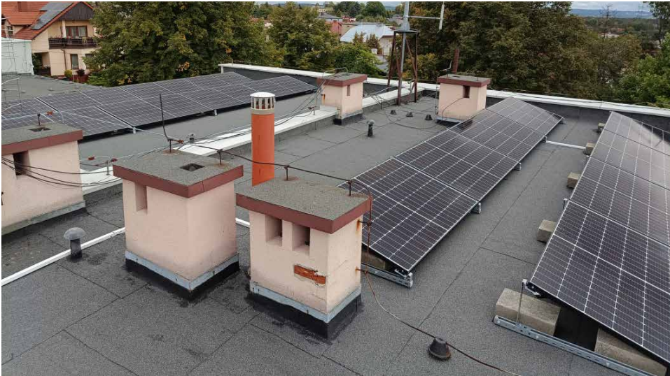
Fotowoltaika pojawiła się m.in. na Ośrodku Kultury w Sarnowie

JUŻ WKRÓTCE W KOLEJNYCH 4 BUDYNKACH UŻYTECZNOŚCI PUBLICZNEJ Z TERENU NASZEJ GMINY: BIBLIOTECE PUBLICZNEJ I OCHOTNICZEJ STRAŻY POŻARNEJ W PSARACH, OŚRODKU KULTURY I OCHOTNICZEJ STRAŻY POŻARNEJ W DĄBIU ORAZ OŚRODKU KULTURY W SARNOWIE ZACZNĄ DZIAŁAĆ NOWE INSTALACJE FOTOWOLTAICZNE, PRZEZNACZONE DO PRODUKCJI ENERGII ELEKTRYCZNEJ. ŁĄCZNY KOSZT TEGO PRZEDSIĘWZIĘCIA WYNOŚI PONAD 300 TYS. ZŁ Z CZEGO PONAD 186 TYS. ZŁ STANOWI POZYSKANE DOFINANSOWANIE.