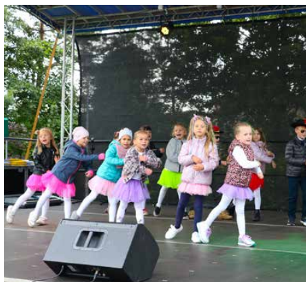
Zgromadzeni obejrzeli występy dzieci ze Strzyżowic

Podczas święta, każdy miał okazję spróbować przepysznych pieczonych