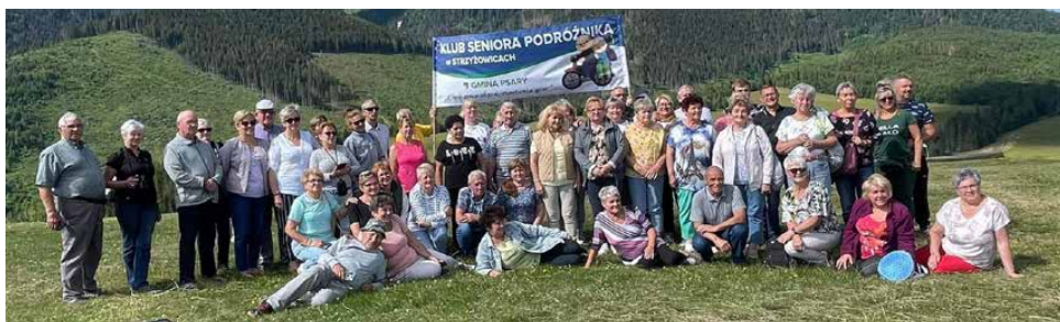
Za Seniorami Podróżnikami jest wiele wycieczek i atrakcji

Już dziś informujemy, że dzięki wsparciu finansowemu gminy Psary, 19 listopada odbędzie się spotkanie ze światowej sławy himalaistą, zdobywcą szczytu K2 i uczestnikiem akcji ratowniczej Elizabeth Revlon Adamem Bieleckim, na które serdecznie zapraszamy mieszkańców naszej gminy do CUS Strzyżowice. KSP