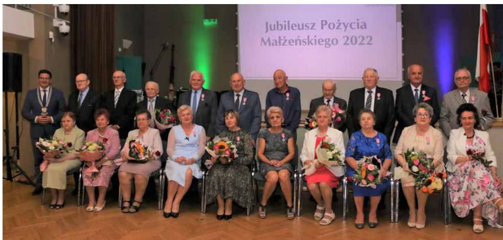
Jubilaci obecni 8 września w sali bankietowej w Dąbiu