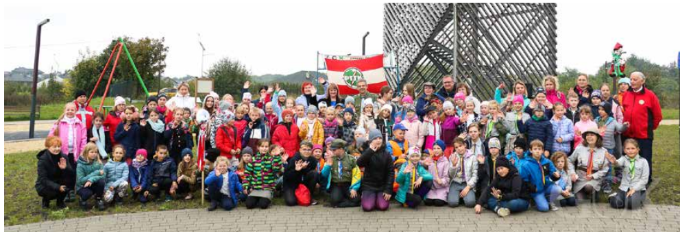
Uczniowie wzięli udział w rajdzie „Szlakami z pięknymi widokami”

Mamy nadzieję, że wspólne wędrowanie i zabawy na świeżym powietrzu zachęcą młodych piechurów do uprawiania turystyki kwalifikowanej i pieszej. Do zobaczenia na szlaku! ZSP Strzyżowice