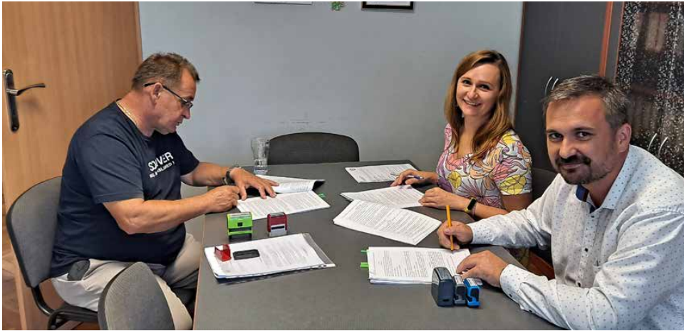
Jesienią rozpocznie się budowa kolektora ściekowego

W SIERPNIU ZAKŁAD GOSPODARKI KOMUNALNEJ W PSARACH PODPISAŁ UMOWĘ NA BUDOWĘ KANALIZACJI SANITARNEJ, ŁĄCZĄCEJ PSARY Z WOJKOWICAMI. DZIĘKI TEJ INWESTYCJI, ŚCIEKI Z CZĘŚCI TERENU NASZEJ GMINY POPŁYNĄ DO OCZYSZCZALNI WOJKOWICKICH WÓD.