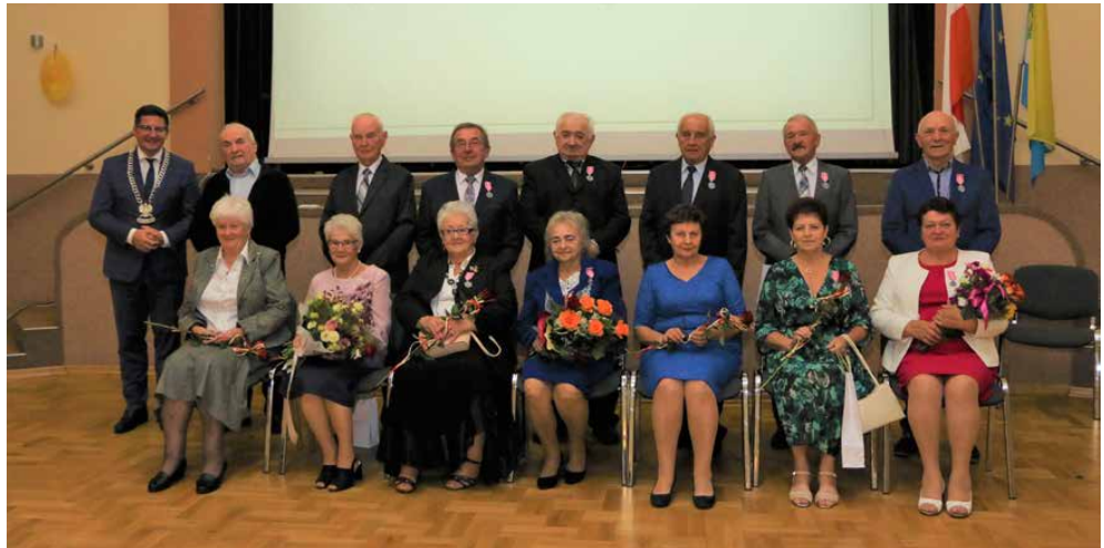
Małżonkowie obecni 8 września w Gminnym Ośrodku Kultury w Gródkowie