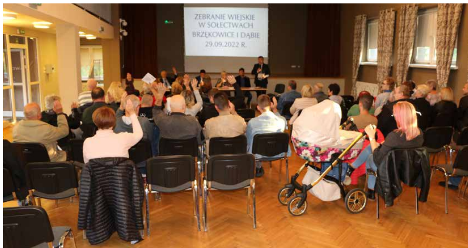
Mieszkańcy zdecydowali na co przeznaczą środki z funduszu sołectkiego

miejsowości. Kiedy mieszkańcy zdecydowali na co chcą przeznaczyć pieniądze, sołtys składa wniosek do wójta.