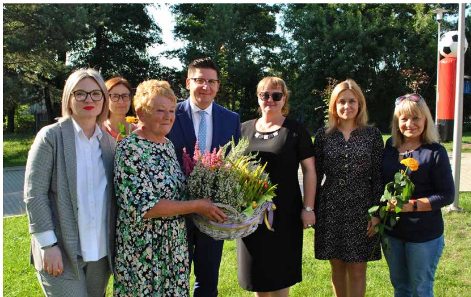
Otwarcie połączone z sołeckim piknikiem

8 WRZEŚNIA UROCZYŚCIE OTWARTO KWIETNY OGRÓDEK PRZY CENTRUM USŁUG SPOŁECZNYCH W STRYŻOWICACH. REALIZACJA TEGO PRZEDSIĘWZIĘCIA BYŁA MOŻLIWA DZIĘKI WSPARCIU STOWARZYSZENIA AKTYWNY WOJKOWICKI SENIOR.