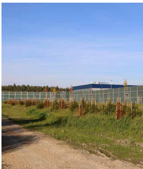
Halę od domów oddziela 40 m pas zieleni izolacyjnej

Zakończenie budowy nowego centrum dystrybucyjnego w Gródkowie to bardzo dobra wiadomość. Inwestycja przełoży się bowiem na znaczny wpływ z podatku od nieruchomości oraz nowe miejsca pracy. Red.