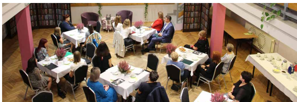
Psary od lat biorą udział w ogólnopolskiej akcji „Narodowe Czytanie”

„Narodowe Czytanie” to ogólnopolska akcja wspólnego czytania największych dzieł literatury polskiej, organizowana od 2012 roku. Tegoroczną lekturą były „Ballady i romanse”, które wspólnie w sali bankietowej w Psarach czytały władze gminy, przedstawiciele środowisk nauczycielskich i medycznych, uczniowie z psarskich szkół oraz mieszkańcy. Wśród wybranych utworów nie zabrakło „Świtezianki”, „Ro-