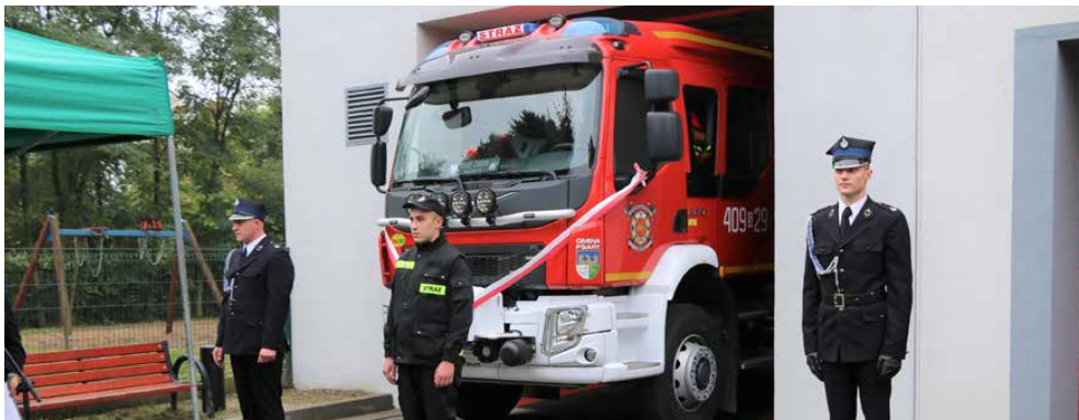
Na początku października odbyło się uroczyste przekazanie i poświęcenie wozu dla OSP Sarnów

Warto wspomnieć, że nowy pojazd trafił do jednostki OSP z Sarnowa w grudniu ubiegłego roku i zajął miejsce wysłużonego, prawie 40-letniego Jelcza. Wóz z napędem 4x4 wyposażony jest między innymi w urządzenia sygnalizacyjno-ostrzegawcze świetlne i dźwiękowe pojazdu uprzywilejowanego i radiostację przenośną analogowo-cyfrową. Jednorazowo samochód może zabrać sześćosobowy skład. Koszt średniego samochodu ratowniczo-gaśniczego wyniósł 780 927 zł, z czego 400 000 zł to dotacja z Krajowego Systemu Ratowniczo-Gaśniczego, a 380 927 zł dotacja z budżetu gminy Psary, w tym 30 000 zł z funduszu sołectwa Sarnowa. Red.