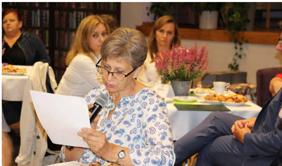
W akcję wspólnego czytania włączyli się m.in. dyrektorzy gminnych szkół

W ramach naszej bibliotekarskiej wdzięczności każdy z zaproszonych gości otrzymał najnowsze wydanie „Ballad” opatrzone pamiątkową pieczęcią Narodowego Czytania 2022, którą otrzymaliśmy wprost z kancelarii Prezydenta RP. Red.