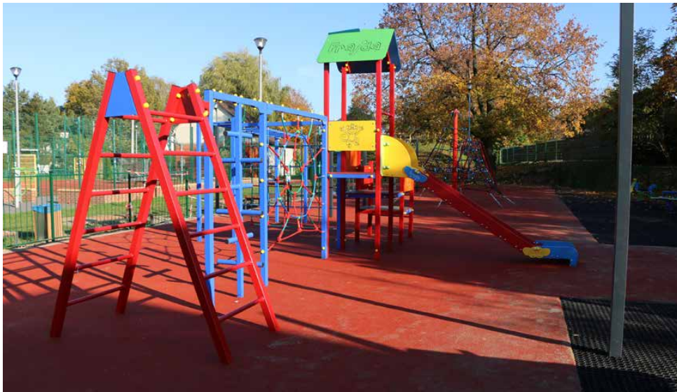
Plac zabaw w Preczowie został całkowicie przebudowany

Wartość inwestycji wyniosła 326 860 zł, a jej wykonawcą była firma Wilk Adam COLOR-SPORT z Bierunia. Red.