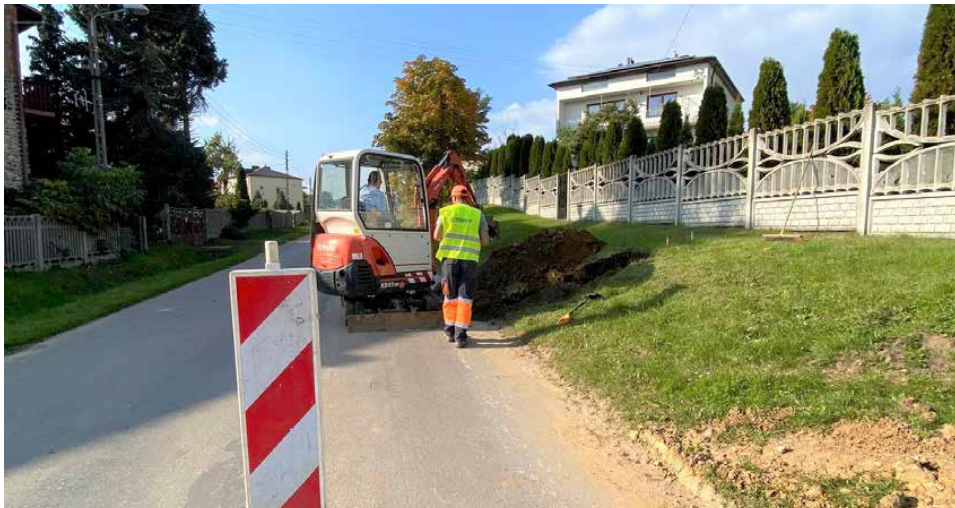
Ruszyła budowa sieci wodociągowej w Dąbiu

ROZPOCZĘLIŚMY KOLEJNĄ INWESTYCJĘ ZWIĄZANĄ Z GOSPODARKĄ WODNO-KANALIZACYJNĄ – BUDOWĘ PRZESZŁO 3,6 KM SIECI WODOCIĄGOWEJ W UL. KOŚCIELNEJ W DĄBIU, BRZĘKOWICACH GÓRNYCH, GOLĄSZY GÓRNEJ ORAZ DĄBIU GÓRNYM. WARTOŚĆ INWESTYCJI WYNOŚI PONAD 3,6 MLN ZŁ I ZOSTANIE WSPARTA DOTACJĄ SIĘGAJĄCĄ 95% PONIESIONYCH KOSZTÓW Z POLSKIEGO ŁADU.