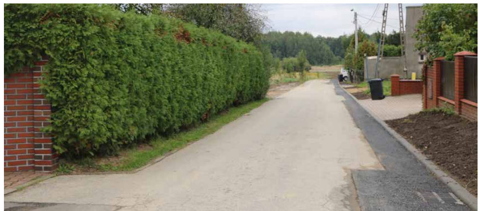
Na ulicy Leśnej w Sarnowie wybudowano kanalizację deszczową

Koszt inwestycji wyniósł 403 107,71 zł, a jej wykonawcą była firma BRUKPOL BIS Paweł Kruz z Mysłowa. Red.