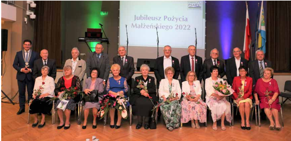
Pary obecne 6 września w sali bankietowej w Dąbiu

KĄDZY JUBILEUSZ JEST OKAZJĄ DO ŚWIĘTOWANIA, ALE ZŁOTE, DIAMENTOWE CZY ŻELAZNE GODY TO JUBILEUSZE NIEZWYKŁE, TAK JAK NIEZWYKŁE SĄ OSOBY, KTÓRE JE OBCHODZĄ. W TYM ROKU PARY Z WIELOLETNIM STAŻEM MAŁŻEŃSKIM ŚWIĘTOWAŁY 6, 7 I 8 WRZEŚNIA. UROCZYSTOŚCI ODBYŁY SIĘ W OŚRODKU KULTURY W DĄBIU ORAZ GMINNYM OŚRODKU KULTURY W GRÓDKOWIE.