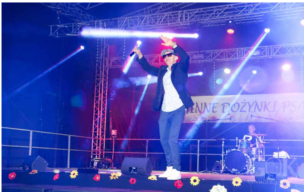
Gwiazdą wieczoru był zespół Bafla