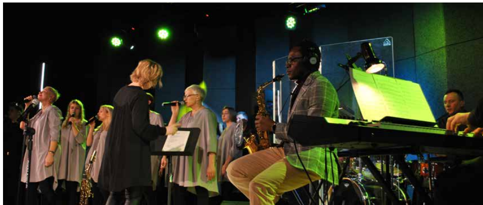
Chór Gospel „Dotyk Nieba” wystąpił w CUS już po raz drugi

11 GRUDNIA W CUS STRYŻOWICE ODBYŁ SIĘ KONCERT CHÓRU GOSPEL „DOTYK NIEBA”. ZESPÓŁ WYSTĘPOWAŁ W NASZEJ GMINIE JUŻ PO RAZ DRUGI.