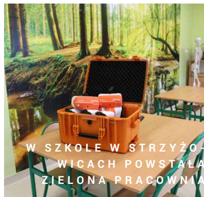
W SZKOLE W STRYŻO- WICACH POWSTAŁA ZIELONA PRACOWNIA