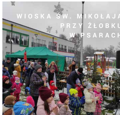
WIOSKA ŚW. MIKOŁAJA PRZY ŻŁOBKU W PSARACH