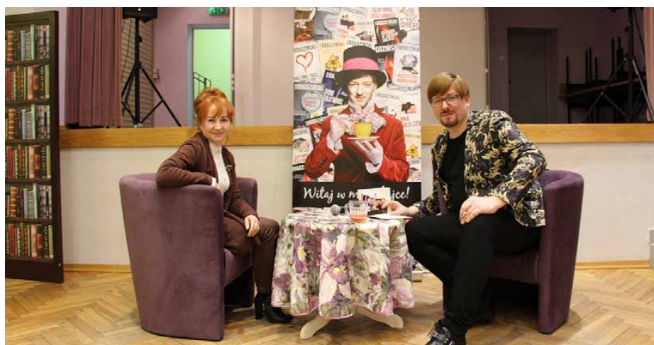
Pisarz na koniec spotkania rozdawał autografy

Nie mogło zabraknąć rozmów o książkach. Pisarz w zabawny sposób opowiadał o przygodach, jakie spotykały go na spotkaniach autorskich