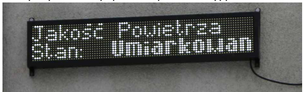
Stacja pomiarowa Syngeos Air Pro

Mieszkańcy gminy Psary mogą także wnioskować o środki finansowe w formie dotacji celowej z budżetu Gminy na wymianę starego źródła ciepła, a już wkrótce rozpocznie się nabór wniosków na usunięcie i unieszkodliwienie wyrobów zawierających azbest. Red.