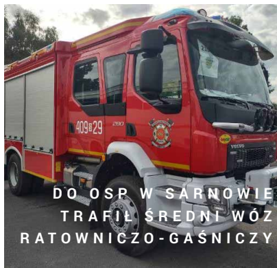
DO OSP W SARNOWIE TRAFIŁ ŚREDNI WÓZ RATOWNICZO-GAŚNICZY