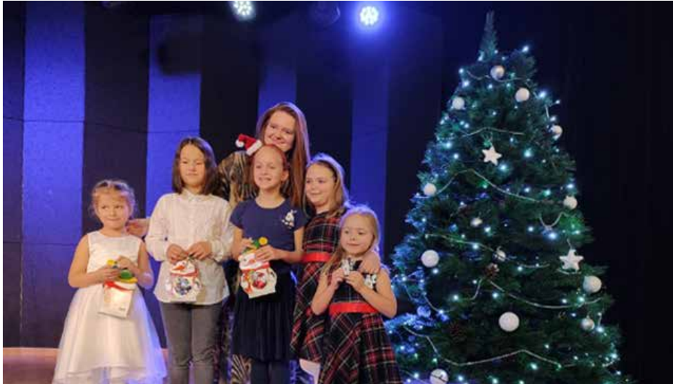
Na stryżowickiej scenie wystąpiły młode artystki z naszej gminy

20 GRUDNIA W SALI WIDOWISKOWEJ CUS W STRYŻOWICACH ODBYŁ SIĘ ZIMOWY KONCERT ZESPOŁU ŚPIEWACZEGO „STRYŻOWICZANIE” ORAZ UCZESTNICZEK ZAJĘĆ WOKALNYCH PROWADZONYCH PRZEZ GOK.