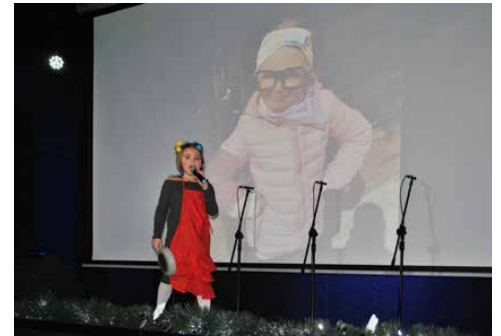
Występy były ilustrowane fotografiami piosenek

naniu którego usłyszeliśmy kolędę pt. „Jezusa narodzonego wszyscy witajmy”. Na zakończenie koncertu wszyscy uczestnicy wspólnie wykonali kolędę „Gore gwiazda gore” oraz