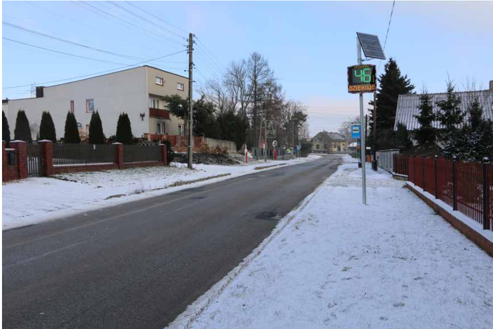
Nowy wyświetlacz prędkości przy szkole w Dąbiu

W GRUDNIU ZAMONTOWANO W NASZEJ GMINIE 6 RADAROWYCH WYŚWIETLACZY PRĘDKOŚCI RZECZYWISTEJ O ZASILANIU SOLARNYM. TYM RAZEM URZĄDZENIA POJAWIŁY SIĘ W DĄBIU, SARNOWIE I STRYŻOWICACH.