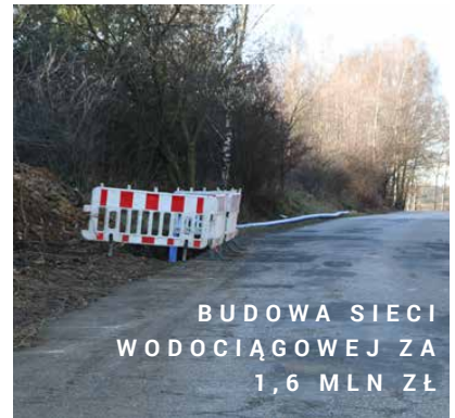
BUDOWA SIECI WODOCIĄGOWEJ ZA 1,6 MLN ZŁ