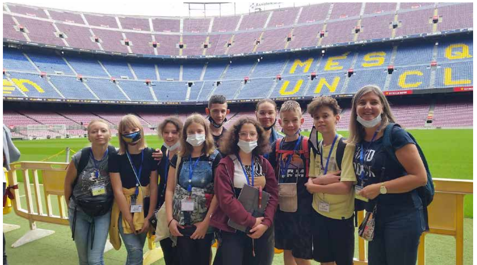
Uczestnicy projektu byli na Camp Nou

Podczas mobilności realizowano zadania projektowe. Bogaty program wizyty sprzyjał rozwojowi umiejętności matematycznych oraz informatycznych, kompetencji językowych, społecznych i kulturowych wszystkich uczestników. Uczniowie wzięli udział w zespołowych grach matematycznych oraz matematyczno-przyrodniczej grze terenowej na wydmach. Tworzyli mandale, rozwiązywali zagadki logiczne, łamigłówki oraz zadania LearningApps wykonane przez