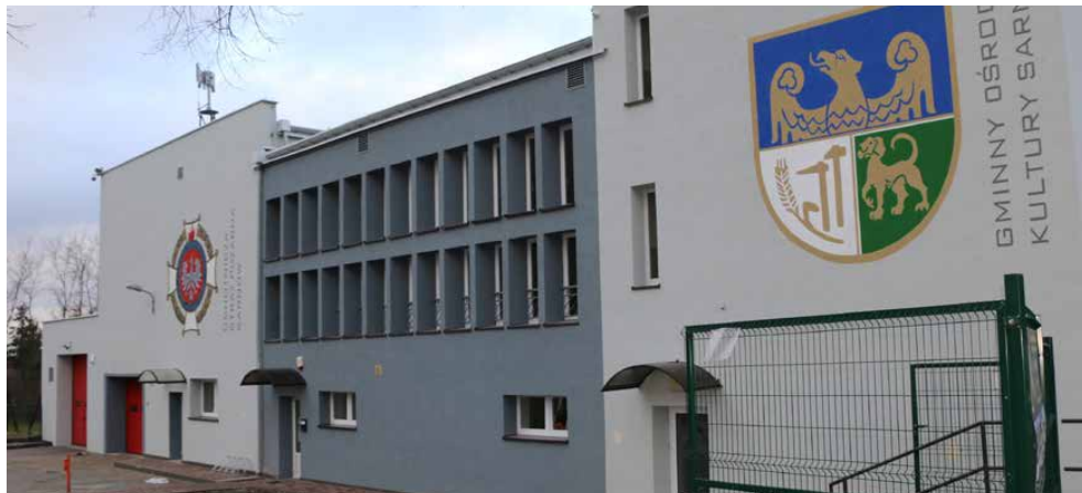
Zmodernizowany budynek OSP i OK w Sarnowie

POD KONIEC ROKU ZAKOŃCZYŁY SIĘ PRACE ZWIĄZANE Z MODERNIZACJĄ BUDYNKU REMIZY OCHOTNICZEJ STRAŻY POŻARNEJ I OŚRODKA KULTURY W SARNOWIE, KTÓRYCH KOSZT WYNIÓSŁ PONAD 1 MLN ZŁ.