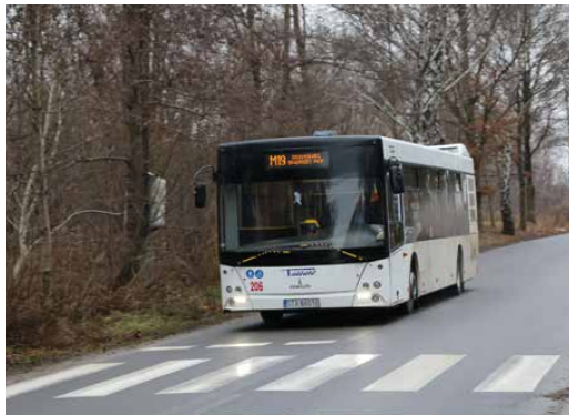
Nowa linia M19 już na drogach

nikacyjnych co 30 min, poza szczytem i w dni wolne co 60 min. M19 zapewnia bezpośredni dojazd z Sosnowca, Będzina, Psar i Mierzęcic do Portu Lotniczego w Pyrzowicach, a także do terminala Cargo Portu Lotniczego w Pyrzowicach w godzinach zmian pracowniczych.