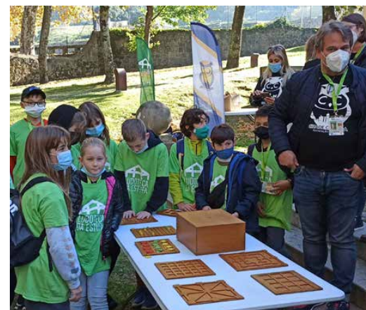
Uczestnicy doskonalili swoje umiejętności matematyczne

Wędrując uroczymi i krętymi uliczkami Porto, podziwiali zabytki i miejsca ozdobione przepięknymi, charakterystycznymi dla Portugalii ceramicznymi płytkami, monumentalny dwukondygnacyjny most Ludwika I na rzece Douro, łączący Porto z miastem Vila