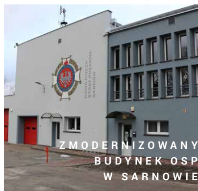
ZMODERNIZOWANY BUDYNEK OSP W SARNOWIE