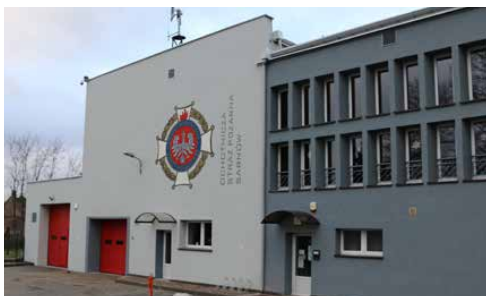
BUDYNEK OSP I OK W SARNOWIE ZMODERNIZOWANY