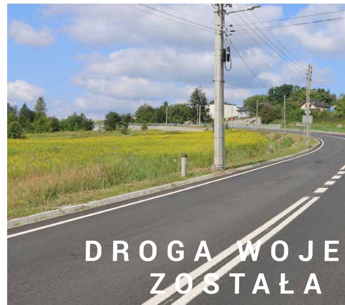
DROGA WOJE ZOSTAŁA