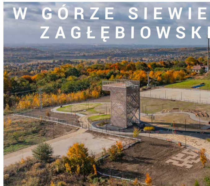
W GÓRZE SIEWIE ZAGŁĘBIOWSKIM