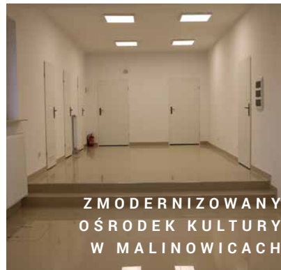
ZMODERNIZOWANY OŚRODEK KULTURY W MALINOWICACH