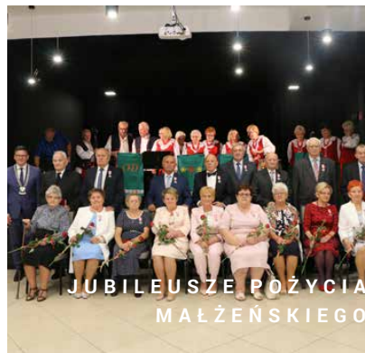
JUBILEUSZE POZYCIA MAŁŻEŃSKIEGO