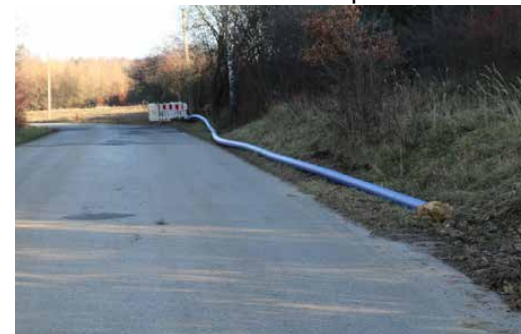
Kontynuowana będzie budowa i przebudowa sieci wodociągowej

W 2022 roku zakończy się budowa sali gimnastycznej z parkingiem przy Szkole Podstawowej w Gródkowie za 2,9 mln zł. Psarski samorząd planuje także częściowy remont wewnętrzny w szkole w Dąbiu, który obejmie m.in. przebudowę systemu kanalizacji oraz montaż klimatyzacji w przedszkolu w Gródkowie. W budżecie zaplanowa-