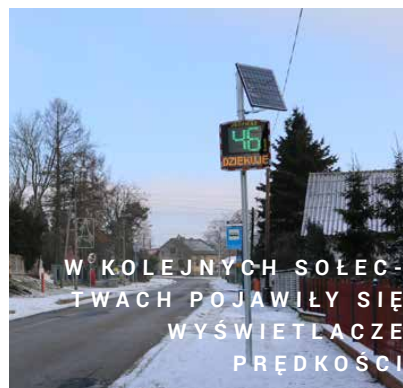
W KOLEJNYCH SOŁEC- TWACH POJAWIŁY SIĘ WYŚWIETLACZE PRĘDKOŚCI