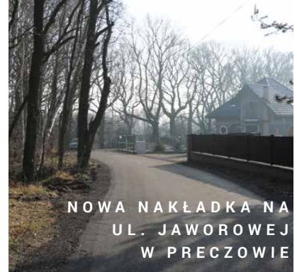
NOWA NAKŁADKA NA UL. JAWOROWEJ W PRECZOWIE