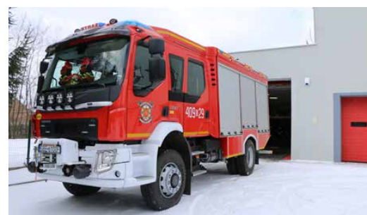
Dzięki przebudowie garażu, mógł w nim stanąć nowy wóz ratowniczo-gaśniczy

Ważnym elementem przedsięwzięcia była przebudowa garażu, w którym pojawiły się nowe bramy z napędem elektrycznym. Teraz może w nim parkować nowy średni wóz ratowniczo-gaśniczy, który w grudniu trafił do jednostki OSP. Wykonawcą przedsięwzięcia była firma Efekt Sp. z o.o. z siedzibą w Chorzowie, a jego koszt wyniósł 1 039 680,22 zł. Na realizację inwestycji Gmina pozyskała dofinansowanie w ramach Programu Działań na Rzecz Ograniczenia Niskiej Emisji w 2021 roku w kwocie 310 753 zł. Red.