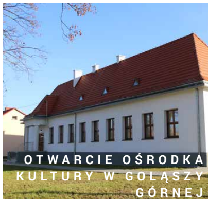
OTWARCIE OŚRODKA KULTURY W GOŁĄSZY GÓRNEJ