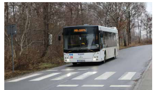
SZYBCIEJ DO BĘDZINA, SOSNOWCA I NA LOTNISKO