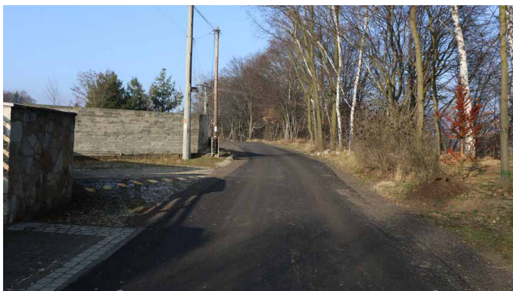
Nowa nakładka asfaltowa na ul. Jaworowej w Preczowie

Wykonawcą zadania była firma ZRB Tyskie Drogi Sp. z o.o. z Tychów, a koszt prac wyniósł 166 848,95 zł. Red.