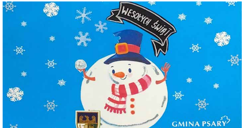
Zwycięska kartka świąteczna 2021

za udział w konkursie i gratulujemy zwycięzcom! Red.