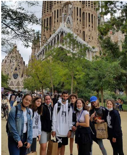
Uczniowie odwiedzili wiele ciekawych miejsc

uczestników projektu. Tworzyli własne skrypty w Scratch. Budowali oraz programowali roboty z kłoców WeDo, tym samym biorąc udział w Europejskim Tygodniu Kodowania Code Week. Wszystkie zajęcia miały charakter praktyczny, a fantastyczna zabawa sprzyja-