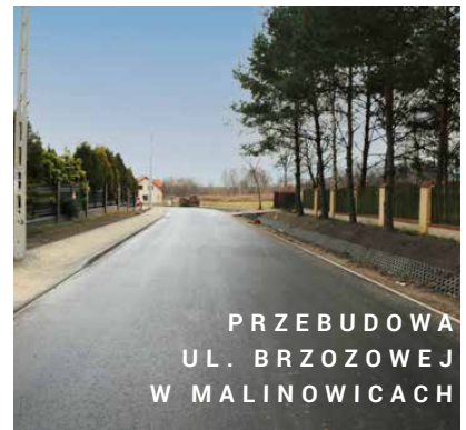
PRZEBUDOWA UL. BRZOSZEJ W MALINOWICACH