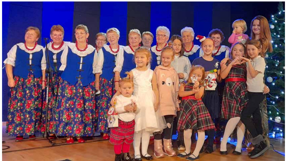
Młode wokalistki wspólnie z zespołem „Stryżowiczanie” wykonały kolędę

otrzymali słodkie upominki od Świętego Mikołaja. GOK