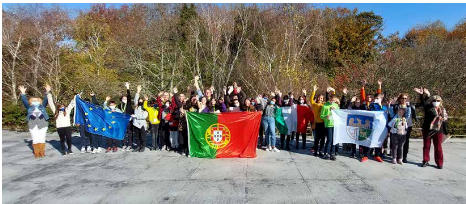
Uczniowie z Sarnowa w listopadzie uczestniczyli w wymianie w Portugalii

Mobilność niewątpliwie zaowocowała nowymi, ciekawymi i cennymi doświadczeniami, nawiązaniem przyjaźni. Uczestnicy wymiany mieli okazję przez pięć dni w pełni uczestniczyć w życiu portugalskiej szkoły. Przebywając z rodzinami uczniów z Portugalii, poznaliśmy ich zwyczaje, kulturę i tradycje, posmakowaliśmy tamtejszej kuchni, doświadczyliśmy ich gościnności i otwartości. ZSP Sarnów