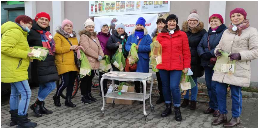
Stowarzyszenie Kobiet 18+ zrealizowało projekt „Zero Waste”

Przeprowadzenie akcji to także pokazanie jak znaczące są nasze konsumenckie działania i wpływ indywidualnych wyborów na otoczenie. Członkinie zapowiedziały kontynuację działań w tym zakresie. SK 18+