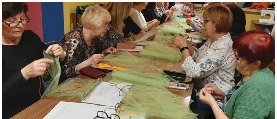
Podczas warsztatów uszyto ponad 200 worków wielokrotnego użytku

popieganiami i podpowiadanie prostych, konkretnych rozwiązań. Tak uczyniły Członkinie SK 18+, realizując projekt „Zero waste-praktycznie w Gminie Psary”. W ramach zadania została przeprowadzona akcja społeczna „Bądź EKO!” w obrębie marketu Karolina, w celu informowania społeczeństwa o idei zero waste poprzez dystrybucję ulotek i eko-długopisów. Ważnym elementem akcji było przekazanie konsumentom 208 sztuk uszytych worków zakupowych wielorazowego użytku,