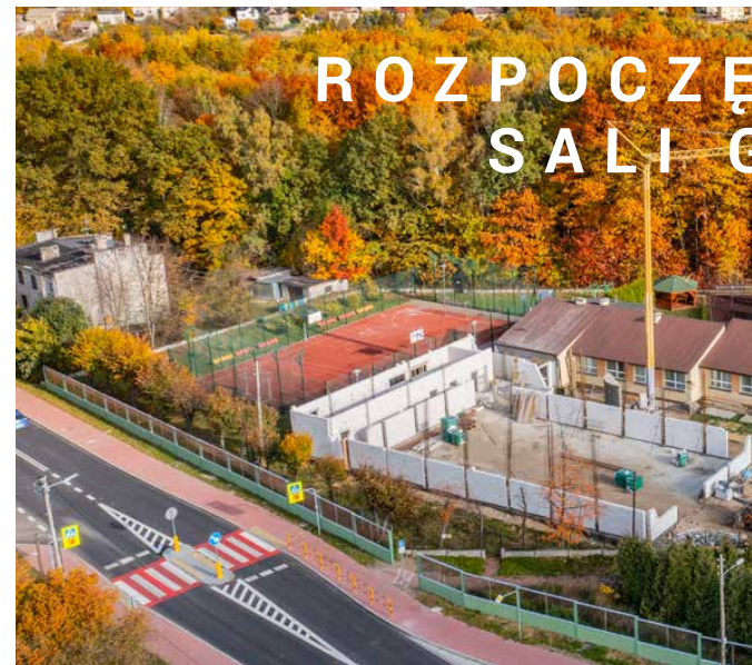
ROZPOCZĘĆ SALI G