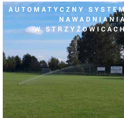
AUTOMATYCZNY SYSTEM NAWADNIANIA W STRYŻOWICACH