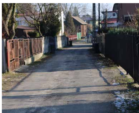
Zaplanowano wykonanie nakładek asfaltowych w Sarnowie

nie brakuje również środków na zadania które służą ochronie środowiska. Mieszkańcy mogą otrzymać dotacje celowe z budżetu Psar na wymianę starego pieca oraz usunięcie i unieszkodliwienie wyrobów zawierających azbest. Ponadto Gmina kontynuuje realizację programu Słoneczna Gmina Psary – Odnawialne Źródła Energii poprawą jakości środowiska naturalnego na terenie gmin partnerskich, w ramach którego u mieszkańców biorących udział w projekcie montowane są instalacje fotowoltaiczne, kolektory słoneczne i pompy ciepła. Przeprowadzona zostanie także termomodernizacja budynku byłej szkoły w Górze Siewierskiej za około 1,2 mln zł.