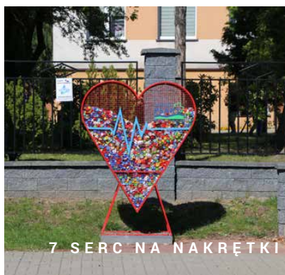
7 SERC NA NAKRĘTKI