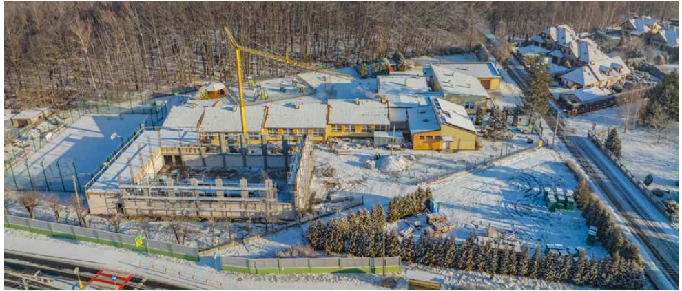
W 2022 r. zakończy się budowa sali gimnastycznej przy szkole w Gródkowie

Jednym z największych zadań, które rozpocznie się w bieżącym roku jest budowa Centrum Przesiadkowego przy Urzędzie Gminy Psary. Koszt tego przedsięwzięcia szacowany jest na około 4,3 mln zł z czego 2,2 mln zł zabezpieczono w tegorocznym budżecie. Ponadto w planie finansowym na rok 2022 jest wykonanie nakładek asfaltowych na drodze w Dąbiu Chrobakowym i gminnych drogach w Sarnowie, zlokalizowanych pomiędzy ulicami Wiejską i Zieloną oraz Browarną i Główną. Psarski samorząd zamierza również zmodernizować ul. Krótką w Malinowicach i wykonać odwodnienie ul. Leśnej w Sarnowie. W budżecie zaplanowano 500 tys. zł na wykonanie projektu i budowę drogi na cmentarz w Preczowie. Dodatkowo, 280 tys. zł zabezpieczono na wymianę wszystkich drogowisk i tabliczek z nazwami ulic oraz opracowanie koncepcji budowy ścieżek i szlaków rowerowych na terenie gminy Psary. W planach jest także opracowanie aż 12 projektów technicznych budowy i przebudowy infrastruktury drogowej w: Gródkowie, Malinowicach, Preczowie, Psarach,