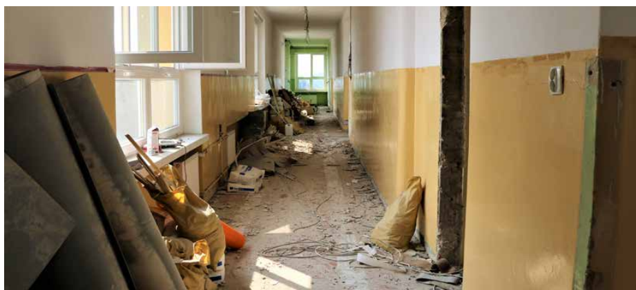
Remont obejmuje pierwsze i drugie piętro szkoły

z umową prace zostaną zakończone 24 sierpnia. Red.