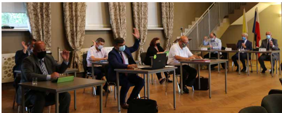
Radni podjęli uchwałę o udzieleniu wójtowi absolutorium