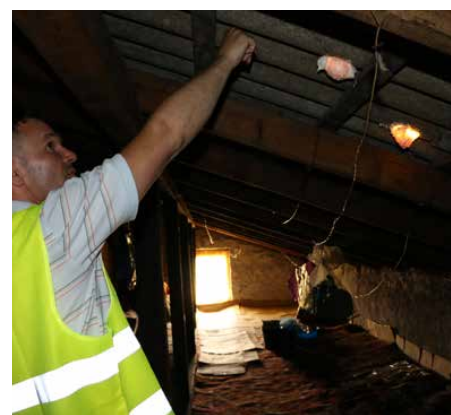
Komisja cały czas szacuje straty

w wyniku nawałnicy i spisują protokoły, niezbędne do wypłaty odszkodowań. Zgłoszeń było tak wiele, że na czas weekendu uruchomiony został specjalny numer telefonu, pod którym mieszkańcy mogli zgłaszać zarówno potrzebę zabezpieczenia uszkodzonego dachu w swoim domu, jak również powstałe szkody, które wymagają sza-