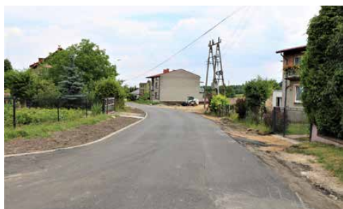
PRACE NA UL. KRÓTKIEJ W SARNOWIE DOBIEGŁY KOŃCA