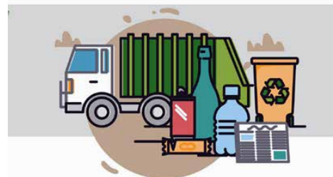
NOWE STAWKI ZA ŚMIECI - DODATEK SPECJALNY