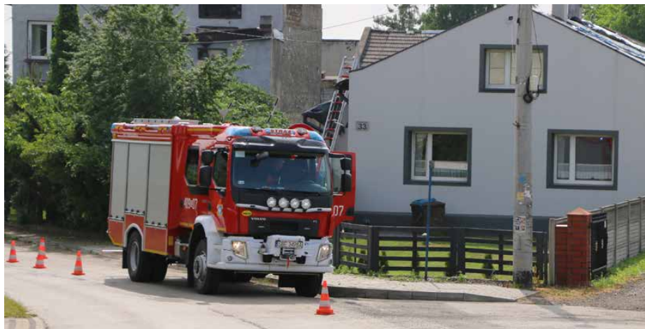
Uszkodzone dachy zabezpieczali strażacy

Skala zniszczeń była tak duża, że Gmina wynajęła na swój koszt 2 zwyzki z obsługą, które wraz z pracownikami Zakładu Gospodarki Komunalnej w Psarach wspomagały pracę strażaków i również zabezpieczały plandekami uszkodzone dachy w budynkach mieszkalnych. Natomiast osoby, które chciały na własną rękę zabezpieczyć