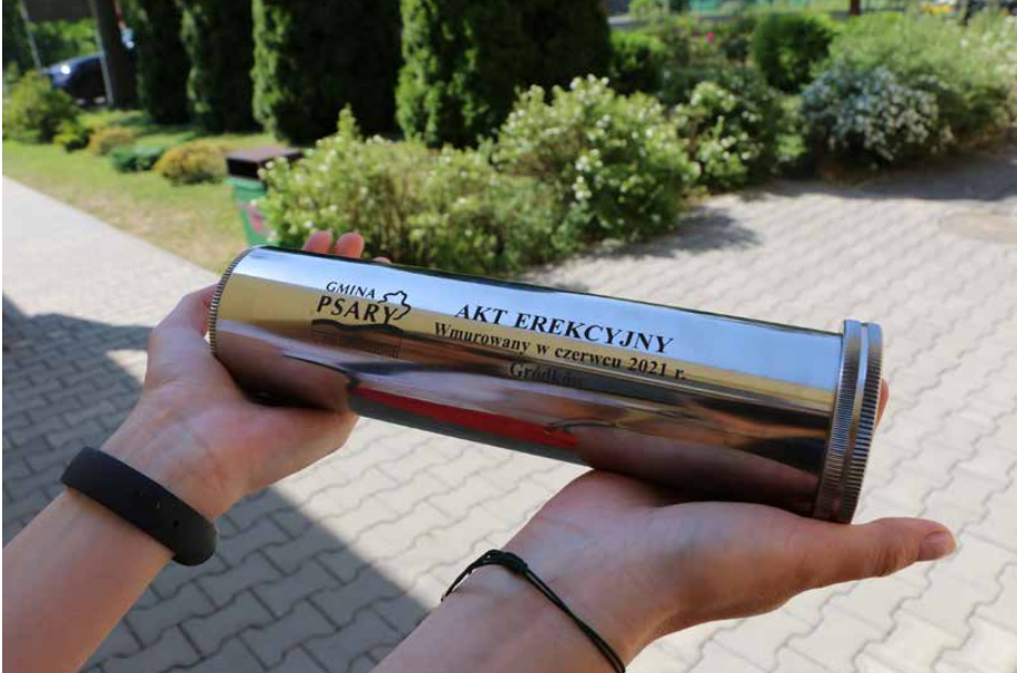
21 czerwca został wmurowany akt erekcyjny w fundamenty budynku

DZIEJE SIĘ W GRÓDKOWIE – BUDOWA NOWEJ SALI GIMNASTYCZNEJ PRZY SZKOLE PODSTAWOWEJ RUSZYŁA PEŁNĄ PARĄ, A 21 CZERWCA ZOSTAŁ WMUROWANY W FUNDAMENTY BUDYNKU KAMIEŃ WĘGIELNY WRAZ Z AKTEM EREKCYJNYM.