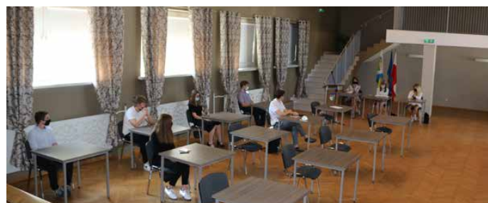
W czerwcu odbyła się sesja Młodzieżowej Rady Gminy Psary