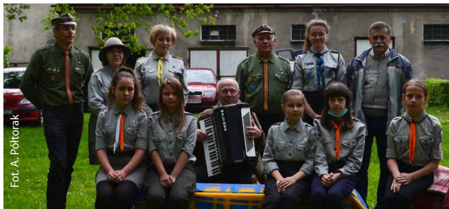
Fot. A. Półtorak