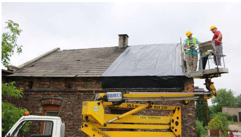
Gmina wynajęła 2 zwyzki z obsługą, które wspomagały pracę strażaków

cowania. Łącznie odnotowano ponad 400 zgłoszeń.