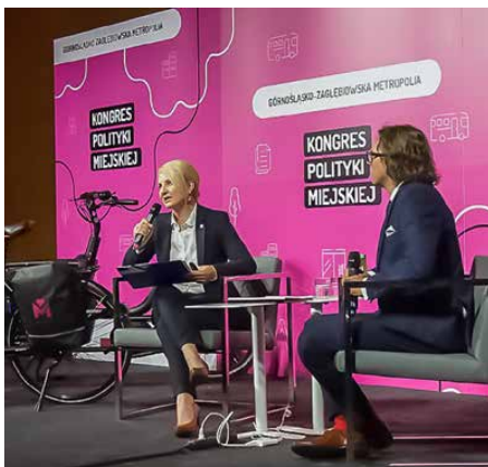
Kongres Polityki Miejskiej odbył się w Katowicach

W spotkaniu, które częściowo odbywało się on-line, łącznie wzięło udział 180 ekspertów, specjalistów, samorządowców oraz działaczy zajmujących się planowaniem przestrzeni miejskiej. W drugim dniu kongresu, który odbył się w formule wirtualnej, ze studium nagraniowym w Katowicach, prowadzona była dyskusja na temat tego, czy jest nadzieja na poprawę jakości powietrza, którym oddychamy. Wójt