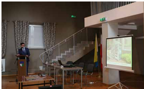
WÓJT OTRZYMAŁ JEDNOGŁOŚNE ABSOLUTORIUM I WOTUM ZAUFANIA