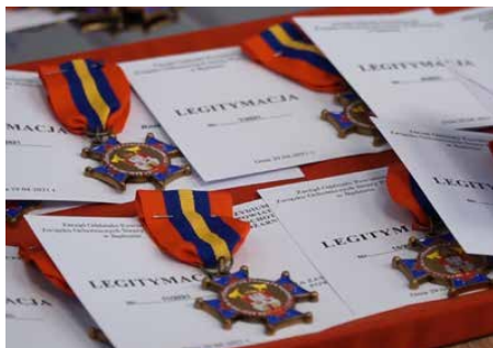
Strażakom przyznano odznaki „Zasłużony dla Pożarnictwa Powiatu Będzińskiego”

28 MAJA, W REMIZIE OSP W WOJKOWICACH KOŚCIELNYCH, WRĘCZONO STRAŻAKOM Z OCHOTNICZYCH STRAŻY POŻARNYCH ODZNAKI ZA ZASŁUGI DLA POŻARNICTWA POWIATU BĘDZIŃSKIEGO. NATOMIAST 31 MAJA W KP PSP W BĘDZINIE ODBYŁ SIĘ UROCZYSTY APEŁ, PODCZAS KTÓREGO BĘDZIŃSCY STRAŻACY UCZCILI SWOJE ŚWIĘTO.