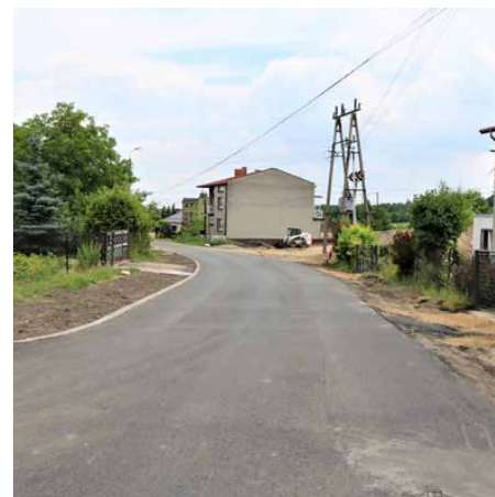
Na ul. Krótkiej powstała kanalizacja deszczowa

Koszt inwestycji to 558 051,37 zł, a wykonawcą przedsięwzięcia jest firma INFRAX Sp. z o.o. z Bojszowy. Red.