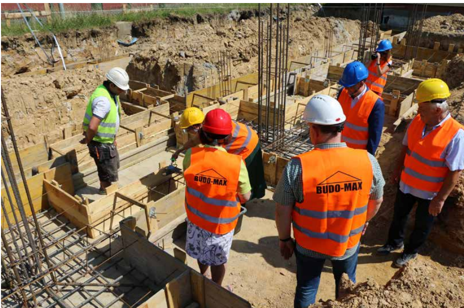
Nowa sala gimnastyczna będzie miała ponad 430 m 2 powierzchni

z chudego betonu pod stopy i łąwy fundamentowe, zbrojenie stóp i łąw fundamentowych oraz betonowanie.