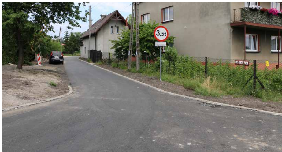
Na jezdni pojawiła się nowa nawierzchnia z warstwami podbudowy

MODERNIZACJA NA UL. KRÓTKIEJ W SARNOWIE DOBIEGA KOŃCA. W RAMACH IWESTYCJI POWSTAJE ODCINEK CAŁKOWICIE NOWEJ DROGI WRAZ Z ODWODNIENIEM. W PLANACH JEST RÓWNIŻ POŁOŻENIE NOWYCH NAKŁADEK ASFALTOWYCH NA SĄSIADUJĄCYCH DROGACH, POMIĘDZY ULICAMI ZIELONĄ A WIEJSKĄ.