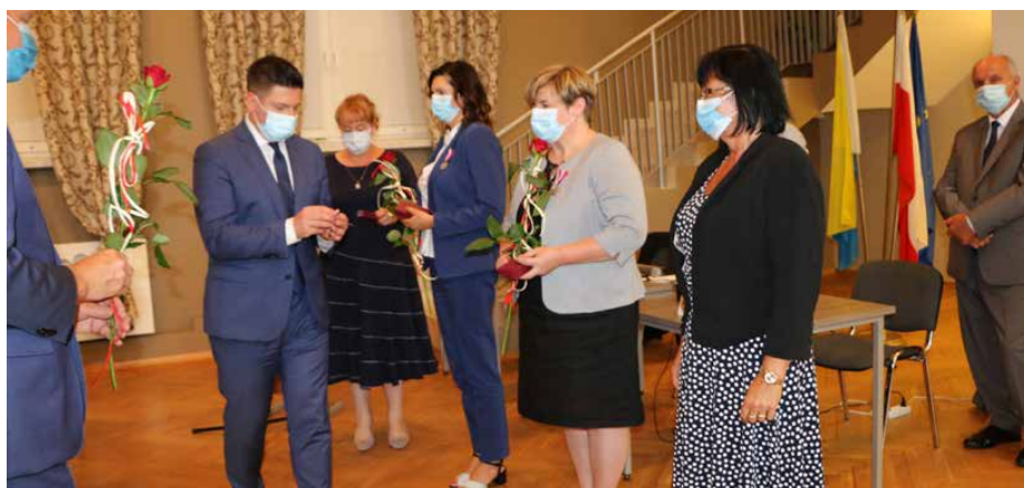
Pracownicy Urzędu otrzymali Medale za Długoletnią Służbę

Wspomniane medale stanowią nagrodę za wzorowe i wyjątkowo sumienne wykonywanie obowiązków służbowych wynikających z pracy zawodowej w służbie państwa polskiego. W zależności od przepracowanych lat nadawane są złote, srebrne i brązowe medale. Red.