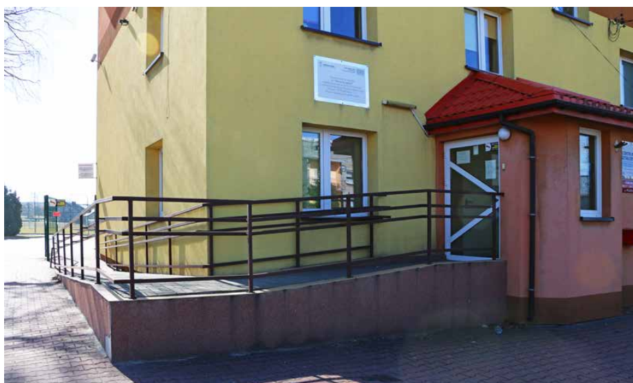
Do budynku prowadzi specjalny podjazd dla wózków inwalidzkich