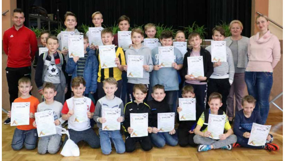
Skrzaty rozegrały swój pierwszy towarzyski mecz

Najmłodszym zawodnikom gratulujemy wspaniałego debiutu i życzymy kolejnych sukcesów! GOK