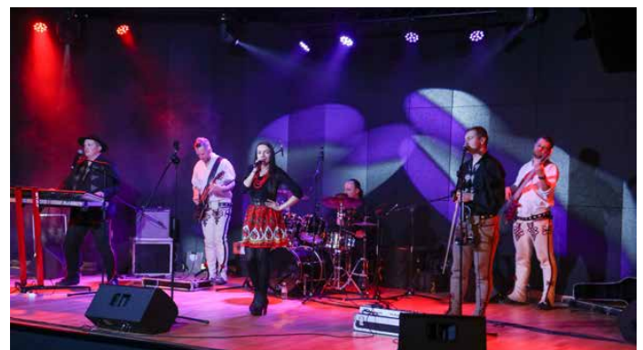
Kapela góralska „Zbóje” wystąpiła w Strzyżowicach

Muzycy zaprezentowali na scenie folklor góralski na najwyższym poziomie, a klimat, który wyczarowali na sali przeniósł zgromadzoną publiczność pod same Tatry. Artyści zagraли takie hity jak: „Szalała szalała”, „Życie to tylko chwila”, „Gdybyś była inna”, „Ostatnia noc w Zakopanem” czy „Wysokie płoty”. GOK