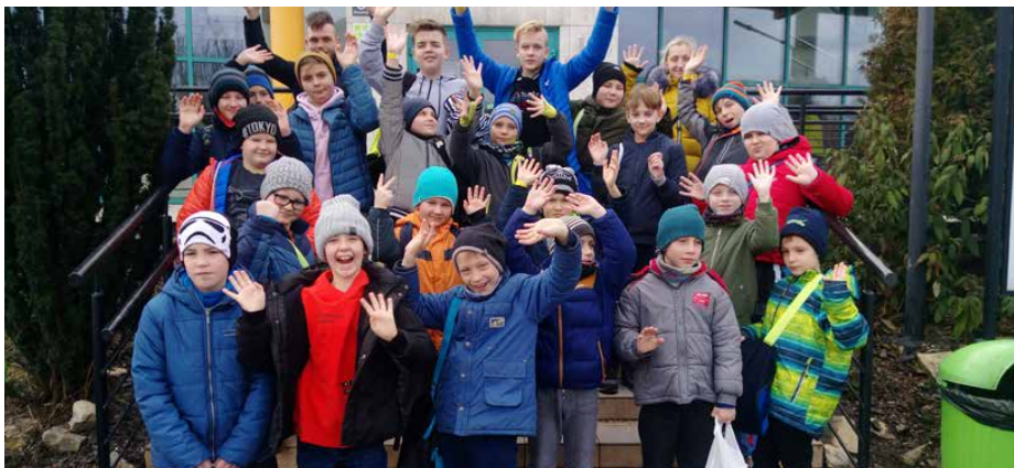
Organizatorzy zadbali o dobrą zabawę i wiele atrakcji