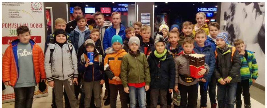
Młodzi piłkarze obejrzeli w kinie „Jak wytresować smoka 3”

Na koniec każdy otrzymał pamiątkowy dyplom. Młodzi piłkarze rozstali się z uśmiechami na twarzach, by zaraz po feriach rozpocząć treningi i przygotowania do wiosennej rundy ligowej. GOK