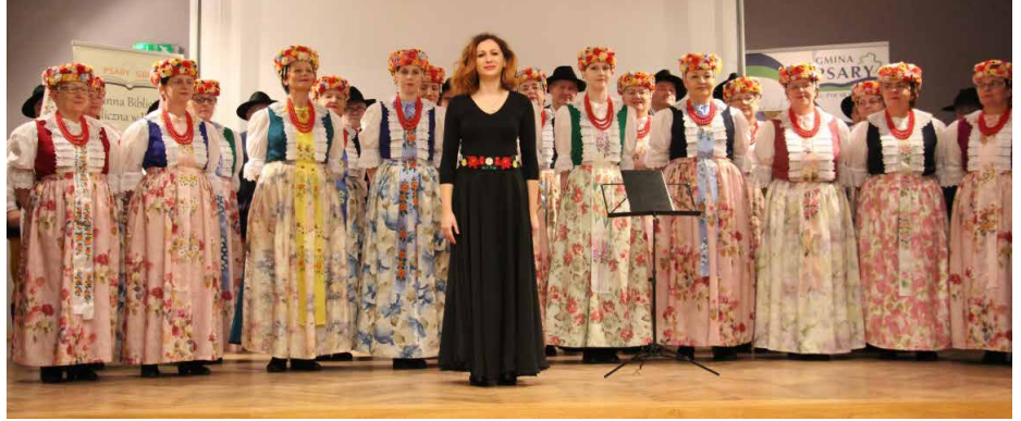
Koncert chóru „Halka” w Psarach

m.in. Grand Prix na Ogólnopolskim Festiwalu „O Kaganek Gwarków” i wyróżnienie „Brazowy Dyplom” na Międzynarodowym Festiwalu Chóralnym w Krakowie. GBP