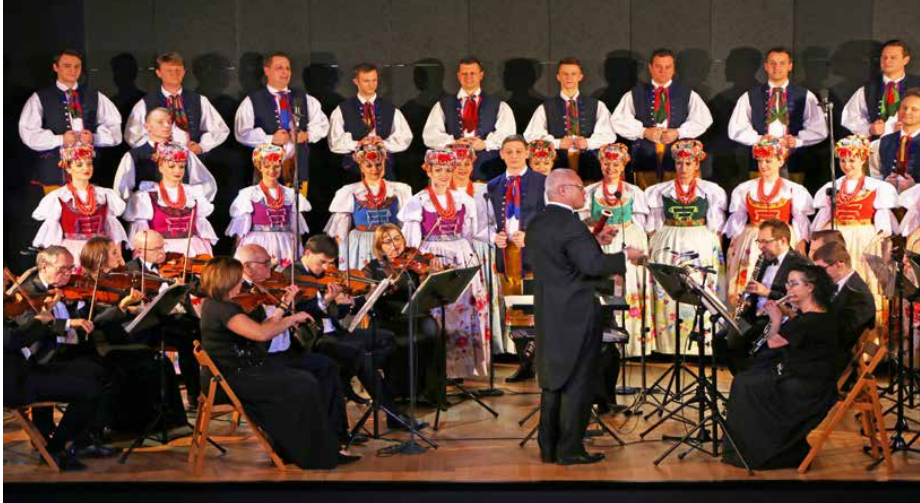
Na scenie wystąpił Zespół Pieśni i Tańca „Śląsk”

25 STYCZNIA ODBYŁO SIĘ UROCZYSTE OTWARCIE CENTRUM USŁUG SPOŁECZNYCH W STRYŻOWICACH. IMPREZĘ UŚWIETNIŁ KONCERT ZESPOŁU PIEŚNI I TAŃCA „ŚLĄSK”.