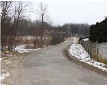
Na odcinku remontowanej drogi pojawi się nowa nawierzchnia

ODCINEK GMINNEJ DROGI NA BRZĘKOWICE WAŁ ZOSTANIE PRZEBUDOWANY. W RAMACH INWESTYCJI POJAWI SIĘ NOWA NAWIERZCHNIA JEZDNI, ZOSTANIE PRZEBUDOWANA KANALIZACJA DESZCZOWA ORAZ POWSTANIE CHODNIK I OŚWIETLENIE.