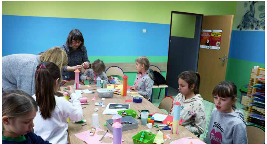
Na zajęciach dzieci rozwijały swoje plastyczne talenty

Na najmłodszych czekały zajęcia plastyczno-manualne, które cieszyły się dużym powodzeniem. Swoje plastyczne talenty dzieci rozwijały podczas zajęć malowania gąbką,