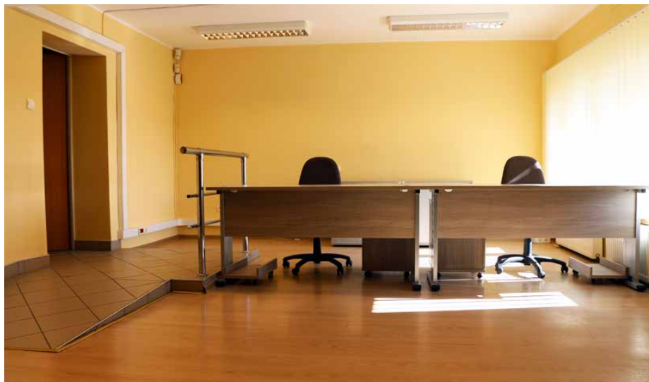
Pomieszczenie zostało już dostosowane na potrzeby Urzędu Stanu Cywilnego

Z POCZĄTKIEM 2019 ROKU W GMINIE PSARY RUSZYŁY PEŁNĄ PARĄ NOWE INWESTYCJE. JEDNA Z NICH DOTYCZY PRZENIESIENIA URZĘDU STANU CYWILNEGO DO BUDYNKU OŚRODKA POMOCY SPOŁECZNEJ W PSARACH. DZIĘKI TEMU PRZEDSIĘWZIĘCIU ZNACZNIE POPRAWI SIĘ KOMFORT OBSŁUGIWANYCH W NIM MIESZKAŃCÓW.