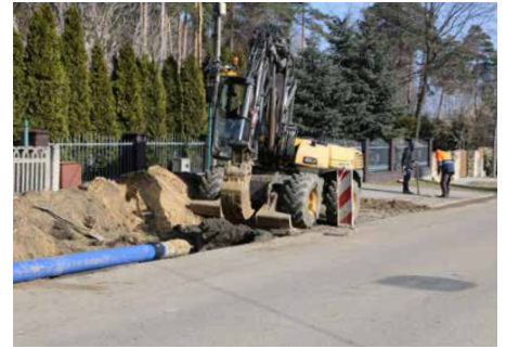
Prace w Brzękowicach Dolnych

Dodatkowo Zakład Gospodarki Komunalnej w Psarach własnymi siłami wymienia wodociąg na ul. Górnej w Gródkowie oraz buduje nowe sieci na osiedlach Malinowice II i Czerwony Kamień w Górze Siewierskiej. Red.