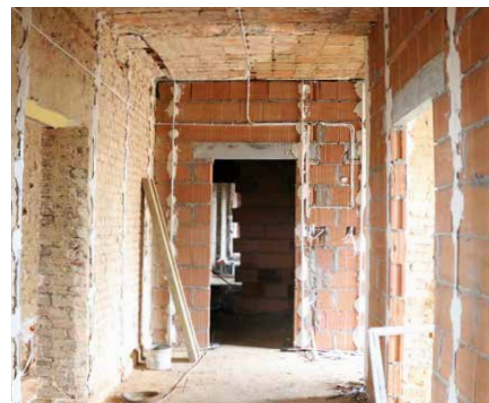
Wmurowano już ścianki działowe

Budynek, który przez wiele lat stał niewykorzystany, przejdzie nie tylko generalny remont i przebudowę, ale także termomodernizację. Wszystko dzięki pozyskanym przez psarski samorząd dofinansowaniom,