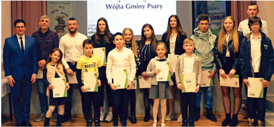
Laureaci Stypendiów Sportowych Wójta Gminy Psary

25 LUTEGO W SALI BANKIETOWEJ W PSARACH ODBYŁA SIĘ UROCZYSTOŚĆ WRĘCZENIA STYPENDIÓW SPORTOWYCH WÓJTA GMINY PSARY. LAUREATAMI ZOSTALI MIESZKAŃCY, KTÓRZY W 2018 ROKU WYKAZALI SIĘ NAJWIĘKSZYMI OSIĄGNIĘCIAMI W TEJ DZIEDZINIE.