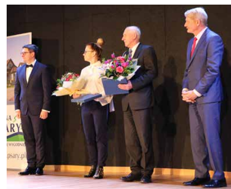
Przedsiębiorcy otrzymali podziękowania za udzieloną pomoc i wsparcie