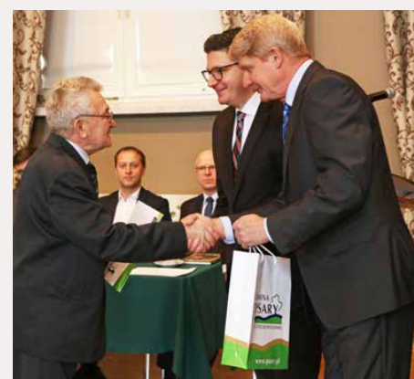
4-letnia kadencja sołtysów i rad sołeckich dobiegła końca

li nie tylko na rzecz swoich sołectw, ale całej gminy Psary. Życzymy zdrowia, wszelkiej pomyślności oraz siły i chęci do dalszej działalności! Red.