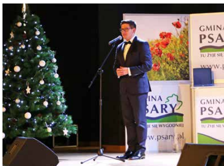
Wójt podsumował działalność psarskiego samorządu w 2018 roku