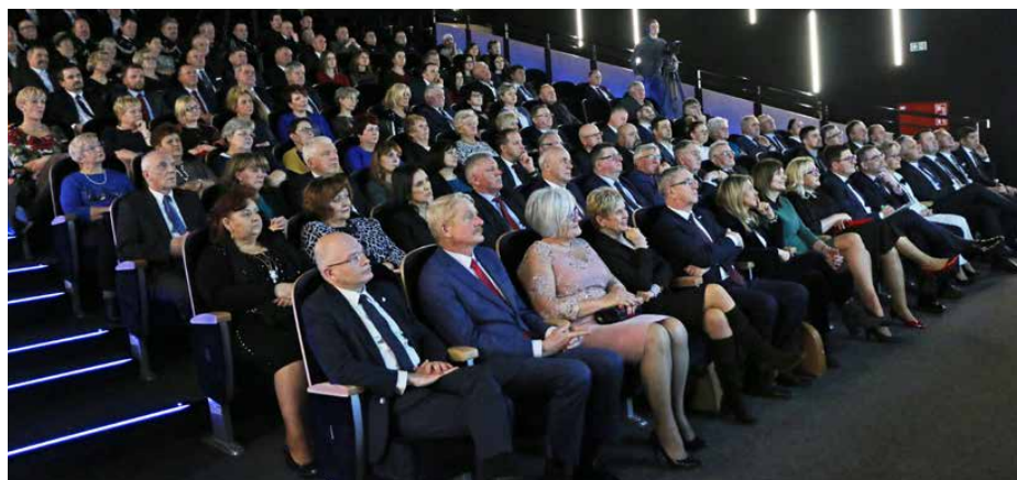
Spotkanie noworoczne odbyło się w Centrum Usług Społecznych w Strzyżowicach