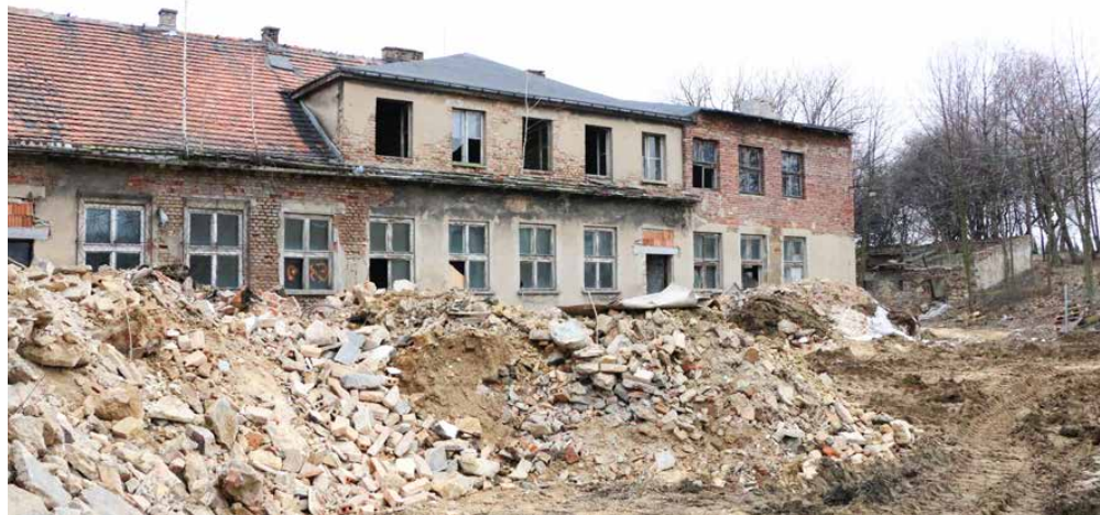
Budynek zostanie kompleksowo wyremontowany wewnątrz i na zewnątrz

Wykonawcą inwestycji jest firma ROMEX Budownictwo Sp. z o.o. Sp. k. z siedzibą w Zrębicach, a prace zgodnie z umową potrwają do czerwca 2020 roku. Wartość przedsięwzięcia sięga 2 417 020,88 zł, z czego aż 1 601 402,20 zł stanowią pozyskane dotacje. Red.