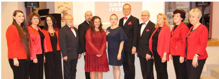
Chór ITERUM zagrał w Psarach koncert o tematyce miłosnej

W CUDOWNĄ PODRÓŻ PO KRAJNIE MIŁOŚCI ZABRAŁ, WSZYSTKICH ZGROMADZONYCH W SALI BANKIETOWEJ PRZY BIBLIOTECY W PSARACH, BĘDZIŃSKI CHÓR ITERUM. KONCERT PT. „ZAKOCHANI SĄ WŚRÓD NAS” ODBYŁ SIĘ 20 LUTEGO.