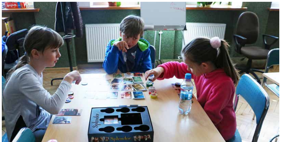
Gra Splendor okazała się zwycięzcą wśród planszówek

li pamięć, koncentrację i strategiczne myślenie. Niekwestionowanymi zwycięzcami wśród planszówkowych hitów okazały się gry Splendor i Dixit. W tym roku ofertę zajęć wzbogacił