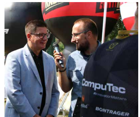
Gmina Psary już po raz piąty była gospodarzem imprezy

tego dnia sprzyjała rodzinnemu piknikowi. Na imprezie pojawiła się nie tylko rekordowa liczba zawodników, ale również wielu kibiców. Red.