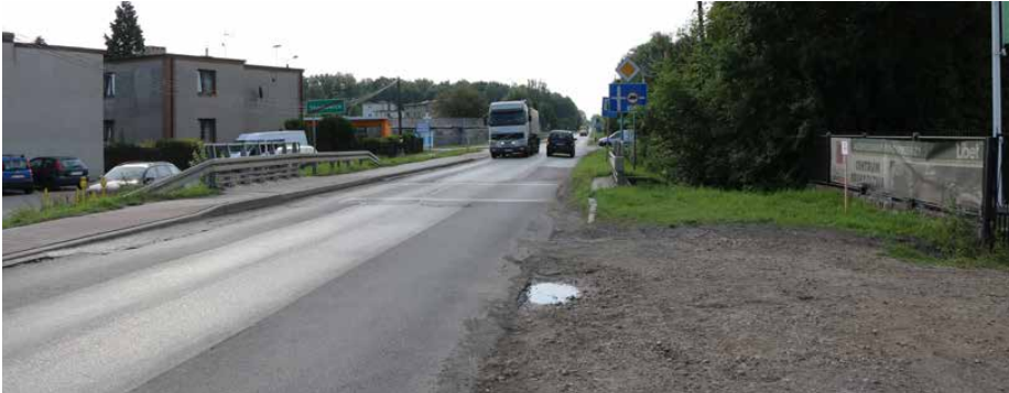
Wkrótce ruszy kompleksowa przebudowa DW 913

JUŻ NIEBAWEM RUSZA WYCZEKIWANA OD WIELU LAT INWESTYCJA. 14 SIERPNIĄ W SIEDZIBIE ZARZĄDU DRÓG WOJEWÓDZKICH W KATOWICACH ZOSTAŁA PODPISANA UMOWA NA KOMPLEKSOWĄ PRZEBUDOWĘ DROGI WOJEWÓDZKIEJ NR 913.