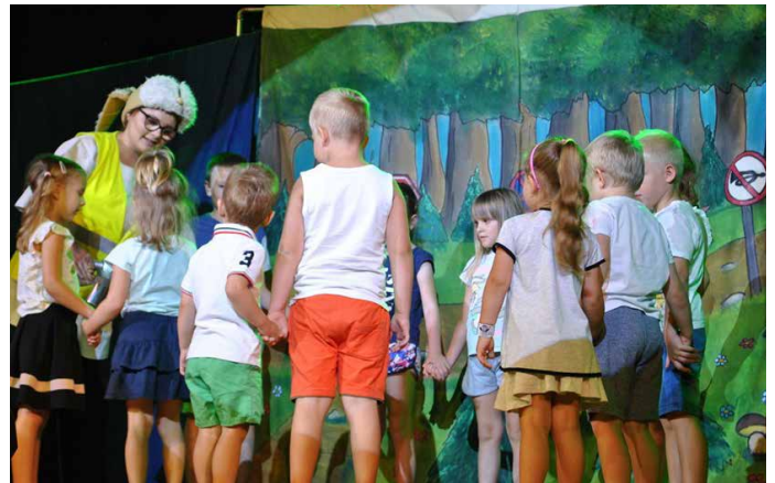
Spektakl teatralny „Wilk i Zając” w Strzyżowicach

Dzięki barwnej scenografii, kolorowym strojom i świetnej grze aktorskiej przedstawienie na długo pozostanie w pamięci zgromadzonych w Strzyżowicach widzów. Red.