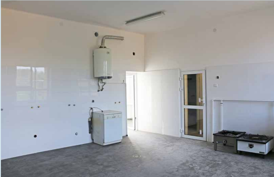
Wyremontowana kuchnia z zapleczem w stryżówickiej placówce

między innymi okapy, zamontowano klimatyzator i taborety gazowe. Pomieszczenia zyskały również nowe okładziny ścienne i podłogowe oraz