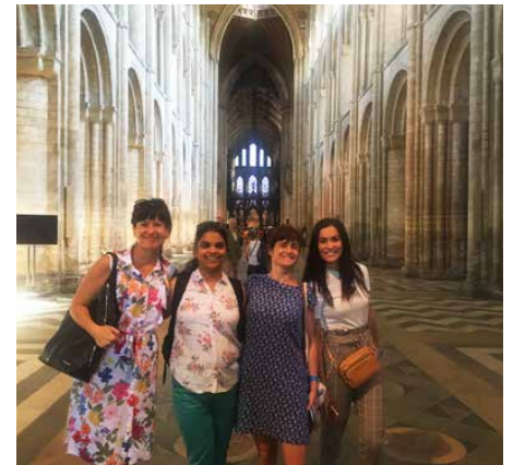
Zwiedzanie katedry w Ely podczas kursu w Cambridge z nauczycielkami z Francji, Indii i Hiszpanii

asystentami w każdej klasie, specjalnie zatrudnionymi osobami dyżurującymi, dobrze przemyślanymi, nieprzeładowanymi podstawami programowymi. Jeśli chodzi o proces dydaktyczny uważam, że zawsze można nauczyć się czegoś cennego od siebie nawzajem. W szkole w Psarach zaczęliśmy wdrażać pracę