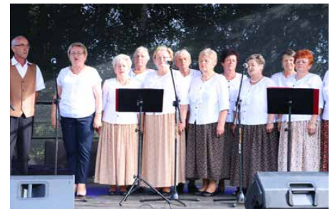
Na scenie wystąpił zespół śpiewaczy „Dąbie”

GOK składa serdeczne podziękowania druhom strażakom z OSP Dąbie za ogromne zaangażowanie oraz pomoc w organizacji tegorocznego festynu. GOK