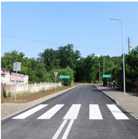
Przebudowa objęła blisko 300 m fragment gminnej drogi

Na blisko 300 m odcinku jezdni wyremontowano całą konstrukcję drogi o nawierzchni bitumicznej. Przebudowano także zjazdy na posesje prywatne, wybudowano chodnik o szerokości 2 m, poszerzono jezdnię na łuku i wykonano mijanki. Dodatkowo przy-