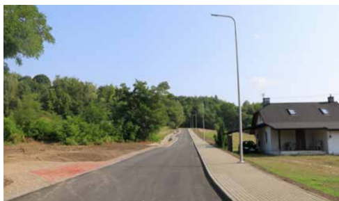
ZAKOŃCZONO PRZEBUDOWĘ ODCINKA DRUGI BRZĘKOWICE WAŁ