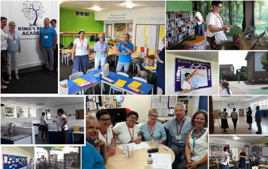
Nauczyciele ze szkoły w Psarach na kursie w Wielkiej Brytanii

W Szkole Podstawowej w Dąbiu realizowano projekt „Szkoła wiejska w Eu-