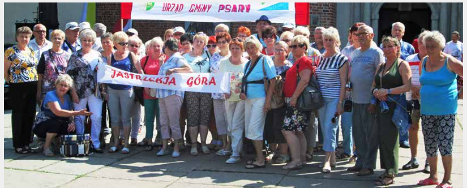
Seniorzy z Psar wybrali się nad polskie morze

Kierownik ośrodka wczasowego, w którym wypoczywali nie tylko psarscy seniorzy, ale także z Częstochowy i Cieszyna, zorganizował dla nich wieczorek zapoznawczy. Parkiet pełny był wirujących par, które doskonale bawiły się w rytm granych na żywo przebojów