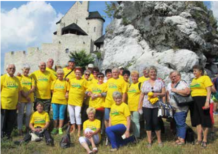
Psarscy emeryci na Jurze Krakowsko-Częstochowskiej

SENIORZY Z PSARY WYBRALI SIĘ 20 LIPCA NA KOLEJNĄ WYCIECZKĘ. TYM RAZEM GRUPA UDAŁA SIĘ NA JURĘ KRAKOWSKO-CZĘSTOCHOWSKĄ, GDZIE ZWIEDZIŁA ZAMKI W BOBOLICACH, OLSZTYNIE I MIROWIE.