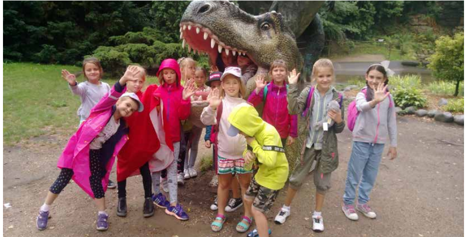
Uczestnicy II turnusu półkolonii odwiedzili Zoo w Chorzowie

oraz ubezpieczenie. W tym roku tematyka turnusów była bardzo różnorodna. Turnus pierwszy i drugi przebiegały pod nazwą „Wakacyjny misz masz”. Dzieci brały udział w zajęciach plastycznych, ruchowych oraz grach i zabawach integracyjnych. Wspólnie stworzyły mapkę gminy Psary oraz muzyczne eko-instrumenty. Trzeci turnus upłynął pod znakiem „Zagrożonych gatunków zwierząt”. Podczas zajęć dzieci tworzyły m. in. mapy kontynentów oraz pozna-