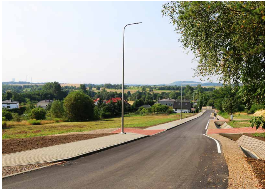
Na wyremontowanym odcinku drogi pojawiło się m.in. oświetlenie uliczne i chodnik

drożne rowy zostały częściowo odtworzone, a częściowo wykonano krytą kanalizację deszczową, której ujściem jest otwarty rów przy ul. Pocztowej. Na remontowanym odcinku powstało oświetlenie uliczne. Zamontowano na nim 8 słupów z wysięgnikami oraz oprawami oświetleniowymi ze światłem LED.