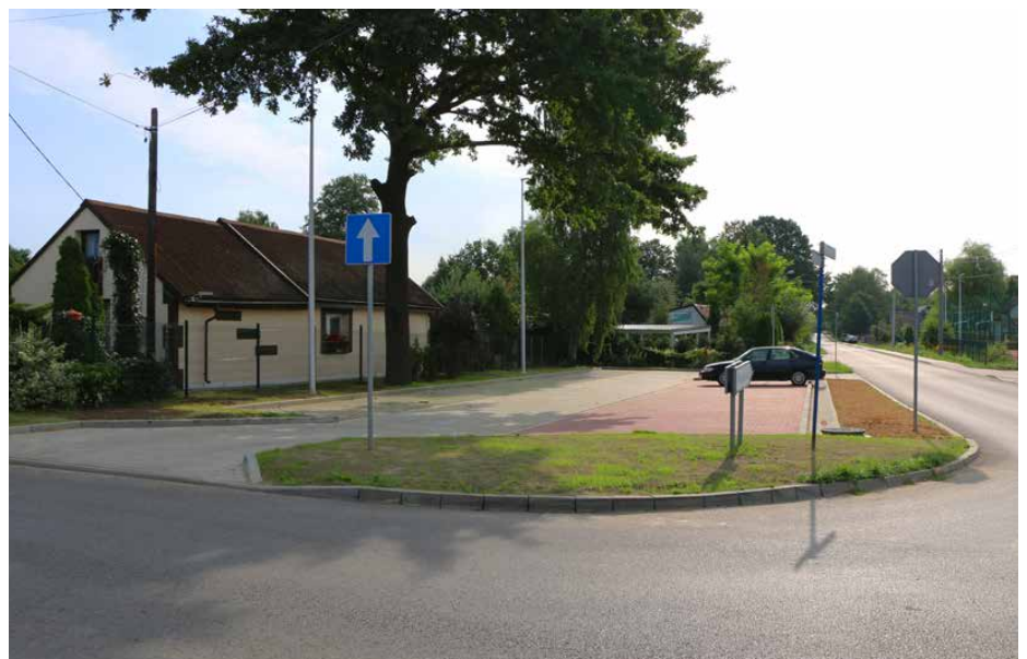
Pod koniec sierpnia zakończono budowę miejsc postojowych

jewództwa śląskiego za pośrednictwem gmin. Red.