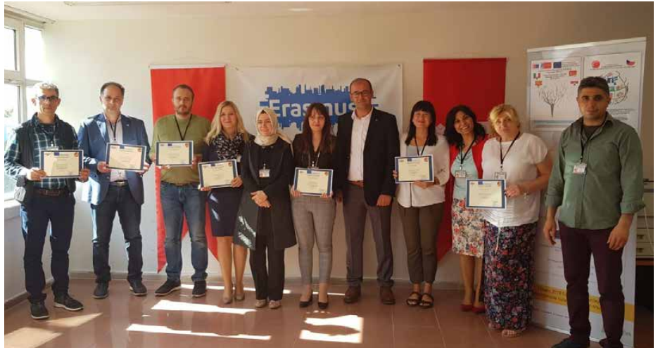
Wręczenie certyfikatów podczas międzynarodowego spotkania projektowego w Malaty

W wymianach uczestniczą nie tylko nauczyciele, ale także uczniowie. Chętnie biorą udział w mobilnościach? Jakie są ich wrażenia? Nie