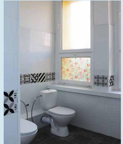
W szkole powstały nowe łazienki

instalacje elektryczne i wodno-kanalizacyjne.