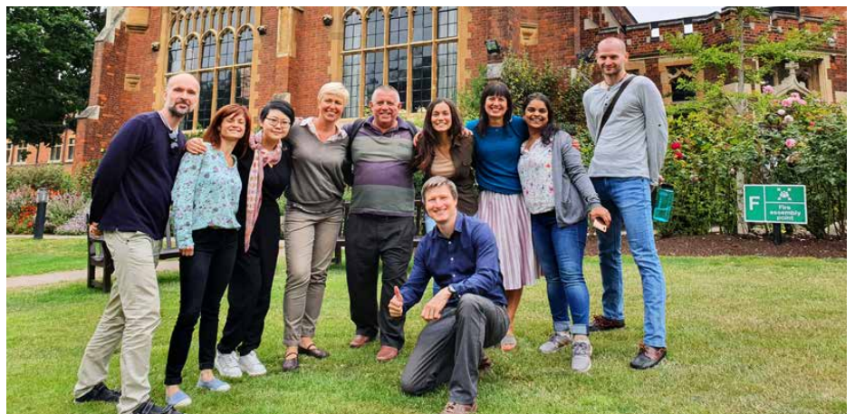
Zagraniczne szkolenia pozwalają nie tylko zdobywać cenne umiejętności, ale także poznawać ciekawych ludzi

metodą projektu oraz nauczanie zintegrowane CLIL – język angielski na lekcjach plastyki. Dużo zmian nastąpiło też w szkole w Dąbiu. Po wizycie w fińskiej szkole, uczniowie wychodzą na przerwach na dwór, jeden dzień w tygodniu chodzą po szkole w skarpetkach, a na korytarzach zostały ustawione regały z książkami, stoliki z grami zręcznościowymi, puzzlami i kolorowanymi. Jestem pewna, że po wakacjach, obfitujących w zagraniczne mobilności kadry,