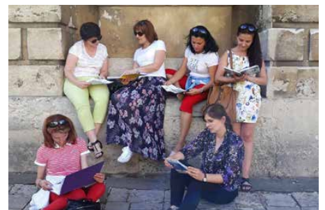
9 nauczycieli ze szkoły w Dąbiu wzięło udział w zagranicznych szkoleniach

Nadchodzący rok szkolny będzie czasem wdrażania nabytych podczas mobilności doświadczeń i umiejętności. Pra-