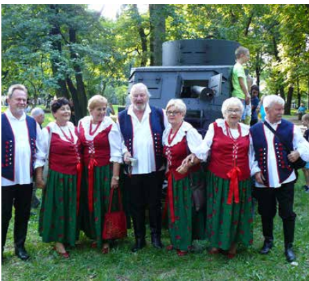
Członkowie zespołu „Od Do”