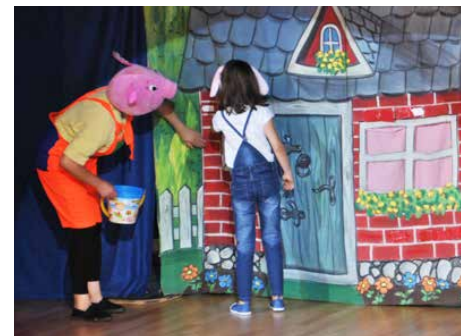
Dzieci obejrzały spektakl o trzech małych świnkach

Dzieci, zaangażowane w poszukiwania wilka i pomoc świnkom, doskonale bawiły się podczas przedstawienia. Dodatkowo spektakl pokazał im, że warto być obowiązkowym, a pracowitość płaca. Red.