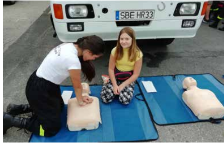
Mieszkańcy sprawdzili swoje umiejętności z zakresu pierwszej pomocy

wspólnej zabawy tanecznej porwał zespół Art Music.