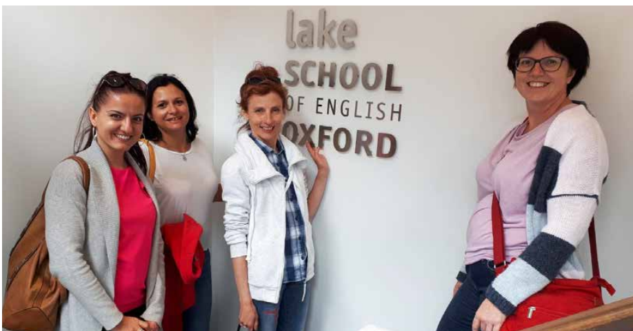
Nauczyciele z Dąbia uczestniczyli w szkoleniu w Oxfordzie

Pracownicy psarskiej szkoły ukończyli szkolenia poprawiające kompetencje językowe Intensive General English, szkolenia metodyczne, pozwalające zrozumieć i opanować specyfikę nauczania młodszych dzieci, kurs Teaching Critical Thinking in the Classroom, który umożli-