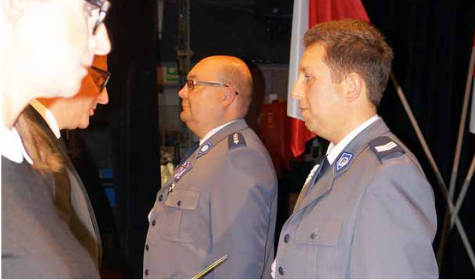
Listy gratulacyjne z rąk wójta otrzymali funkcjonariusze pracujący na terenie gminy Psary

11 LIPCA W TEATRZE DZIECI ZAGŁĘBIA IM. JANA DORMANA ODBYŁY SIĘ UROCZYSTE OBCHODY ŚWIĘTA POLICJI W BĘDZINIE. W TYM ROKU FUNKCJONARIUSZE ŚWIĘTOWALI JUBILEUSZ 100. ROCZNICY POWSTANIA POLICJI PAŃSTWOWEJ.