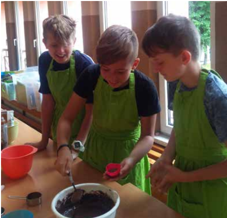
Podczas zajęć kulinarnych powstały słodkie wypieki

Podobnie jak w latach ubiegłych także i w tym roku odbyły się 3 turnusy dla dzieci w wieku 6-11 lat, w których łącznie wzięło udział 42 dzieci. W ramach każdego turnusu uczestnicy mieli zapewnione pełne wyżywienie, opiekę instruktora