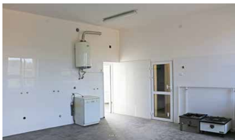
SZKOŁA PODSTAWOWA W STRYŻOWICACH PRZESZŁA REMONT S. 4