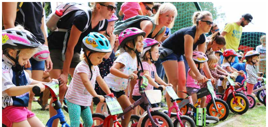
Najmłodszy uczestnicy ścigali się w kategorii KIDO