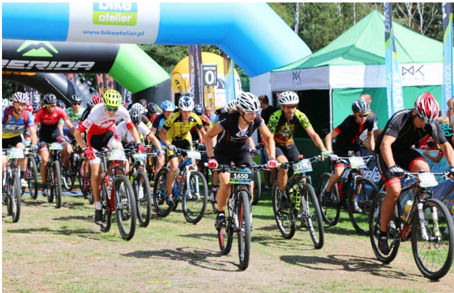
Na starcie stanęło ponad 900 zawodników

18 SIERPNIĄ NA STADIONIE LKS ISKRA PSARY ODBYŁA SIĘ KOLEJNA EDYCJA BIKE ATELIER MTB MARATON. GMINA PSARY BYŁA GOSPODARZEM IMPREZY JUŻ PIĄTY ROK Z RZĘDU. TYM RAZEM NA STARTCIE STANĘŁO PONAD 900 ZAWODNIKÓW!