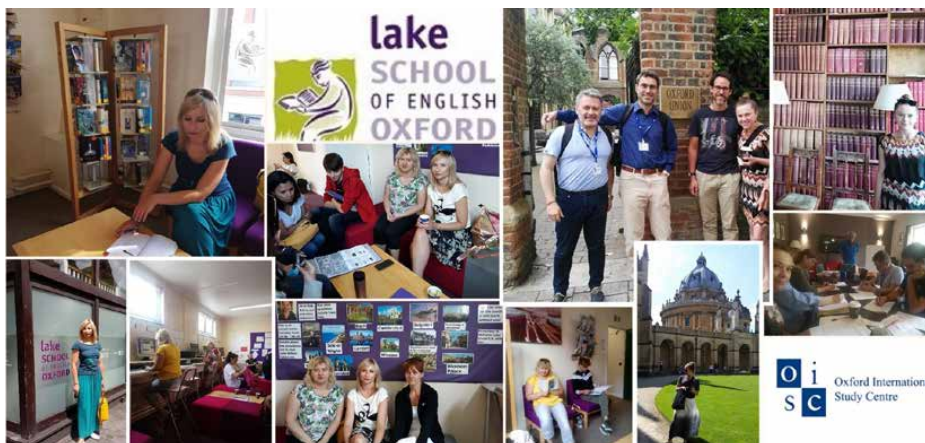
Kolejna grupa nauczycieli z Psar szkoliła się w szkołach w Oxfordzie

ropie". Dzięki niemu w zagranicznych szkoleniach wzięło udział dziewięciu nauczycieli.