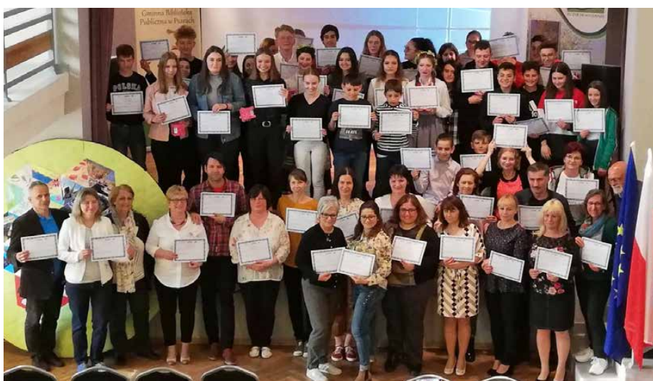
Ostatnie spotkanie w ramach dwuletniego projektu odbyło się w szkole w Psarach

Trzeci dzień uczestnicy rozpoczęli od Wieliczki, gdzie wzięli udział w warsztatach „Zostań eksploratorem kopalnianych głębin, po których każdy otrzymał Akt Nadania tytułu Eksploratora Kopalnianych Głębin. Program wizyty został wybrany