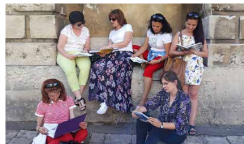
MOBILNI NAUCZYCIELE ZMIENIAJĄ SZKOŁY W GMINIE PSARY