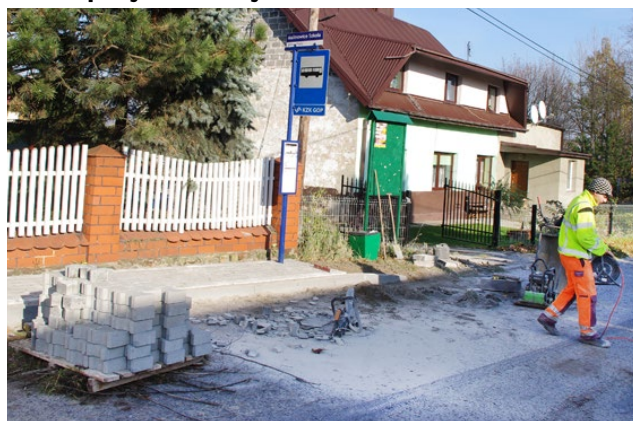
Prace przy brukowaniu peronu przystankowego

Na obecnym etapie robotnicy przygotowują podłoża i brukują platformy na kolejnych przystankach. Wiaty będą ustawiane już niebawem. Przedmiotowe prace zostaną zrealizowane do końca bieżącego roku za kwotę 411.729,06 zł. Red.