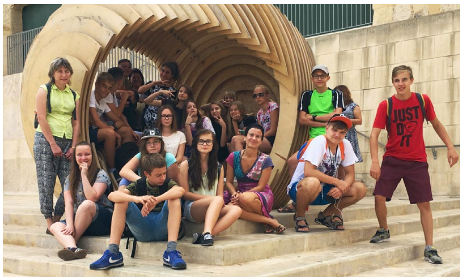
Uczestnicy warsztatów na Malcie