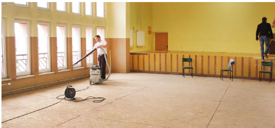
Prace nad montażem parkietu na sali w Ośrodku Kultury w Sarnowie

Do tej pory wykonano prace związane z usunięciem starego parkietu i położeniem płyt pod nową podłogę. Zainstalowano także klimatyzację. W drugim tygodniu listopada ma się rozpocząć układanie nowego parkietu,