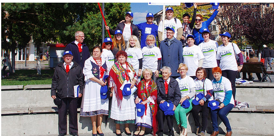
Uczestnicy warsztatów w Rumunii

Bansko z Bułgarii, Varpalota z Węgier, Ponte nelle Alpi z Włoch. Wśród 22-osobowej delegacji z gminy Psary znaleźli