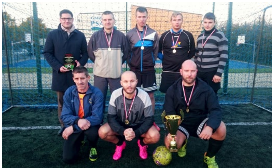
KS Orliki - zwycięzcy GALO na pamiątkowym zdjęciu