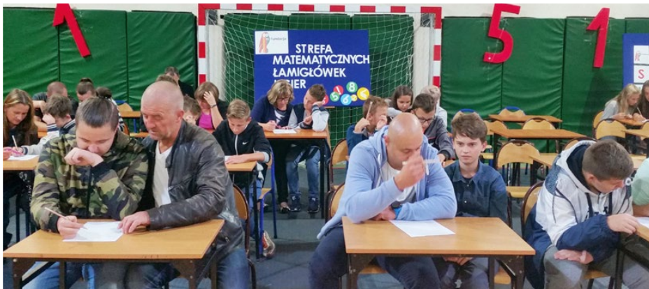
Strefa matematycznych łamigłówek i gier

Rozkoszą dla podniebienia były domowe wypieki przygotowane przez rodziców, kawa i herbata. Każda klasa zorganizowała swój kącik kulinarny, w którym spożywała grillowaną kiełbasę, pieczonki i pizzę. Gorąco dziękujemy wszystkim, którzy w jakikolwiek sposób przyczynili się do organizacji pikniku. Gimnazjum Psary