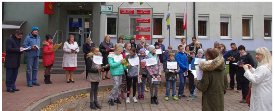
Akcja czytania pod Urzędem Gminy w Psarach

Uczniowie są przekonani, iż książka otwiera nam drzwi do innego, nieznanego świata. Siła sprawcza słowa pisanego jest ogromna. Czytając otwieramy naszą nieskrepowaną niczym wyobraźnię, słowa autora ubieramy w obrazy i to właśnie my tworzymy swoją autorską wizję. Kreujemy nową przestrzeń zgodnie z naszą wrażliwością, wiedzą i doświadczeniami życiowymi.