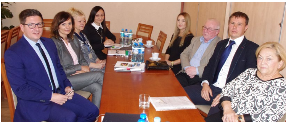
10.10.2016 r. podpisano umowy z projektantami kanalizacji oraz oczyszczalni

c.d. ze str. 1 „Powstaje projekt kanalizacji i oczyszczalni ścieków”