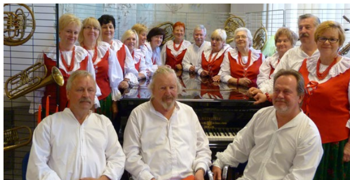
Zespół „Od... Do...” z Preczowa

1 października b.r. w siedzibie „Archetti” Orkiestry Kameralnej Miasta Jaworzna w Jeleniu odbyły się Jaworznicke Spotkania Chóralne, w których wziął udział Zespół Śpiewaczy „Od Do” z Preczowa, zajmując I miejsce.