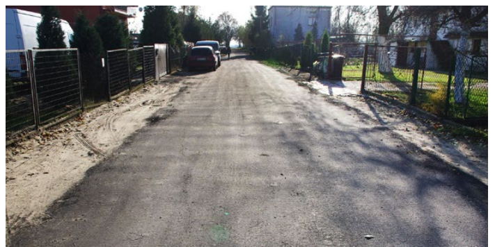
Najbardziej zniszczony fragment Akacjowej utwardzono frezem

Inwestycja obejmowała odcinek od ul. Wiejskiej w Psarach do powstającego centrum logistycznego firmy DL Project Management S.A. Oprócz wodociągu, zainstalowano też kabel energetyczny ziemny, a część drogi utwardzono frezem asfaltowym. Zadanie to zrealizowała firma TRANZIT Sp. z o.o., która była generalnym wykonawcą budowy węzła komunikacyjnego w Sarnowie. Z kolei Zakład Gospodarki Komunalnej w Psarach, niezwłocznie po oddaniu wodociągu do użytku, przyłączył posesje mieszkańców z ul. Akacjowej do nowej sieci. Obecnie trwa procedura przekazywania magistrali na rzecz Zakładu. ZGK