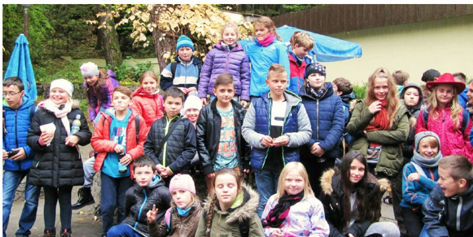
Uczestnicy wycieczki w Góry Świętokrzyskie