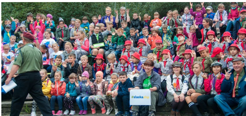
Gromada „Leśne Skrzaty” na Harcerskiej Imprezie Plenerowej