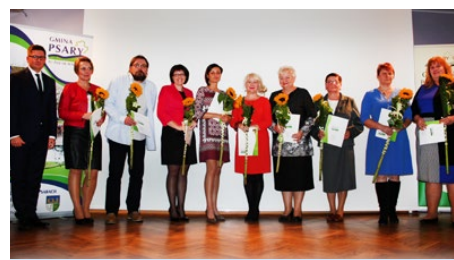
s. 7 INFORMACJE Gminny Dzień Edukacji Narodowej