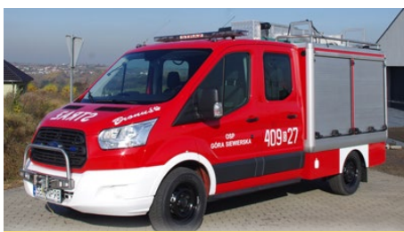
s. 5 INWESTYCJE Nowy wóz strażacki dla Góry Siew.