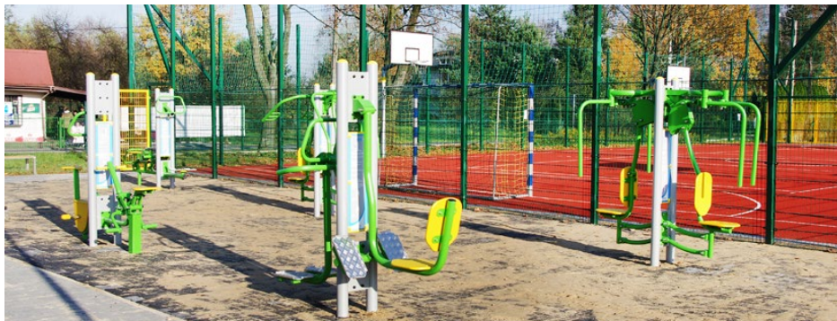
W Preczowie w 2016 z funduszu sołeckiego częściowo sfinansowano rozbudowę siłowni zewnętrznej

Od 19 do 23 września w naszej gminie odbywały się zebrania sołeckie, w których uczestniczyli przedstawiciele władz samorządowych, rady sołeckie poszczególnych miejscowości oraz mieszkańcy. Podczas spotkań ustalano podział tzw. funduszu sołeckiego. Na 2016 rok wyniósł on 285 202,17 zł.