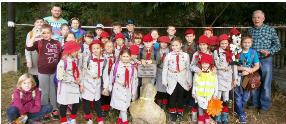
Uczestnicy gminnego zjazdu turystycznego

Wszystkie trakty miały metę na stadionie Iskry w Psarach, gdzie rozegrano dwa konkursy. Pierwszym zadaniem było wykonanie „Totemu - Jesiennego Stworca” z zebranych po drodze materiałów. Wszystkie prace były bardzo wesołe i kolorowe. Pierwsze miejsce przyznano ekipie Zespołu Szkolno-Przedszkolnego nr 2 z Sarnowa. Drugi konkurs polegał na przedstawieniu najciekawszej relacji ze szlaku. W tej konkurencji zwyciężyła drużyna Zespołu Szkolno-Przedszkolnego Nr 1 w Strzyżowicach. Wszystkie relacje były bardzo interesujące. Dotyczyły obiektów historycznych (krzyż pokutny), gatunków roślin, napotkanych śladów zwierząt (sarny, dzika), obiektów sakral-