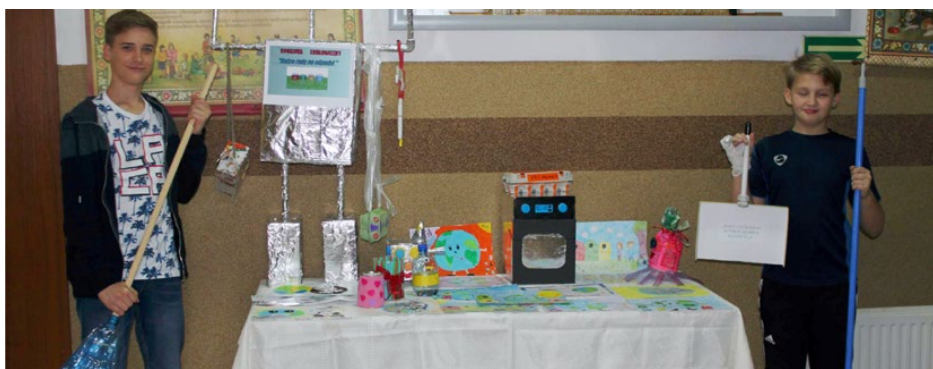
Wystawa prac w konkursie ekologicznym