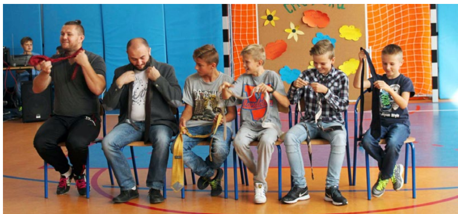
Panowie podczas konkurencji wiązania krawatów