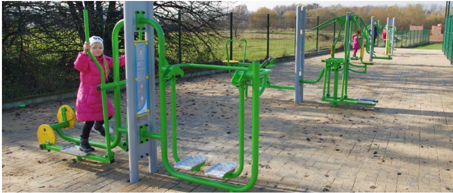
Nowa siłownia przy OPS w Psarach

Zakończono budowę dwóch siłowni zewnętrznych: w Psarach przy ul. Kamiennej oraz w Strzyżowicach w sąsiedztwie ul. Zwycięstwa. Z kolei w Preczowie zainstalowano nowe urządzenia przy istniejącej siłowni.