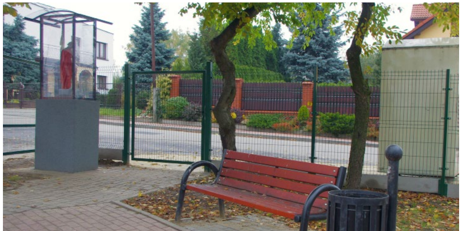
Nowe ogrodzenie wokół placu oraz wymieniona gablota z figurą św. Floriana

Zakres prac objął między innymi wymianę ogrodzeń: przy istniejącym placu zabaw oraz od strony ul. Szkolnej, wraz z bramą i furtkami. Poszczególne ławki przy alejce na placu zostały przesunięte, a przestrzeń wokół nich wybrukowana. Przy remizie robotnicy zamontowali nowy maszt i szlaban, wymienili także gablotę, w której znajduje się figura Świętego Floriana. Z kolei w budynku Związku Hodowców Gołębi Poczтовых z gminy Psary pomalowano posadzki w dwóch pomieszczeniach i wymieniono oprawy świetlne. Koszt całkowity prac wyniósł 30 223,56 zł. Red.