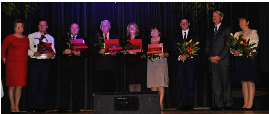
Laureaci pierwszej edycji nagród „Rydwany kultury”

Po ich występie goście mieli możliwość obejrzenia krótkiej prezentacji multimedialnej, będącej podsumowaniem działalności Gminnego Ośrodka Kultury. Na slajdach znalazły się najważniejsze imprezy oraz wydarzenia, które odbyły się w gminie Psary w tym roku. Materiał zawarty w prezentacji obrazował tylko niewielki ułamek całorocznej pracy oraz zaangażowania pracowników GOKu, władz samorządowych, lokalnych instytucji, stowarzyszeń oraz społeczników. Niedzielne spotkanie stanowiło znakomitą okazję do uhonorowania ludzi, którzy szczególnie angażują się w dziedzinie kultury na terenie naszej gminy. Po raz