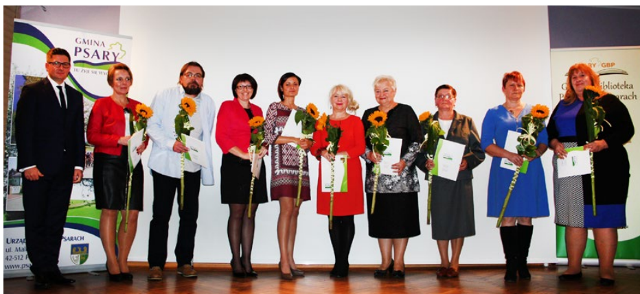
Nauczyciele-laureaci nagrody wójta