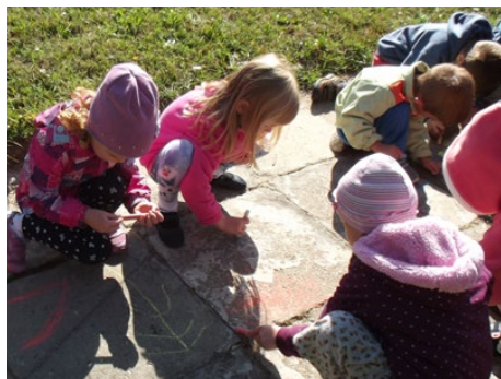
Wspólna zabawa podczas malowania

Pięć lat temu Polski Komitet Światowej Organizacji Wychowania Przedszkolnego ogłosił 20 września Ogólnopolskim Dniem Przedszkolaka, by podkreślić wagę edukacji przedszkolnej w rozwoju i wychowaniu dzieci.