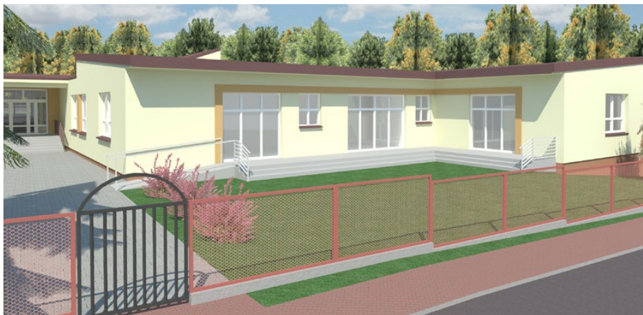
Wizualizacja mającego powstać budynku przedszkola od frontu

Otwarto oferty w przetargu na budowę przedszkola w Gródkowie o powierzchni użytkowej 280,90m 2 , które będzie się znajdowało przy istniejącym budynku szkolnym.