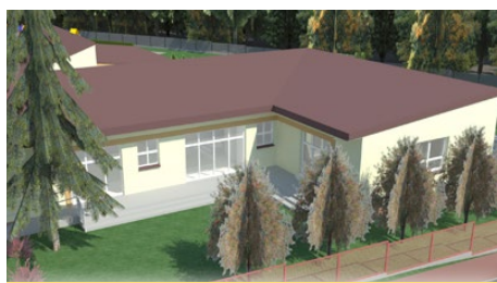
s. 3 INWESTYCJE Budowa przedszkola w Gródkowie

nowaną budową sieci kanalizacji sanitarnej. Gmina postawiła sobie bardzo ambitne zadanie, aby połączyć tworzenie kanalizacji – która i tak zlokalizowana będzie w pasie drogowym – z przebudową dróg i tam, gdzie to konieczne, powstaną c.d. na str. 2