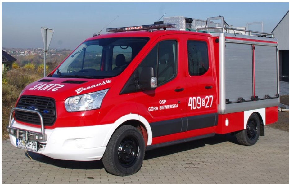
Nowy pojazd na wyposażeniu OSP Góra Siewierska

Zakup pojazdu został sfinansowany przez Gminę Psary oraz uzyskał 50 tys. zł dotacji z Ministerstwa Spraw Wewnętrznych i Administracji. Red.