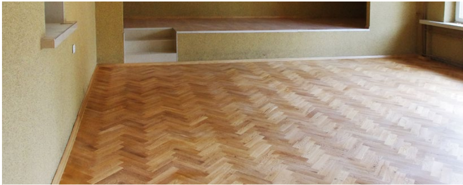
Nowy parkiet w sali bankietowej w Malinowicach

Wiosną zakończono prace remontowe w kolejnych pomieszczeniach w budynku po byłej szkole w Malinowicach.