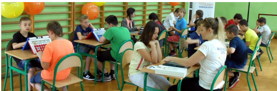
Przyjaciele gier planszowych

umożliwiają rozwój zdolności i zainteresowań dzieci. Roześmiane, pomalowane dziecięce buzie, mnóstwo wspaniałych zabaw podczas gier i różnorodnych konkurencji - tak w skrócie opisać można zajęcia w Szkole Podstawowej w Gródkowie, które w ramach projektu „Kumulacja Dobrej Woli” przygotowali wolontariusze LOTTO z Katowic. Podczas akcji uczniowie, nauczyciele oraz wolontariusze spędzili aktywnie czas w radosnej i życzliwej atmosferze. W ramach projektu 20 czerwca została zorganizowana wycieczka edukacyjna na Jurę Krakowsko-Częstochowską. SP Gródków