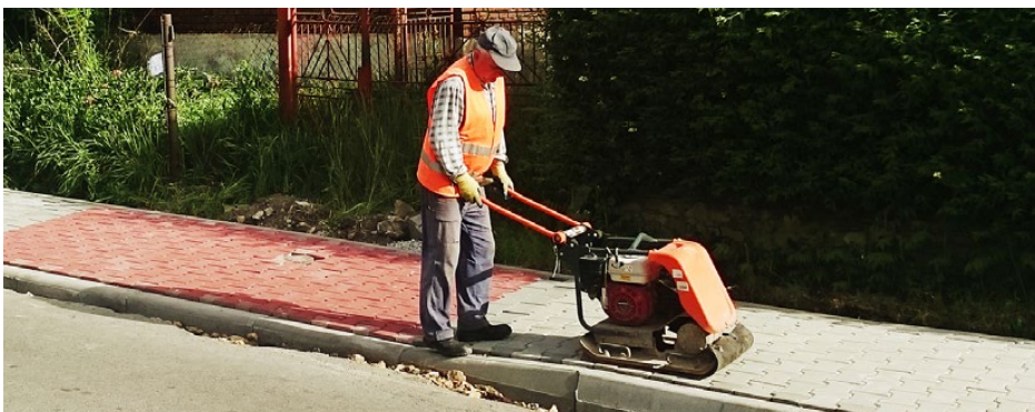
Prace przy budowie chodnika na ul. Wiejskiej w Sarnowie

Zlecono również realizację kolejnych etapów budowy chodników z odwodnieniem: w Górze Siewierskiej przy ul.