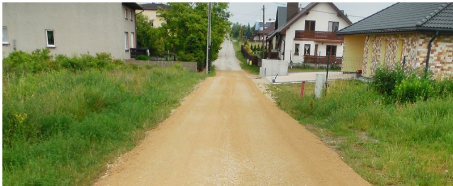
Utwardzona kruszywem ulica Ogrodowa w Górze Siewierskiej

W tym roku łącznie około 1800 metrów bieżących dróg w gminie Psary zostanie utwardzonych kruszywem.