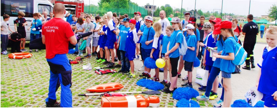
Pokaz ratownictwa medycznego

31 maja na kompleksie sportowo-rekreacyjnym miała miejsce impreza plenerowa organizowana przez Ośrodek Pomocy Społecznej w Psarach w ramach programu profilaktyczno-edukacyjno-sportowego pn. „Żyj marzeniami a nie uzależnieniami”.