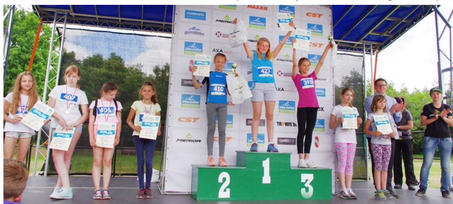
Wręczenie nagród dla dzieci po wyścigu kolarskim

Wyniki zawodów oraz informacje o kolejnych dostępne na: www.bikeateliermaraton.pl Bike Atelier