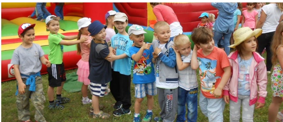
Zakładamy zielony kącik

wych atrakcji i konkurencji sportowych. Klauni zabawiali różnorodnymi grami i zabawami, puszczali bańki mydlane. Chętne dzieci mogły pomalować swoje twarze, zmieniając się w bajkowe postaci. Dmuchane zamki i zjeżdżalnie wzbudzały wśród uczestników największą radość. Całej imprezie towarzyszyła muzyka dyskotekowa, więc nasze szkolne cheerleaderki zaprezentowały najnowsze układy taneczne, co zmotywowało pozostałych uczniów do wspólnej zabawy. Uczestnikom dopisywał dobry humor, a z buzi nie schodził uśmiech. Na zakończenie każdy został poczęstowany słodką watą cukrową. Ten wyjątkowy dzień upłynął w miłej i przyjemnej atmosferze. SP Gródków