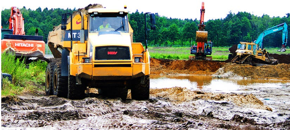
Pierwsze prace przy budowie centrum dystrybucyjnego LIDL-a w Gródkowie

Gmina Psary odczuła już pierwsze korzyści z budowy centrum logistycznego LIDL, gdyż w maju ubiegłego roku na konto samorządu wpłynęły blisko 3 mln zł z tytułu tzw. renty planistycznej wpla-