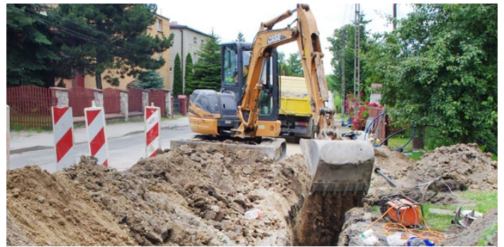
Prace na ul. Akacjowej w Psarach będą takie same jak te, które przeprowadzono na ul. Malinowickiej w Psarach

Inwestycja obejmie odcinek od ul. Wiejskiej w Psarach do powstającego centrum logistycznego firmy DL Project Management S.A. Zadanie to zostanie zrealizowane przez firmę TRANZIT Sp. z o.o., która jest generalnym wykonawcą budowy węzła komunikacyjnego w Sarnowie. Po zakończeniu budowy wodociąg zostanie przekazany odpłatnie gminie Psary, zgodnie z wynegocjowaną umową, za kwotę nie wyższą niż 319 800 zł brutto. Następnie Zakład Gospodarki Komunalnej w Psarach rozpocznie przyłączenie posesji mieszkańców z ul. Akacjowej do nowej sieci wodociągowej. Red.