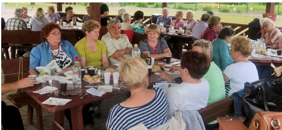
Spotkanie seniorów w Goląszy

Ale tak naprawdę najważniejsza była atmosfera tego spotkania – serdeczna i radosna, iście rodzinna. Sprawiły to m.in. niezapomniane piosenki biesiadne śpiewane przez wszystkich przy akompaniamencie gitary, konkursy wokalne z „przymrużeniem oka” czy taniec wokół altany na zakończenie spotkania.