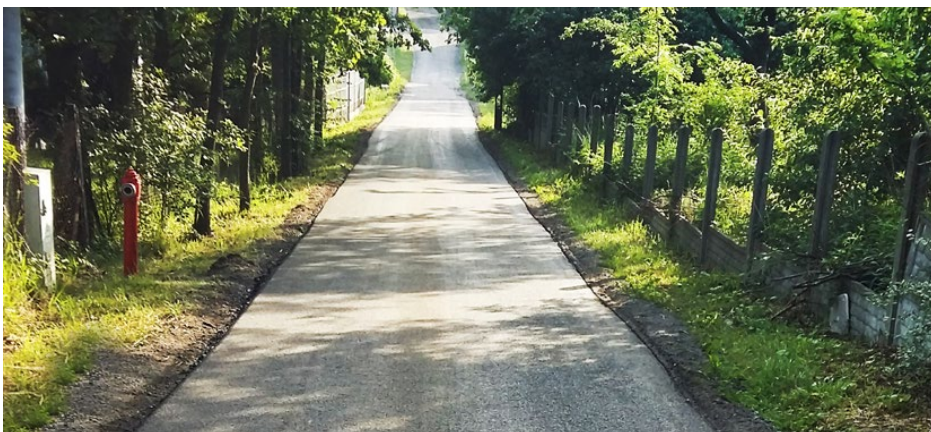
Ulica Kwiatowa w Gródkowie po remoncie

Ponadto przeprowadzono remonty cząstkowe nawierzchni bitumicznej grysem i emulsją pod ciśnieniem z remontera. Tego typu naprawy objęły łącznie odcinki 24 ulic o powierzchni ok. 2000 m 2 , w tym: w Malinowicach – ul. Brzozową i ul. Bory, w Dąbiu – ul. Pocztową (parking OSP Dąbie), w Sarnowie – ul. Jasną, ul. Spacerową, ul. Kamienną, ul. Starą, ul. Browarną, ul. Krótką, ul. Gruntową, ul. Poprzeczną,