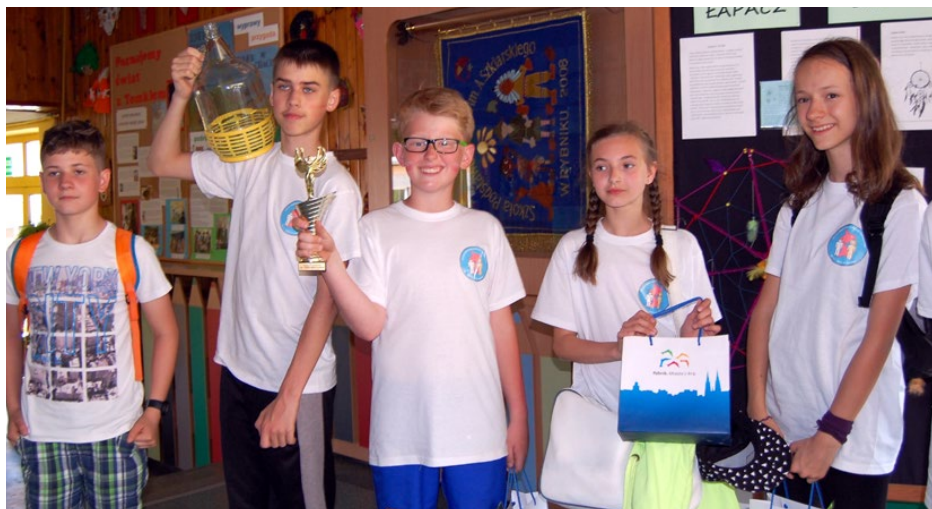
Wracamy z pucharem