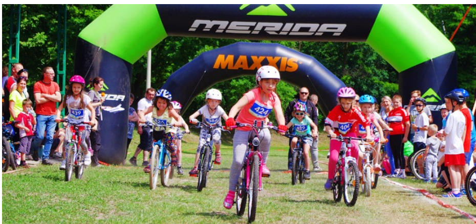
Dzieci, jak co roku, startowały na boisku Iskry Psary

Start oraz meta Bike Atelier Road usytuowane były przy stadionie LKS Iskra Psary, a trasa rundy prowadziła przez okoliczne miejscowości: Górę Siewierską, Twardowice, Najdziszów, Toporowice, Chrobakowe i Malinowice. W ramach imprezy odbyły się również wyścigi dzieci – łącznie wystartowało