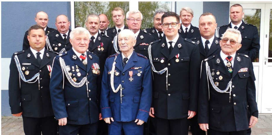
Nowy Zarząd Gminnego Związku OSP RP w gminie Psary

21 maja 2016 r. w sali bankietowej Ochotniczej Straży Pożarnej w Dąbiu odbył się XI Zjazd Oddziału Gminnego Związku Ochotniczych Straży Pożarnych RP w Psarach.