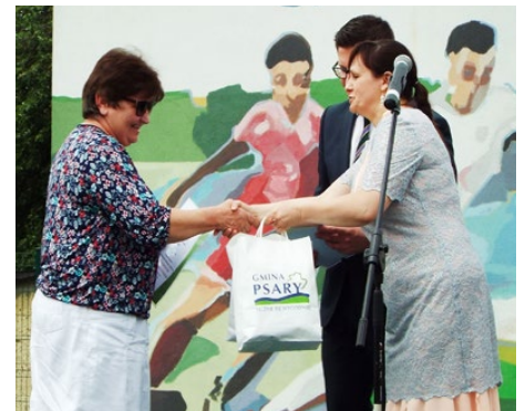
Najlepszą szkołą w tym roku okazała się placówka z Dąbia