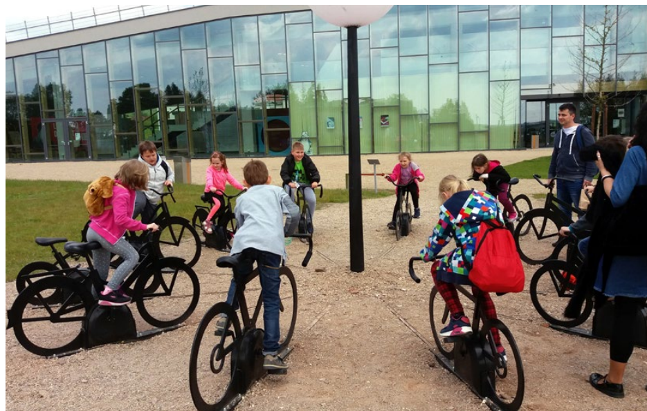
W krainie Leonarda