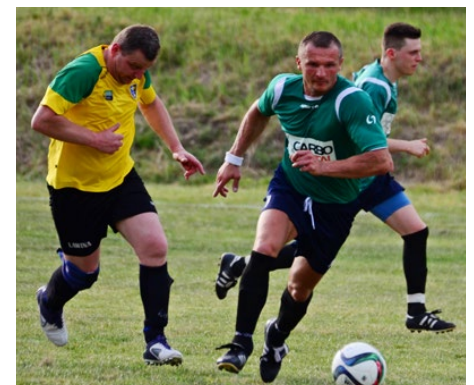
LKS Jedność Strzyżowice podczas meczu z KS Górnik II Piaski

„Awans LKS Jedność Strzyżowice jest w pełni zasłużony. Drużyna bardzo cięż-