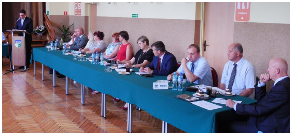
Radni jednogłośnie udzielili wójtowi absolutorium

c.d. ze str. 6 „Absolutorium dla Wójta za dobrze wykonany budżet”