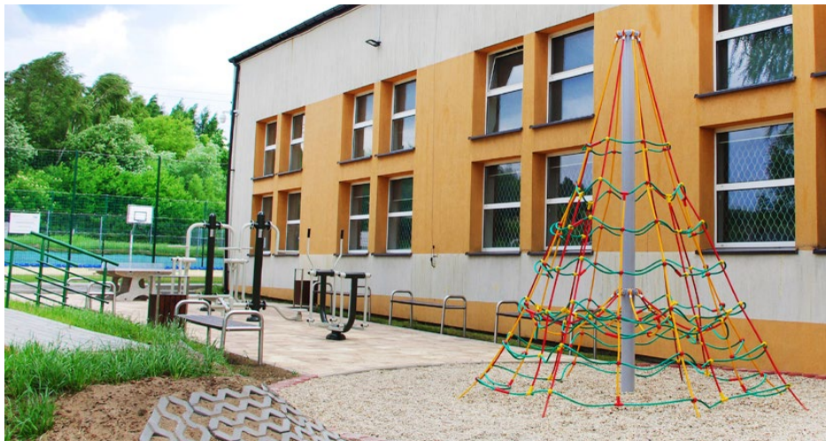
Nowe miejsce do zabaw oraz siłownia zewnętrzna przy szkole w Dąbiu

Z końcem maja zakończono prace związane z zagospodarowaniem terenu wokół budynku Szkoły Podstawowej w Dąbiu.