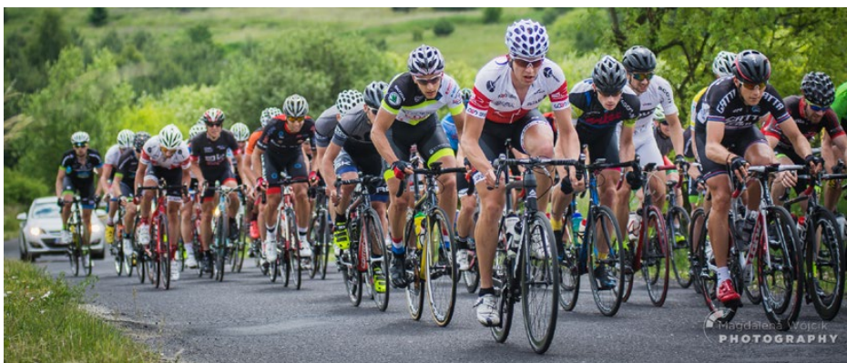
Wyścig w kategorii Masters