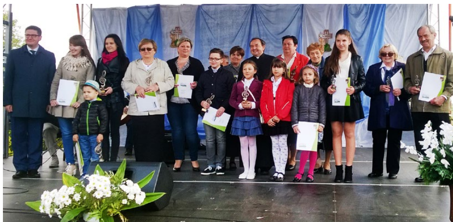
Laureaci Gminnego Przeglądu Piosenki Religijnej

Podobnie jak poprzednio, to muzyczno-religijne wydarzenie składało się z dwóch części, które miały miejsce 9 i 15 maja br.