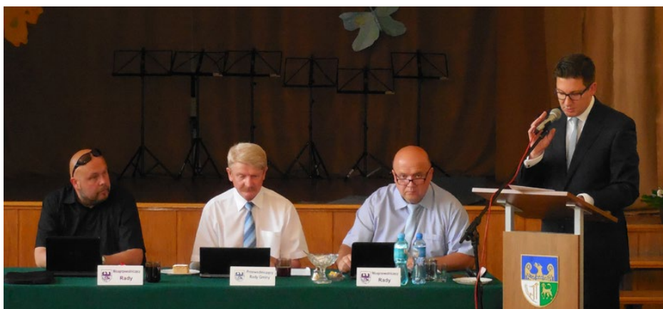
Wójt podczas sesji, na której uzyskał absolutorium

Budżet 2015 roku był pod wieloma względami historyczny. Po raz pierwszy dochody gminy przekroczyły, i to znacznie, barierę 40 mln zł – ostatecznie wyniosły 45 787 744 zł. Rekordowe były również wydatki na inwestycje, czyli majątkowe, które sięgnęły aż 13,2 mln zł, co stanowiło prawie 32% wszystkich wydatków budżetu gminy. Jest to niezwykle wysoki wskaźnik w skali całego kraju, oznaczający, że samorząd przeznaczą bardzo duże środki na inwestycje budowlane dla mieszkańców w porównaniu z innymi wydatkami bieżącymi. Dla porównania, wśród wszystkich miast i gmin w powiecie będzińskim, tylko duża Czeladź miała nieznacznie większe wydatki majątkowe. Na uwagę zasługuje także fakt, że już piąty rok z rzędu zadłużenie gminy z tytułu kredytów długoterminowych zmalało, rok do roku, o 1,162 mln zł. Dług ten wyniósł na koniec 2015 r. nieco ponad 6,6 mln zł, co stanowiło jedynie 14,5% wy-