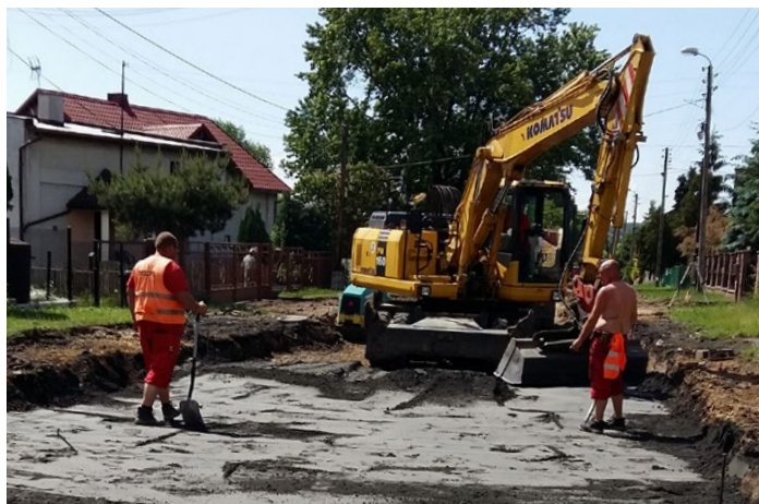
Prace przy korytowaniu drogi na ul. Bocznej w Psarach

W kwietniu rozpoczął się remont ul. Bocznej i Łącznej w Psarach. Na drogach widać już pierwsze efekty prac.