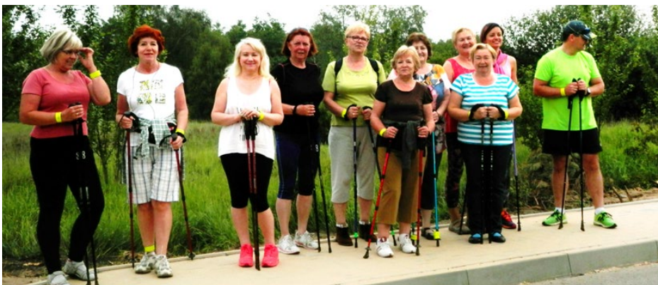
Uczestnicy marszu Nordic Walking

4. Poprawa kondycji. Jeśli wejście po schodach na trzecie piętro powoduje u Ciebie zadyszkę, po miesiącu treningów nordic walking nie będziesz mieć z tym problemu. Sport ten należy do aktywności typu kardio, a więc stymulujących pracę serca. Podczas dynamicznego spaceru z kijami tętno wzrasta o 7-15