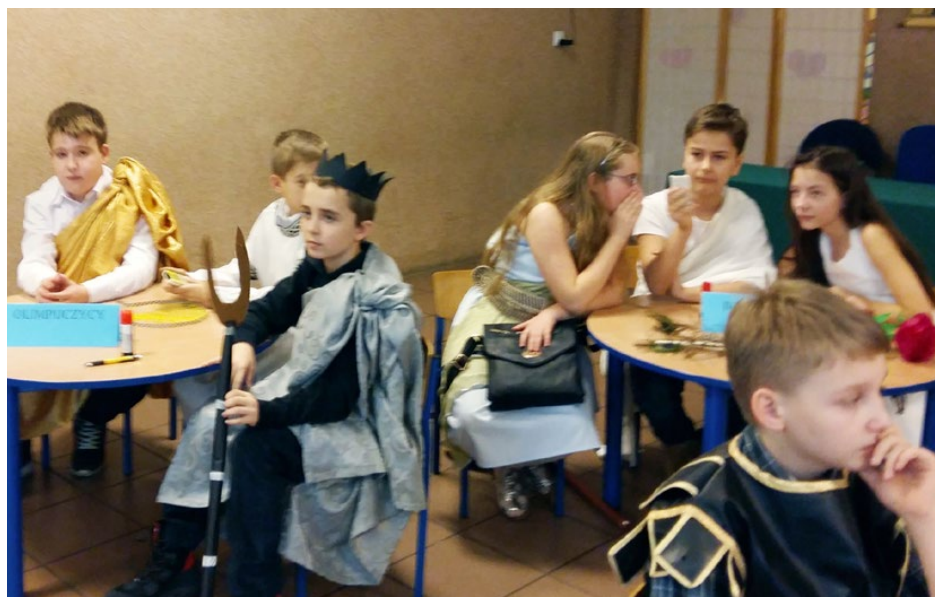
W oczekiwaniu na kolejne zadanie