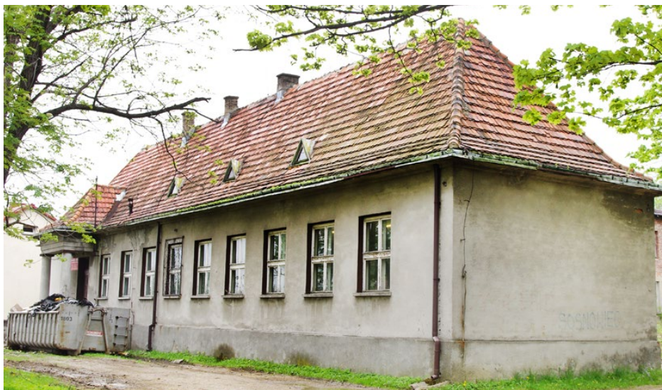
Powstanie projekt remontu i termomodernizacji byłej szkoły w Goląszy Górnej

Kolejne opracowanie będzie dotyczyło termomodernizacji i remontu budynku szkoły podstawowej w Strzyżowicach, którego parametry energetyczne uległy znacznemu pogorszeniu. Projektant będzie musiał przewidzieć