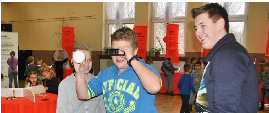
Interaktywna wystawa Centrum Nauki Kopernik budziła duże zainteresowanie

Również poszczególne placówki biblioteki przygotowały ciekawe zajęcia w czasie ferii. I tak, we wszystkich oddziałach GBP odbywały się cykliczne zajęcia pod intrygującym tytułem „Szukamy odpowiedzi na trudne pytania”. W zaję-