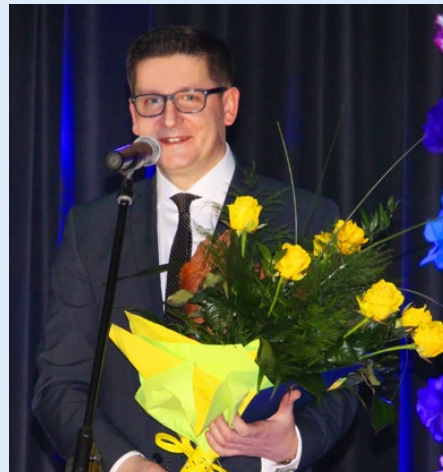
Wójt Gminy Psary chwilę po wyróżnieniu Złotą Odznaką Honorową za wspieranie seniorów nadaną przez Związek Emerytów, Rencistów i Inwalidów 8 marca br.

W formularzu zgłoszeniowym należało przedstawić osiągnięcia kandydata w zakresie budowy infrastruktury komunalnej, w szczególności dróg, wodociągów, obiektów sportowych,