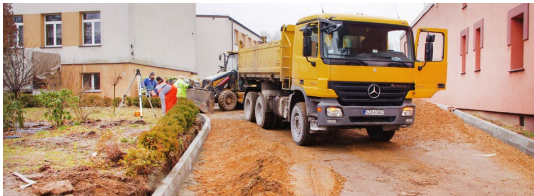
Prace przy budowie wjazdu na plac szkoły w Dąbiu

nitową pod plac apelowy oraz nawierzchnię na terenie przeznaczonym na siłownię zewnętrzną. Wykonano podbudowy pod miejsca postojowe dla samochodów i zamontowano część ogrodzenia z paneli 3D. Wartość przeprowadzonych robót wyniesie 538 458,32 zł brutto. Red.