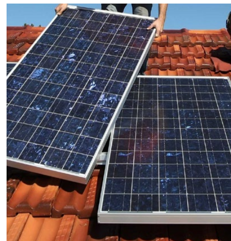
Przykładowe ogniwa fotowoltaiczne