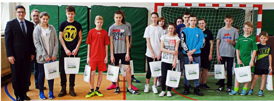
Laureaci sportowych konkurencji zorganizowanych w ferie

zowicach miały miejsce nowatorskie zajęcia plastyczne pod hasłem „Artystyczna Biblioteka”. Bezsporne największym zainteresowaniem cieszyły się projekcje 6 filmów z serii „Gwiezdne Wojny”, które odbyły się w Psarach. Nie zabrakło również oferty kinowej dla dzieci, które miały okazję oglądać cieszące się nieślabnącym powodzeniem bajki. Oglądaliśmy Rozbójnika Rumcajsa, Bolka i Lolka, Przygody Reksia i Zaczarowany ołówek. Oczywiście oprócz wersji filmowej można było w każdej bibliotece posłuchać i poczytać bajki razem z bibliotekarką.