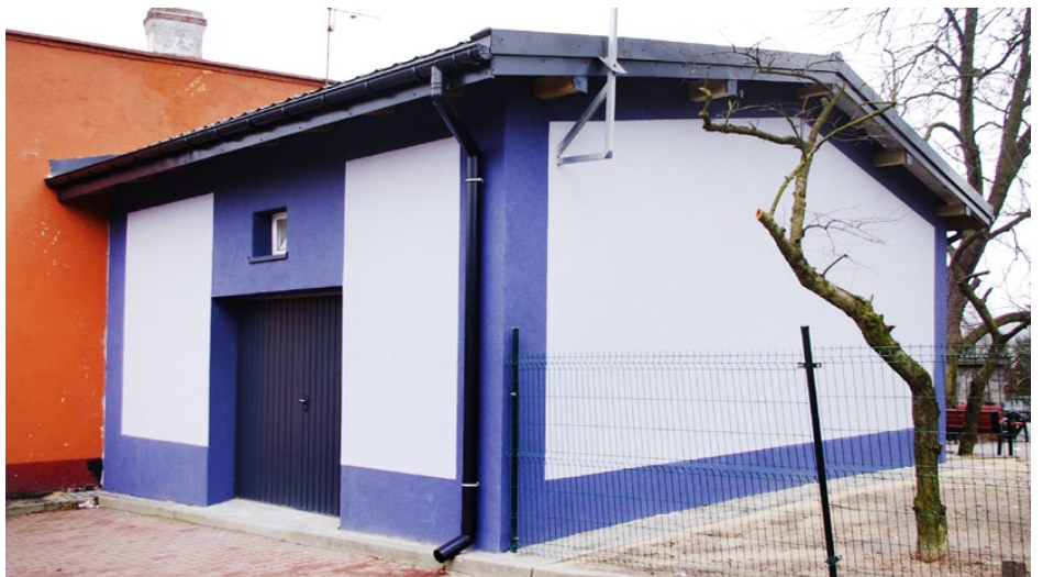
Wyremontowany budynek wykorzystywany przez Związek Hodowców Gołębi Poczтовых

Wykonawcą tego zadania było Hutnicze Przedsiębiorstwo Remontowe Dąbrowa Górnicza Sp. z o.o. Firma ta za kwotę 58 681,91 zł zmieniła konstrukcję dachu na dwuspadowy oraz wyremontowała wnętrze budynku, w którego części położono nowe tynki, a wszystkie ściany ocieplono i pomalowano. Odświeżone zostało także dojście do budynku. Obiekt jest wykorzystywany przez członków Związku Hodowców Gołębi Poczтовых z gminy Psary. Red.