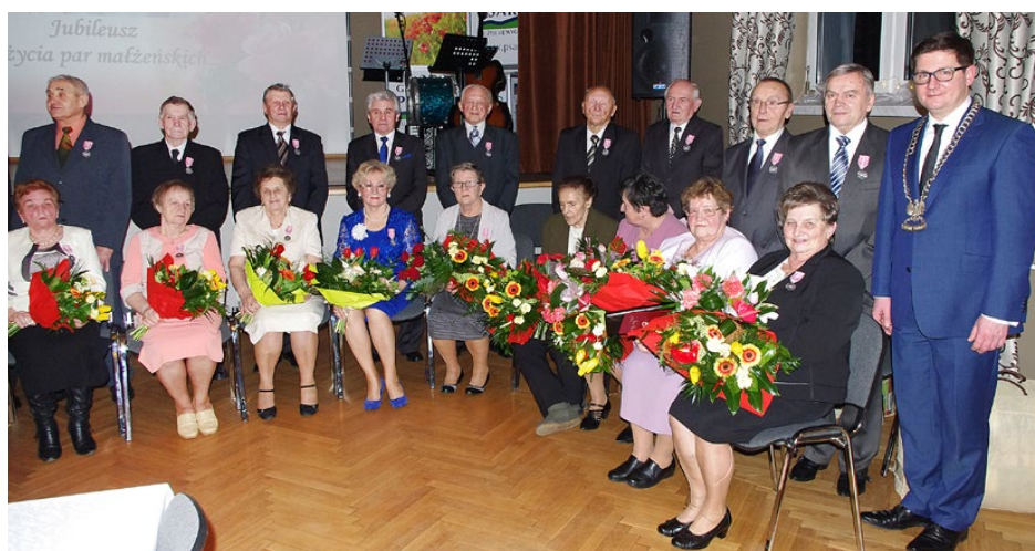
Jubilaci, którzy świętowali złote gody 2 lutego - część II