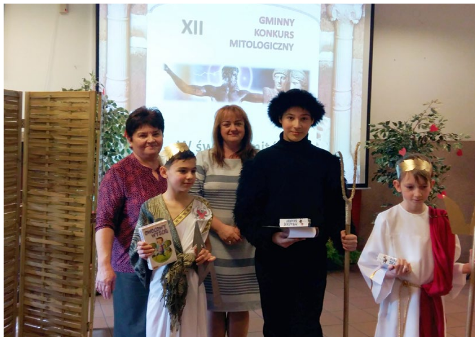
Zwycięska drużyna z Dąbia

Zawodnicy, niczym mityczny Herakles, mieli do wykonania dwanaście prac. Pierwszą był e-test. Przedstawiciele starożytnej cywilizacji bez problemu poradzi sobie z technologią cyfrową, udzielając za pośrednictwem pilotów odpowiedzi na podstawowe pytania dotyczące mitologii greckiej. Potem, również korzystając z technologii komputerowej, zespoły mogły obserwować na dużym ekranie kolejne zadania. Dotyczyły one m.in. rozpoznawania postaci mitologicznych w malarstwie i rzeźbie, nazwania prac