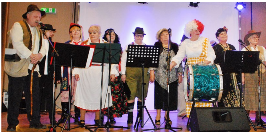
Zespół „OD... DO...” z Preczowa na scenie

Jak co roku, ostatni dzień karnawału mieszkańcy naszej gminy świętowali podczas gminnych Zapustów, 9 lutego w sali bankietowej OSP Dąbie.