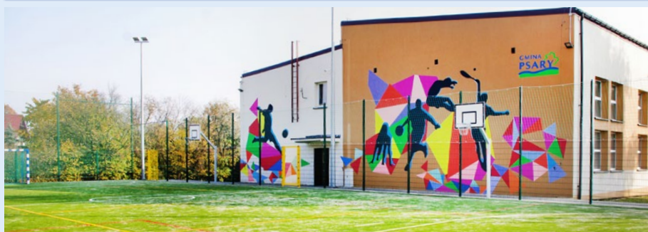
W 2015 r. wybudowano również boisko wielofunkcyjne w Dąbiu oraz poprawiono estetykę budynku szkoły

Zeskanuj kod smartfonem lub tabletem, aby zobaczyć podsumowanie 2015 roku dostępne także na www.psary.pl