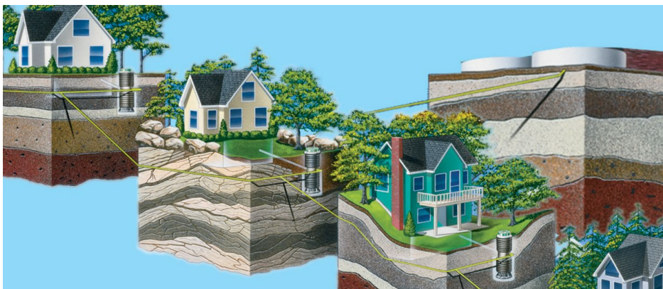
Schemat działania kanalizacji ciśnieniowej.

Ekspertsi związani z firmą „Ekoprojekt” z Zabrze, posiadający bardzo duże doświadczenie przy projektowaniu kanalizacji oraz oczyszczalni, wykonali wielowariantową koncepcję odprowadzania ścieków na terenie gminy. Opracowanie to powstało na przełomie 2015 i 2016 roku na zamówienie Gminy Psary. Szczegółowo rozpatrzono wszystkie istotne czynniki, które mogły pomóc w wyborze optymalnego dla naszej gminy rozwiązania. Zwracano uwagę między innymi na