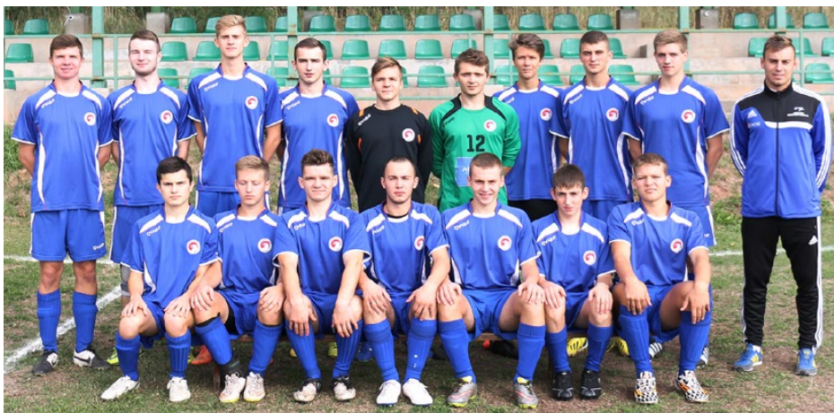
Drużyna juniorów Orła Dąbie

A.CZ.: Drużyna trenuje 2 razy w tygodniu. Nasz klub jest dobrze wyposażony w akcesoria szkoleniowe. Zawodnicy doskonalią swoją grę zarówno na mniejszym boisku Orlika jak i na dużym obiekcie w Dąbiu, gdzie trenują również seniorzy Orła. Jedynym problemem jest to, że przy