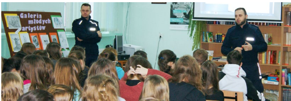
Spotkanie z policjantem