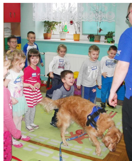
Zajęcia z psem Largo