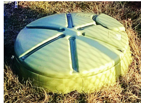
Przykładowa studzienka przydomowa o śr. ok. 80 cm, w której znajduje się pompa z rozdrabniaczem

Należy dodać, że do kanalizacji ciśnieniowej odprowadzane są wyłącznie ścieki sanitarne, a nie opady deszczu, śniegu, czy wody gruntowe – tworzy bowiem system zamknięty, pobierając ścieki jedynie z przyłączonych gospodarstw domowych, a nie ze studzienek kanalizacyjnych znajdujących się w jezdni. Dzięki temu taka oczyszczalnia ścieków nie będzie obciążona zbędnymi wodami, które utrudniają oczyszczanie ścieków sanitarnych i podwyższają koszty eksploatacyjne oczyszczalni. To wpłynie także na zwiększenie wydajności tej infrastruktury oraz pozwoli ograniczyć ilość i wielkość oczyszczalni koniecznych do obsługi całego systemu – stąd w założeniu planowana jest budowa tylko jednej bądź maksymalnie dwóch oczyszczalni. Inną ważną zaletą kanalizacji ciśnieniowej jest to, że poszczególne elementy instalacji i koszty jej wykonania są znacznie niższe