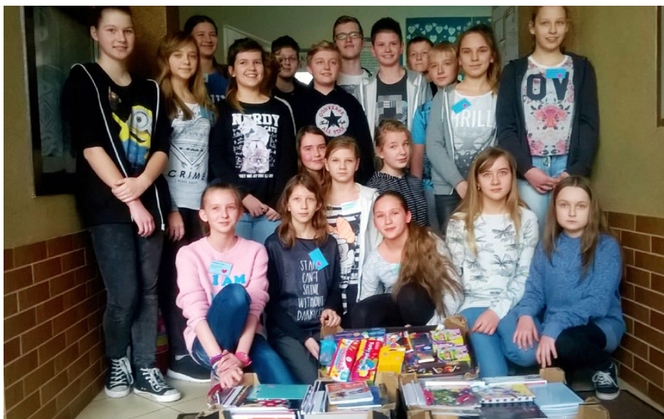
Wolontariusze ze Szkolnego Klubu Wolontariatu podczas zbiórki artykułów szkolnych