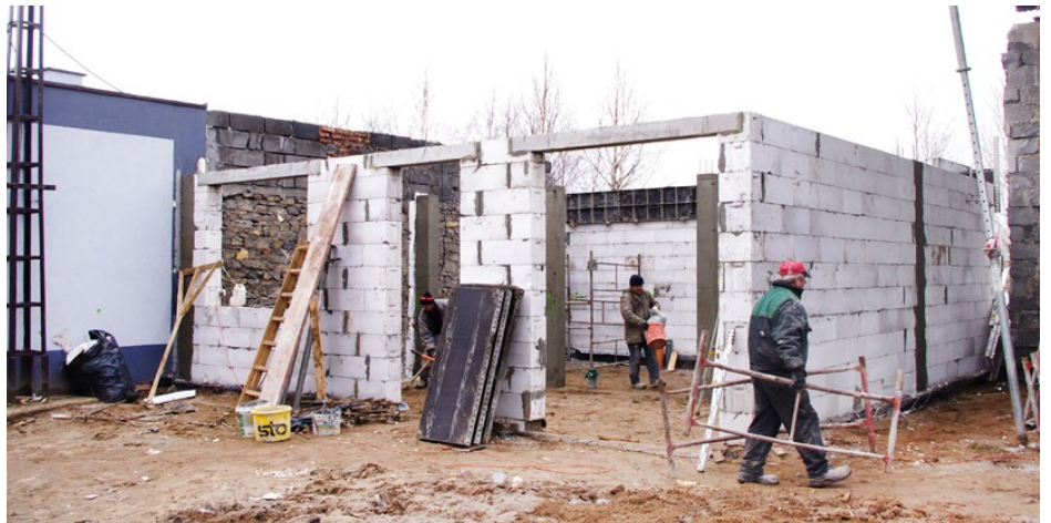
Prace przy rozbudowie pomieszczeń dla strażaków z Dąbia

Koszt robót i materiałów budowlanych wyniesie 283 816,27 zł brutto. Ter-