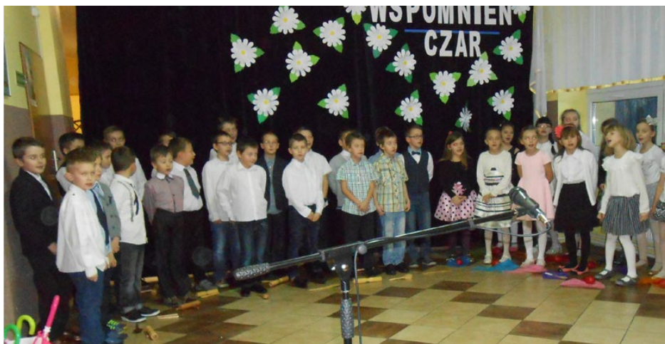
Występy z okazji dnia Babci i Dziadka

Styczeń to miesiąc szczególny, w którym swoje święto obchodzą babcie i dziadkowie. Chcąc uczcić te wyjątkowe dni, społeczność przedszkola i szkoły podstawowej w Gródkowie miała za-