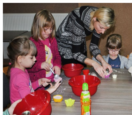
Warsztaty z robienia kul do kąpeli

Gminny OPS przygotował na czas ferii dużą ilość zajęć sportowych pod hasłem „Zimowe Igrzyska – radość bez narkotyków”, które odbywały się w Gimnazjum w Psarach. W programie znalazły się następujące dyscypliny: piłka nożna, koszykówka, badminton, tenis stołowy i siatkówka, a także inne zabawy rekreacyjno-sportowe. Turnieje zostały zorganizowane w celu zapewnienia dzieciom i młodzieży alternatywnej, ciekawej i prospołecznej formy spędzania czasu wolnego, co stanowi też swego rodzaju skuteczną działalność profilaktyczną przeciw uzależnieniom od alkoholu i narkotyków. W zaję-