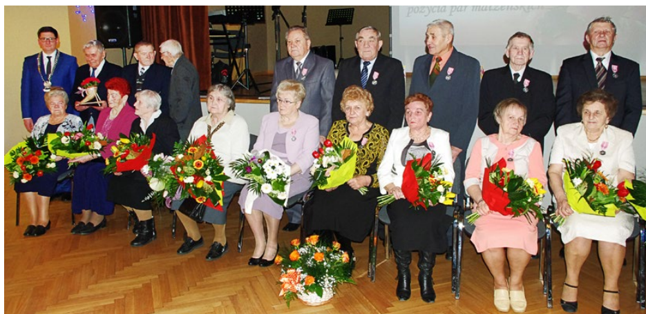
Jubilaci, którzy świętowali złote gody 2 lutego - część I

Po wręczeniu wyróżnień zgromadzeni na uroczystości goście złożyli życzenia wszystkim wyróżnionym małżonkom. Następnie rozpoczęła się część artystyczna w wykonaniu Zespołu Śpiewaczego Dąbie, „Nasz Gródków”, „Od... Do...” oraz Brzękowanie. Red.