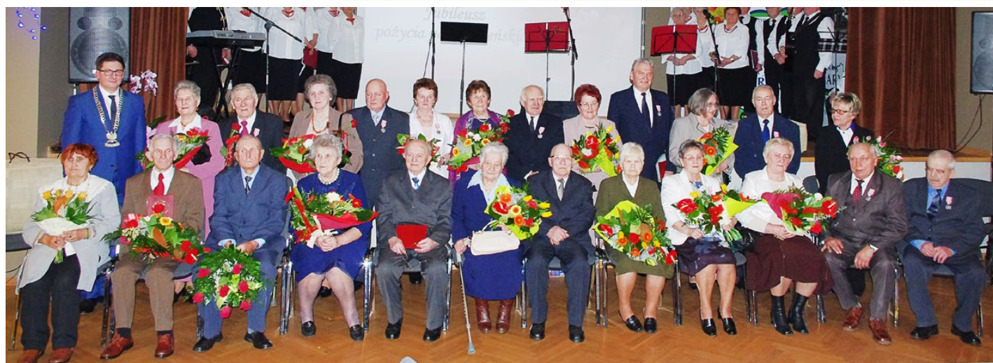
Jubilaci, którzy świętowali złote gody 3 lutego