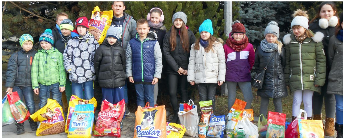
Wolontariusze ze Szkoły Podstawowej w Gródkowie