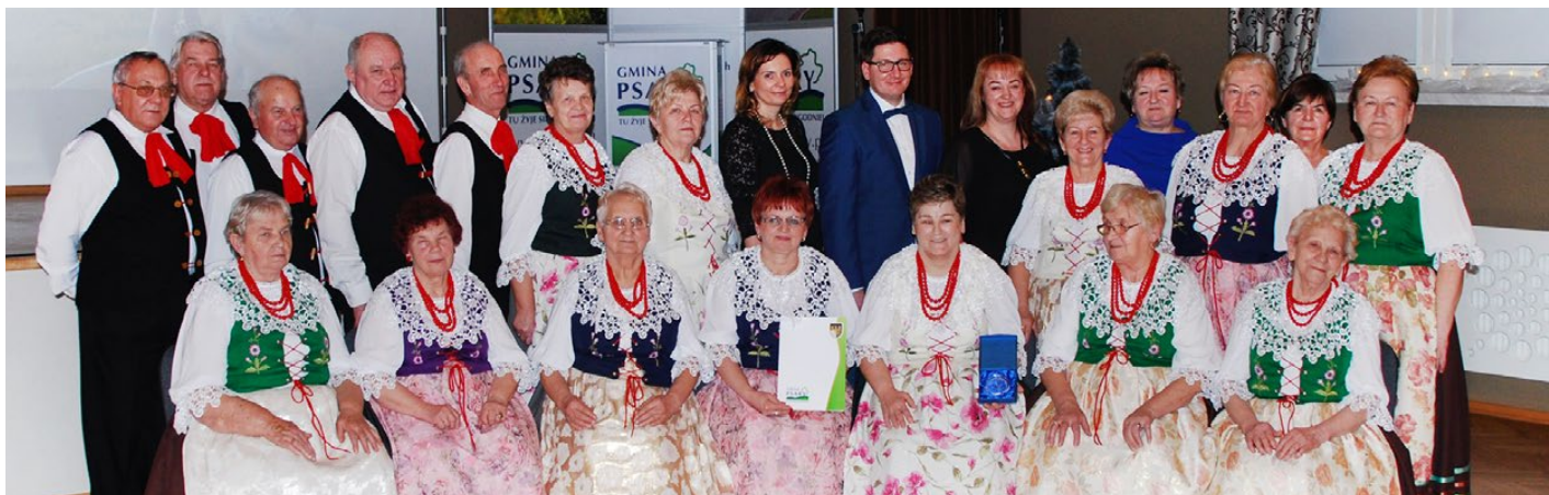
Pamiątkowe zdjęcie Zespołu Śpiewaczego „Dąbie” z przedstawicielami samorządu

Zespół Śpiewaczy Dąbie został laureatem nagrody Wójta Gminy Psary w dziedzinie kultury. Zapraszamy do zapoznania się z osiągnięciami wyróżnionego zespołu.