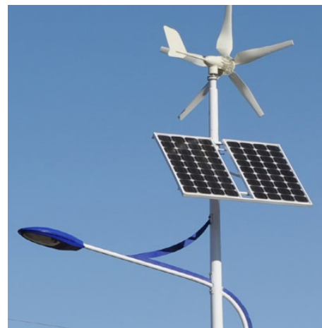
Przykładowa instalacja oświetleniowa zasilana technologiami OZE

Oprócz oświetlenia projektowanego z wykorzystaniem odnawialnych źródeł energii (OZE) trwają także prace nad dokumentacją budowlaną dla oświetlenia LED zasilanego tradycyjnie, energią elektryczną z sieci. Opracowanie obejmuje instalacje nowych lamp w takich miejscach jak: odcinek ulicy Brzozowej w Malinowicach oraz Dąbie Chrobakowe, fragment drogi na Brzękowie Wał (od drogi powiatowej), drogę dojazdową do nowej zabudowy w miejscowości Brzękowie Wał na odcinku ok. 212 mb., fragment ul. Parkowej w Strzyżowicach, odcinek ul. Malinowickiej w Psarach (do ośrodka zdrowia), odcinek ul. Podwale w Strzyżowicach, ul. Dębowej w Preczowie, ul. Browarnej w Sarnowie. Ponadto planowane jest objęcie projektem zasilania wiaty przystankowej wraz z monitoringiem w Górze Siewierskiej na łącz-