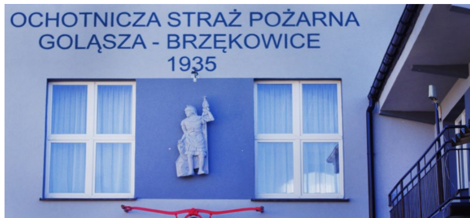
Płaskorzeźba Świętego Floriana na nowej elewacji

Ten rok pod względem inwestycji na pewno należy do udanych dla jednostki Ochotniczej Straży Pożarnej w Gołąszo-Brzękowicach, bowiem ich remiza przeszła kolejne prace remontowe, a wóz bojowy kompleksowy remont.