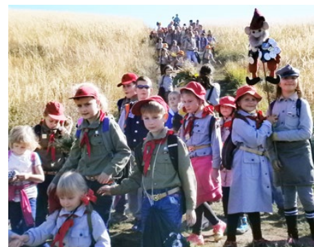
Zuchy na rajdzie pieszym

Zespół Szkolno-Przedszk. Nr 1 w Strzyżowicach – Leśne Skrzaty