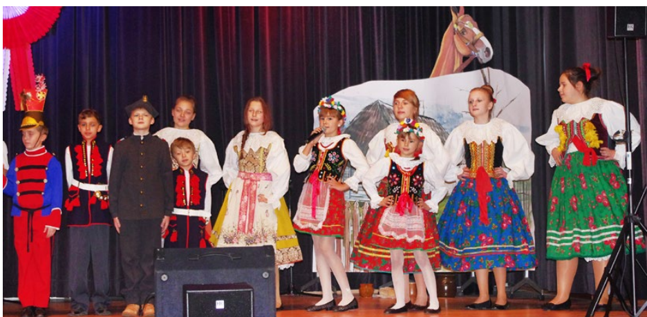
Występ uczniów ze Szkoły Podstawowej w Gródkowie