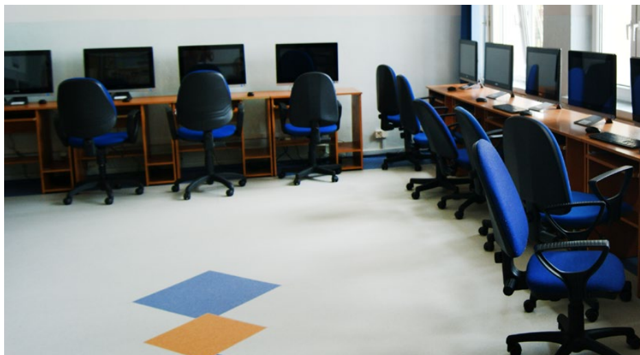
Nowoczesna sala komputerowa w gimnazjum z nową podłogą

Podłoga została wykonana w te wakacje przez firmę OL-BUD BIS z Sosnowca kosztem 7000 zł brutto. Nowoczesna wykładzina posiada wszystkie stosowne atesty antystatyczne i nieprzewodzące. Olbrzymim plusem jest również trwałość nowej podłogi, która nie niszczy się tak jak parkiet z powodu krzeseł biurowych na kółkach, znajdujących się przy każdym stanowisku komputerowym. Red.