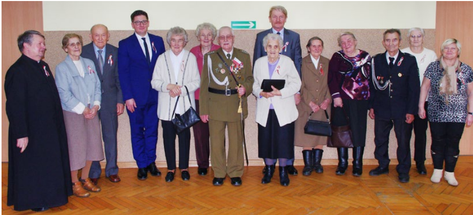
Pamiątkowe zdjęcie koła ZKRPIBWP z gminy Psary

17 XI w Ośrodku Kultury w Sarnowie odbyło się uroczyste zebranie ogólne Związku Kombatantów RP i Byłych Więźniów Politycznych Koło Psary.