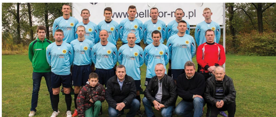
Drużyna LKS Jedność Strzyżowice - lider B-klasy po rundzie jesiennej

Nieco silniej reprezentowana jest nasza gmina w B-klasie sosnowieckiego podokręgu, gdzie grają 3 tutejsze zespoły i radzą sobie w tych rozgrywkach całkiem dobrze. Po ostatniej, dwunastej jesiennej rundzie na czele ligi znalazł się