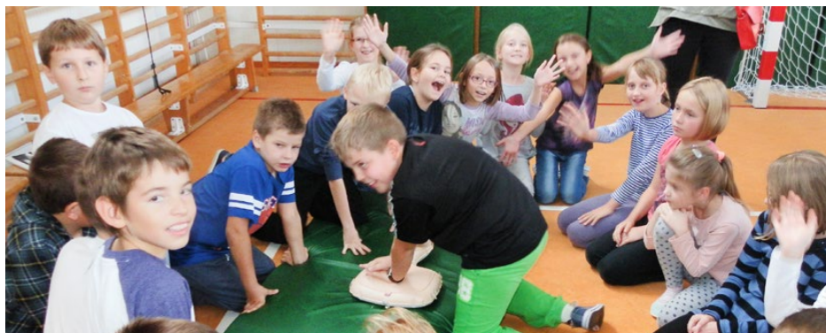
Bicie rekordu w resuscytacji w Szkole Podstawowej w Sarnowie

16 października 2015 r. z okazji Europejskiego Dnia Przywracania Czynności Serca uczniowie, rodzice i nauczyciele Zespołu Szkolno-Przedszkolnego Nr 2 w Sarnowie po raz drugi włączyli się do wspólnego ustanawiania rekordu w jednoczesnym prowadzeniu resuscytacji krążeniowo-oddechowej przez jak największą liczbę osób.