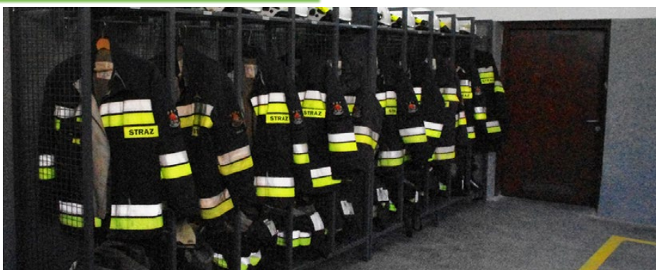
Nowe szafki na wyposażeniu strażaków z OSP Gołąszo-Brzękowice

Zmiany zaszły także w strażackim garażu, gdzie oprócz nowych tynków pojawiły się specjalne szafki na odzież druhow oraz przechowywanie indywidualnego sprzętu. Ta z pozoru drobna