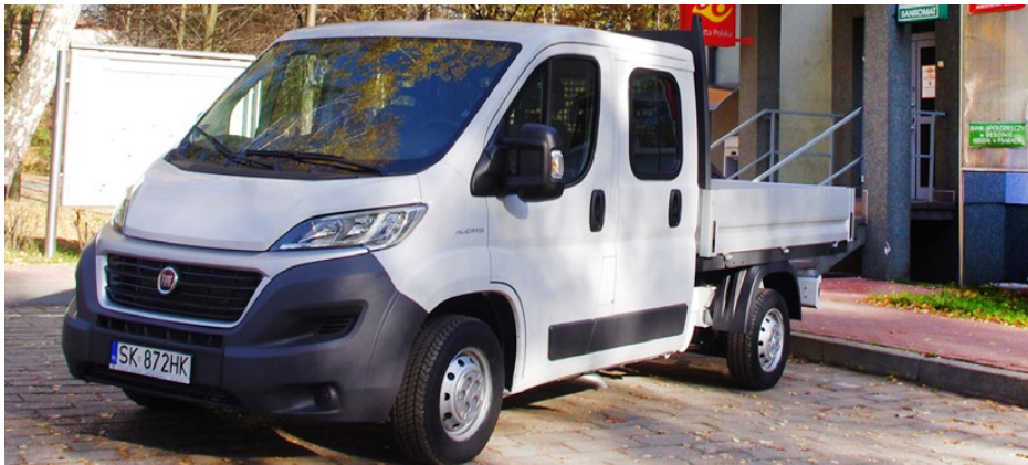
Nowy samochód dostawczy Zakładu Gospodarki Komunalnej w Dąbiu

Na początku listopada Zakład Gospodarki Komunalnej w Dąbiu wziął w leasing nowy samochód dostawczy Fiat Ducato. Wkrótce zakupiony zostanie także ciągnik z pełnym wyposażeniem do utrzymania porządku na drogach.