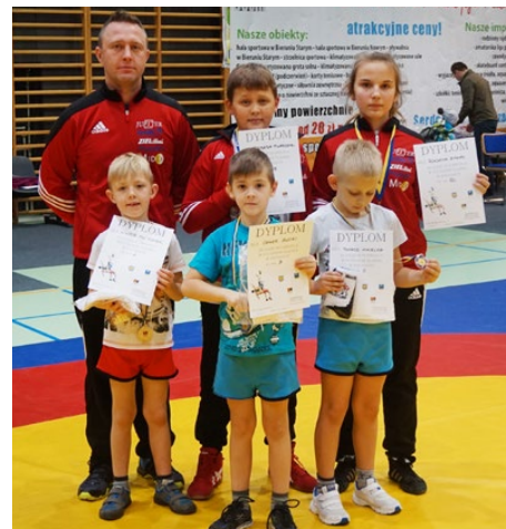
Młodzi zapaśnicy z gminy Psary wraz z trenerem po zawodach w Bieruniu