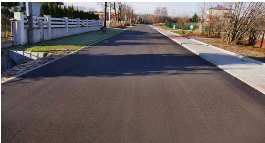
Nowy asfalt oraz chodnik na ulicy Szkolnej w Preczowie