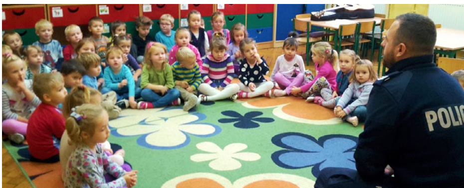
Spotkanie z policjantem

W październiku nasze przedszkole odwiedził policjant z Powiatowej Komendy w Będzinie. Zapoznał on dzieci z wykonywanym zawodem, wyjaśnił dokładnie na czym polega praca funkcjonariusza Policji. Pokazał również wszystkie niezbędne elementy stroju policjanta, jak również przedmioty wykorzystywane w jego pracy. Stróż porządku mówił również o właściwym zachowaniu się na chodniku, bezpiecznym przechodzeniu przez ulicę, znajomości podstawowych znaków, w tym o sygnalizacji świetlnej. Są to umiejętności, dzięki którym dziecko staje się uczestnikiem ruchu drogowego. Od takiej wiedzy może zależeć także jego