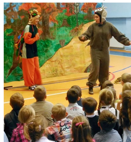
Przedstawienie Kolczasta przyjaźń