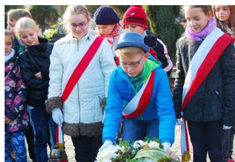
Przy grobie patrona

Przełom października i listopada to szczególny okres – czas refleksji i zadumy. Wraz z wirującymi nad naszymi głowami kolorowymi liśćmi, pojawia się zaduma nad tym co ulotne, przemijające a także trwałe i wartościowe. Bardzo ważne jest, aby zachować ciągłość tradycji, by zachować w pamięci to co cenne, by poznawać przeszłość bezpośrednio od tych którzy ją pamiętają.