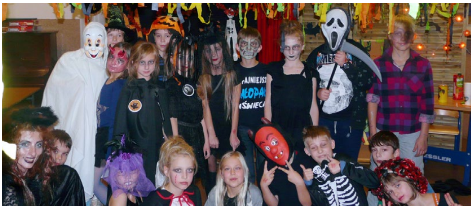
Halloween w wykonaniu uczniów

Koniec października to czas, gdy nasi uczniowie na wesoło poznają tradycję i kulturę krajów angielskiego obszaru. Jedną z nich jest Halloween – celtycki