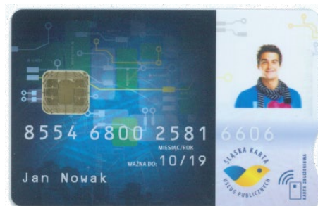
Przykładowa Śląska Karta Usług Publicznych w wersji spersonalizowanej

Przed pierwszym użyciem kartę należy zasilić wybraną kwotą. Polega to na przelaniu na konto karty wybranej sumy. Pieniężmi tymi będzie można płacić m.in. za przejazd, parkowanie, bilet okresowy, dokonać opłat w Punktach Obsługi Klienta, Punktach Obsługi Pasażera, automatach ŚKUP czy używać jej w instytucjach akceptujących płatności kartą ŚKUP. Kartę zasilić można w Punktach Obsługi Klienta, Punktach Obsługi Pasażera, poprzez stacjonarny automat oraz Portal Klienta. W POP, POK i w automacie kartę można doładować gotówką i kartą płatniczą. W Portalu Klienta