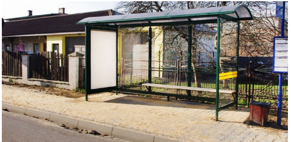
Nowa wiatę przystankowa oraz chodnik na ul. Malinowickiej w Psarach

Największe postępy przy budowie chodników widać w Psarach przy ul. Malinowickiej, gdzie kostką betonową został wyłożony fragment od kwaciarni do przystanku przy ul. Wiejskiej, a przy ulicy Malinowickiej zamontowano także nową podświetlaną wiatę przystankową. Prace uzupełniające prowadzone są na ul. Belnej w Strzyżowicach. W Preczowie przy ul. Wiejskiej (fragment od skrzyżowania z ul. Polną do posesji nr 16) wykonywana jest podbudowa pod chodnik. Natomiast w Brzękowicach Górnych powstaje odwodnienie drogi powiatowej w postaci 235 m.b. kanalizacji deszczowej zlokalizowanej na tzw. „Gościńcu”. Roboty związane z odwodnieniem prowadzone są również przy tamtejszej remizie, dzięki czemu wody opadowe nie będą już spływać na teren wokół obiektu oraz drogę polną za nim. Oprócz tego wybudowano już większość chodników wraz z odwodnieniem w Górze Siewierskiej na ul. Kościuszki (fragment od skrzyżowania z drogą wojewódzką nr 913 do rejonu posesji nr 2). Trwają