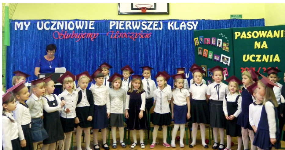
Pierwszoklasiści ze Szkoły Podstawowej w Gródkowie

27 października 2015 roku w Szkole Podstawowej im. Emilii Gierczak w Gródkowie odbyło się uroczyste pasowanie na ucznia.