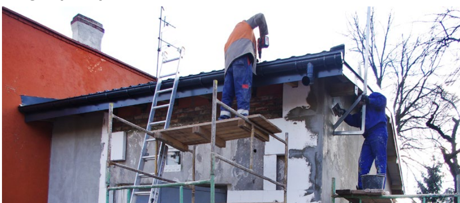
Instalacja ocieplenia na budynku gołębiarzy w Sarnowie

Kolejną inwestycją jest rozbudowa pomieszczeń socjalnych dla OSP w Dąbiu – część obiektu znajdująca się przy garażach remizy zostanie przebudowa-