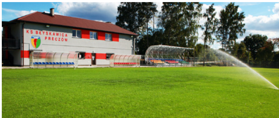
Nowa murawa na stadionie LKS Błyskawica Preczów

Kolejnym etapem była więc generalna renowacja płyty boiska, która znajdowała się w bardzo złym stanie. Dlatego też pod koniec 2014 roku zlecono firmie Szkołka Drzew Jacek Wolny kompleksową renowację murawy. Zakres robót objął m.in. rozdrobnienie istniejącej nawierzchni, niwelację nierówności, rozścielenie ziemi oraz instalację elektronicznie sterowanego systemu na-