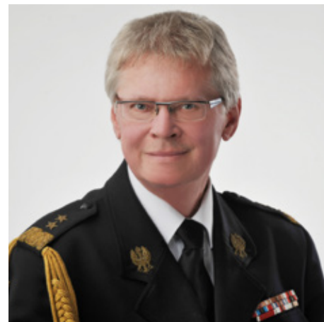
Gen. Zbigniew Meres

ale nie tylko. Na terenie naszego województwa działa 101 orkiestr OSP. Jest to prężny, bardzo szeroki, prospołeczny i artystyczny ruch. Organizujemy przeglądy orkiestr dętych i zespołów artystycznych OSP. Mamy też olbrzymie osiągnięcia w działalności kulturalno-wychowawczej. Takim ważnym przedsięwzięciem przy-