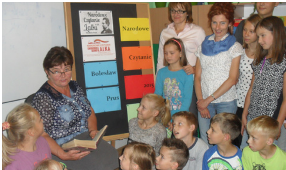
Ogólnopolska akcja „Narodowe Czytanie”

Jeśli masz ochotę poczytać razem z nami – zapraszamy do szkolnej biblioteki. Miłośnicy czytania SP Dąbie