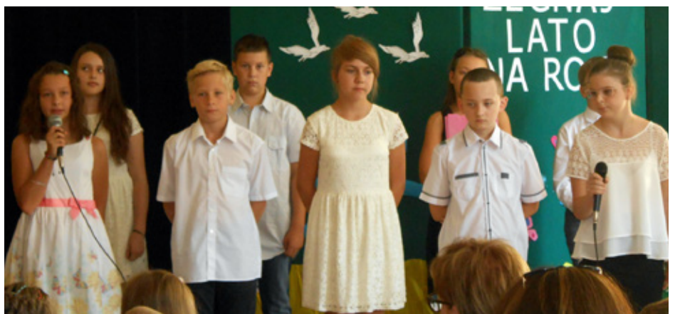
Przedstawienie pod hasłem „Żegnaj lato na rok”

Cudownie było porozmawiać z koleżankami i kolegami o spędzonych wakacjach i planach na ten rok. Choć wiele osób z przerażeniem patrzy na plan lekcji kojarzący się z mrocznymi jak