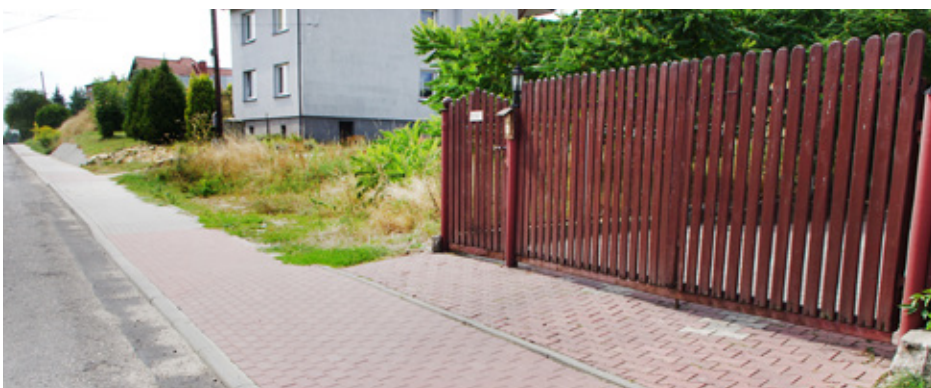
Gmina Psary sfinansuje budowę podobnych chodników jak ten na ul. 1 Maja

• Budowę chodnika wraz z odwodnieniem od przystanku autobusowego na ul. Malinowickiej (przy kwiaciarni) do przystanku na ul. Wiejskiej (przy sklepie spożywczym);