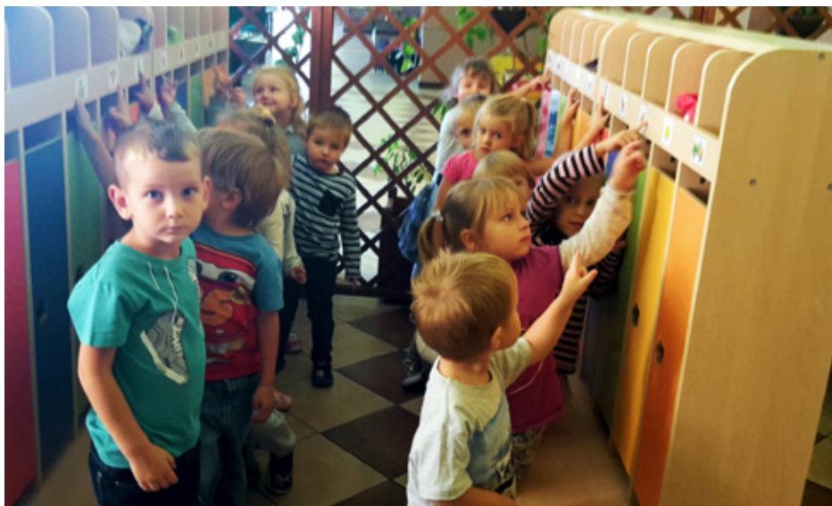
Uczymy ładu i porządku