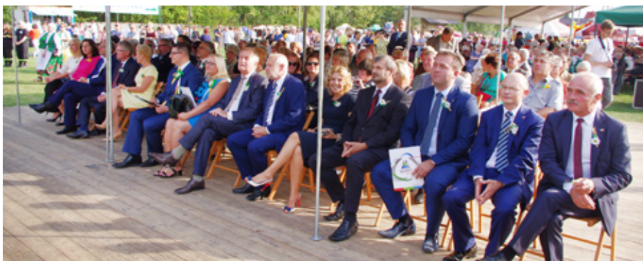
Licznie zgromadzeni na Gminnych Dożynkach goście