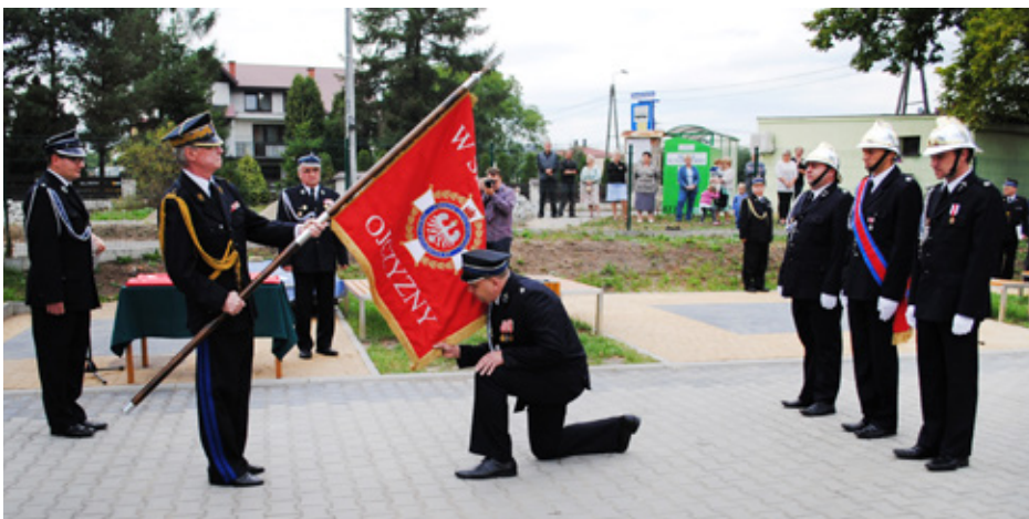
Przekazanie sztandaru OSP Preczów podczas jubileuszu