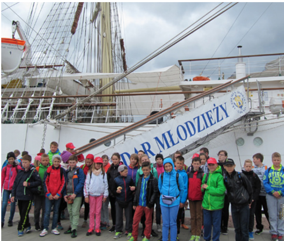
Wspomnienia z zielonej szkoły

Codziennie spacery brzegiem morza i zajęcia rekreacyjne na świeżym powietrzu doskonale wpływały na nasze samopoczucie. Program pobytu został tak przygotowany, że nie było czasu na nudę. Wycieczka do Ocean Parku we Władysławowie przeniosła wszystkich w świat stworzeń żyjących w morzach i oceanach. Odwiedziliśmy też strusią fermę, gdzie mieliśmy możliwość skosztowania jajecznicy przygotowanej ze strusiego jajka. Przewodnik na zamku w Malborku wprowadził nas w czasy średniowiecznych rycerzy zakonu krzyżackiego. Wiele wrażeń dostarczyły wycieczki do Gdyni, Sopotu oraz na Półwysep Helski. W Gdyni dzieci zwiedziły okręt wojenny ORP BŁYSKAWICA, widziały żaglowiec DAR POMORZA, w Sopocie mogły przespacerować się po najdłuższym polskim molo. Ciekawą lekcją przyrody okazał się pobyt na Półwyspie Helskim w Fokarium. Poznawaliśmy ciekawostki najbliższej okolicy: Lisi Jar, latarnię