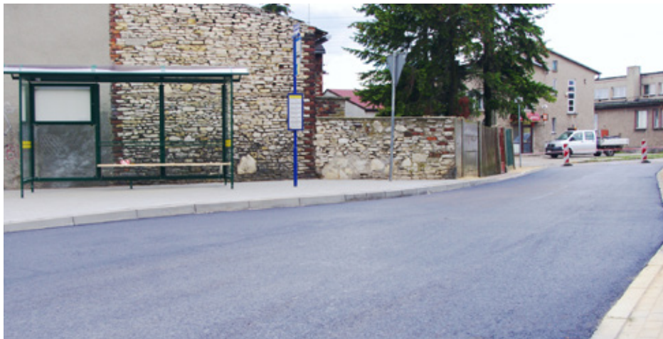
Gotowy łącznik drogowy w Górze Siewierskiej

Wyłoniona w drodze zapytania ofertowego firma Usługi Remontowo-Budowlane z Zawiercia z końcem września zakończyła prace drogowe w Malinowicach na ulicy Zielonej oraz w Górze Siewierskiej na odcinku łączącym ul. Kościuszki z i ul. Szopena.