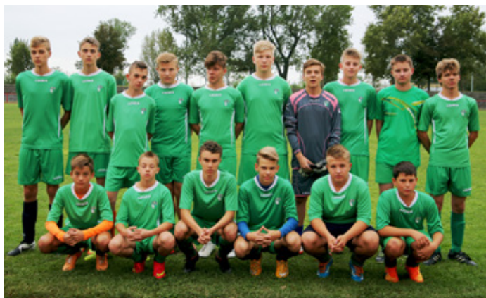
Młodzi reprezentanci gminy Psary na Węgrzech

Współfinansowany w ramach unijnego programu „Europa dla obywateli”