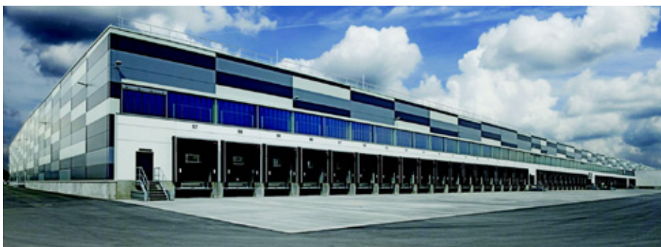
Podobny magazyn Lidla ma stanąć w Gródkowie

Przypomnijmy, że 29 sierpnia firma LIDL Polska Sp. z o.o. nabyła od Agencji Nieruchomości Rolnych Skarbu Państwa z siedzibą w Opolu ponad 19 ha terenu przeznaczonego w miejscowym planie