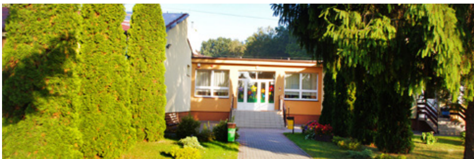
Największy projekt budowlany dotyczy szkoły w Gródkowie, gdzie powstanie dokumentacja na budowę nowej sali gimnastycznej oraz rozbudowę części przedszkolnej

Drugie zadanie projektowe dotyczy budowy sali gimnastycznej wraz z łącznikiem i zapleczem oraz rozbudowy szkoły podstawowej w Gródkowie. Plany obejmujące część z infrastrukturą sportową obejmą projekt nowej hali o powierzchni placu gry od 400 do 540 m 2 , w której wpisane zostaną w pełni wyposażone boiska do piłki siatkowej, koszykówki, badmintonu oraz tenisa ziemnego. Ponadto sala będzie posiadała automatycz-