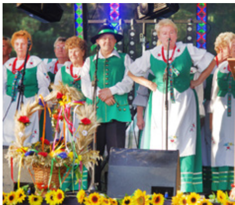
Występ zespołu „Górzanie”