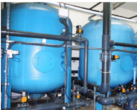
Stacja uzdatniania wody w Malinowicach

W tym roku Zakład Gospodarki Komunalnej w Psarach realizuje rekordową ilość inwestycji wodno-ściekowych. W czerwcu, na mocy uchwały Rady Gminy, rozszerzono też zakres obowiązków zakładu o szereg zadań związanych głównie z utrzymaniem porządku m.in. na drogach, chodnikach, placach, obiektach sportowych itp.