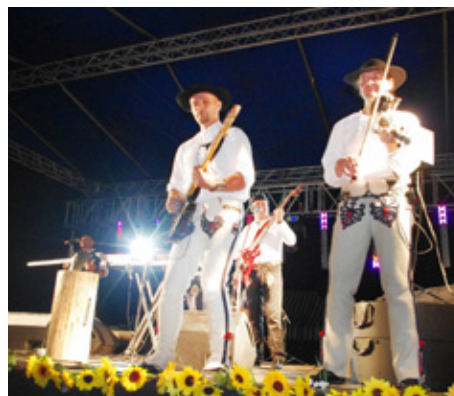
Występ zespołu „Baciary”