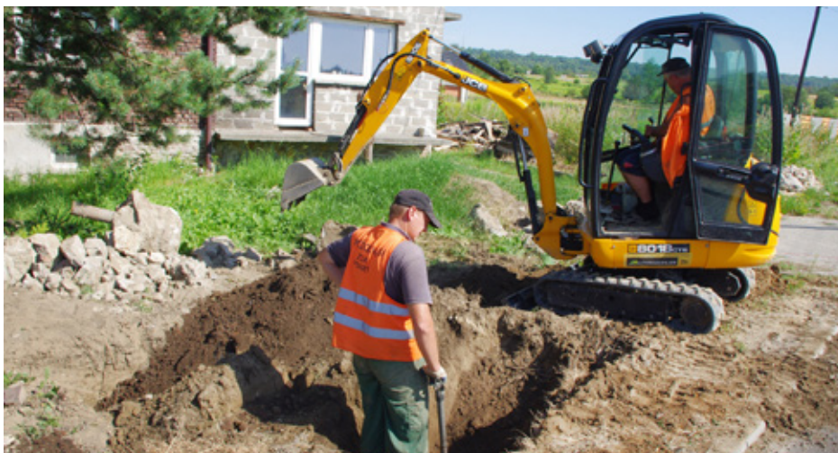
Jedne z wielu prac ziemnych prowadzonych przez ZGK

ZGK własnymi siłami wykonał w tym roku także kilka innych ważnych inwestycji, m.in.: 1) W Psarach i Gródkowie przy ul. Wspólnej wymieniono 800 mb. wodociągu stalowego o średnicy 150 mm na wodociąg z tworzywa PE Ø 160 mm wraz z 16 przyłączami do budynków mieszkalnych i 4 hydrantami; 2) Wybudowano wodociąg PE Ø 110 mm o dł. 320 mb. na ul. Nowej w Sarnowie; 3) Wymieniono przyłącze wodociągowe na rury PE Ø 50 w ilości 40 mb. w Powiatowym Zarządzie Dróg w Rogoźniku przy ul. Węgroda; 4) W Strzyżowicach przy ul. Szosowej przebudowano 70 mb. starej instalacji stalowej na wodociąg PE Ø 110 mm wraz z tzw. przepinką 3 przyłączy do budynków mieszkalnych; 5) Wymieniono stalowe przyłącze wodociągowe do Szkoły Podstawowej w Dąbiu na nowe rury PE Ø 63 w ilości 85 mb.; 6) W Sarnowie przy ul. Parkowej położono 100 mb. wodociągu PE Ø 63 mm w miejscu dawnej instalacji stalowej, wykonano także przepinkę 3 przyłączy do budynków mieszkalnych; 7)