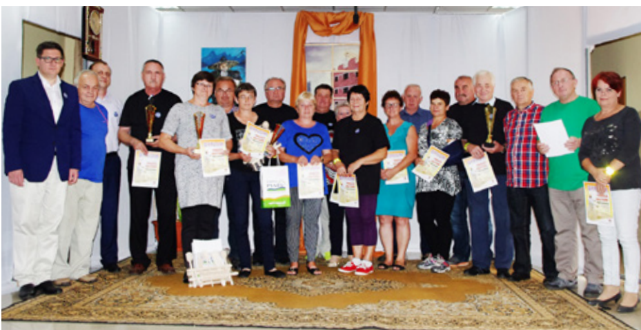
Wójt gminy Psary oraz Radny z Preczowa wraz z sołtysami

Na turnieju sołtysi musieli wykazać się nie lada zręcznością. Wśród zadań znalazł się między innymi rzut beretem na odległość czy gumakiem do kosza. Po tych konkurencjach w sali remizy OSP w Preczowie na sołtysów czekał sprawdzian wiadomości z zakresu BHP przeprowadzony przez KRUS. Po