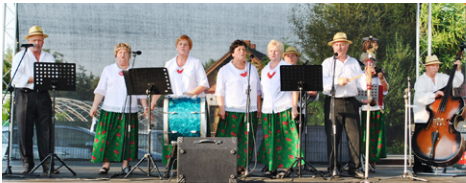
Występ zespołu śpiewaczego „Od... do...” z Preczowa

Podsumowaniem tego święta była zabawa taneczna trwająca do późnych godzin wieczornych. GOK.