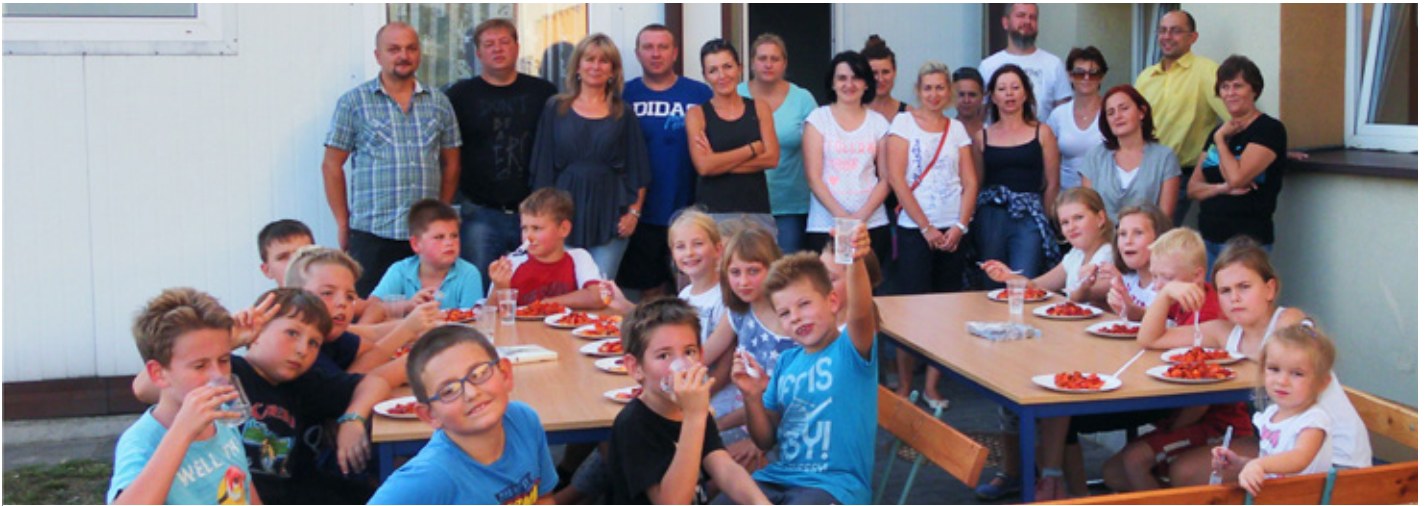
Święto pieczonego ziemniaka

Trudno było nam uwierzyć, że to ostatnie dni lata. To ostatnie chwile, by zrelaksować się w ciepłych promieniach słońca.