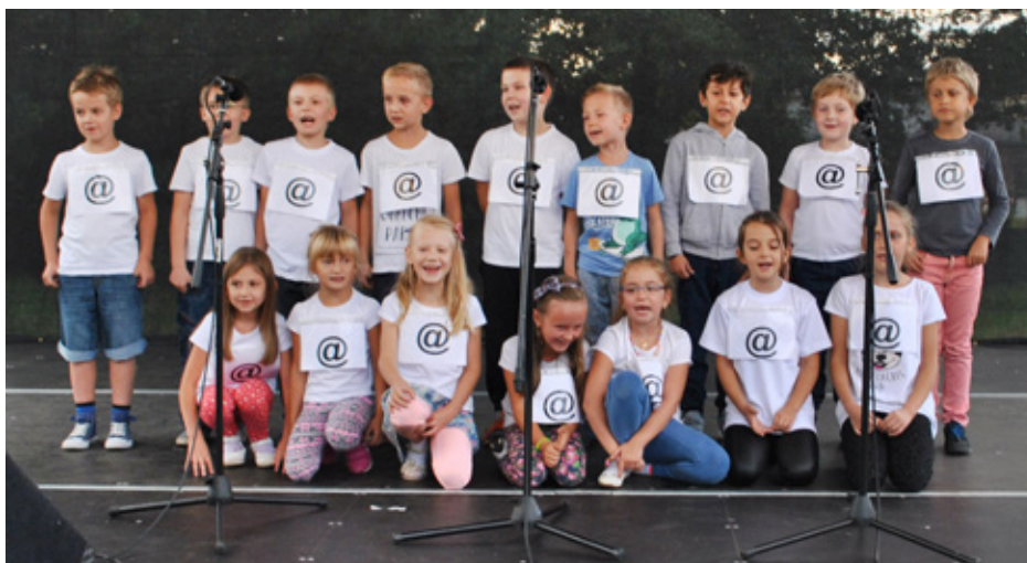
Występ uczniów ze SP Strzyżowice