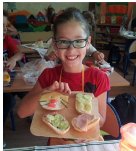
Po takim śniadaniu nauka pójdzie jak z płatka

Szkolny Dzień Drugiego Śniadania okazał się bardzo ciekawym doświadczeniem. Wspólny posiłek dodał nam energii do nauki i zabawy na cały szkolny dzień, zaspokoił zapotrzebowanie na witaminy i minerały oraz wzmocnił organizm. Ponadto wspólne śniadanie zintegrowało klasowe zespoły, nauczyło nas wzajemnego dzielenia się oraz ogłady i dobrych manier przy stole. Dla młodszych dzieci było również lekcją samodzielności.