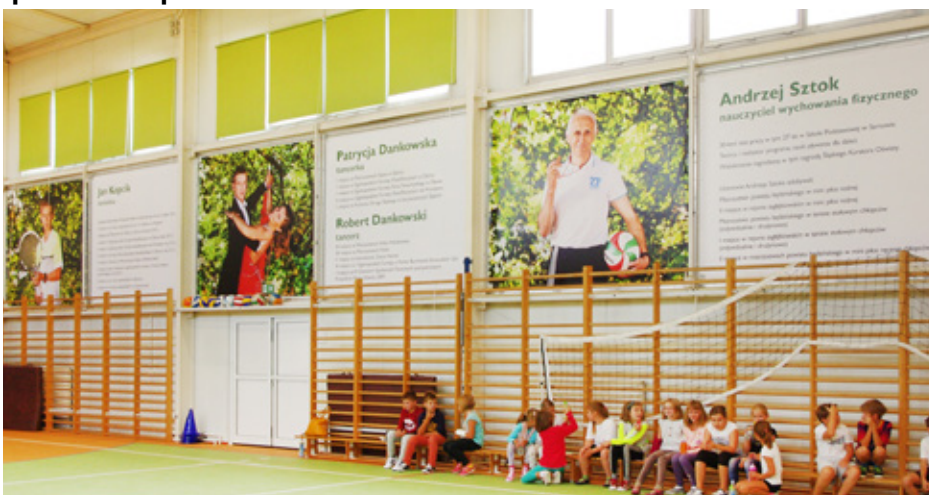
Sala gimnastyczna w Sarnowie z ekspozycją

Duże, kolorowe i bardzo dobrze wyeksponowane fotografie oraz napisy, które zdobią wyremontowaną w te