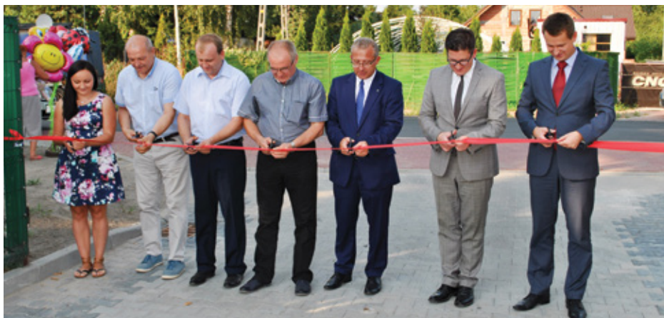
Uroczyste przecinanie wstęgi na otwarciu obiektu

Po części oficjalnej pikniku nadszedł czas na artystyczną. Rozpoczęły ją występy artystyczne zespołów z terenu gmin Siewierz i Psary. Przed publicznością zaprezentowały się: „Od Do” Preczowa, Zespół Śpiewaczy „Dąbie”, Zespół KGW Leśniaki, Zespół KGW Żeliszawice, Chór Męski z Żeliszawic oraz młodzież solist-