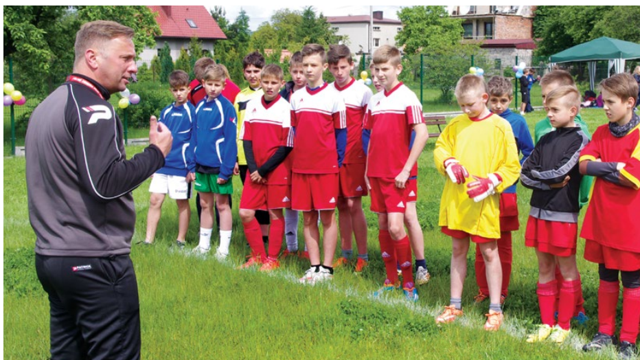
Trener drużyny Zagłębie Sosnowiec przeprowadził trening pokazowy z młodymi piłkarzami ze Szkół Podstawowych w gminie Psary

Dziękujemy również sponsorowi Bankowi Spółdzielczemu w Będzinie oraz pozostałym instytucjom z terenu gminy Psary, w szczególności: Gminnemu Ośrodkowi Kultury – za profesjonalną konferansjerkę i obsługę nagłośnienia, społecznością szkolnym ze Szkoły Podstawowej w Gródkowie, Szkoły Podstawowej w Dąbiu, Zespołowi Szkolno-Przedszkolnemu nr 1 w Strzyżowicach, Zespołowi Szkolno-Przedszkolnemu nr 2 w Sarnowie – za udział konkursach i rozgrywkach, nauczycielom za przygotowanie młodzieży, Urzędowi Gminy Psary oraz Kołu Gospodyń Wiejskich w Dąbiu. OPS Psary.