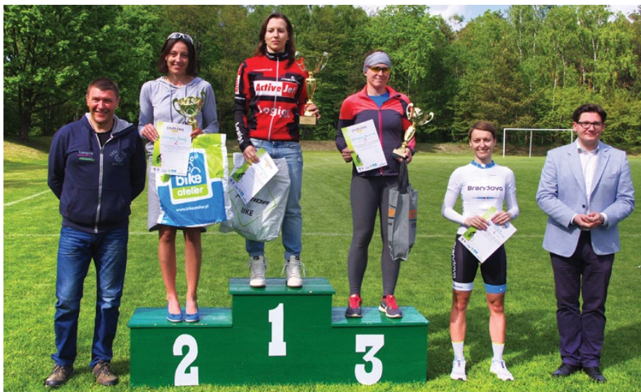
W tym roku w wyścigu wzięła udział rekordowa ilość dorosłych amatorów i kolarzy

wyścigu było pokazanie piękna tej dyscypliny oraz promowanie sportu w codziennym życiu. Rosnące zainteresowanie rywalizacją w naszym konkursie potwierdziło, że to, co robimy od tylu lat przynosi