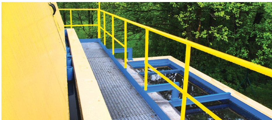
Wyremontowane piętro w oczyszczalni ścieków w Malinowicach

W maju zakończono również wymianę wodociągu w ulicy Wspólnej w Gródkowie. Siłami pracowników ZGK w Dabiu wymieniono 600 mb wodociągu z rur PE Ø 160 mm oraz przełączono 17 przyłączy wodociągowych do budynków mieszkalnych. Red.