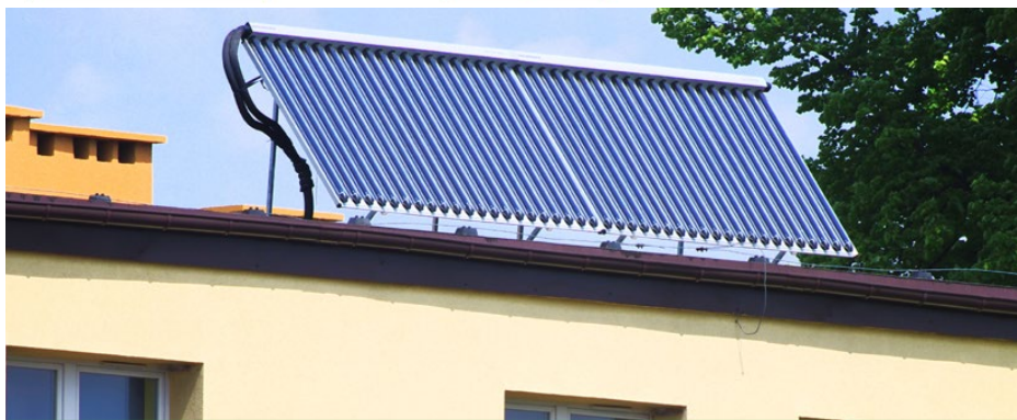
Instalacja solarna na dachu Przedszkola Publicznego w Strzyżowicach

Na dachu przedszkola zamontowano dwa słoneczno-wodne kolektory rurowe o powierzchni 7.82 m 2 , które wyłapują promienie światła i gromadzą w ten sposób energię przetwarzaną następnie na energię cieplną. W stryżowickiej placówce instalacja współpra-