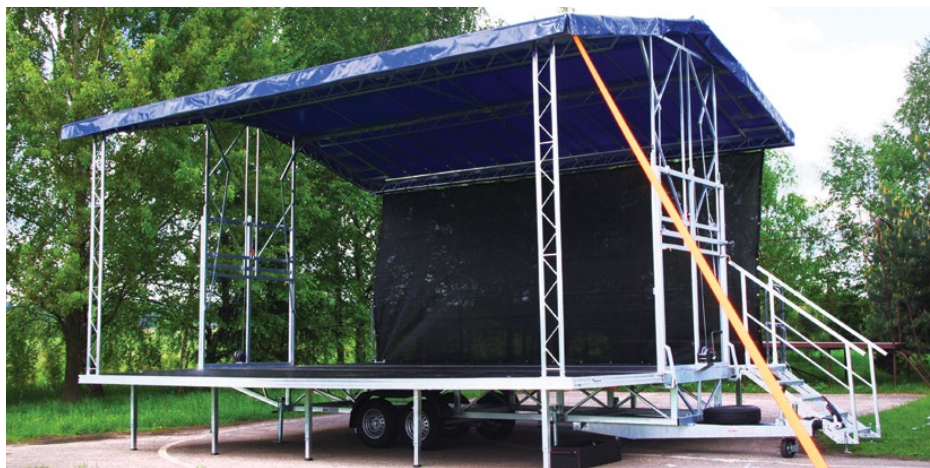
Przenośna scena zakupiona z unijnym dofinansowaniem

Zakupiona przy 85% unijnej dotacji scena to bardzo praktyczne urządzenie. Ma wymiary 7,5 na 6 metrów. Można ją holować samochodem, ponieważ jej po-