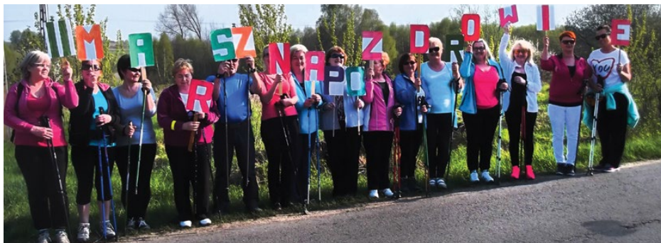
Uczestnicy Marszu po zdrowie

II Gminny Marsz za nami... Było przepięknie! Pogoda jak na zamówienie, dobre humory, wola sportowego zaangażowania. Tak grupa entuzjastów nordic walking rozpoczęła „sezon kijkowy”.