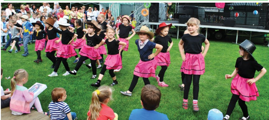
Występy podczas Dnia Dziecka

oraz Rehabilitacji św. Łukasza, gdzie rodzice mogli wykonać podstawowe badania stopy oraz postawy dziecka. Ponadto w ciągu całego popołudnia dzieci były obdarowywane słodkościami i kolorowymi balonami przez kroczących po stadionie szczudlarzy.