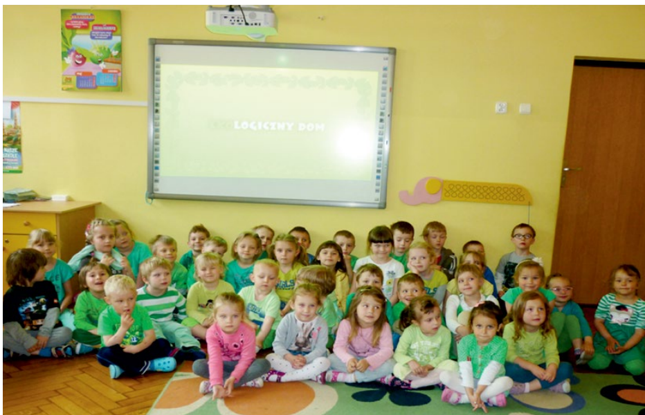
Przedszkolaki podczas świętowania

Głos Szkolny jest dodatkiem do Głosu Gminy Psary redagowanym przez uczniów: