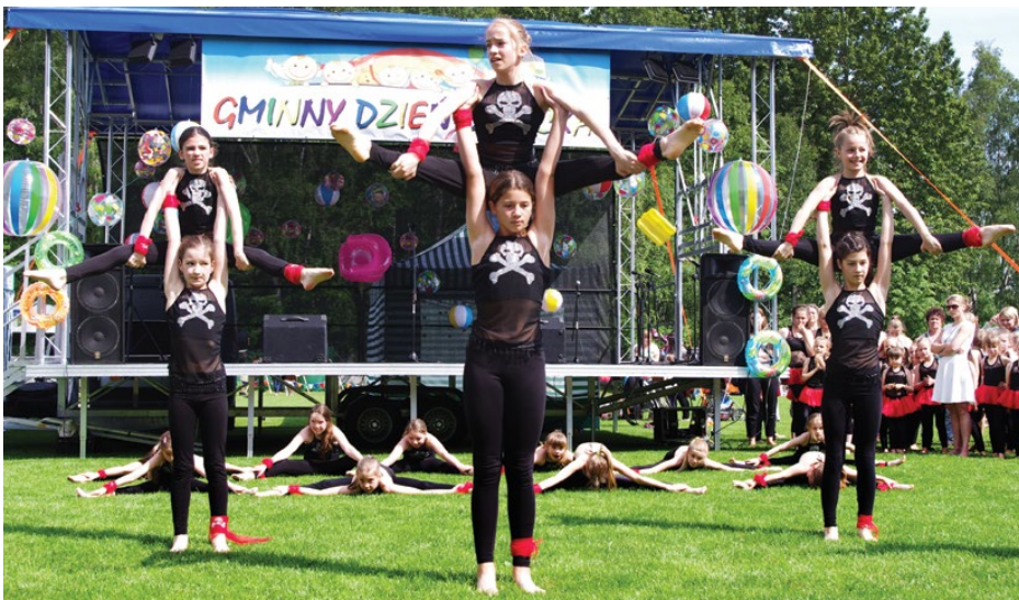
Goście mogli podziwiać popisy akrobatyki artystycznej

Wszystkie dzieci uczestniczące w tegorocznych obchodach mogły bezpłatnie korzystać z atrakcji takich jak: dmuchańce, zjeżdżalnie, karuzela, samochodziki elektryczne. Wielbiciele dzikiego zachodu mieli możliwość postrzelać z łuku, rzucić podkową, lassem czy spróbować swoich sił, jako poszukiwacze złota. Tegoroczny festyn wzbogaciły stoiska firmy Ziaja, prezentującej kosmetyki dla dzieci