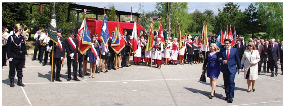
Przemarsz do sali bankietowej w Dąbiu

W swym wystąpieniu Wójt Gminy Psary odniósł się do chlubnych tradycji demokracji, uchwalonej konstytucji i nawiązał do obecnych czasów oraz bieżących przedsięwzięć gminy. Po części oficjalnej goście zostali zaproszeni przez Wójta na poczęstunek przygotowany przez Gminny Ośrodek Kultury. Red.