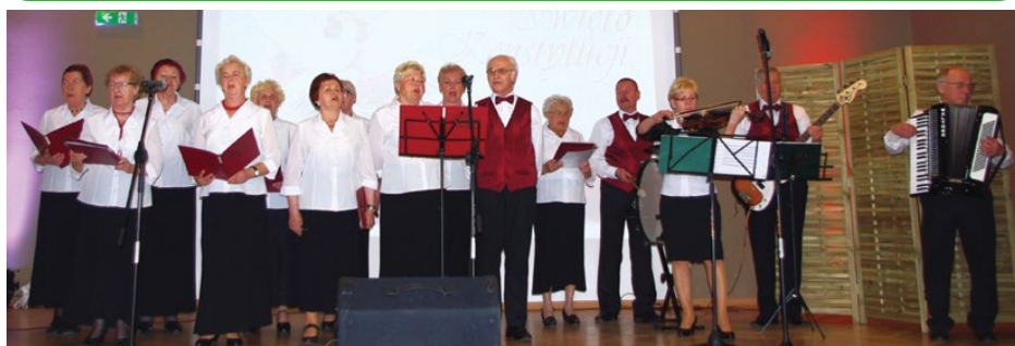
Występ zespołu „Nasz Gródków”

Wójt Gminy Psary serdecznie zaprasza na: spotkanie z Arturem Barcisiem, które odbędzie się 9 lipca 2015 r. o godz. 15:00 w sali bankietowej OSP Psary.