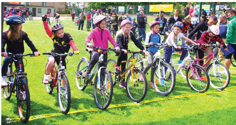
Najmłodszy ścigali się na murawie stadionu Iskry Psary

W tym roku do wyścigu zgłosiła się rekordowa liczba dorosłych amatorów i kolarzy Masters. „66 amatorów i 175 kolarzy zaawansowanych, którzy startowali na szosie w 12. edycji wyścigu to dla nas olbrzymi sukces. Głównym założeniem