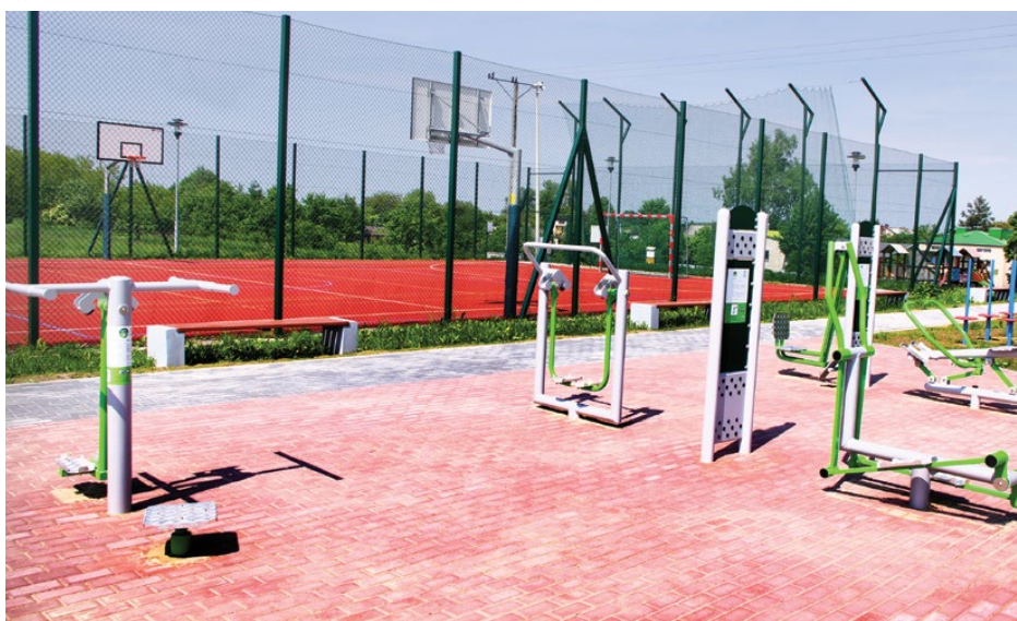
Nowa siłownia zewnętrzna przy boisku wielofunkcyjnym w Goląszy Górnej