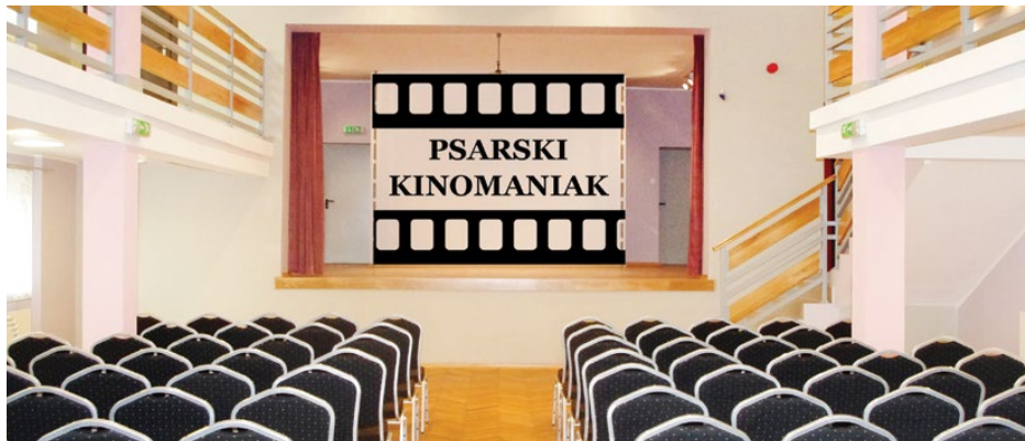
Spotkania psarskiego kinomaniaka odbędą się w sali bankietowej w OSP Psary

Pokazy filmowe w „Psarskim kinomaniaku” będą odbywały się cyklicznie w dobrze znanej i świetnie sprawdzającej się formule