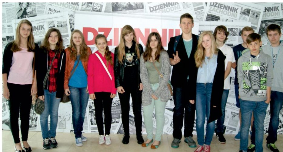
Gimnazjaliści w lokalnej redakcji Dziennika Zachodniego