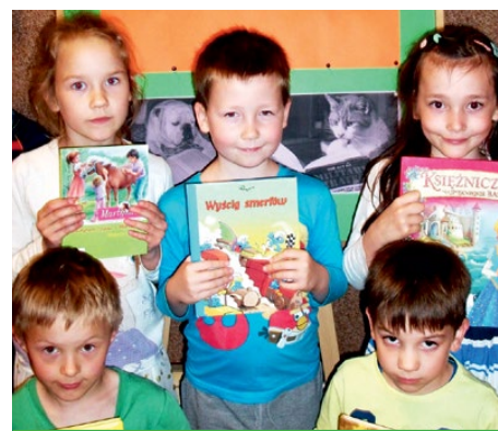
Dzieci ze swoimi książkami