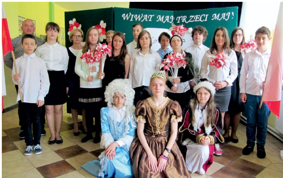
Uczniowie po występie z okazji 3-go Maja