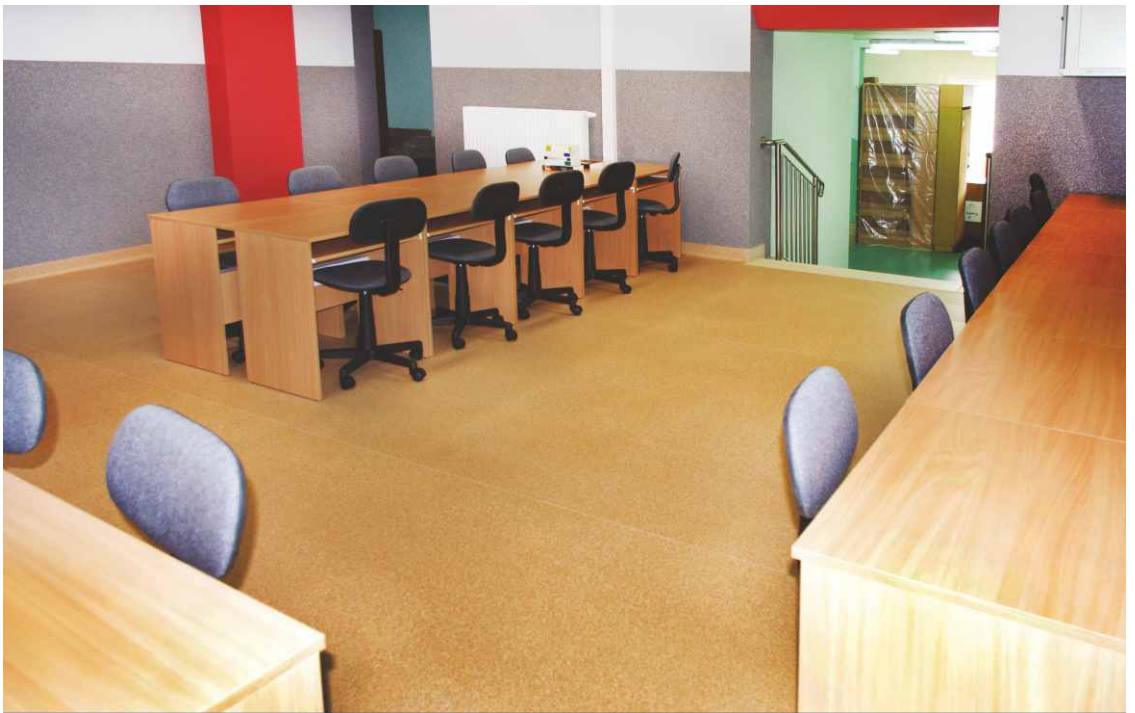
Pomieszczenie, w którym powstanie publiczny punkt dostępu do Internetu.

Rozbudowa biblioteki się zakończyła, ale to nie koniec prac budowlanych, pod koniec lutego zostanie poszerzona wnęka w sali głównej. Dzięki temu zabiegowi w jednym z pomieszczeń powstanie przestrzeń, w której zostaną postawione regały na książki, a bibliotekarz będzie mógł widzieć osoby korzystające z komputerów. Powstanie również bezpośrednie zejście do kotłowni z nowej klatki schodowej. Red.