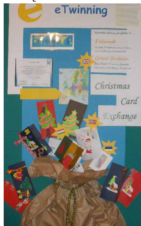
Wystawa kartek świątecznych