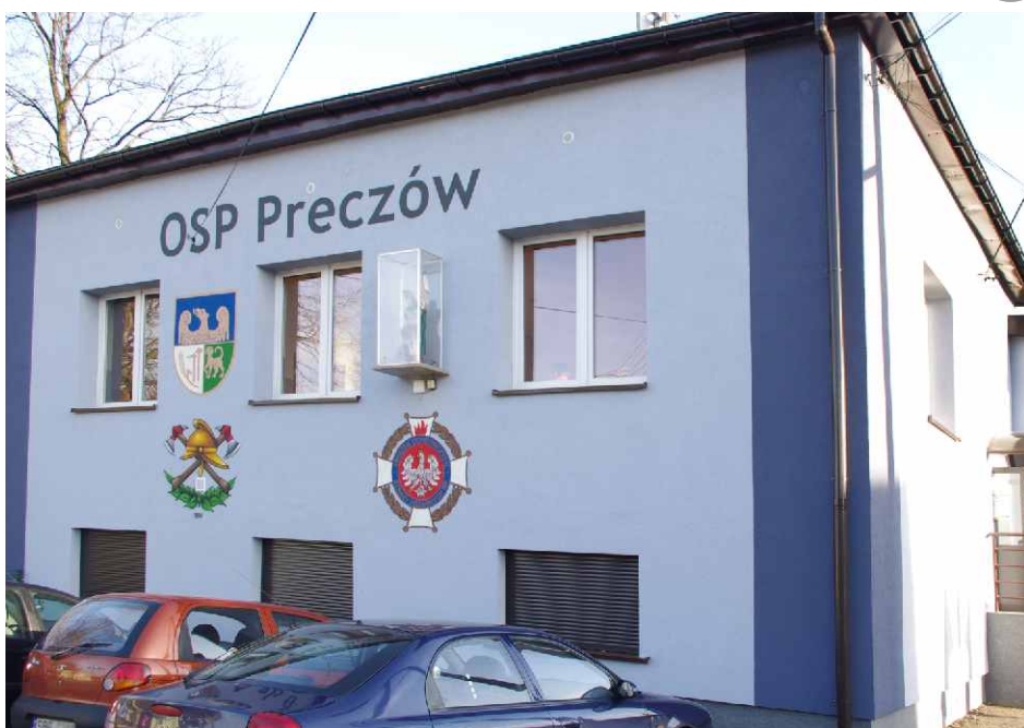
Budynek OSP w Preczowie po termomodernizacji w 2012 r.

Zmiany infrastruktury strażackiej nie były jedynymi inwestycjami w tę jednostkę. W 2012 r. OSP z Góry Siewierskiej wykonało karosację średniego wozu bojowego, na którą przekazano 60 000 złotych z budżetu gminy.