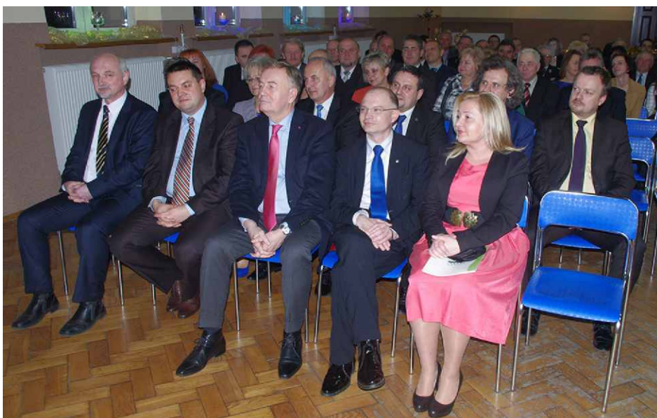
Goście na spotkaniu samorządowym w Gminnym Ośrodku Kultury w Gródkowie

W ubiegłym roku realizowanych było wiele interesujących projektów polegających na budowie obiektów sportowych. Powstał kompleks sportowo – rekreacyjny za Ośrodkiem Pomocy Społecznej w Psarach, dokończono budowę szatni Błyskawicy Preczów, wykonano nowoczesną podłogę