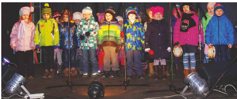
Zespół dziecięcy „Bongosiki”

Po muzyczno-tanecznych szaleństwach przyszedł czas na losowanie nagród. Jak co roku nie zawiedli nas ich sponsorzy, którzy hojnie przygotowali dla mieszkańców całkiem sporą pulę nagród, a tegoroczną edycję gminnego finału WOŚP wsparli: Salon fryzjerski "Oliwia", FHU Oliwia - Dąbie Chrobakowe, "Kwiaciarnia Floo-