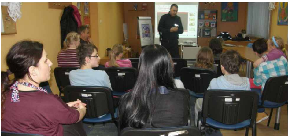
Prelekcja Policji o cyberprzemocy

Cyberprzemoc przejawia się dręczeniem poprzez komunikatory internetowe, fora dyskusyjne, SMS-y, e-maile czy też przez udostępnianie zdjęć, filmów w Internecie bez zgody osób na nich występujących. Stróże prawa tłumaczyli młodym ludziom, jak się przed nią chronić i jak na nią reagować. Bardzo dobrym przykładem była projekcja filmu animowanego, na którym pokazano jedną z form cyberprzemocy oraz różne modele