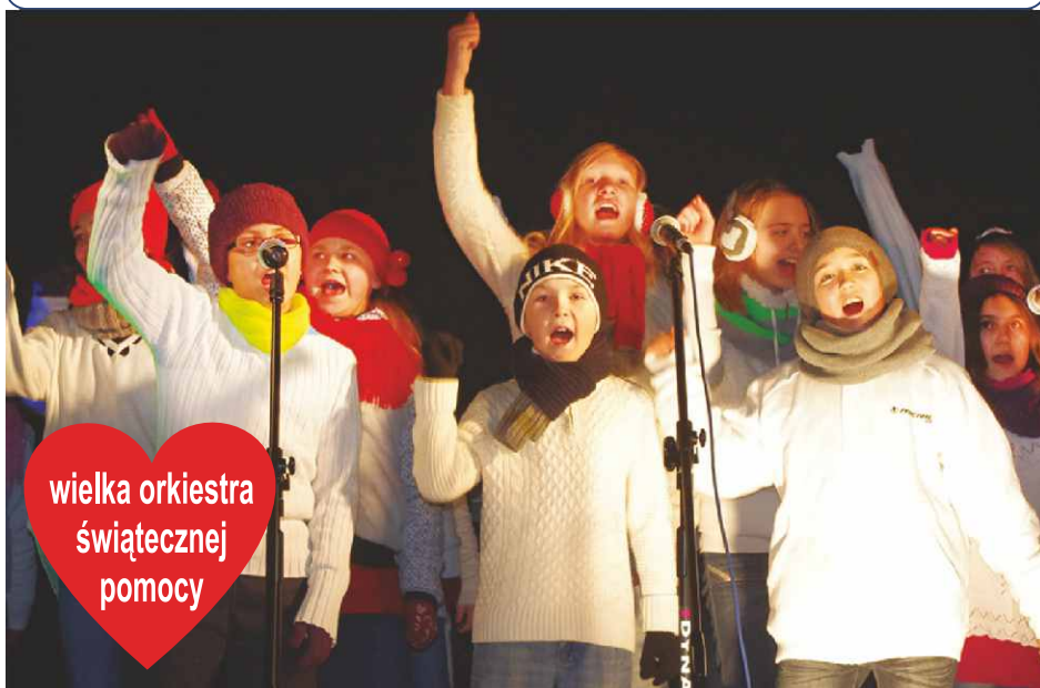
Występ uczniów ze Szkoły Podstawowej w Dąbiu