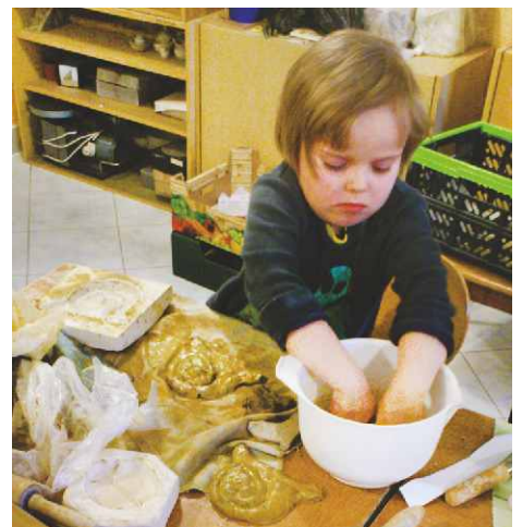
Jedna z najmłodszych uczestniczek podczas pracochłonnych zajęć

dzieci na zajęcia o kontakt pod numerem telefonu 32/267-22-59. GOK.