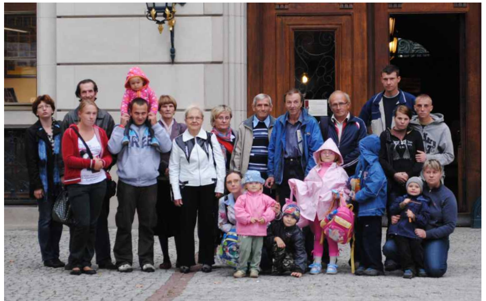
Uczestnicy projektu „Praca się opłaca” na wycieczce w Pszczynie