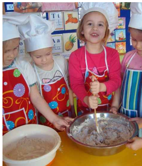
Zajęcia kulinarne, cieszą się powodzeniem wśród przedszkolaków.