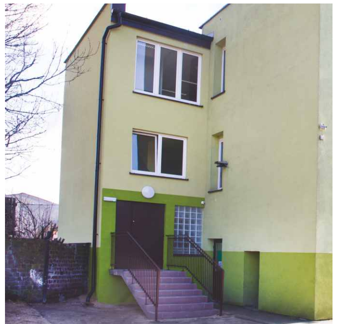
Nowe wejście i dobudowana klatka schodowa w budynku biblioteki w Psarach.