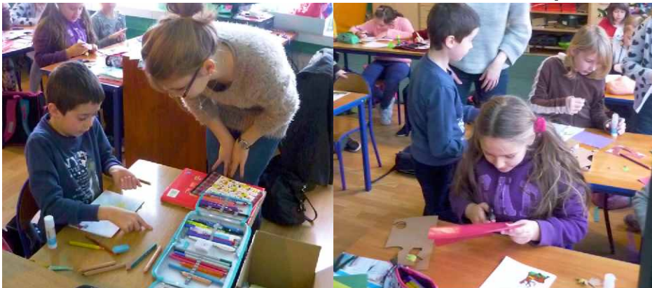
Intensywna i kreatywna praca podczas zajęć projektowych

Zespół Szkolno-Przedszkolny w Strzyżowicach nawiązał współpracę z przedstawicielami programu „Projektor – Wolontariat Studencki” z Katowic. Jest to już III edycja tego projektu w naszej szkole. W jego ramach studentki różnych kierunków urozmaicają nasze zajęcia świetlicowe. Tematyka zajęć bywa różnorodna – od zajęć plastyczno-technicznych, poprzez podróże po całym świecie, aż po zajęcia z kryminalistyki! Spotkania te są dla nas bardzo odkrywcze! Oby było ich więcej!