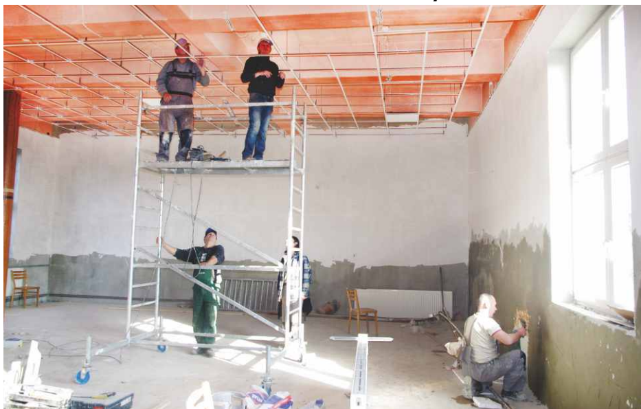
Montaż sufitu podwieszanego oraz oświetlenia.

Wspomniana sala już teraz diametralnie zmienia swój wygląd i coraz bliżej jej do nowoczesnego i bezpiecznego pomieszczenia rozrywkowego. Pracownicy brygady zdemontowali starą boazerię, wykonali całkowicie nową instalację elektryczną i rozpoczęli montaż podwieszanego sufitu na całej jego powierzchni. Dzięki temu możliwa będzie wymiana oświetlenia na sali na bardziej ekonomiczne i estetyczne; założono już