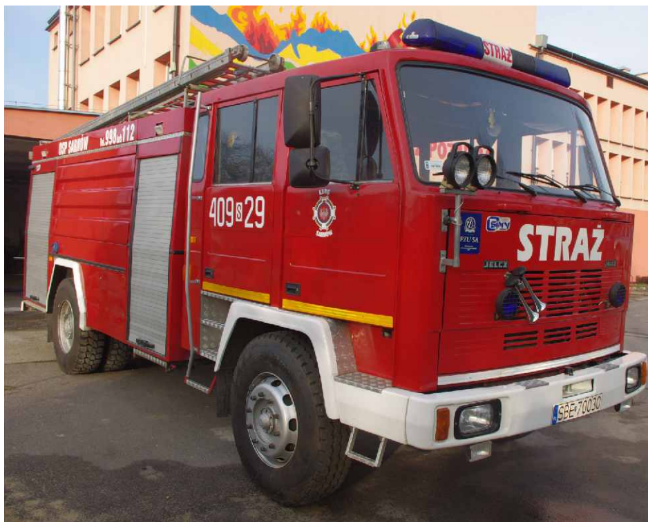
Wóz bojowy zakupiony do OSP Sarnów w 2013 r.

W 2012 r. został wykonany projekt budowlany placu przylegającego do remizy. Pierwszy etap tego zadania – zaplanowany jeszcze na ten rok – będzie polegał na budowie miejsc postojowych