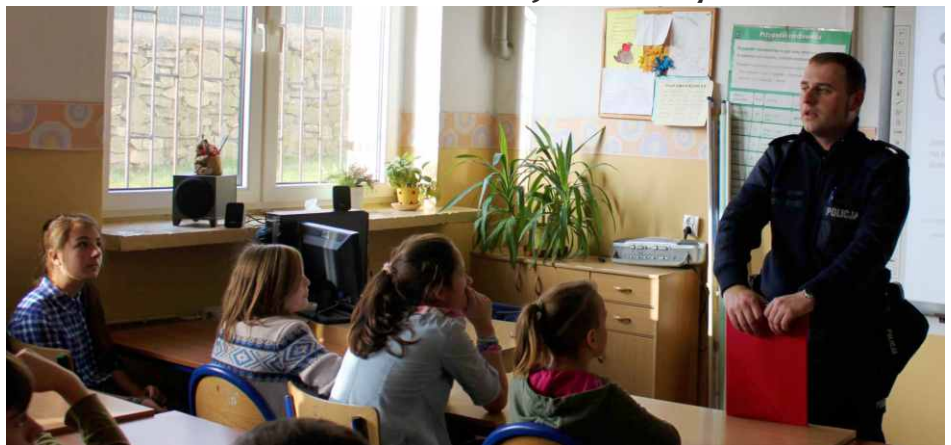
Uczniowie podczas policyjnej prelekcji

Głos Szkolny jest dodatkiem do Głosu Gminy Psary redagowanym przez uczniów: