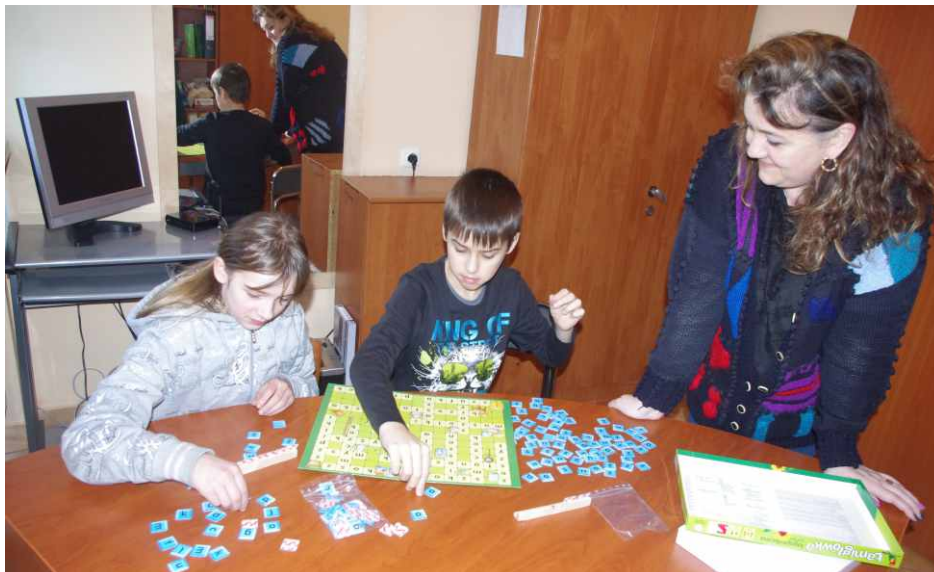
Zajęcia w Szkole Podstawowej w Sarnowie z wykorzystaniem pomocy dydaktycznych

Zaraz po feriach zimowych na uczniów szkół podstawowych z terenu naszej gminy czekały nowe zestawy ciekawych i rozwijających pomocy naukowych. Wśród zakupionych przedmiotów pojawiły się materiały do zajęć teatralnych, z których będzie budowana scenografia dla młodych aktorów. - Najbardziej wyczekiwany przez uczniów pomocami były gry edukacyjne, takie jak grzybobranie, łamigłówka, czy dźwiękowe sześciiany. W tej ostatniej grze zabawa polega na tym, że poszczególne gracze wybiera dwa dowolne pudełka i potrząsa nimi, jeśli dźwięk wyda mu się taki sam para jest jego. Takie ćwiczenia poprzez zabawę rozwijają zmysł słuchu, przez co dzieci