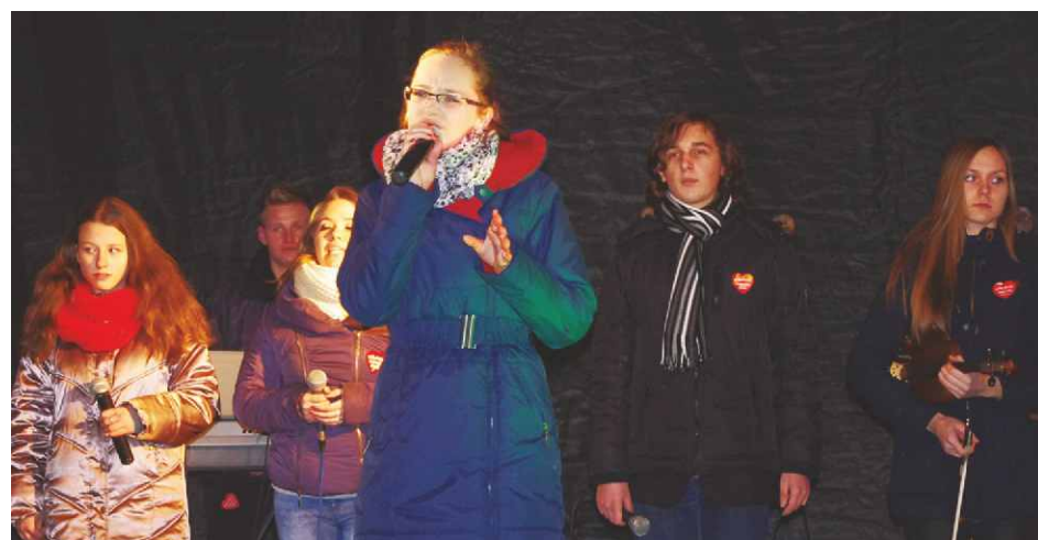
Występ zespołu „Talenty z gminy Psary”

Art", Restauracja „Zielony Gościniec”, Mariusz Cela Auto Klimatyzacja, Salon fryzjerski Olga z Psar, Salon Kosmetyczny Violet, Gospodarstwo Ogrodnicze Tadeusz Mularski, Salon Kosmetyczny „Twój Styl”, Bank Spółdzielczy w Psarach, Supermarket „Karolina”, Kwiaciarnia Pana Marka Łapanowskiego, Zakład Introligatorski