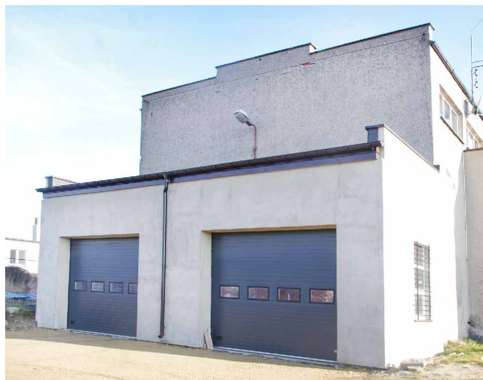
Dobudowane w 2013 r. garaże dla OSP w Górze Siewierskiej