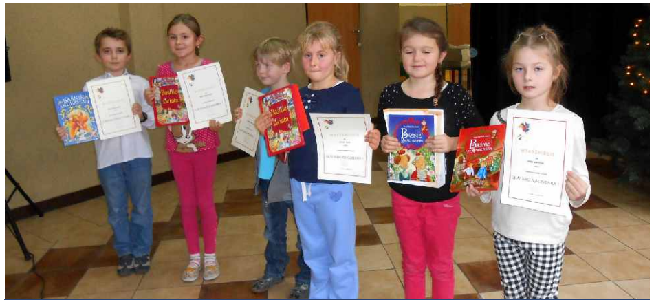
Laureaci konkursu pięknego czytania z Gródkowa.

W Szkole Podstawowej w Gródkowie zorganizowano Konkurs Pięknego Czytania dla uczniów klas I-III. Ma on na celu rozwijanie potrzeb czytelniczych uczniów, dbałość o kulturę słowa, kształcenie umiejętności pięknego czytania i rozumienia tekstu oraz stworzenie dzieciom możliwości prezentacji własnych umiejętności