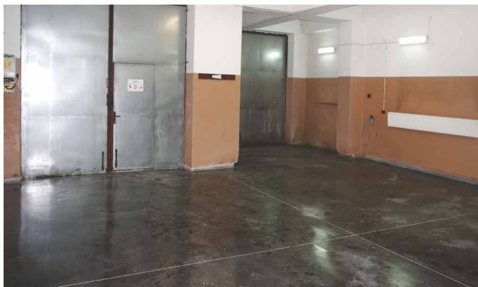
Nowa posadzka w garażu OSP Brzękowice - Goląsza.

Odrestaurowana i jednocześnie unowocześniona sala będzie, z pewnością, służyć mieszkańcom, instytucjom i firmom przy okazji organizacji wydarzeń rozrywkowych i oficjalnych spotkań. Red.