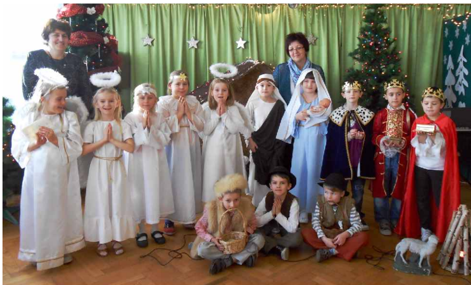
Jasełka w Szkole Podstawowej w Gródkowie

Przedstawienie przygotowane przez uczniów klasy II przywołało wspomnienie wydarzeń betlejemskiej nocy, a melodie wspólnie śpiewanych kolęd wprawiły wszystkich w świąteczny, bożonarodzeniowy nastrój. Mali aktorzy, nie okazując tremy, recytowali i śpiewali kolędy, budząc radość i wzruszenie u uczniów i pracowników szkoły. Przedstawienie zachwytiło widownię, która nagrodziła ich występ gorącymi brawami. Następnie