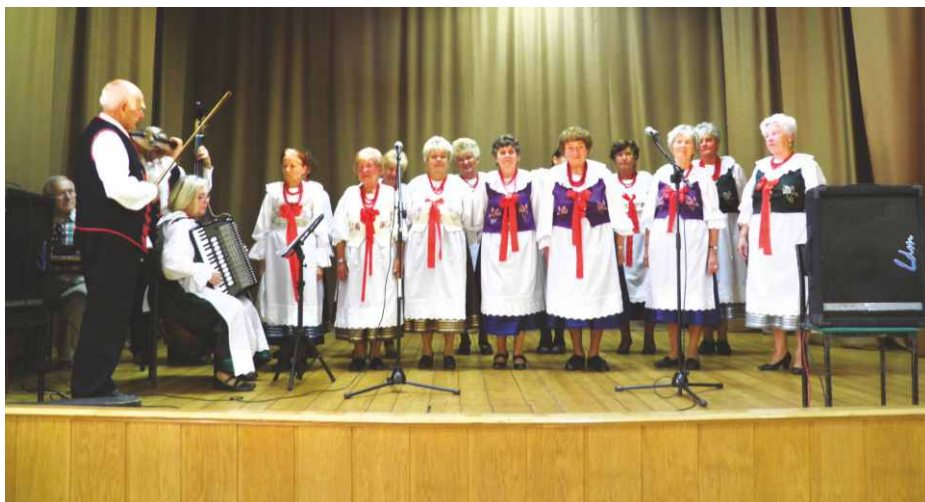
Występ Zespołu Śpiewaczego „Zagłębianki” na Święcie Chleba.