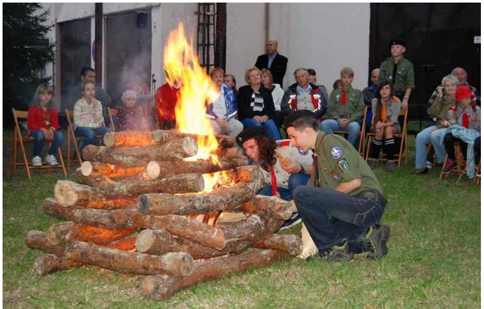
Wszyscy uczestnicy spotkania wspólnie śpiewając i tworząc okrag przesłali sobie symbolicznym gestem „ISKIERKĘ”.