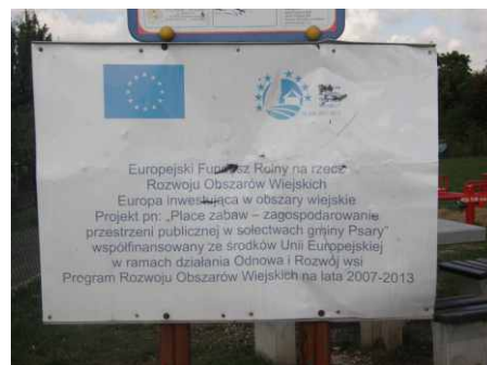
Zdewastowana tablica informacyjna placu zabaw w Goląszy Górnej.

Wszystkie te działania mają na celu ograniczenie aspołecznych zachowań oraz dewastacji naszego wspólnego mienia. Jednak zdajemy sobie sprawę, że działania te są niewystarczające,