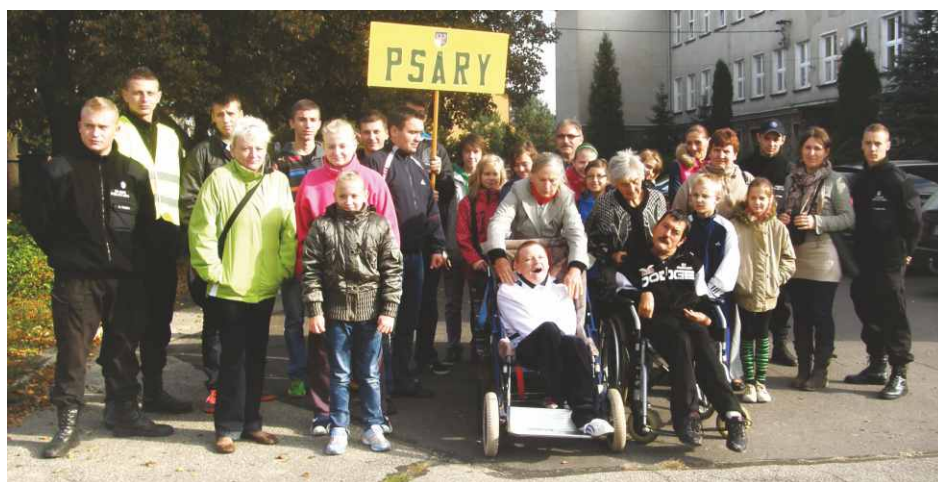
Uczestnicy X Powiatowej Olimpiady Osób Niepełnosprawnych z gminy Psary.

Dziękujemy organizatorom - Stowarzyszeniu Osób Niepełnosprawnych „Szansa” w Będzinie, Powiatowemu Centrum Pomocy Rodzinie w Będzinie, Starostwu Będzińskiemu za zaproszenie. OPS Psary.