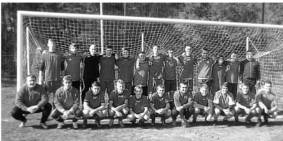
Wspólne zdjęcie zawodników startujących w meczu przyjaźni.