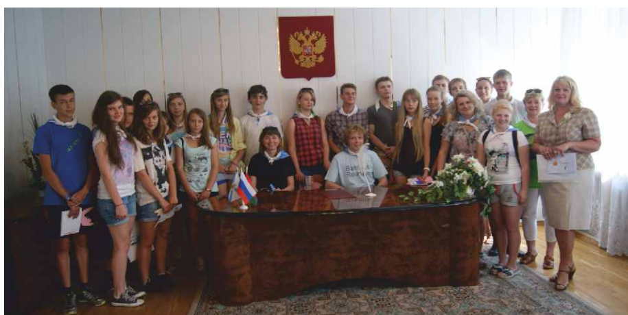
Wizyta w Urzędzie Miasta Kariażmy