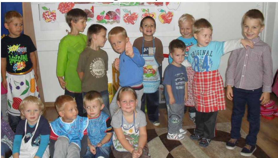
Grupa 4 i 5 -latków z Dąbia.

Po przebraniu się w fartuszki oraz wyszorowaniu rącek, przystąpiły do pracy. Każdy przedszkolak wcielił się w rolę małego kucharza. Wszystkie owoce zostały porządnie umyte i obrane ze skórek (trochę pomagały panie), a następnie przedszkolaki samodzielnie je kroili i łączyły ze sobą. Przygotowanie sałatki dało dzieciom wiele satysfakcji i radości. Był to znakomity i bardzo zdrowy deser, a przedszkolaki chętnie sięgały po kolejne porcje. SP Dąbie.