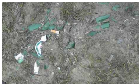
Rozbita butelka na placu zabaw w Sarnowie.

W ostatnich miesiącach do Urzędu Gminy Psary wpłynęło bardzo dużo zgłoszeń o nagminnym spożywaniu alkoholu na placach zabaw, do którego głównie dochodzi na obiektach w Goląszy Górnej i Sarnowie. Młodzież, która wieczorami przychodzi na place zabaw zachowuje się głośno, wulgarnie i agresywnie, zakłócając tym samym spokój osobom mieszkającym w pobliżu obiektu. Niestety skutkami odbywających się spotkań alkoholowych jest również zaśmiecony