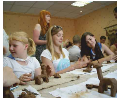
Warsztaty lepienia z gliny w ośrodku młodzieżowym „Rodina” w Kariażmie