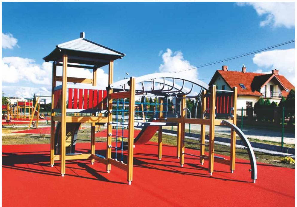
Urządzenia zabawowe na placu zabaw za Ośrodkiem Pomocy Społecznej w Psarach.

Na obiekcie znajduje się także duży i dobrze wyposażony plac zabaw, na którym znajdują się takie urządzenia jak: huśtawki podwójne, huśtawka ważka, stoliki do gier planszowych, sprężynowiec, karuzela czteroramienna i tarczowa, zestaw rekreacyjny oraz