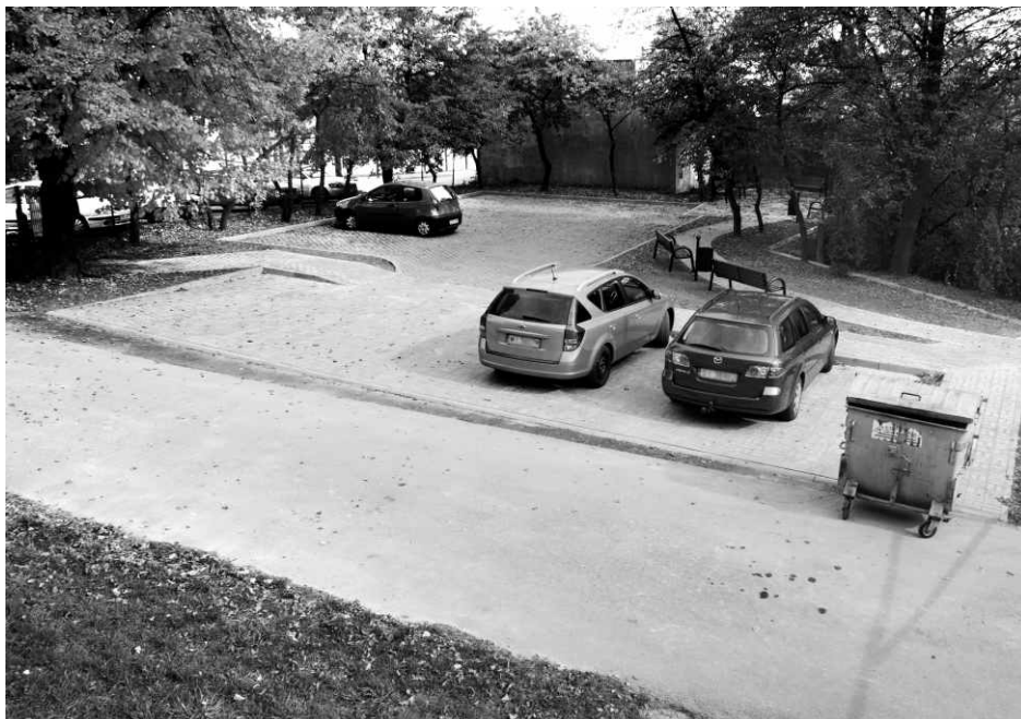
Widok z góry na nowy plac przed budynkiem Ośrodka Kultury w Sarnowie.

Przeprowadzone prace zwiększyły estetykę otoczenia budynku oraz zapewniły miejsca postojowe i miejsca odpoczynku dla odwiedzających ośrodek kultury, bibliotekę, przychodnię zdrowia, czy pracownię architektoniczną. Red.