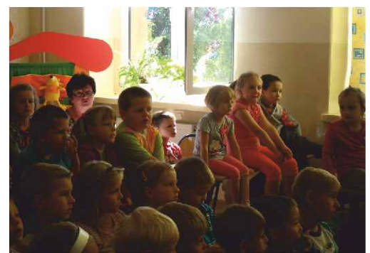
Najmłodszy uczestnicy „Narodowego Czytania”