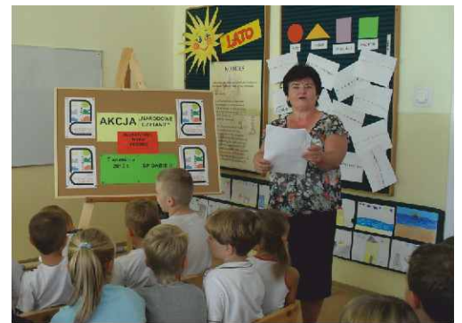
Nasza Pani Dyrektor też czytała Fredrę!