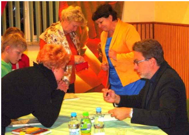
Każda z osób przybyłych na spotkanie mogła dostać autograf Michała Rusinka.

do nas „trochę” spóźniony, ponieważ trafił do Psar leżących nieopodal Trzebini. Wszystko się zgadzało; była ul Szkolna, była szkoła, była biblioteka, tylko nas oczekujących na spotkanie nie było! Ale Pan Michał sobie świetnie poradził i dotarł do tych właściwych Psar gdzie przy kawie czekała na Niego grupa miłośników pięknego słowa i stwierdził, że tego spotkania do końca życia nie zapomni. GBP.