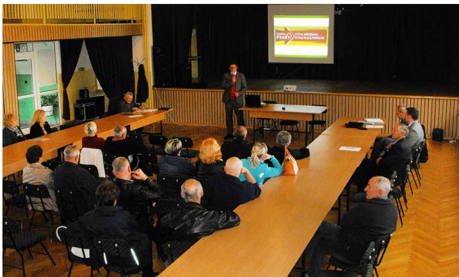
Zebranie wiejskie w Sołectwie Dąbie.

• Brzękowice: dalsza modernizacja i termoizolacja budynku OSP w Dąbiu oraz doposażenie klubu sportowego, Dąbie: dalsza modernizacja i termoizolacja budynku OSP w Dąbiu oraz doposażenie klubu sportowego (juniorzy). Red.