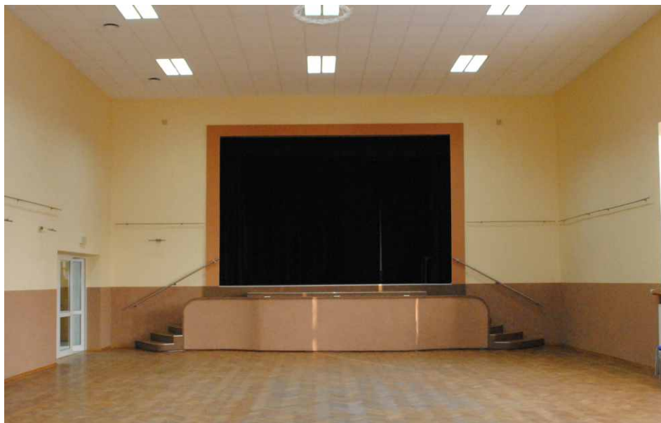
Scena w Ośrodku Kultury w Gródkowie zyska nowe kurtyny.

Świetlica wiejska w Preczowie wzbogaci się o nowe meble, garnki, wieszaki do szatni oraz rolety na okna. Największym wsparciem finansowym zostanie objęta świetlica w Gródkowie, gdzie dzięki pozyskanym środkom finansowym w Gminnym Ośrodku Kultury w Gródkowie zostanie zmodernizowana scena, na której pojawią się nowe kurtyny oraz ekran projekcyjny o szerokości 5 m i wysokości 3 m. Ponadto zakupione zostaną krzesła i stoły konferencyjne, urządzenia biurowe oraz wyposażenie kuchni. Do świetlicy w Brzękowicach Górnych zostaną kupione stoły konferencyjne oraz wieszaki stojące. Świetlica w Dąbiu zyska natomiast, oprócz stołów i krzeseł, także nowy sprzęt nagłaśniający, meble kuchenne