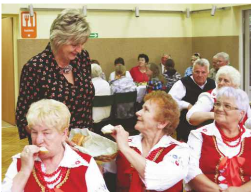
Tradycyjnie na święcie częstowano chlebem.

zaprezentowały się Zespoły „Zagłębianki” i „Górzanie”. Wszyscy goście mieli także okazję spróbować chleba z własnoręcznie przygotowanym przez Sarnowskie gospodynie smalcem, wspaniałych ciast także pieczonych przez Członkinie Zespołu „Zagłębianki” oraz wielu innych pyszności przygotowanych na tę okazję. Do wieczora trwała też zabawa taneczna.