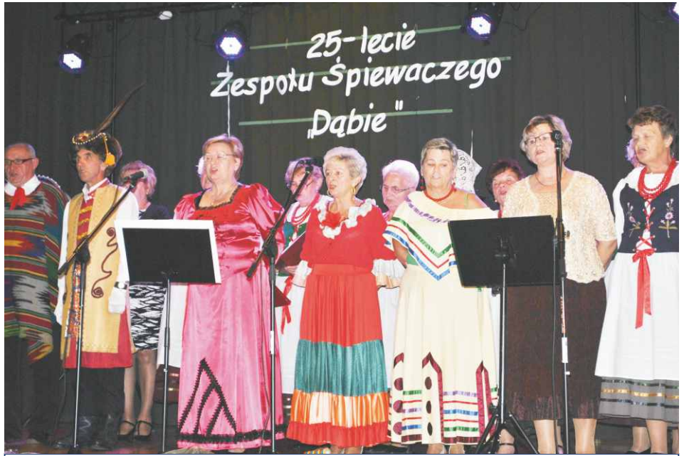
Członkowie Zespołu „Dąbie” w kolorowych strojach z dumą prezentowali swój 25 -letni dorobek artystyczny.

Zespół może poszczycić się m.in. „KASZTELANKĄ” nagrodą Starosty Będzińskiego w Dziedzinie Krzewienia Kultury, Orderem za Wkład w Rozwój Powiatu Będzińskiego, Nagrodą