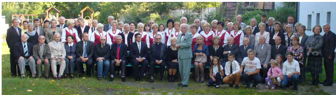
Zgromadzeni goście na promocji książki Bolesława Ciepieli.