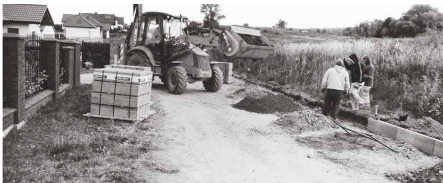
Prace budowlane na ul. Irysów w Psarach.

Obecnie budowlańcy zabudowują obrzeża betonowe oraz uzupełniają podbudowę drogi. Następnie na ul. Irysów zostaną uregulowane wjazdy na posesje po czym wyłożona zostanie nowa nawierzchnia z kostki betonowej. Ogółem powstanie 750,63 metrów bieżących i 4257,5 m 2 nowej drogi. Koszt inwestycji wyniesie 485 774,72 zł. Termin realizacji zamówienia upływa 28.11.2013r. Red.