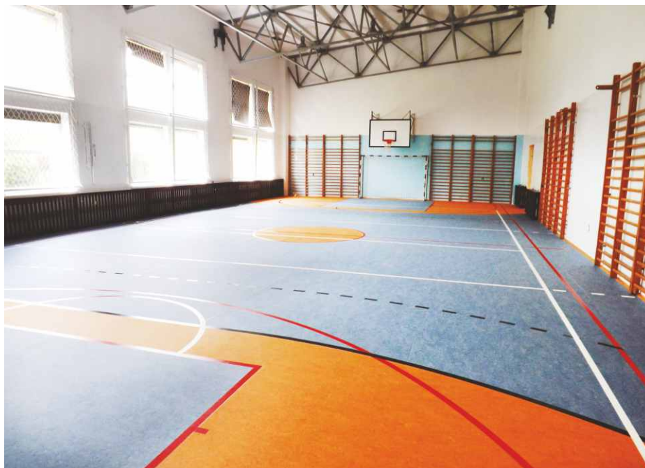
Nowa podłoga na sali gimnastycznej w Dąbiu.

wykonać remont sali gimnastycznej przy szkole w Strzyżowicach za ok. 150 tys. zł. Zarówno sale przy szkole w Dąbiu jak i w Strzyżowicach zostały zgłoszone do dofinansowania ze środków z Ministerstwa Sportu i Turystyki, a 24.09.2013r. zostaliśmy poinformowani, że oba projekty zostaną objęte wsparciem finansowym na ponad 93 tys. zł. Red.