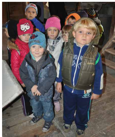
Przedшкоlacy ze Strzyżowic.

Ponad sześćdziesięcioletni młyn zwiedzały tylko grupy starsze. Przewodniczka i właścicielka młynu opowiedziała dzieciom o zasadności rozdzielania zbóż i ich zastosowania przez człowieka. Po części teoretycznej nadszedł czas na praktyczną czyli na zwiedzanie. Dzieci zobaczyły ziarna zbóż (pszenica i żyto) oraz to co z nich powstało – mąkę i otręby. Poznały pracujące w młynie maszyny i nie mogły się nadziwić, jak to wszystko współgra ze sobą. ZSP Strzyżowice.