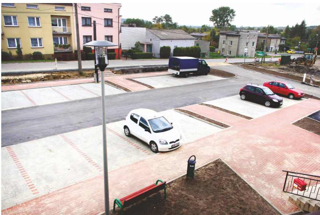
Ukończony plac z miejscami parkingowymi przed remizą OSP w Strzyżowicach.

W ramach robót wykonano wjazd i zjazd z drogi powiatowej, 24 miejsca parkingowe, w tym dwa dla niepełnosprawnych, dojście do budynku dla pieszych i nowy wjazd dla straży pożarnej oraz oświetlenie terenu. Koszt robót to 296 278,59 zł brutto. Zadanie to zostało zgłoszone do dofinansowania z Programu Rozwoju Obszarów Wiejskich. Red.