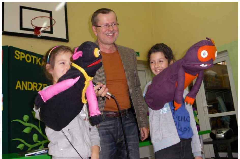
Uczniowie z Gródkowa i z Dąbia mieli okazję pobawić się kukiełkami.

jednakże zanim to się stało dzieci wręczyły naszemu Gościowi piękne kwiaty i podziękowały gromkimi brawami za spotkanie. Red.