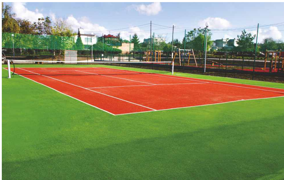
Kort tenisowy posiada nawierzchnię ze sztucznej trawy.

wielofunkcyjny zestaw sprawnościowy. Co ważne, każdy zestaw zabawowy na placu zabaw ma dostosowaną do niego strefę bezpieczeństwa pokrytą warstwą amortyzacyjną, wykonaną z poliuretanu, która chroni dzieci przed urazami w razie upadku.