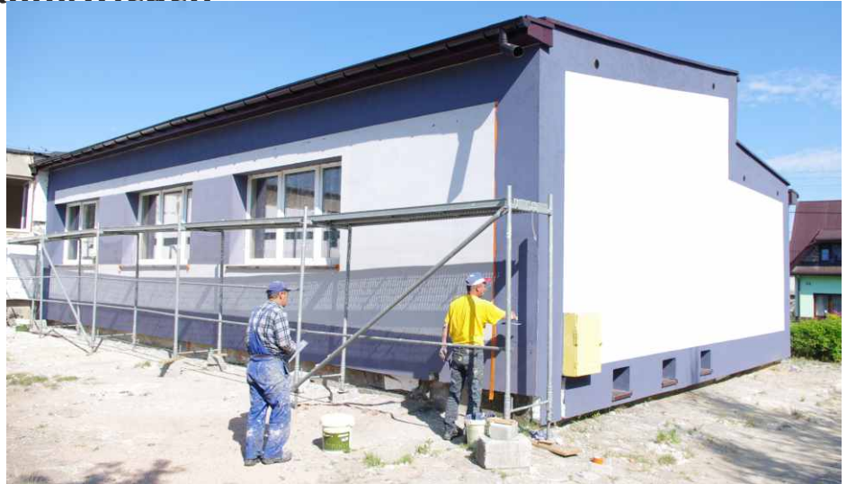
Prace podczas modernizacji budynku w Malinowicach.

W budżecie gminy na 2013 rok przewidziano ok. 50 000 zł na termomodernizację budynku byłej SP w Malinowicach. Blisko 20 tys. zł z tej kwoty, które w całości zostały przeznaczone na zakup materiałów budowlanych, stanowi fundusz sołecki