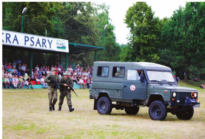
6. Batalion Powietrznodesantowy z Gliwic zaprezentował pokaz walki dynamicznej.