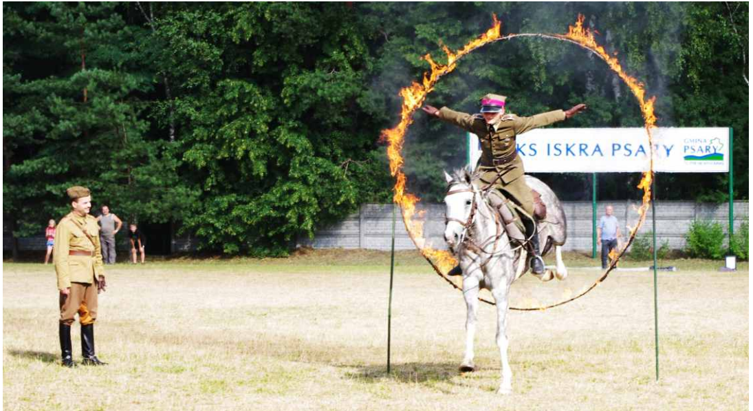
Kaskaderski popis Szwadronu „Toporzysko” wywarł na widzach ogromne wrażenie.