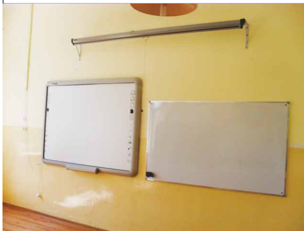
W Dąbiu jedną z sal doposażono w nową tablicę.