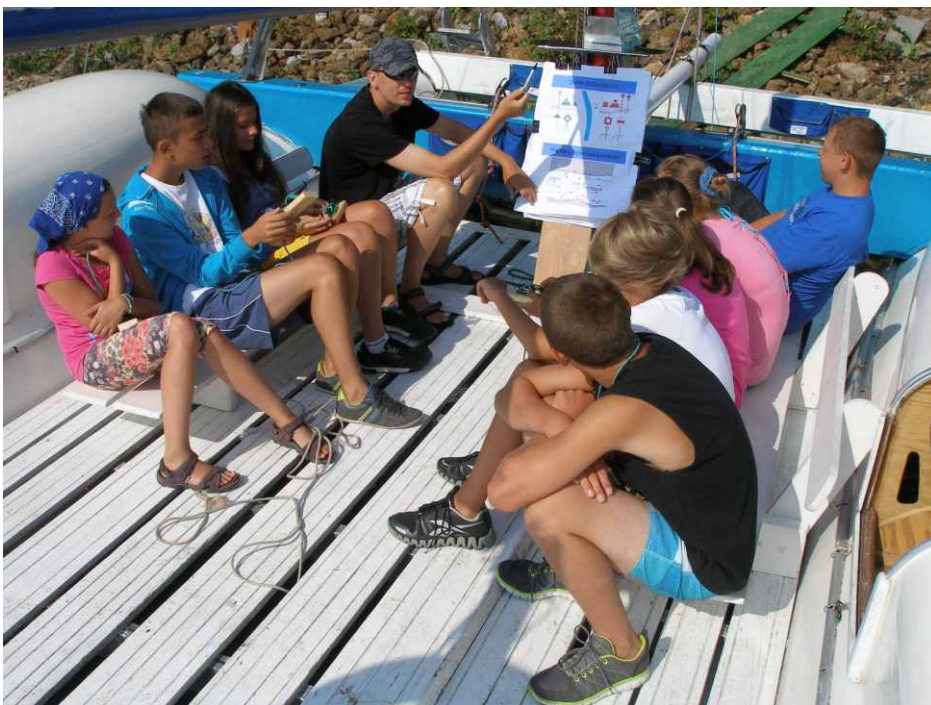
Uczestnicy projektu podczas wykładów.

nauki i praktyczne umiejętności żeglowania. Dodatkową atrakcją jest zwiedzanie licznych wysp i zatok położonych na jeziorze Pogoria, dzięki którym uczestnicy poznają piękno żeglarstwa. Wyrabiają w sobie poczucie