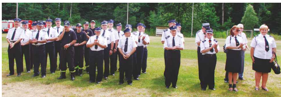
Na Jubileuszu zgromadzili się druhowie z gminnych i sąsiednich jednostek OSP.