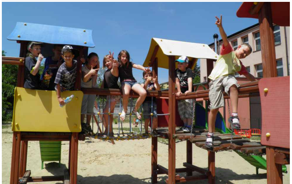
Sarnowski plac zabaw stał się w czasie wakacji ulubionym miejscem zabaw w tym sołectwie.