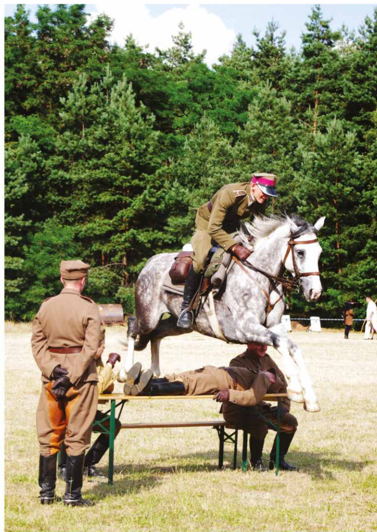
Pokaz kaskaderski w wykonaniu szwadronu Toporzysko dostarczył wielu emocji oglądającym go widzom.