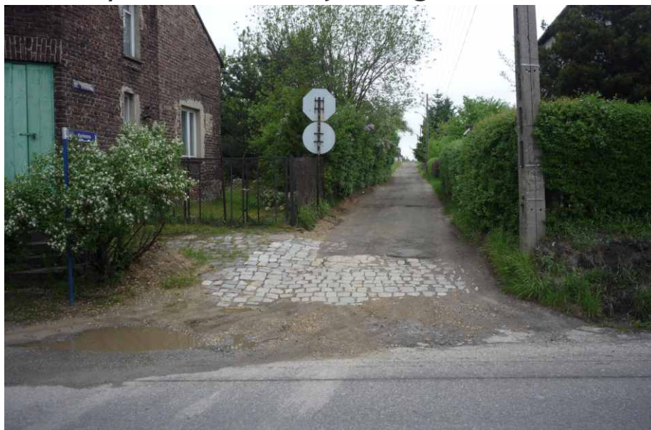
Ul. Kamienna w Sarnowie przejście remont.

W 2013 r. w budżecie gminy przewidziano środki na umocnienie frezem asfaltowym 7 odcinków dróg gminnych. Taka przebudowa czeka ulicę Kamienną i Browarną w Sarnowie, odcinek ulicy Szosowej w Strzyżowicach do numeru 44, 3 odcinki dróg w Malinowicach oraz ulicę Leśną w Gródkowie. Wykonawcą tych prac będzie Firma Usługi Remontowo-Budowlane z Zawiercia, która zaoferowała najniższą cenę w wysokości 178 349,00 zł. Termin realizacji tego zakresu zamówienia upływa 16 września 2013 r.