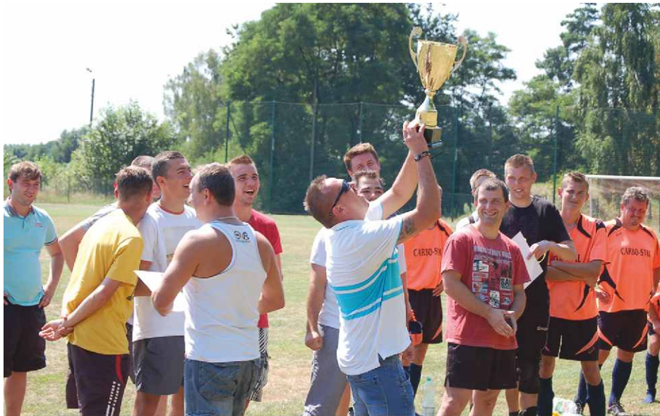
Klub Sportowy Góra Siewierska bardzo ucieszył się z wygranej.

W pierwszym spotkaniu zmierzyły się ze sobą drużyny LKS Orzeł Dąbie kontra KS Góra Siewierska. Sukces odnieśli piłkarze KS Góra Siewierska, wygrywając wynikiem 5:0. W kolejnym starciu ponownie KS Góra Siewierska zmierzył się z drużyną LKS Jedność Strzyżowice. To spotkanie również górzanie zakończyli zwycięstwem, tym razem 1:0. Ostatni mecz rozegrany został między drużyną LKS Orzeł Dąbie a LKS Jedność Strzyżowice, w którym zwycięsko wyszła grupa LKS Orzeł