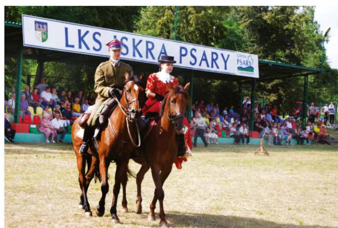
W skład szwadronu „Toporzysko” wchodzi również panie, które zaprezentowały jazdę w damskim siodle.