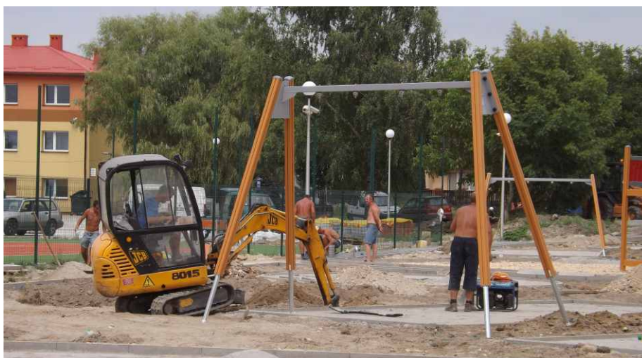
Pracownicy montują urządzenia na placu zabaw.

Ze względu na przedłużającą się zimę prace mogły rozpocząć się dopiero w połowie kwietnia, co w połączeniu z