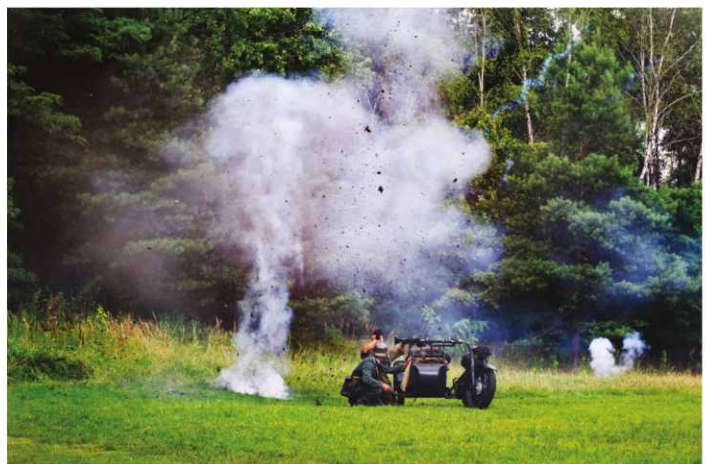
Podczas inscenizacji starcia wojsk niemieckich z radzieckimi użyto wielu efektów pirotechnicznych.