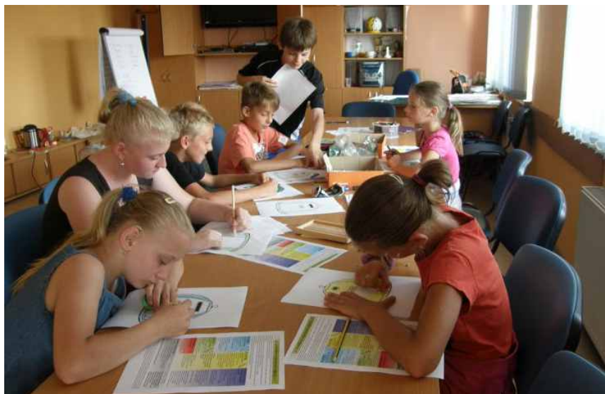
Zajęcia plastyczne w Ośrodku Pomocy Społecznej.

uzyskać pod numerem telefonu 32/ 267 22 59. Aktualny harmonogram zajęć jest dostępny na stronie internetowej GOK Gminy Psary www.gok.psary.pl .