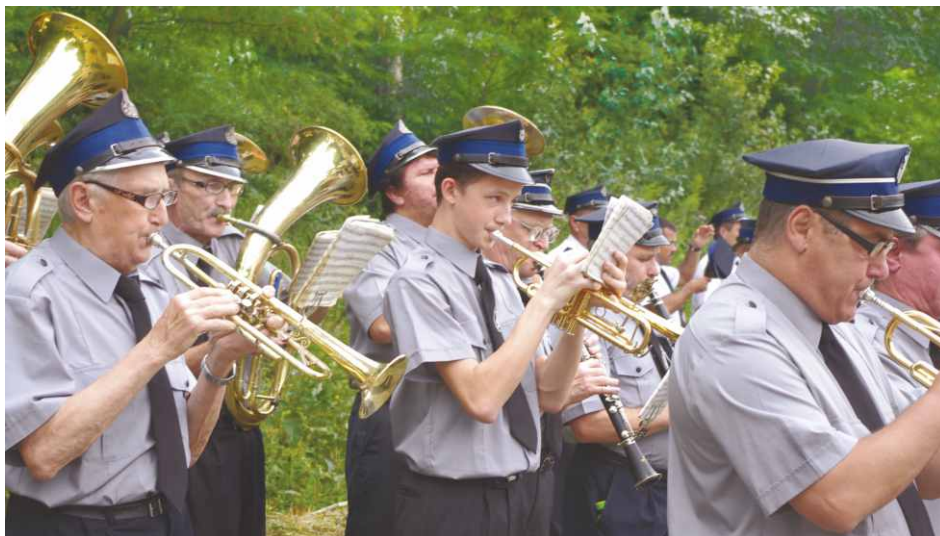
Orkiestra dęta uświetniła swoim występem Jubileusz 85 -lecia.