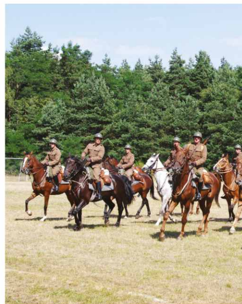
Pokaz władania białą bronią i w wykon