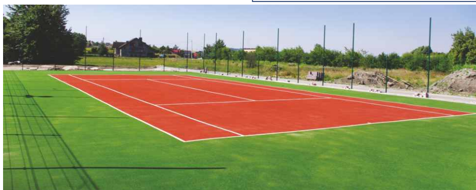
Boisko do tenisa ziemnego wyłożono sztuczną trawą.

niezwykle obfitymi opadami deszczu w maju spowodowało opóźnienie względem pierwotnego harmonogramu prac. Główny wykonawca firma Moris Sport z Warszawy deklaruje, że zakończy zadanie do końca sierpnia. Projekt ten objęty jest dofinansowaniem w ramach Programu Rozwoju Obszarów Wiejskich w wysokości 339 448 zł. Red.