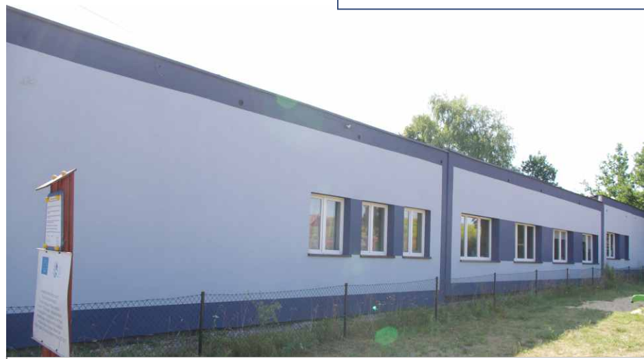
Elewacja od strony placu zabaw po zakończeniu prac.

dla Sołectwa Malinowice. Pracownicy brygady położyli styropian i wykonali nową elewację na 5 ścianach budynku. Wykonano obróbki blacharskie, przedłużono konstrukcję dachu, którą ocieplono nad częścią kuchenną. Jest to I etap prac modernizacyjnych, które będą kontynuowane także w roku przyszłym.