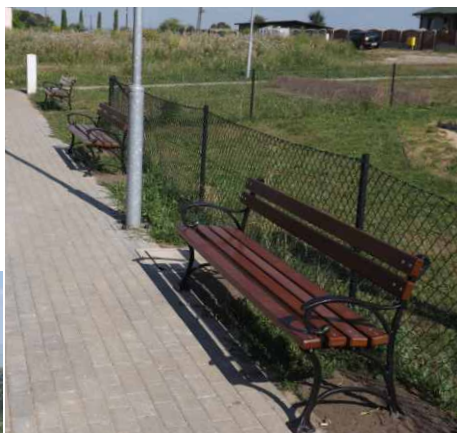
Ławki przy boisku i placu zabaw w Górze Siewierskiej.

na boisku. Koszt tych prac to 15 084,72 zł.