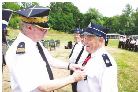
Strażakom wręczono medale za 60 lat służby w OSP.

Po zakończeniu oficjalnej części na boisku Klubu Sportowego Góra Siewierska zgromadzeni goście przeszli do remizy strażackiej, gdzie odbyła się druga część uroczystości wypełniona wspomnieniami z działalności jednostki OSP z Góry Siewierskiej. Red.