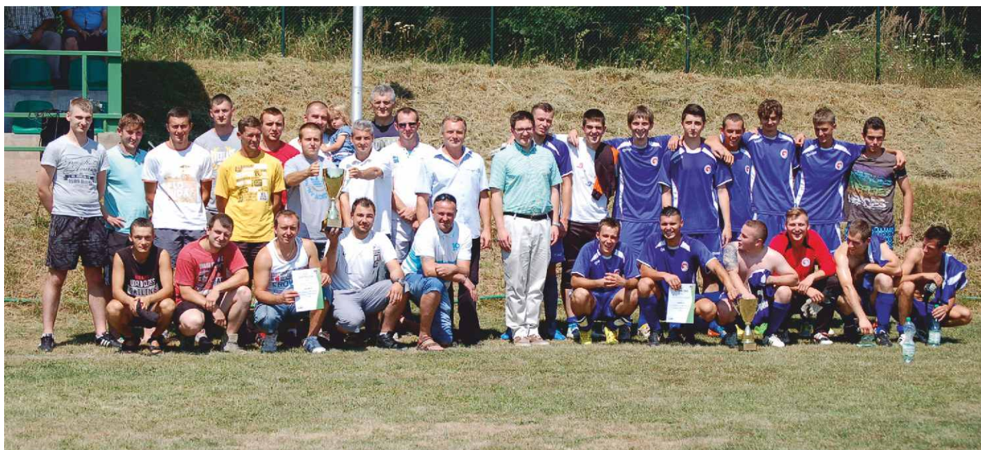
Pamiętkowe zdjęcie Klubu Sportowego Góra Siewierska z drużyną Orła Dąbie.

Serdecznie gratulujemy zwycięzcom i liczymy na kolejną dawkę emocji w następnym roku. Red.