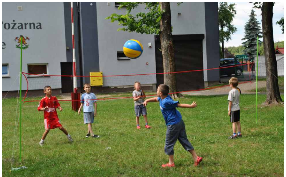
Wakacje to świetny sposób na podszlifowanie swojej sportowej formy.

Na zakończenie wakacji dla uczestników zajęć oraz chętnych dzieci GOK przygotował wyjazd do Warowni Rycerskiej w Pszczynie, na który już dziś serdecznie zapraszamy. Zgłoszenia przyjmowane będą od 19 sierpnia w siedzibie GOK w Gródkowie, więcej informacji można