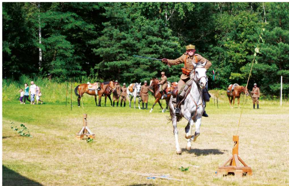
naniu ułanów kawalerii konnej ze szwadronu Toporzysko 3 pułku Strzelców Konnych im. Hetmana Polnego Stefana Czarneckiego.