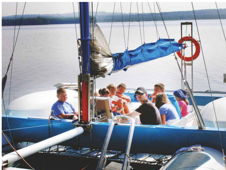
Uczestnicy projektu na jachcie z instruktorem.

Projekt współfinansowany jest ze środków Unii Europejskiej w ramach działania 4.1.3 wdrażanie lokalnych strategii rozwoju dla małych projektów Programu Rozwoju Obszarów Wiejskich na lata 2007-2013. Red.