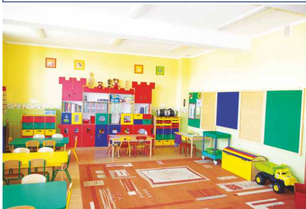
W Przedszkolu w Strzyżowicach pomalowano wszystkie sale.

W Zespole Szkolno-Przedszkolnym w Strzyżowicach pomalowano sale przedszkolne, a na boisku wielofunkcyjnym za szkołą powstają trybuny sportowe, do końca września dookoła obiektu zostanie wykonane nowe ogrodzenie.