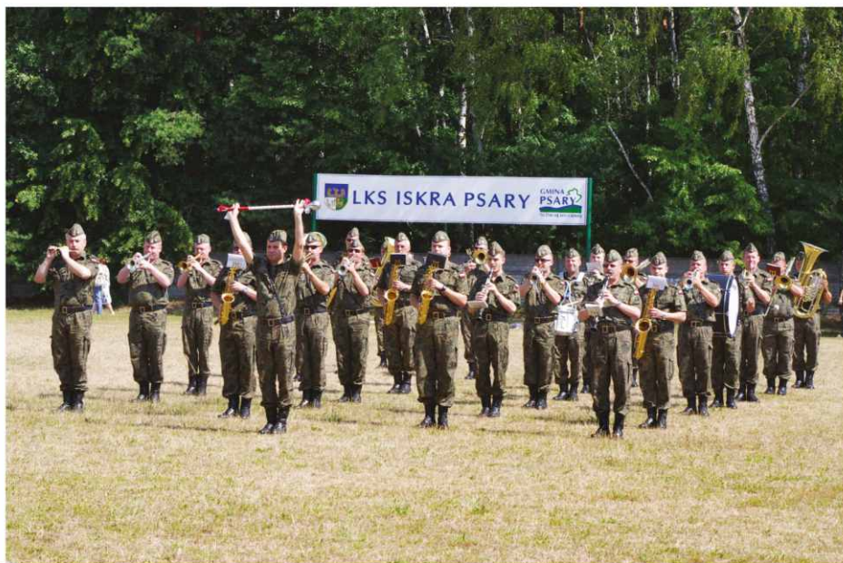
Występ Orkiestry Wojskowej Sił Powietrznych z Bytomia.