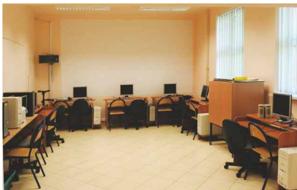
Doposażona w nowy sprzęt komputerowy pracownia w Szkole Podstawowej w Sarnowie.

Wzorem lat ubiegłych sukcesywnie malowane są w szkole kolejne pomieszczenia. W tym roku odświeżone zostały dwie sale lekcyjne oraz szatnia.