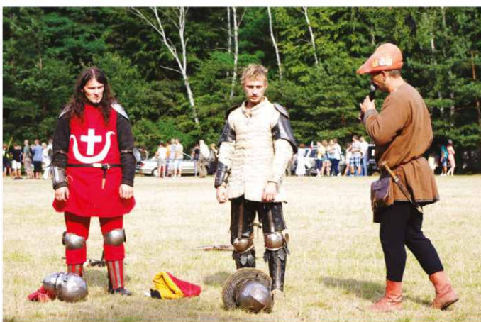
Walki rycerskie oraz uzbrojenie zaprezentowało Bractwo Rycerskie Zamku Będzin.