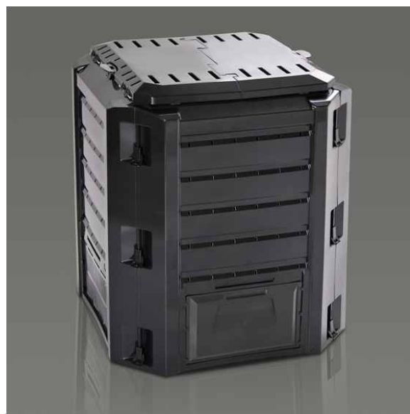
Gmina zakupiła kompostowniki dla mieszkańców.

Kompostownik pomaga zagospodarować odpadki organiczne jak i zielone. Dodatkowo nie zajmuje on dużo miejsca i można go ustawić na działce lub w ogródku. Red.