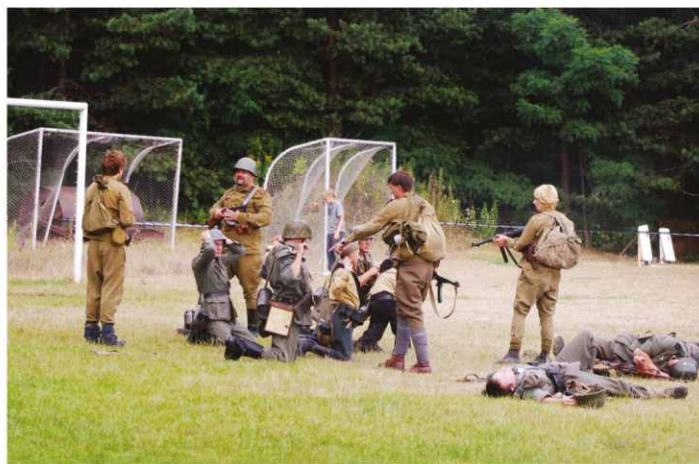
Rekonstrukcja walk z okresu II Wojny Światowej.