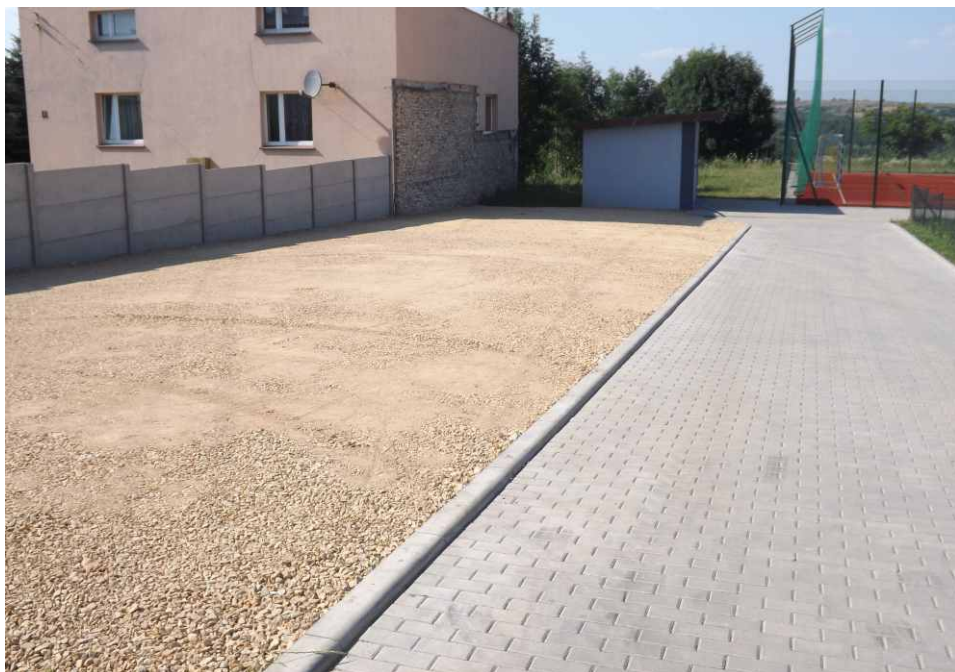
Miejsce parkingowe przy boisku wielofunkcyjnym w Górze Siewierskiej.

miejscu po byłych garażach został wykonany parking z kruszywa na całej długości drogi dojazdowej do boiska. Wykonawca prac, firma „Drogrem” zamontowała także 3 ławki wzdłuż ogrodzenia placu zabaw, z których można obserwować sportowe zmagania