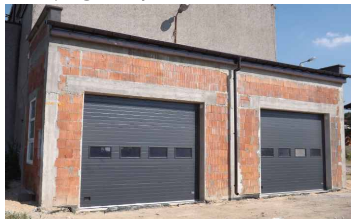
W Górze Siewierskiej rozbudowano garaże strażackie.

Realizowane zadanie jest kolejnym etapem prac mających na celu przebudowanie budynku OSP w Górze Siewierskiej i przyległego do niego placu. Ukończono już również prace w pomieszczeniu, w którym będzie znajdował się publiczny punkt dostępu do Internetu (PIAP). Gmina posiada projekt budowlany na zagospodarowanie placu znajdującego się przy remizie OSP, który zakłada przebudowę ciągu od ulicy Chopina do Ogrodowej oraz zorganizowanie wielu miejsc odpoczynku i rekreacji. Red.