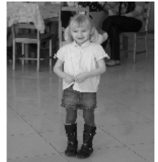
Jeden z uczestników odbiera dyplom. Uczestniczka konkursu.