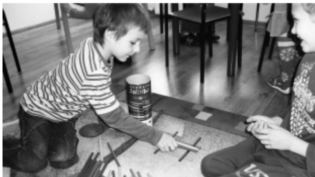
Uczniowie układają studnie Jakuba w ramach zajęć - „Pierwsze uczniowskie doświadczenia drogą do wiedzy”.

Podczas „dni otwartych drzwi” rodzice i dzieci będą mogli osobiście przekonać się jak szkoły przygotowane są na przyjęcie sześciolatków. Będzie to okazją do rzeczowego dialogu z dyrektorami placówek oraz obecnymi i przyszłymi wychowawcami. Warto też śledzić informacje na stronach internetowych szkół, gdzie wyodrębniono specjalne zakładki poświęcone sześciolatkom, a także przeglądać najnowsze foldery informacyjne szkół.