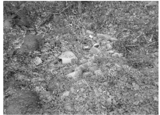
Nielegalne wysypisko śmieci.

Kupujemy i konsumujemy coraz więcej produktów. Zajadamy się smaczными batonikami, pijemy chłodne napoje, używamy coraz większej ilości kosmetyków, cieszymy się nowym telewizorem. Wiele z takich produktów przynosimy do domu w różnych opakowaniach np. pudełkach, torbach, folii, papierze, opakowaniach plastikowych, butelkach czy puszkach. Jednak rzadko zastanawiamy się nad tym, co się z nimi stanie, gdy już przestaną być potrzebne i zazwyczaj beztrudno wyrzucamy je do jednego, wspólnego kosza na śmieci.