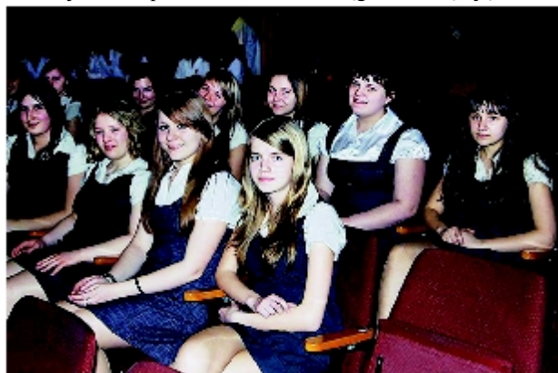
Chór z Gimnazjum przed występem.