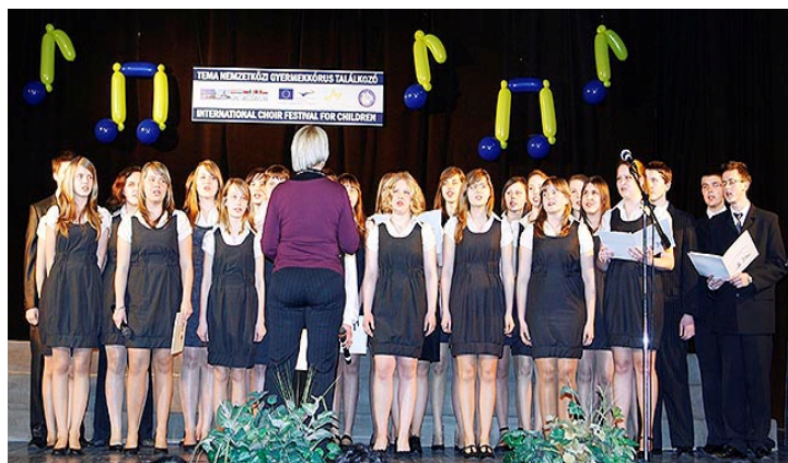
Chór z Gimnazjum na scenie podczas występu.

Symbolem organizacji T.E.M.A. jest most. Dzięki muzyce młodzież szkolna mogła przekroczyć granice i spotkać się ze sobą, poznać i zrozumieć inną kulturę. Nawiązały się również nowe przyjaźnie, które będą bardzo dobrą motywacją do nauki języka angielskiego. Red.