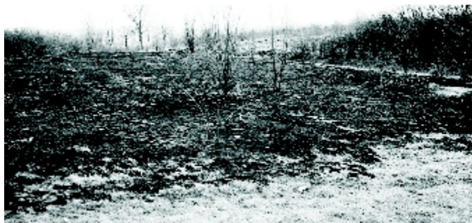
Wypalone trawy w Górze Siewierskiej.

Często pożar z łąk zaczyna obejmować pobliskie zabudowania gospodarcze, okoliczne drzewa, a dym z pożaru nierzadko jest przyczyną samochodowych wypadków. Dochodzi do tragedii ludzkich oraz strat finansowych. Gminy biorą na siebie koszt funkcjonowania jednostek ochrony przeciwpożarowej tak więc koszty związane z usuwaniem skutków pożarów – straty w mieniu oraz paliwo i sprzęt używany do akcji gaśniczych jest pokrywany bezpośrednio z budżetu gminy. Red.