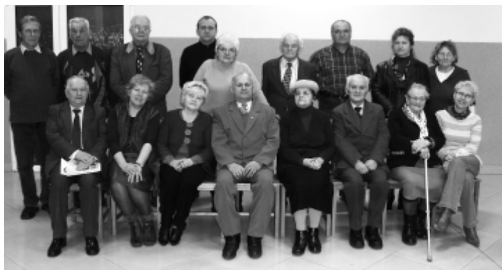
Uczestnicy spotkania w sprawie monografii Preczowa.