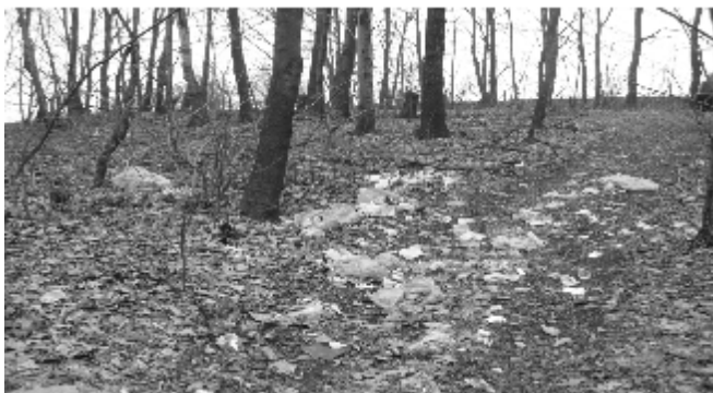
Zdjęcie zrobione podczas wiosennego spaceru.

Kilka dni temu zdecydowałam się pójść na spacer do lasu. W związku z tym, że stopił się śnieg, postanowiłam wreszcie zobaczyć trochę zieleni. Były już pierwsze kwiaty i liście na drzewach. Można byłoby nazwać to ładnym krajobrazem, gdyby nie to, że było tam mnóstwo śmieci.