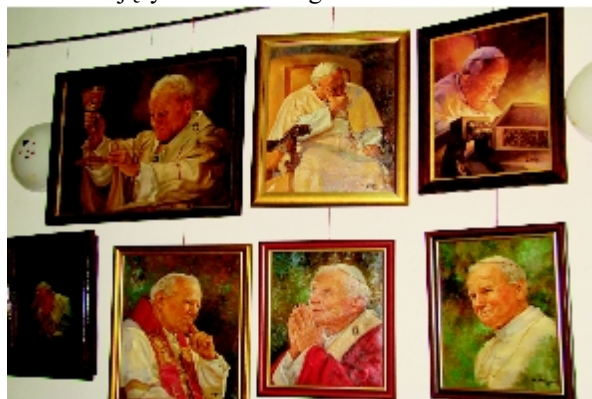
Portrety Jana Pawła II.