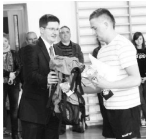
Jeden z uczestników turnieju odbiera nagrodę z rąk wójta.