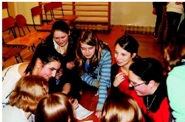
Gimnazjaliści wspólnie z uczniami z Węgier rozwiązują zadanie.