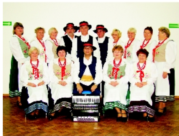
Zespół Śpiewaczy Nasz Gródków.