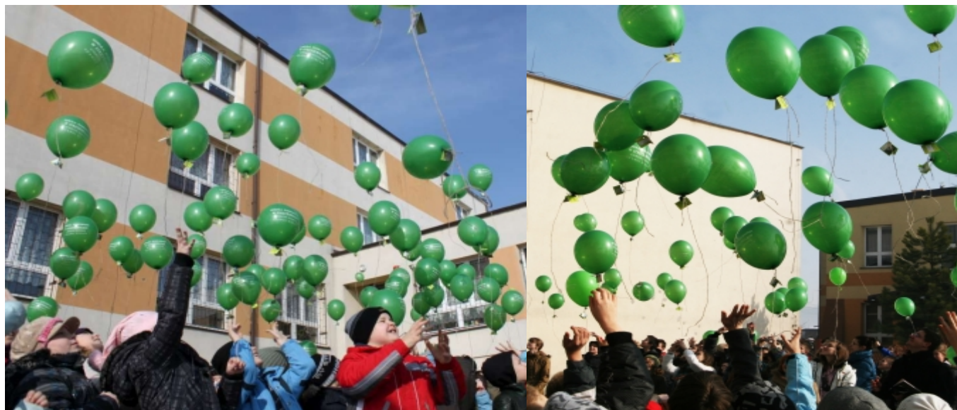
Uczniowie ze Szkoły Podstawowej w Strzyżowicach podczas II Zawodów Balonowych.

Aby mieć pewność, że zima nie wróci uczniowie z klasy III SP w Strzyżowicach utopili Marzannę, co zostało udokumentowane i zostanie zamieszczone w „Magazynie wiosennym”, z którym zapoznają się uczniowie ze szkół partnerskich. Red.