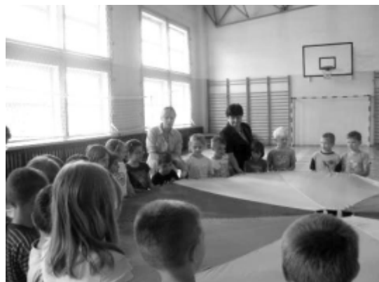
Uczniowie z chustą animacyjną, spadochronem.