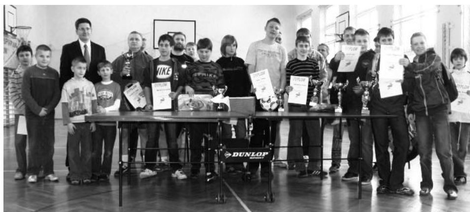
Zdjęcie grupowe laureatów kategorii Szkoły Podstawowe.