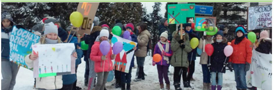
Manifestacja uczniów z Gródkowa