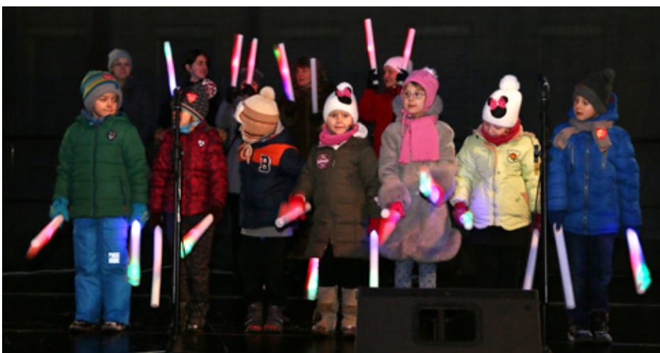
Występ przedszkolaków z Dąbia podczas gminnego finału WOŚP

Organizatorzy serdecznie dziękują sponsorom za wsparcie tegorocznego gminnego finału WOŚP. Red.