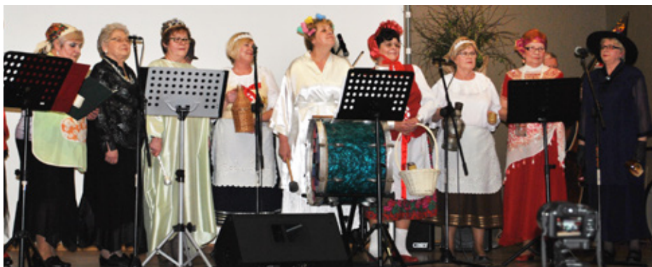
Zespół „Od... Do...” na scenie podczas Zapustów

Tym razem przed licznie zgromadzoną publicznością zaprezentowały się zespoły: Dąbie – w przedstawieniu „O Marysi, która chciała być sierotką, czyli teatrzyk dla dorosłych”, Od... Do... – zaprezentował „Korowód zapustowy”, Górzanie – widowisko „Kulawa Gęś”, Zagłębianki – zaprezentowały scenki kabaretowe, Tęcza – program „Lata młodości i terazniejsze kabaretu Tęcza” oraz Kapela Gródków – przedstawiła „Gminę Psary w pigułce”. Gościnnie