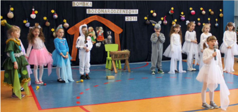
Występy artystyczne uczniów