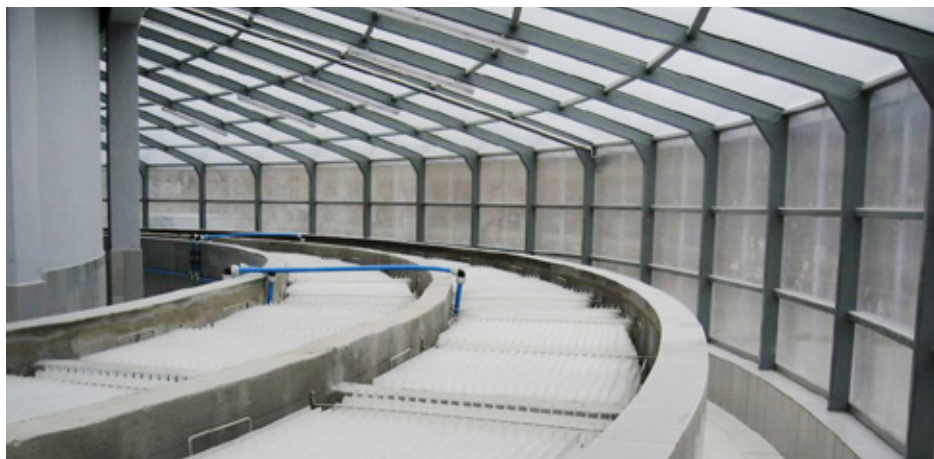
Oczyszczanie ścieków w Psarach będzie odbywało się w zadaszonym pomieszczeniu

W odpowiedzi na liczne pytania mieszkańców, zgłaszane do Urzędu Gminy w Psarach, firma „ALFA” zorganizowała dyżury informacyjne, na które przyszło ok. 200 mieszkańców. Na spotkaniach omówione i wyjaśnione zostały wątpliwości oraz uzgodniono przebieg sieci kanalizacji i wodociągu. Trwają również indywidualne uzgadniania przebiegu mediów z mieszkańcami i właścicielami firm objętych projektem. Jest to kluczowy moment dla właścicieli nieruchomości, znajdujących się przy projektowanej sieci kanalizacji, ponieważ mogą oni ustalić, w którym miejscu na swojej posesji będą przebiegały rury kanalizacyjne oraz gdzie będzie umiejscowiona pompownia. Red.