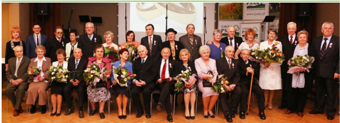
Pary zgromadzone na Jubileuszu Pożycia Małżeńskiego z terenu gminy Psary - 09.02.2017 r.