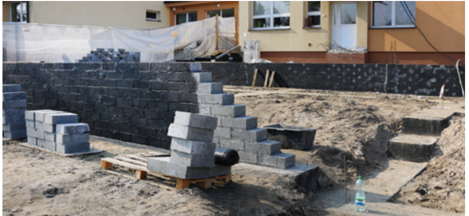
Powstają ściany przedszkola przy szkole w Gródkowie

Przebudowana zostanie również przestrzeń wokół obiektu – powstaną