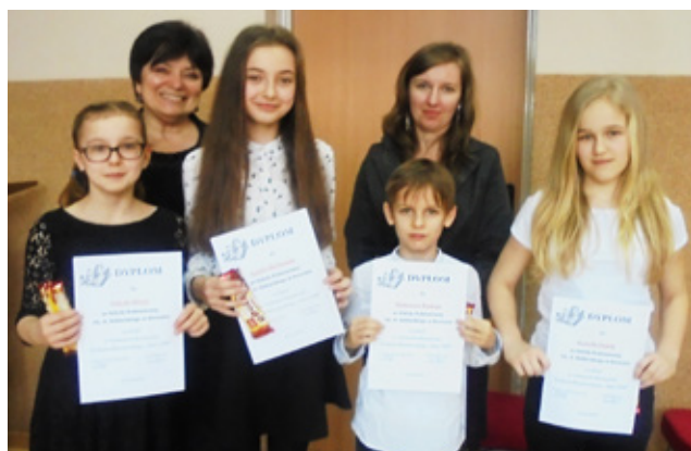
Laureaci konkursu „Mały OKR” z jury

Te trzy młode artystki będą reprezentowały naszą gminę na eliminacjach wojewódzkich konkursu. Życzymy powodzenia i trzymamy kciuki za dziewczyny! GOK.