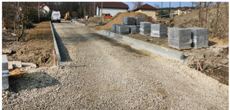
Na stadionie w Strzyżowicach już wkrótce rozpoczną się prace brukarskie

Przypominamy, że w ramach wyżej wymienionej inwestycji powstaną między innymi drogi dojazdowe, chodniki oraz 14 miejsc postojowych o nawierzchni z kostki betonowej. Na stadionie postawione zostaną nowe zadaszone trybuny oraz oświetlenie, zarówno parkowe jak i sportowe, umożliwiające treningi po zmierzchu. Modernizacja obejmie również budynek szatni, gdzie robotnicy