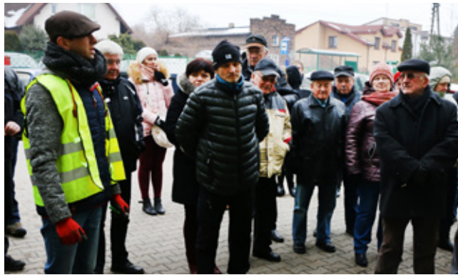
Ekspert portalu czysteogrzewanie.pl podczas pokazu ekonomicznego spalania

Ekspert pokazał wszystkim uczestnikom pokazu jak rozpałać w piecu, aby ten oddawał maksymalną ilość ciepła z używanego przez nas paliwa, przy czym szkodząc jak najmniej przyrodzie. W tym celu przed budynkiem OSP w Psarach zostały ustawione dwa przenośne piece z kominami. W pierwszym z nich zastosowano ekologiczną i ekonomiczną metodę spalania od góry, a w drugim spalania od dołu, (jest to metoda najczęściej stosowana w gospodarstwach domowych). Już po chwili można było zaobserwować większą ilość dymu, która wychodzi z pieca opalanego metodą spalania od dołu, przy metodzie górnej dym był prawie niewidoczny. Dodatkowo dzięki tej metodzie oszczędzamy na węglu, ponieważ aż 90% smogu ulatującego w trakcie tradycyjnego palenia ulega spalaniu, a co za tym idzie wydłuża się proces, w którym otrzymujemy ciepło.