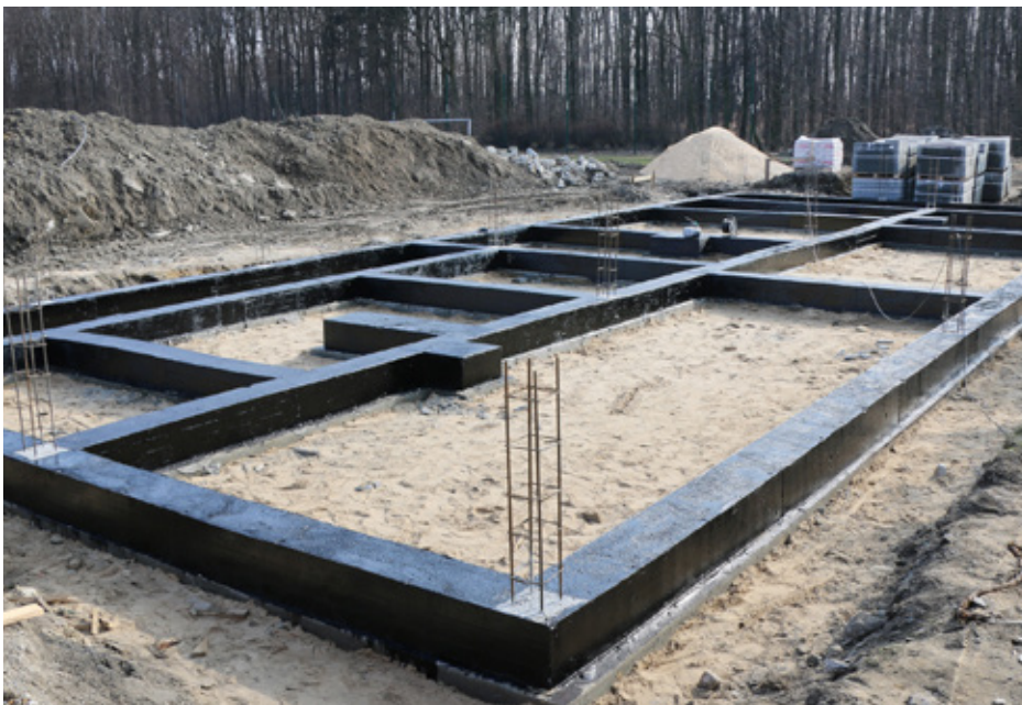
W Sarnowie powstały już fundamenty pod budowę szatni KS Sarnów

W ramach przeprowadzonych na sarnowskim stadionie prac powstanie nowy budynek zaplecza socjalnego o powierzchni 209,87 m 2 , szambo, a także zadane trybuny z 200 miejscami siedzącymi. Remont przejdzie także otoczenie obiektu jak i płyta boiska, na której zamontowany zostanie drenaż, system nawadniania oraz posiana zostanie nowa trawa. Zamontowane zostanie również oświetlenie sportowe do treningu. Red.