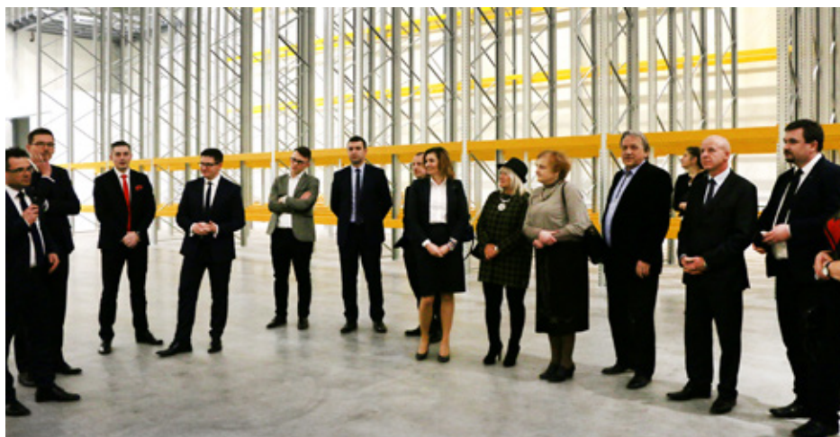
Podczas uroczystości zawieszenia wiechy zgromadzeni goście mieli okazję obejrzeć wnętrze centrum dystrybucyjnego Lidl w Gródkowie