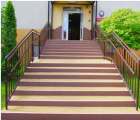
Gimnazjum w Psarach zostanie dostosowane do przyjęcia siedmiolatków

kiem Zdrowia w Psarach. Ponieważ ta lokalizacja znajduje się na pograniczu dwóch sołectw Psar i Malinowic, a w przyszłości przedszkole funkcjonować będzie w zespole szkolno – przedszkolnym ze szkołą w Psarach zdecydowano, aby część Malinowic stanowiła również obwód szkoły w Psarach.