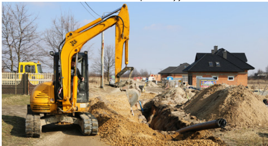
Budowa wodociągu w Malinowicach na ul. Słonecznej

Zakład Gospodarki Komunalnej w Psarach aktualnie projektuje również budowę i przebudowę wodociągów w Brzękowicach Górnych, Dąbiu Górnym, Gołuszy Górnej, Gródkowie od Przedsiębiorstwa Przetwórstwa Drzewnego do skrzyżowania z ul. Dojazdową, na ul. Pokoju i ul. Górnej, w Malinowicach na ul. Bukowej i ul. Słonecznej w drugiej linii zabudowy oraz w Preczowie na ul. Dębowej. Red.