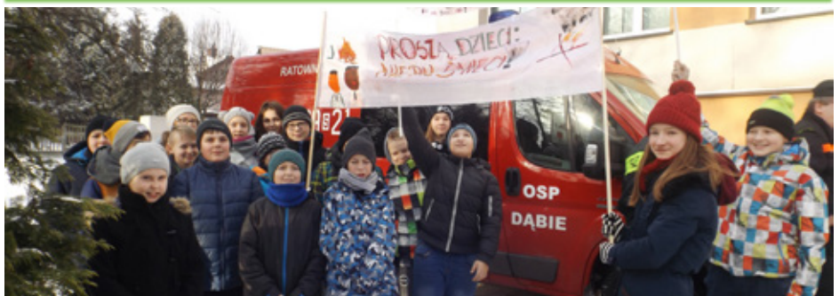
Manifestacja uczniów ze szkoły w Dąbiu