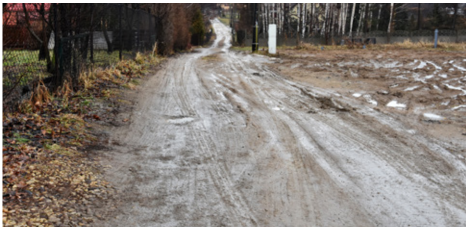
Ulica Wspólna w Gródkowie przed rozpoczęciem prac

Przedmiotem inwestycji jest przebudowa odcinka drogi gminnej o długości ok. 806 m. i szerokości ok. 3,5 m. z obustronnym krawężnikiem. Nawierzchnia jezdni wykonana zostanie z kostki betonowej, a pobocza grunto-we wzmocnione zostaną kruszywem o szerokości ok. 0,50 m. Przewidziana jest również modernizacja skrzyżowania ul. Wspólnej z ul. Strzyżowicką, przebudowa zjazdu publicznego na gminną drogę wewnętrzną i zjazdów