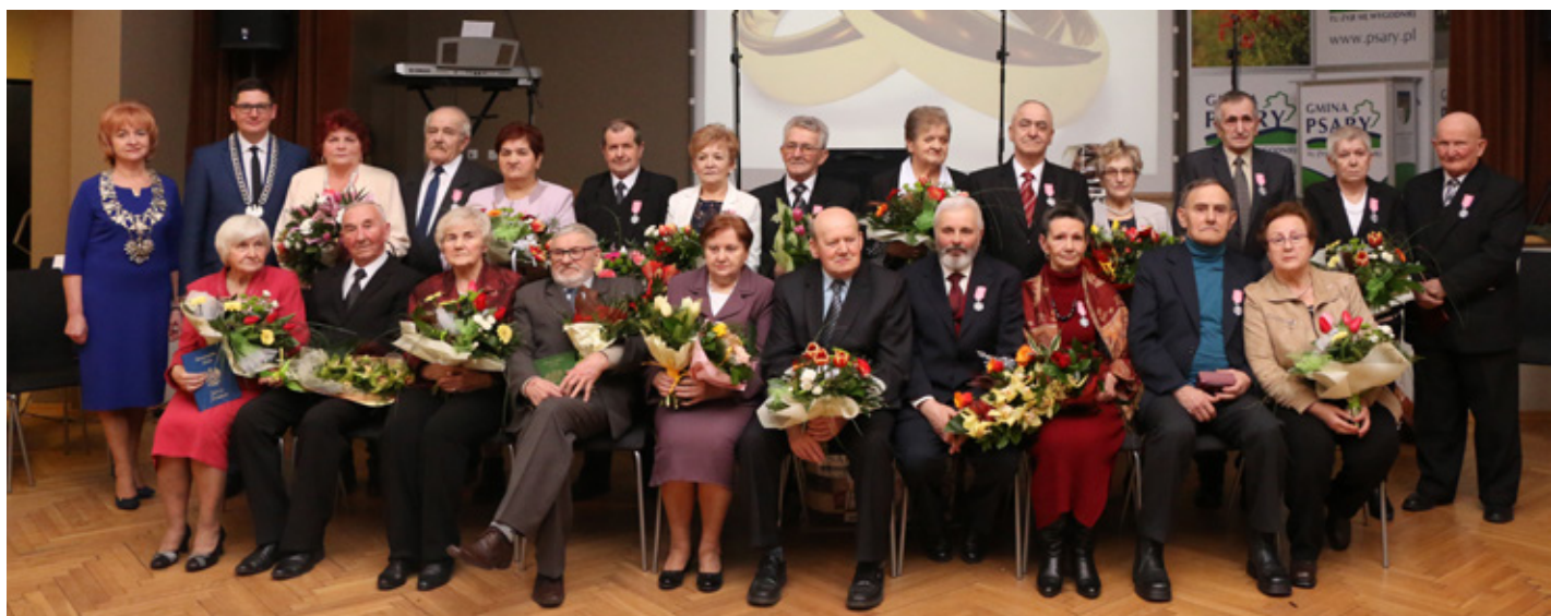
Pary zgromadzone na Jubileuszu Pożycia Małżeńskiego z terenu gminy Psary - 08.02.2017 r.

Po odnowieniu przysięgi małżeńskiej, odznaczeniu Jubilatów medalami i wręczeniu listów gratulacyjnych był czas na złożenie życzeń i gratulacji oraz wzniesienie toastu szampanem. Następnie odbyła się część artystyczna. Wśród występujących zespołów na scenie Jubilatów zagrały następujące Zespoły Śpiewacze: „Dąbie”, „Zagłębianki”, „Górzanie” i „Brzękowanie”. Red.