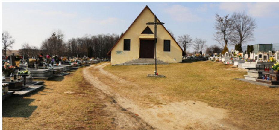
Alejki i kaplica na cmentarzu komunalnym w Strzyżowicach przejdą remont

Wymienione wyżej inwestycje to jednak nie jest cały zakres robót, które zostaną wykonane na strzyżowickim cmentarzu jeszcze w tym roku. Ponieważ poza robotami opisanymi powyżej planowane są jeszcze prace, które przeprowadzi Zakład Gospodarki Komunalnej w Dąbiu. Generalny remont