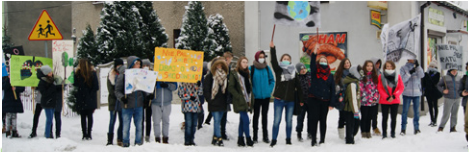
Manifestacja uczniów z Gimnazjum w Psarach

Ostatnia i najstarsza grupa uczniów z Gimnazjum w Psarach demonstrowała wraz z nauczycielami wykorzystując plakaty, transparenty i głośniki, przez które apelowała do mieszkańców propagując następujące hasła: „Kochasz dzieci nie pal śmieci”, „Nie masz się czym chwalić, jeśli w piecu śmieci palisz”, „Smog nas truje dlatego nikt nie reaguje”, „Nie pal śmieci dbaj o środowisko”, „Okaż kulturę i chroń naturę”. Na znak protestu wielu uczniów założyło maski przeciwpyłowe. Red.