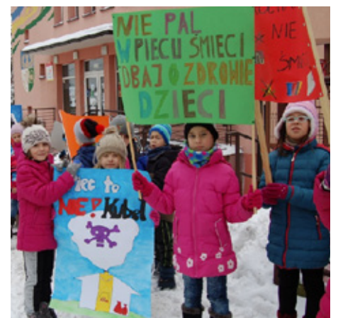
Manifestacja uczniów z Sarnowa

W Szkole Podstawowej w Dąbiu strażacy z zaprzyjaźnionej jednostki OSP Dąbie,