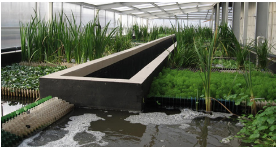
Oczyszczalnia ścieków będzie wykorzystywała metodę laguny hydroponicznej

Projekt budowy kanalizacji sanitarnej ciśnieniowej i przebudowy sieci wodociągowej o wartości 578.100 zł brutto, przygotowuje firma „ALFA” mgr Bożena Habrajska z Będzina. Model kanalizacji ciśnieniowej polega na gospodarowaniu ściekami sanitarnymi za pomocą niewielkich zbiorników przydomowych wyposażonych w proste