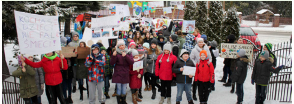
Manifestacja uczniów ze szkoły w Strzyżowicach