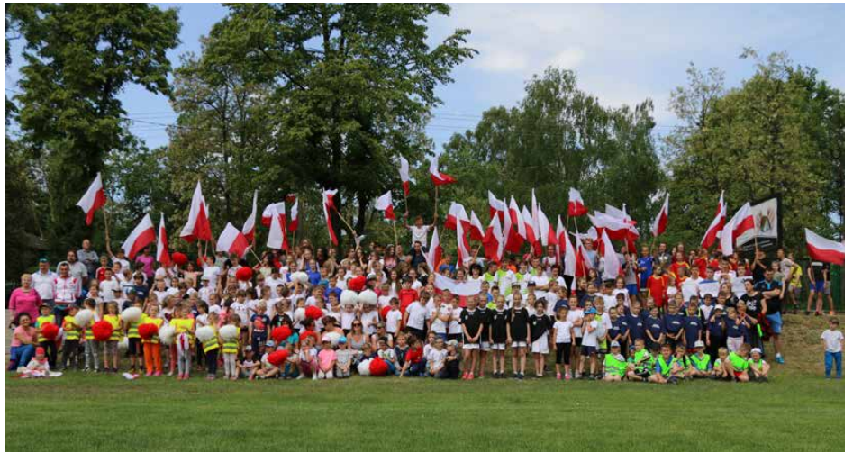
Uczniowie i przedszkolaki Dzień Flagi uczcili zawodami

W ramach „Biegu z flagą” odbyły się również mistrzostwa gminy Psary szkół podstawowych w sztafetowych biegach przełajowych chłopców i dziewcząt. Organizatorem zawodów była Szkoła Podstawowa w Psarach. Serdecznie gratulujemy wszystkim zwycięzcom i uczestnikom! Red.