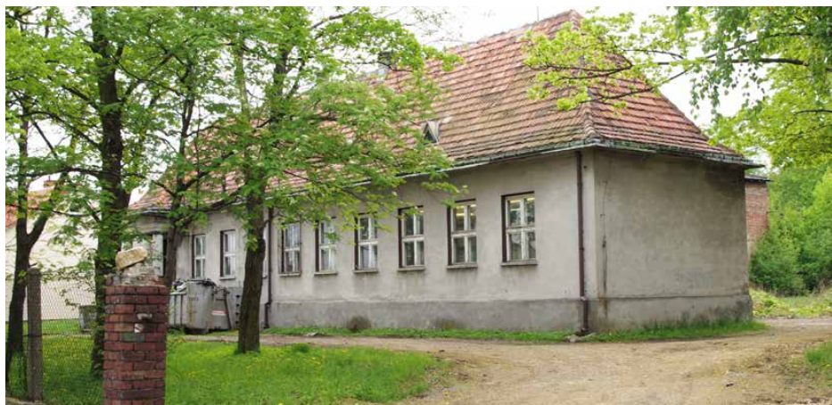
Pod koniec roku rozpoczną się prace w budynku byłej szkoły w Goląszy Górnej

Warto zaznaczyć, że spośród 93 zakwalifikowanych do dofinansowania projektów, aż 2 złożone przez psarski samorząd, znalazły się w pierwszej trójce najwyższej ocenionych. Pozostałe również zdobyły bardzo wysoką ilość przyznanych punktów. Wymienione termomodernizacje przyczynią się przede wszystkim do rozwiązania kluczowego problemu, jakim jest niski poziom efektywności energetycznej oraz wysoka emisyjność i energochłonność budynków. Przyniosą również nieocznione korzyści środowiskowe, dzięki obniżonym poziomom emisji zanieczyszczeń. Red.