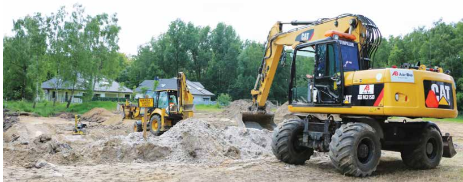
Prace ziemne związane z budową fundamentów placówki

Po wielu staraniach budowa żłobka i przedszkola w Psarach staje się faktem. 25 kwietnia podpisano umowę na wartość blisko 6 mln 700 tys. zł inwestycję, a w maju rozpoczęto prace budowlane.