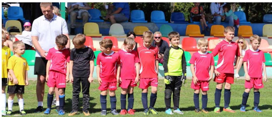
Żaczki rozpoczęły rundę wiosenną

22 kwietnia organizacja i oficjalne rozpoczęcie rundy wiosennej rozgrywek ligowych w Podokręgu Sosnowiec przypadła najmłodszej grupie Żaków ze Sportowej Gminy Psary. Na początku wszystkie drużyny z grupy D, które przez najbliższe tygodnie będą ze sobą rywalizować o awans do finału, zostały uroczysto przywitane.