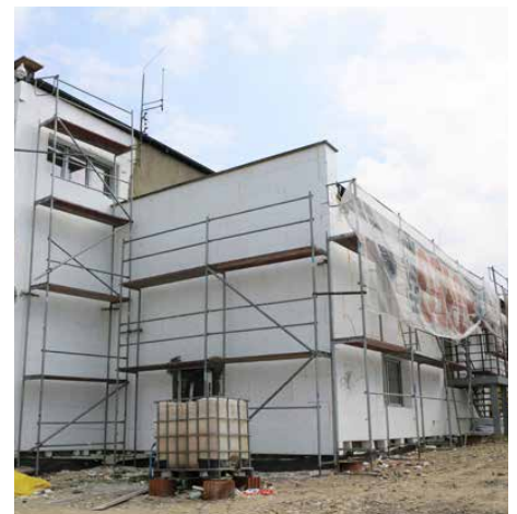
Termomodernizacja OSP w Górze Siewierskiej

Bardzo ważna dla władz gminy jest ochrona środowiska, dlatego w ubiegłym roku powstało oświetlenie hybrydowe w Psarach na ul. Irysów, rozpoczęto kompleksową modernizację energetyczną 4 gminnych budynków oraz zamontowano ogniwa fotowoltaiczne na przedszkolu w Sarnowie, szkołach w Psarach, Sarnowie i Gródkowie oraz Urzędzie Gminy Psary. Dzięki programowi dotacji dla mieszkańców na termomodernizację prywatnych budynków mieszkalnych docieplono ściany, dachy, wymieniono okna i drzwi w 51 budynkach mieszkalnych za blisko 1,6 mln zł.