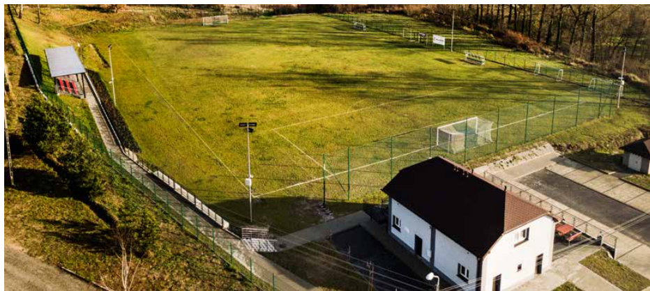
Koszt 1,2 mln zł przebudowano stadion w Strzyżowicach

W trosce o bezpieczeństwo mieszkańców zakupiono 2 wozy ratowniczo-gaśnicze. Pierwszy z nich, ciężki