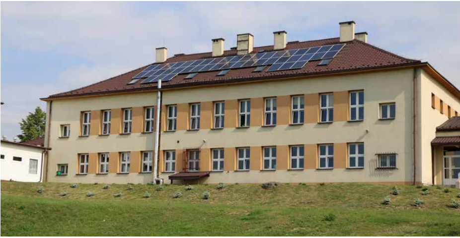
Ogniwa fotowoltaiczne zamontowano m.in. na szkole w Sarnowie