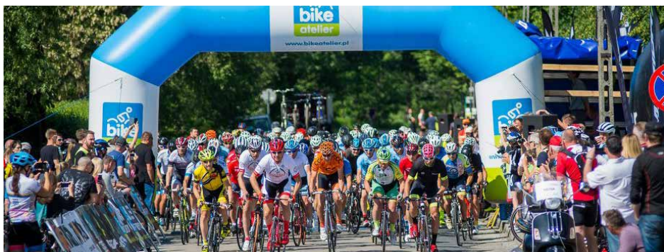
Przeszło 350 zawodników rywalizowało w różnych kategoriach wiekowych o Puchar Wójta Gminy Psary