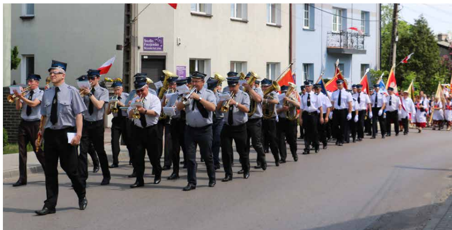
Korowód udał się do Ośrodka Kultury w Sarnowie

3 maja w gminie Psary uroczystość obchodzono kolejną rocznicę uchwalenia Konstytucji 3 Maja.