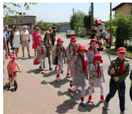
Wśród uczestników obchodów nie zabrakło zuchów