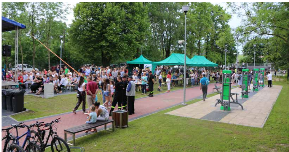
Uroczyste otwarcie zostało połączone z piknikiem rodzinnym

11 maja uroczyste otwarto kompleks rekreacyjno-sportowy przy Ochotniczej Straży Pożarnej w Psarach, w którym powstał m.in. pierwszy w gminie skatepark. Obiekt został zagospodarowany tak, by mogli z niego korzystać wszyscy mieszkańcy gminy – zarówno dorośli, młodzież jak i dzieci znajdą tu coś odpowiedniego dla siebie.