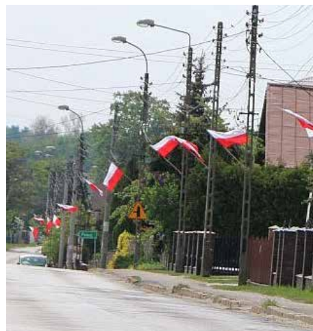
Flagi zawieszono w Dąbju

Przypominamy jednak, że flaga państwowa podlega ochronie prawnej. Zniszczenie jej lub obelżywe traktowanie uznawane jest jako obraza narodu i podlega karze. Polskie prawo nie przewiduje jednocześnie kar za brak wywieszanej flagi narodowej w dniu świąt lub uroczystości państwowych. Intencją ustawodawcy było, aby gest ten wynikał z woli samych obywateli, a nie z przymusu. Red.