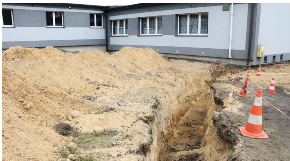
Wkrótce przy byłej szkole w Malinowicach pojawią się m.in. dwie altany i krąg ogniskowy

W maju rozpoczęto prace związane z zagospodarowaniem otoczenia byłej szkoły w Malinowicach. Dzięki temu powstanie nowe miejsce, w którym mieszkańcy będą mogli wypoczywać na świeżym powietrzu.