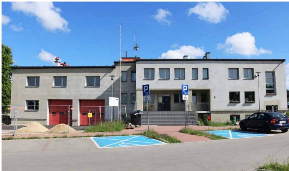
Kompleksowa modernizacja energetyczna remizy OSP w Strzyżowicach

Następnym przedsięwzięciem, które c.d. na str. 4