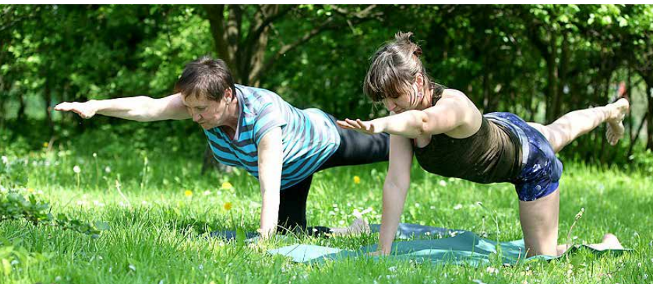
Aktywność dla ciała i umysłu

Dołącz do grona ćwiczących jogę na całym świecie! Spotykamy się na terenie OSP w Dąbiu. Niedziela, godz. 16.00.