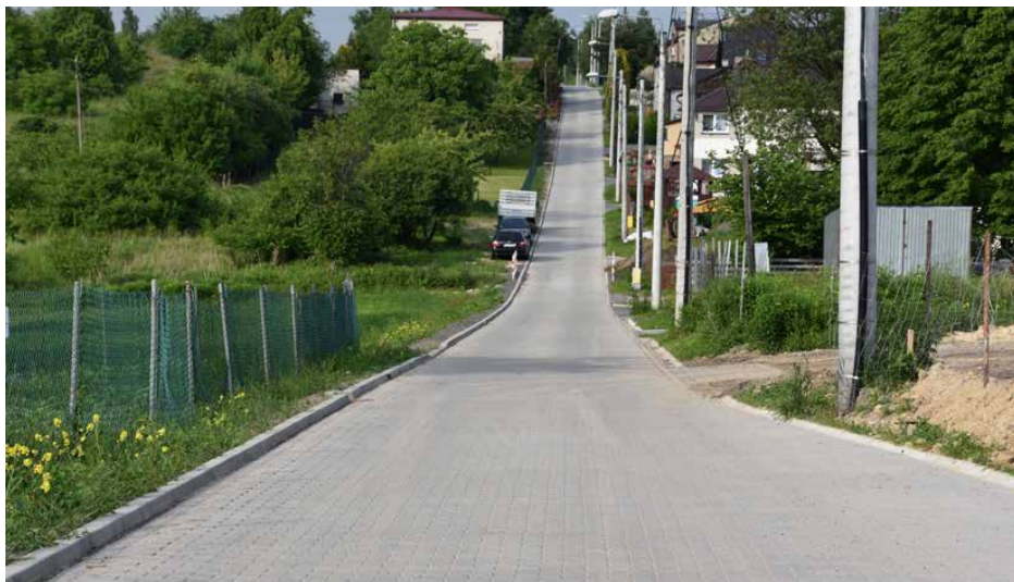
Ulica Wspólna w Gródkowie po zakończeniu budowy

W ubiegłym roku na ten cel wyda- c.d. na str. 7