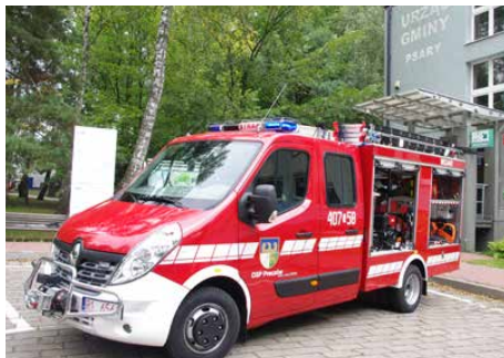
Zakupiono nowy lekki wóz pożarniczy dla OSP Preczów