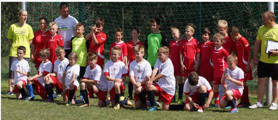
Zawodnicy Akademii Piłkarskiej w Psarach na II Pikniku Wybitnego Piłkarza Śląska

Po krótkiej sesji zdjęciowej przyszła pora na grupę Orlików, w której psarska Akademia wystawiła aż dwie drużyny. W ostatnim meczu oba zespoły spotkały się na boisku, tworząc jedyne w całym turnieju derby. Po uhonorowaniu wszystkich zawodników przyszła kolej na Oldbojów 40+ i mecz Śląsk kontra