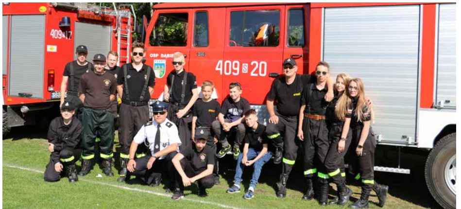
Strażacy z jednostki OSP Dąbie