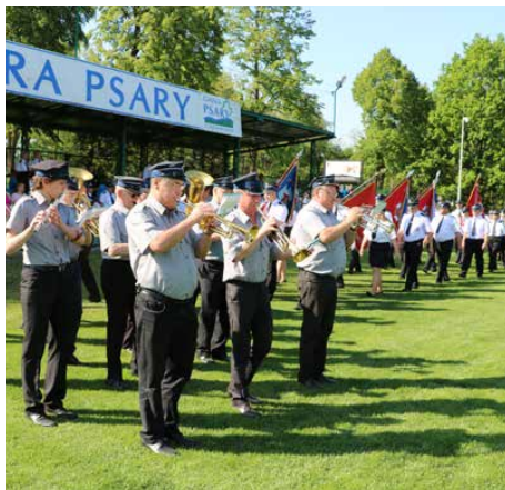
Święto rozpoczął uroczysty przemarsz