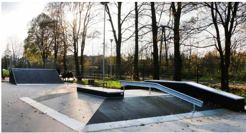
Skatepark w Psarach

Wydatki na przedsięwzięcia remontowo-budowlane w oświacie wyniosły około 1,8 mln zł. Kluczową inwestycją w 2017 r. w zakresie edukacji była budowa przedszkola przy Szkole Podstawowej w Gródkowie za blisko 1,4 mln zł. Ponadto przekształcono gimnazjum w Psarach w szkołę podstawową, w przyziemiach sarnowskiego przedszkola urządzono harcówkę, na placu szkolnym w Sarnowie wykonano nasadzenia, a w Gródkowie powstała nowoczesna pracownia biologiczna tzw „Zielona Pracownia”.