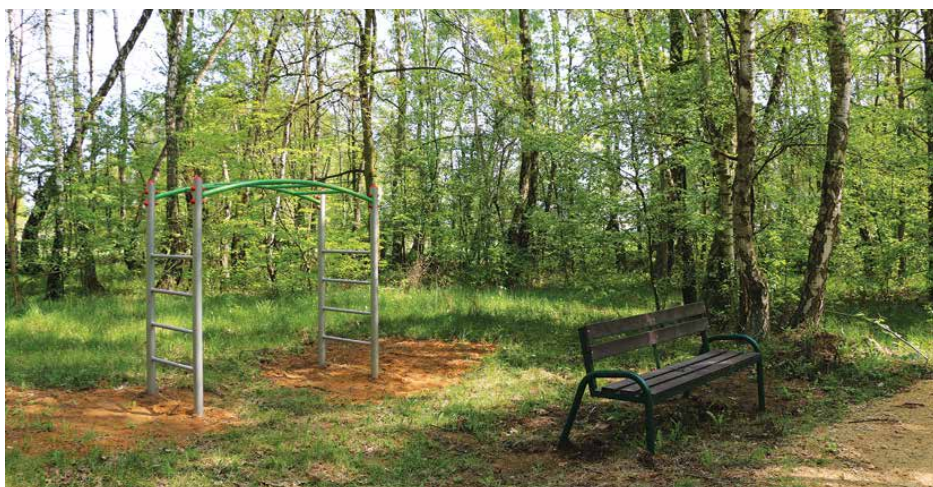
W parku pojawiły się urządzenia sportowo-rekreacyjne i ławki

W parku powstało miejsce, w którym można aktywnie spędzać czas na świeżym powietrzu. Zapraszamy wszystkich mieszkańców do takiej formy wypoczynku, ponieważ ruch i sport są najlepszą drogą do zdrowia i dobrego samopoczucia. Red.