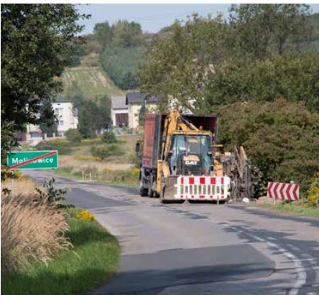
W 2017 rozpoczęto budowę wodociągu z Dąbia do Malinowic

no 3,3 mln zł, a największym przedsięwzięciem z zakresu infrastruktury drogowej była budowa ul. Podwałe w Strzyżowicach połączona z budową sieci kanalizacji sanitarnej ciśnieniowej i odwodnienia rejonu skrzyżowania ul. Podwałe z ul. Rogoźnicką za ponad 1,8 mln zł. Wybudowano również ul. Wspólną w Psarach i Gródkowie za