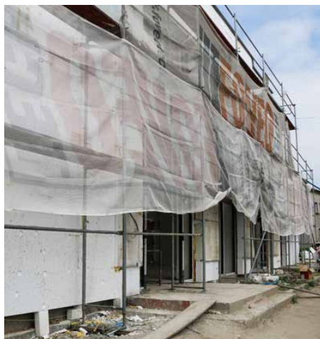
Termomodernizacja remizy OSP w Górze Siewierskiej

W maju ogłoszono listę projektów, które otrzymają dofinansowanie w ramach Regionalnego Programu Operacyjnego Województwa Śląskiego na lata 2014-2020. Aż 5 gminnych inwestycji, dotyczących kompleksowej termomodernizacji budynków użyteczności publicznej oraz mieszkaniowych, otrzyma dotacje, których łączna wartość wyniesie aż 4 201 401,20 zł.