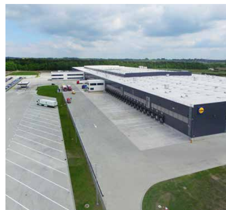
W połowie 2017 r. otwarto centrum dystrybucyjne firmy Lidl

W 2017 r. zrealizowano wiele kluczowych zadań we wszystkich możliwych obszarach, w których gmina może być aktywna. To rok, w którym rozpoczęto realizację 3 letniego planu inwestycyjnego na lata 2017-2019 o wartości oko-