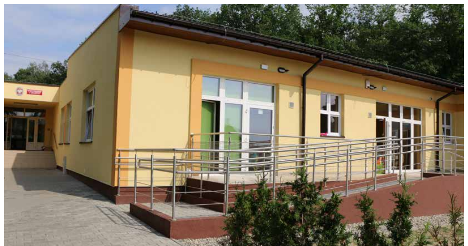
Budowa nowego przedszkola w Gródkowie kosztowała blisko 1,5 mln zł

W ubiegłym roku pełną parą ruszyła realizacja 3 zadań, za ponad 3 mln 370 tys. zł, polegających na budowie sieci wodociągowej wraz z przyłączami o łącznej długości 15 km. Zakład Gospodarki Komunalnej własnymi siłami wykonał odcinki wodociągu o długości 1,2 km na ulicach: Południowej w Gródkowie, Polnej i Górnej w Psarach, Skowronków w Preczowie, Bukowej w Malinowicach, Strzyżowickiej na granicy Psar i Będzina oraz zakupił 420 wodomierzy radiowych i zestaw do odczytu zdalnego. Powstała także dokumentacja techniczna budowy odcinków sieci wodociągowej o długości 10 km w Gródkowie, Malinowicach, Brzękowicach Górnych, Gołąszy Górnej i Preczowie oraz trwały intensywne prace przy opracowywaniu dokumentacji technicznej dla budowy blisko 25 km sieci zbiorczej kanalizacji sanitarnej.