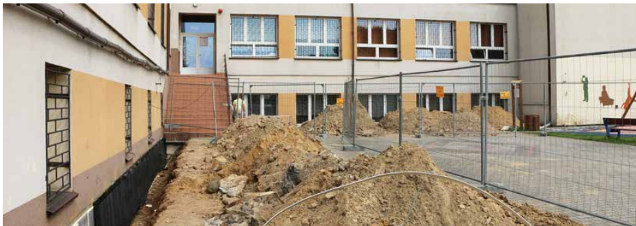
Wykonywane są izolacje ścian piwnicznych budynku szkoły

Rozpoczęto, wartą blisko 1,2 mln zł, kompleksową modernizację energetyczną Szkoły Podstawowej w Strzyżowicach. W tym roku planowany jest również montaż instalacji fotowoltaicznej na dachu budynku. Dzięki tym przedsięwzięciom szkoła stanie się bardziej ekologiczna.