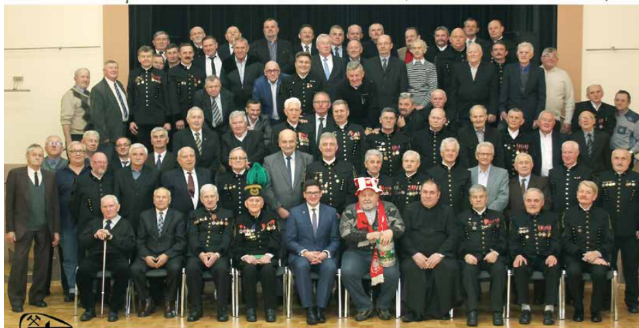
Górnicy z terenu gminy Psary po raz kolejny obchodzili swoje święto w Gminnym Ośrodku Kultury.