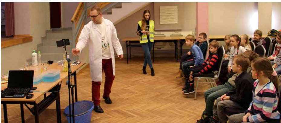
Młodzi studenci dowiedzieli się podczas zajęć jakie tajemnice skrywa woda

Woda to najbardziej rozpowszechniony, ale i jeden z najdziwniejszych związków chemicznych na Ziemi. Jako jedna z niewielu substancji może występować w trzech stanach skupienia: stałym, ciekłym i gazowym. Ma ogromną pojemność cieplną, szczególną gęstość i nietypową budowę atomową, która czyni ją wyjątkowym rozpuszczalnikiem.