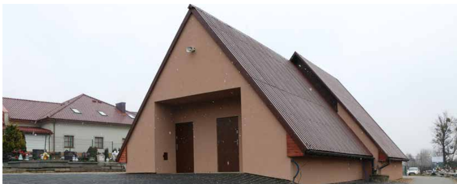
Wyremontowany budynek kaplicy na cmentarzu w Strzyżowicach

W ramach poprzedniej inwestycji na cmentarzu komunalnym wybudowano sześć wzajemnie krzyżujących się alejek wykonanych z kostki betonowej drobnowymiarowej o łącznej powierzchni 806 m 2 . W centralnej części cmentarza, znajdującej się przy krzyżu, ułożono płyty