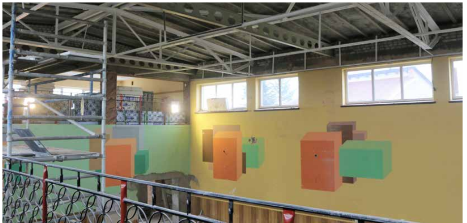
Prace remontowe w sali bankietowej w Górze Siewierskiej

Podczas dotychczasowych prac fundamenty boczne ścian zostały odkopane, a następnie oczyszczone. Dzięki temu możliwe będzie wykonanie izolacji przeciwwilgociowej i ocieplenia. Jedno z przyłączy gazowych zostało zlikwidowane, a w jego miejsce powstanie nowe, zasilające kotłownię usytuowaną w nowej lokalizacji. Ponadto nad salą widowiskową zamontowano niezależną konstrukcję nośną, opartą bezpośrednio na zewnętrznych ścianach nośnych budynku, służącą do podwieszenia nowe-