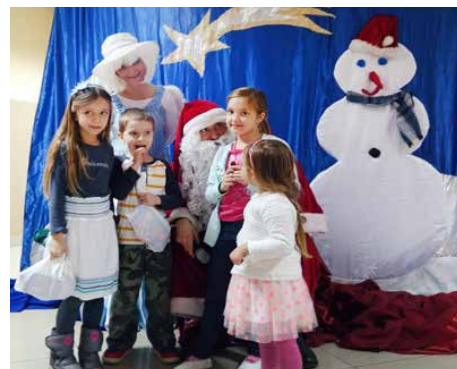
W Preczowie sołeckie Mikołajki wyszły jak zawsze udanie

Serdecznie dziękujemy wszystkim uczestnikom za wspólną zabawę. Do zobaczenia za rok! GOK.