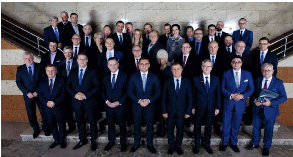
Laureaci tytułu Samorządowca Roku 2017