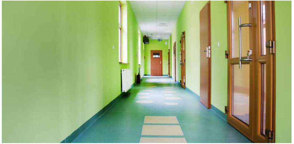
Ukończone wnętrze nowego przedszkola w Gródkowie

Od 3 do 18 stycznia 2018 r. trwa rekrutacja m.in. do grupy popołudniowej, która będzie działać w godzinach 12:00-17:00. Wszystkie informacje na temat rekrutacji można uzyskać w Szkole Podstawowej w Gródkowie, pod numerem telefonu 32 267 22 40 lub na stronie internetowej www.spgrodkow.edupage.org Red.