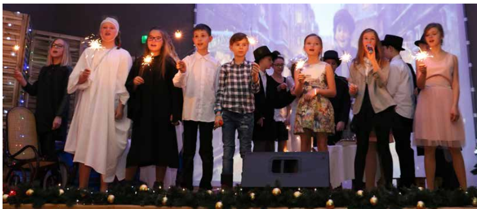
Występ uczniów ze Szkoły Podstawowej w Dąbiu podczas „Wieczoru kolęd i pastorałek”