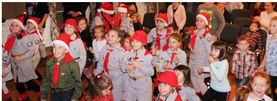
Na imprezie Mikołajkowej w Dąbiu nie zabrakło animacji ruchowych dla dzieci

W tym roku dzieci z gminy Psary miały okazję spotkać się z Mikołajem 1 grudnia w Ośrodku Kultury w Preczowie oraz 3 grudnia w Ośrodku Kultury w Dąbiu.