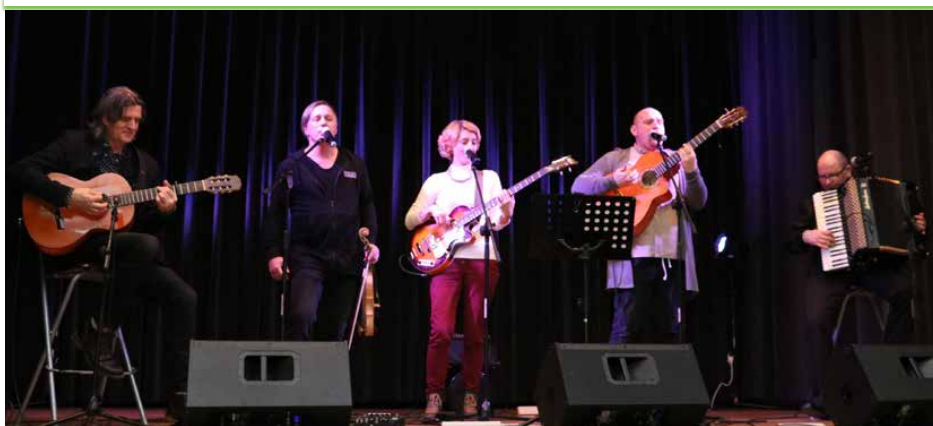
Koncert zespołu „Dzień dobry” w Psarach

w magiczny, świąteczny nastrój zgromadzonych gości wprowadziły ciekawe aranżacje kolęd i pastorałek. Koncert