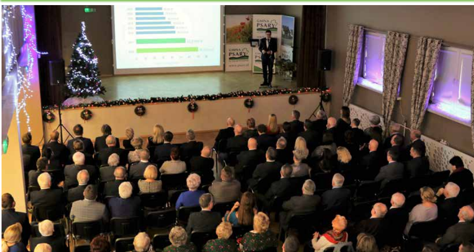
Wójt gminy Psary przedstawił prezentację osiągnięć samorządu w 2017 r.