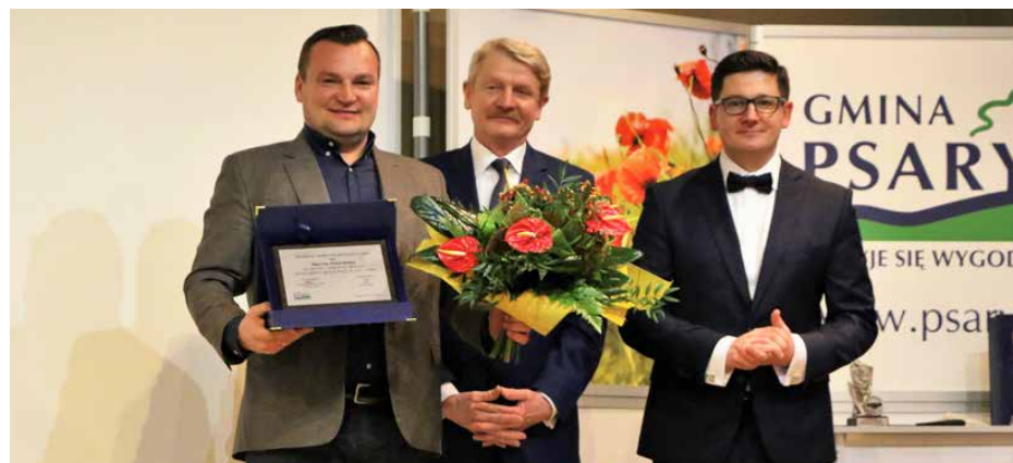
Wójt wraz z Przewodniczącą Rady Gminy złożył podziękowania dla Gospodarstwa Ogrodniczego T. Mularski za współpracę z samorządem w 2017 r.

czeństwa mieszkańców oraz bazy sportowo-rekreacyjnej. Wydatki majątkowe gminy w 2017 r. sięgnęły 16,4 mln zł, a do największych przedsięwzięć należą: budowa przedszkola przy Szkole Podstawowej w Gródkowie, rozpoczęcie budowy Centrum Usług Społecznych w Strzyżowicach, przebudowa remizy OSP w Górze Siewierskiej, bu-