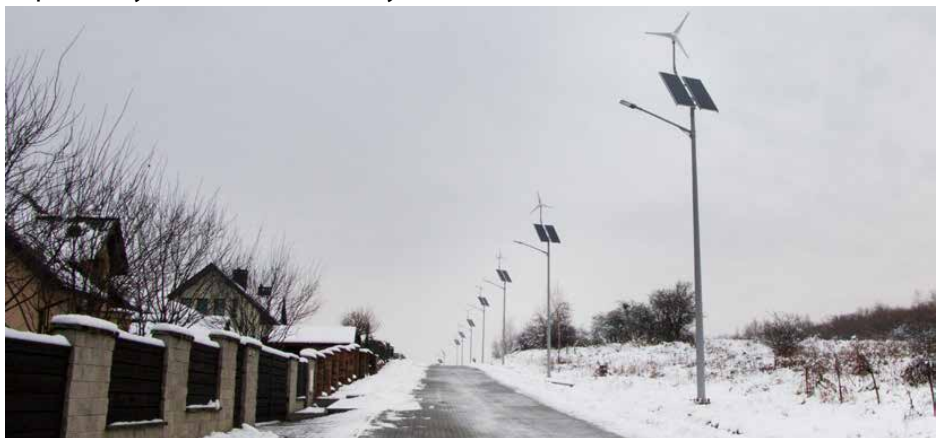
Oświetlenie hybrydowe na ul. Irysów w Psarach