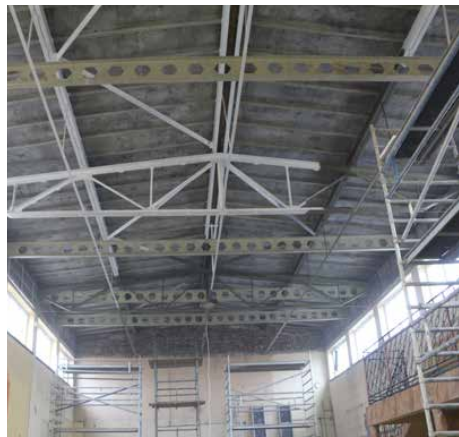
W obiekcie zamontowano niezależną konstrukcję nośną sufitu

go sufitu z płyt kartonowo-gipsowych i oświetlenia. Rozpoczęto również skuwanie starych tynków ze ścian i sufitów oraz posadzek. Z dachu obiektu zerwano stare ocieplenie z płyt wiórowych i pokrycie z papy termozgrzewalnej.