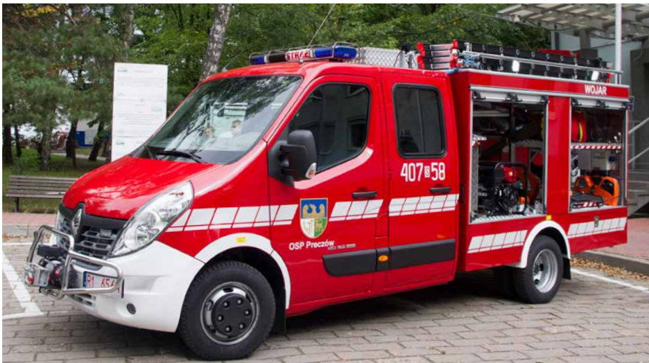
Nowy wóz ratowniczo-gaśniczy OSP Preczów dofinansowany z funduszu sołeckiego

Mieszkańcy Góry Siewierskiej fundusz w wysokości 30 836 zł w całości przeznaczyli na termomodernizację i przebudowę remizy OSP wraz z wypo-