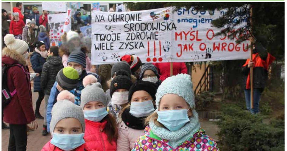
Akcja antysmogowa zorganizowana przez szkołę w Strzyżowicach