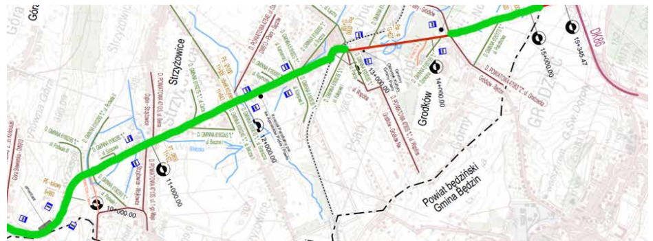
Powstał już projekt budowlany przebudowy DW 913

W związku z planowaną budową gminnej oczyszczalni ścieków, kanalizacji sanitarnej ciśnieniowej oraz przebudową sieci wodociągowej, psarski samorząd postanowił, przy okazji modernizacji DW 913, wybudować w jej pasie, kanalizację sanitarną i przebudować sieć wodociągową. Zadanie będzie realizowane wspólnie z Województwem Śląskim, w imieniu którego działa Zarząd Dróg Wojewódzkich w Katowicach. Zasady współpracy oraz zakres obowiązków będzie regulować zawarte pomiędzy stronami porozumienie. Taka formuła realizacji zamówienia jest niezwykle korzystna finansowo dla gminy