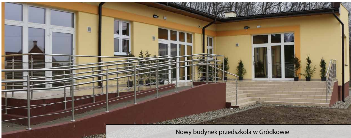
Nowy budynek przedszkola w Gródkowie

W grudniu 2017 r. zakończono budowę przedszkola w Gródkowie. Nowa placówka dla najmłodszych mieszkańców gminy rozpocznie działalność już 12 lutego.