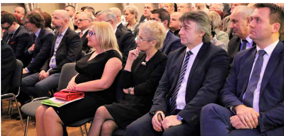
Zgromadzeni goście na spotkaniu samorządowym

W ubiegłym roku realizowano wiele zadań – praktycznie we wszystkich możliwych obszarach aktywności samorządu gminnego, a szczególnie w zakresie: edukacji, kultury i integracji społecznej, infrastruktury drogowej i wodno-kanalizacyjnej, ochrony środowiska, bezpie-