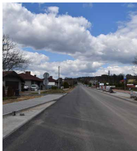
Inwestycja poprawi bezpieczeństwo podróżujących

Każdy remont czy przebudowa wiąże się z utrudnieniami, które wymagają wiele zrozumienia i cierpliwości. Wiemy jednak, że są one konieczne