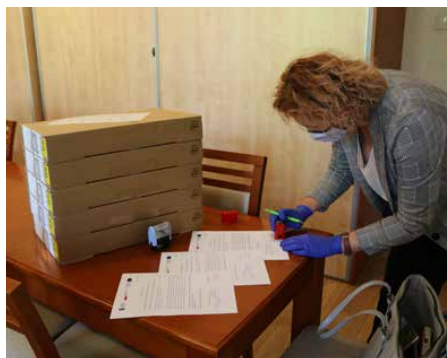
Do szkół trafiły komputery do nauki zdalnej

Gdy rząd ogłosił, że uczniowie przechodzą na naukę zdalną, władze gminy w pierwszej kolejności przekazały do szkół 37 zestawów komputerowych z kamerami i mikrofonami. Sprzęt pochodził z zakończonego unijnego projektu, polegającego na utworzeniu publicznych punktów dostępu do Internetu w placówkach Gminnej Biblioteki Publicznej i Gminnego Ośrodka Kultury. Następnie zakupiono 45 laptopów z pełnym oprogramowaniem,