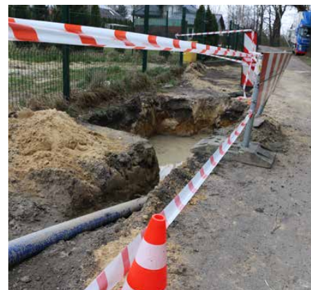
Prace prowadzone są metodą przewiertu sterowanego

Wykonawcą prac jest Zakład Gospodarki Komunalnej w Psarach, a ich koszt sięga 300 000 zł. Planowany termin zakończenia inwestycji to początek maja. Red.