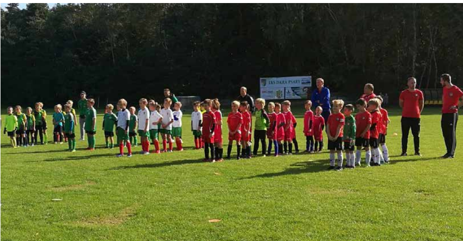
Turniej grupowy został zorganizowany na stadionie LKS Iskra Psary

Ten rok, nadal z pandemią w tle, w niektórych aspektach wciąż jeszcze ogranicza zawodników pewnymi restrykcjami. W tym sezonie planują jednak pracę z jeszcze większym zaangażowaniem w aktywność i zdrowy styl życia. W trakcie przygotowań do tegorocznej rundy wiosennej, po raz kolejny zawodnicy zostali zaskoczeni przymusową przerwą, która trwała 3 tygodnie. Również tutaj sportowcy wykazali się jednak prawdziwym zapałem i kolejny raz udowodnili, że piłka jest ich prawdziwą pasją. W challenge zorganizowanym przez trenerów chętnie przesyłali zdjęcia i filmiki z domowych treningów oraz zabaw z rodziną przy stworzonej specjalnie z myślą o nich, piłkarskiej planszówce. Od 19 kwietnia wszyscy wrócili do treningów na boiskach oraz do rozgrywek ligowych. Akademia Piłki Nożnej na tym jednak nie poprzestaje. W tej chwili na organizowany przez APN letni obóz sportowy lista chętnych osób jest już pełna. Powrót do stacjonarnych treningów pozwala z nadzieją patrzeć w przyszłość i realizować kolejne wyzwania oraz plany. APN