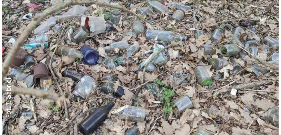
W części Parku Żurawiniec, która nie należy do Gminy zalega mnóstwo śmieci

Nie brakuje również miejsc, gdzie wyrzucane są stare meble, zużyty sprzęt elektryczny i elektroniczny, opony czy odpady remontowe. Przypominamy, że każdy z nas płaci opłatę za gospodarowanie odpadami komunal-