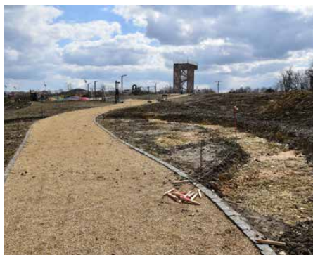
W ostatnim czasie wytyczona została ścieżka edukacyjna

Równocześnie, opracowywana jest edukacyjna ścieżka zapobiegania niskiej emisji złożona z 23 tablic, z których dowiemy się czym jest niska