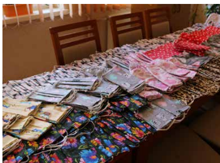
W akcję zycia maseczek zaangażowała się wiele osób

Gminna Biblioteka Publiczna od początku pandemii działa w mocno ograniczonym zakresie. Zgodnie z wytycznymi odwołano wszystkie