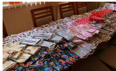
PANDEMIA W GMINIE PSARY - ROK PEŁEN WYZWAŃ