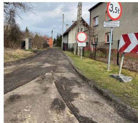
Na ul. Krótkiej trwa budowa kanalizacji deszczowej

w Sarnowie jest realizowana przy pomocy dotacji celowej z budżetu Górnośląsko-Zagłębiowskiej Metropolii w ramach Programu „Metropolitalny Fundusz Solidarności” w kwocie 200 tys. zł. Red.