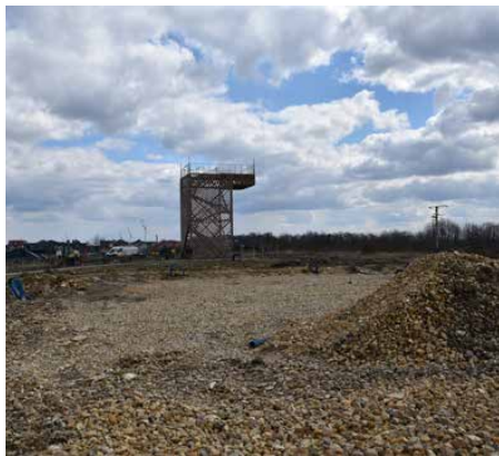
Przy Parku Linearnym powstanie parking

PLANOWANIE, BUDOWA I KONKURS – AŻ TYLE DZIEJE SIĘ W TRAKCIE TRWANIA PROJEKTU PN. „ZAGŁĘBIOWSKI PARK LINEARNY – REWITALIZACJA OBSZARU FUNKCJONALNEGO DOLINY RZEK PRZEMYSZY I BRYNICY”. PODOBNIEM JAK W PRZYPADKU ETAPU I, RÓWNIEM II BĘDZIE PRAWIE W CAŁOŚCI SFINANSOWANY Z POZYSKANYCH DOTACJI KRAJOWYCH I UNIJNYCH. ŁĄCZNIE NA TO ZADANIE GMINA PSARY ZDOBYŁA PONAD 4,1 MLN ZŁ DOFINANSOWAŃ.