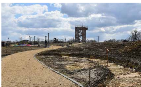
RUSZYŁ II ETAP PRAC W ZAGĘBIEWSKIM PARKU LINEARNYM