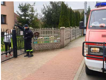
Strażacy angażują się w pomoc mieszkańcom

W związku z pandemią do gminnych jednostek Ochotniczych Straży Pożarnych trafiło dodatkowe wyposażenie, w tym m.in.: kombinezony, okulary ochronne, maseczki i nitrylowe rękawice. Ponadto odpowiadając na prośbę Rejonowego Pogotowia Ratunkowego oraz Szpitala Powiatowego w Czeladzi, psarski samorząd wsparł te instytucje kwotą 50 000 zł. Środki te pozwoliły m.in. na zakup maseczek, kombinezonów i gogli dla