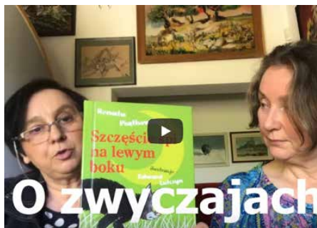
Część działalności biblioteki przeniosła się do sieci

Drugim obszarem, w którym Gmina może pomóc przedsiębiorcom jest podatek od nieruchomości wykorzystywanych pod działalność gospodarczą. Pracownicy urzędu gminy zweryfikowali liczbę i status podatników oraz fakt czy są właścicielami nieruchomości. Weryfikacji poddano także ilość oraz status najemców. Ustalono również poziom wpływów z podatków od osób prowadzących działalność gospodarczą na terenie naszej gminy. Właściciel nieruchomości może wnie-