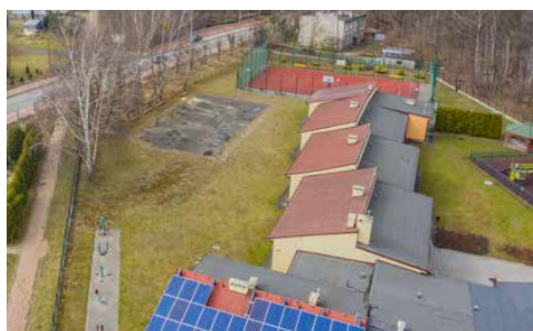
1,7 MLN DOTACJI NA BUDOWĘ SALI GIMNASTYCZNEJ W GRÓDKOWIE