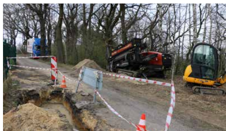
Inwestycja zakłada budowę ponad 440 m sieci wodociągowej

W KWIETNIU ZAKŁAD GOSPODARKI KOMUNALNEJ W PSARACH ROZPOCZĄŁ BUDOWĘ NOWEJ SIECI WODOCIĄGOWEJ W PRECZOWIE NA UL. JAWOROWEJ. WSZYSTKIE PRACE PROWADZONE SĄ METODĄ PRZEWIERTU STEROWANEGO.