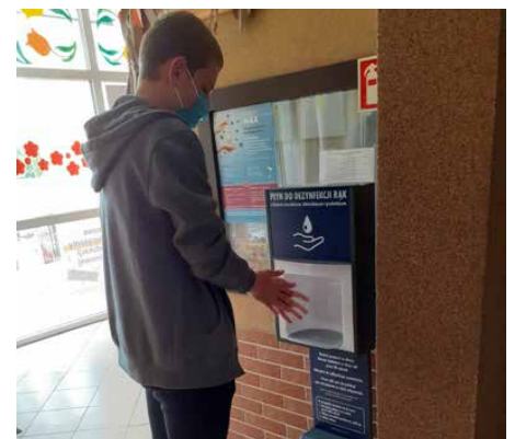
W szkołach pojawiły się dozowniki z płynem dezynfekującym

W przedszkolach opracowano i wdrożono nowe procedury organizacji opieki, bezpieczeństwa i higieny w czasie pandemii. Ograniczono do niezbędnego minimum przebywanie