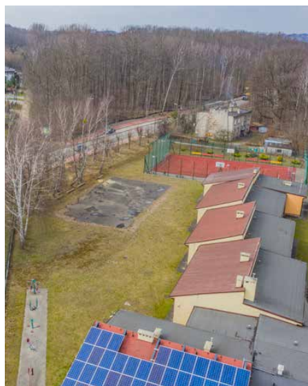
Przy szkole powstaje nowa sala gimnastyczna

Gmina przystąpiła już do budowy sali gimnastycznej. Na początku bieżącego roku wybrano wykonawcę prac, z którym 17 marca podpisano umowę. Zwycięskie konsorcjum firm: PHU MONTER Grzegorz Wąsowicz