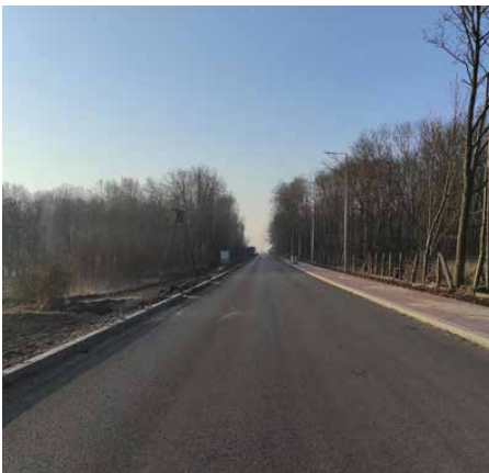
Na jezdni ułożono warstwy wiążące z betonu asfaltowego

Wiosna dopiero się rozpoczęła, ale pogoda cały czas sprzyjała inwestycjom w naszej gminie. Firma Strabag,