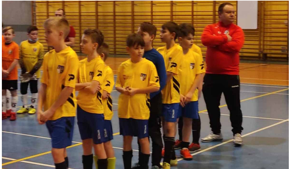
Młodzi piłkarze brali udział w różnych turniejach

Całkowity lockdown poskutkowało przerwą w treningach od 11 marca do 24 maja, a wiosenna runda w Podokręgu Sosnowiec została odwołana. W momencie, gdy tylko pojawiło się zielone światło do powrotu na boiska, w ścisłym reżimie sanitarnym zawodnicy wznowili treningi we wszystkich grupach. Przyzwyczajając się z każdym miesiącem do nowych realiów, w okresie wakacyjnym rozpoczęły się przygotowania do rundy jesiennej, a już od końca sierpnia Podokręg Sosnowiec wznowił rozgrywki ligowe. Podobnie jak w poprzednim sezonie, zawodnicy grali w 4 kategoriach wiekowych: Młodzik, Młodzik Młodszy, Orlik i Żak. W ramach zawodów odbywały się mecze wyjazdowe oraz rozgrywane u siebie, przy udziale wykwalifikowanych sędziów. Grupy Młodzików i Żaków grały na stadionie LKS Iskra w Psarach, a Orlików na Orliku przy Szkole Podstawowej w Psarach. W sumie w rundzie jesiennej odbyło się 36 meczy z czego 19 na wyjeździe, a 17 u siebie oraz 7 turniejów Żaków. W turniejach zgłoszonych było 6 drużyn, które rozgrywały ze sobą mecze systemem „każdy z każdym”. Zatem 15 meczy na turniej, a organizatorem jednego z nich – grupowego, była Gmina Psary. Okres zimowy u naszych