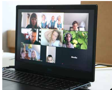
Projekty GOK-u były realizowane za pośrednictwem platform internetowych

Pandemiczny czas wykorzystano również na poprawę infrastruktury i terenów wokół placówek, przeglądy wyposażenia technicznego ośrodków i świetlic oraz prace naprawcze i po-