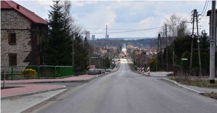
Przebudowa DW 913 zmierza ku końcowi

GÓRA SIEWIERSKA, STRZYŻOWICE, PSARY I GRÓDKÓW TO MIEJSCOWOŚCI, PRZEZ KTÓRE PRZEBIEGA DROGA WOJEWÓDZKA NR 913. PRACE ZWIĄZANE Z JEJ PRZEBUDOWĄ ODBYWAJĄ SIĘ ZGODNIE Z PLANEM I ZMIERZAJĄ KU KOŃCOWI.