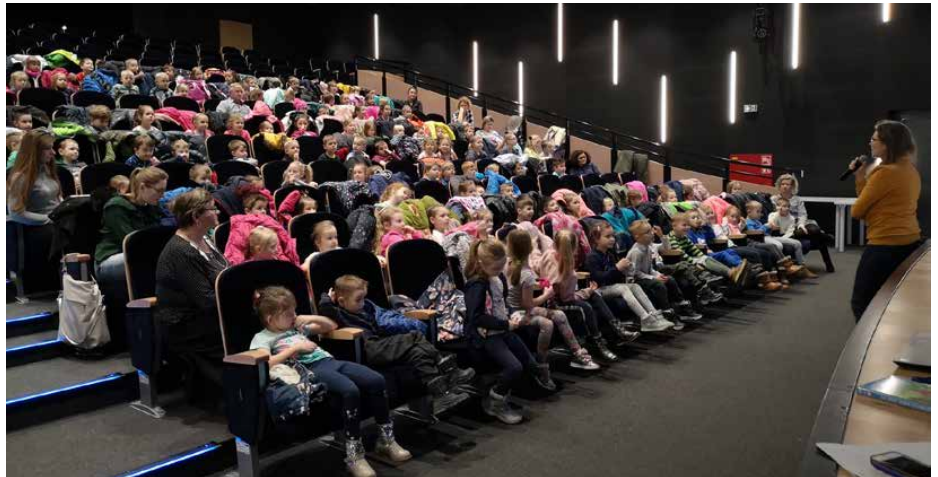
Stacjonarne zajęcia Akademii Filmowej odbywały się do marca 2020 r.

Drugim projektem, który realizowaliśmy równolegle do filmowych opowieści, była inicjatywa skierowana do gminnych zespołów śpiewaczych, pt. Wyśpiewana tradycja – zespoły śpiewacze zagłębia dąbrowskiego. Największy kulturalny projekt realizowany w 2020 r. przez GOK dofinansowany był również w ramach projektu Narodowego Centrum Kultury - Kultura w sieci. Wzięło w nim udział ponad 120 osób ze wszystkich 9 zespołów śpiewaczych z gminy Psary, a także ekspertki z Instytutu Sztuk Muzycz-