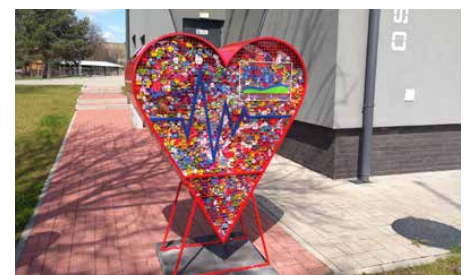
Mieszkańcy, aby pomóc dziewczynce przekazali wiele nakrętek