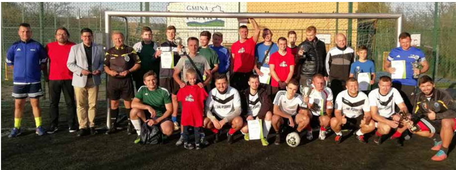
VII edycję GALO wygrał zespół IW Psary

Zwycięzcami VII edycji Gminnej Amatorskiej Ligi Orlika został zespół IW Psary, II miejsce w tabeli zajął Somax, III miejsce