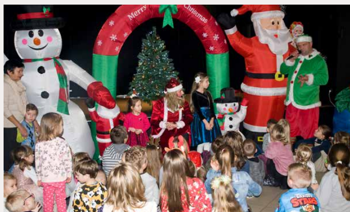
Święty Mikołaj spotkał się z najmłodszymi w Preczowie

Tym razem forma spotkania była nieco inna niż w latach poprzednich. Na początku Pipek i Psotka – elfy Świętego Mikołaja – wspaniale bawiły się z licznie zgromadzonymi dziećmi. Było mnóstwo zabawy i śmiechu! Następnie, na głośne zaproszenie maluchów, przybył Święty Mikołaj, który dla każdego dziecka miał słodki upominek. Sponsorem tego radosnego wydarzenia była firma MILES, która co roku pamięta o najmłodszych mieszkańcach Preczowa oraz Gminny Ośrodek Kultury. GOK