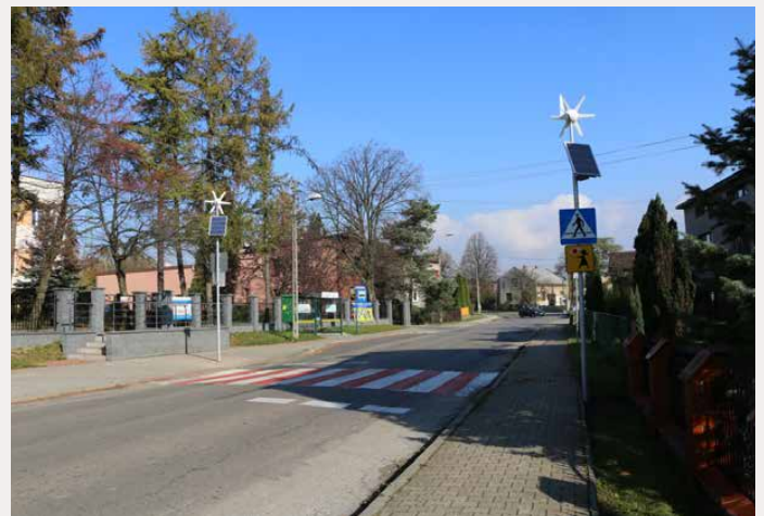
Jedno z przejść powstało przy szkole w Dąbiu

Inteligentne, czyli automatycznie oświetlane przejścia dla pieszych działają w bardzo prosty sposób. Żółte pulsujące światło na znaku drogowym znajdującym się przy przejściu aktywuje się samoczynnie gdy pieszy do niego podchodzi. Zainstalowanie tego typu rozwiązania podyktowane było troską o bezpieczeństwo dzieci uczęszczających do szkół w Dąbiu i Sarnowie. Red.