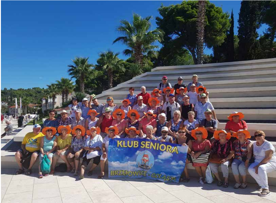
Uczestnicy rejsu wzdłuż wybrzeża Dalmacji na wyspie Šolta

JESIEŃ – PRZEZ WIELU UZNAWANA ZA PRZYGNĘBIAJĄCĄ PORĘ ROKU – SENIOROM JEST SZCZEGÓLNIIE BLISKA. I NIE CHODZI TU JEDYNIIE O JESIEŃ W KONTEKŚCIE ŻYCIA, ALE TEŻ O PAŹDZIERNIKOWE ŚWIĘTOWANIE DNIA SENIORA ORAZ WSPÓLNE WYJAZDY, REMEDIUM NA JESIENNE SMUTKI.