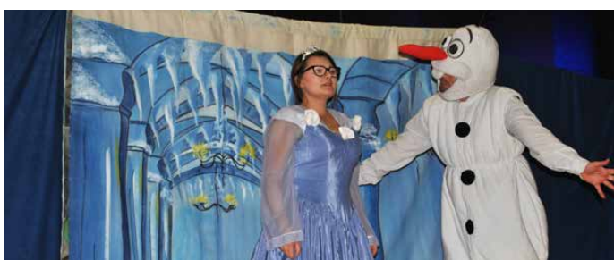
Strzyżowicka scena zamieniła się w lodową krainę

7 GRUDNIA SCENA CENTRUM USŁUG SPOŁECZNYCH W STRYŻOWICACH ZAMIEIŁA SIĘ W MAGICZNY ŚWIAT LODU I ŚNIEGU. WSZYSTKO DZIĘKI AKTOROM Z KRAKOWA, KTÓRZY ZAPREZENTOWALI MŁODYM WIDZOM PRZEPIĘKNĄ BAŚŃ PT. „LODOWA KRAINA”.