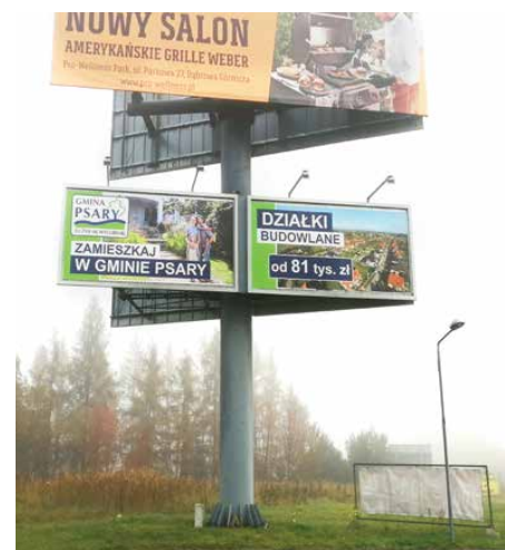
Nowe billboardy zachęcają do kupna gminnych działek

To nie koniec zmian. W tym samym miesiącu wymieniona została również tablica przed Urzędem Gminy Psary, na której znajduje się teraz mapa gminy z zaznaczonymi charakterystycznymi miejscami. Wykonawcą tej inwestycji była Pracownia Reklamy ARKANA z Katowic, a jej koszt sięgnął 1230 zł. Red.