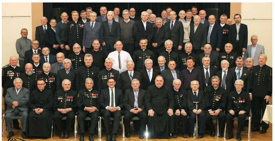
Gwarkowie z gminy Psary spotykają się co roku w Barbórkę