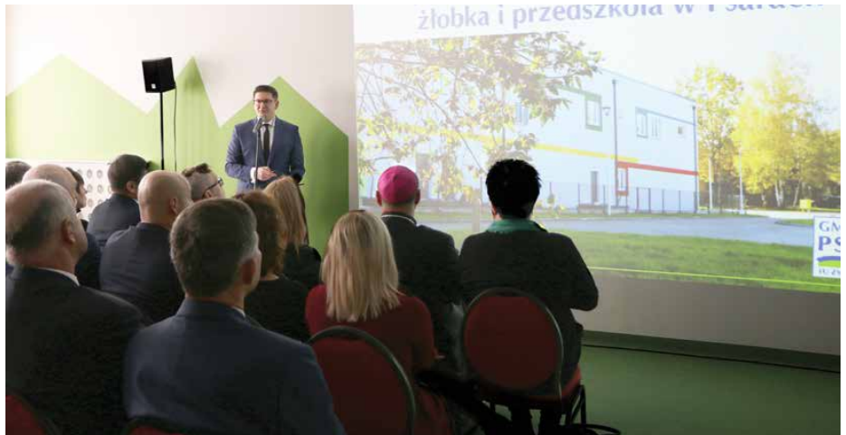
Wójt Gminy Psary przedstawił prezentację multimedialną dotyczącą etapów powstawania żłobka od momentu decyzji o budowie, aż do uruchomienia placówki

Zmienił się również teren wokół placówki, gdzie powstał parking z drogą dojazdową i 50 miejscami postojowymi oraz chodniki. Maluchy mają do swojej dyspozycji ogrodzony plac zabaw o powierzchni około 315 m 2 , na którym wydzielona jest część o nawierzchni poliuretanowej z urządzeniami zaba-