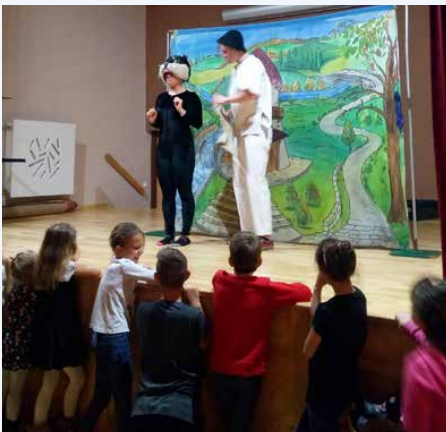
Dzieci chętnie współtworzą spektakle teatralne

W OSTATNIM CZASIE NAJMŁODSI MIESZKAŃCY GMINY MIĘLI OKAZJĘ ZOBACZYĆ DWA SPEKTAKLE TEATRALNE. ARTYŚCI ZE STUDIA MAŁYCH FORM TEATRALNYCH KRAK-ART Z KRAKOWA, DZIĘKI WYJĄTKOWYM SCENOGRAFIOM, KOSTIUMOM I MUZYCE PRZENIEŚLI MŁODYCH WIDZÓW W BAJKOWY ŚWIAT SMOKA WAWELSKIEGO I KOTA W BUTACH.