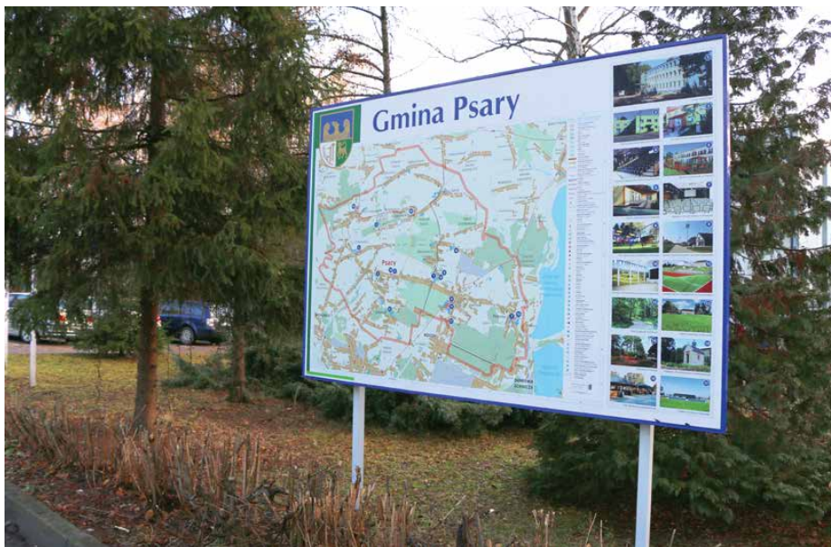
Tablica z mapą znajduje się przed Urzędem Gminy Psary

W OSTATNIM CZASIE PRZY DK 86 WYMIENIONE ZOSTAŁY BILLBOARDY REKLAMUJĄCE GMINNE DZIAŁKI NA SPRZEDAŻ, A NA TABLICY ZNAJDUJĄCEJ SIĘ PRZED URZĘDEM GMINY PSARY POJAWIŁA SIĘ MAPA GMINY.