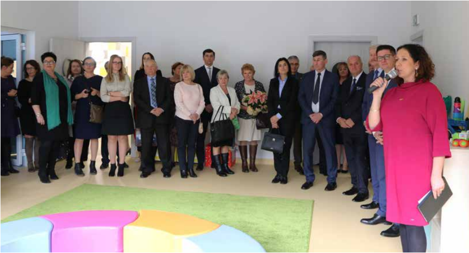
12 grudnia odbyło się uroczyste otwarcie gminnego żłobka

zbudowany tak, by mogły z niego swobodnie korzystać osoby niepeł-