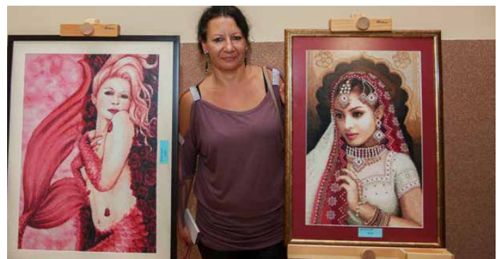
Wystawa prac członków Stowarzyszenia Twórców Kultury Zagłębia Dąbrowskiego

Organizatorem tego wyjątkowego wernisażu było Stowarzyszenie Twórców Kultury Zagłębia Dąbrowskiego. GOK