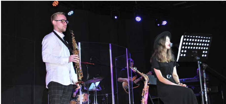
Koncert przyciągnął wielu miłośników jazzu

3 LISTOPADA W CENTRUM USŁUG SPOŁECZNYCH W STRYŻÓWICACH ODBYŁY SIĘ ZADUSZKI JAZZOWE W WYKONANIU ZESPOŁU INSPIRED JAZZ QUINTET.