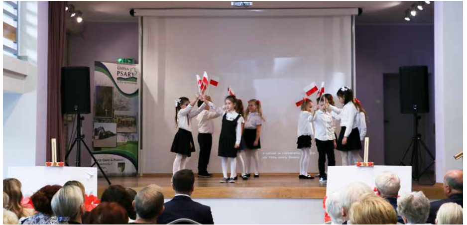
Część artystyczną obchodów uświetniły występy uczniów ze Szkoły Podstawowej w Gródkowie