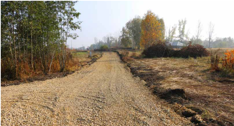
Nowa nawierzchnia z kruszywa na ulicy Promiennej w Malinowicach

Nowa nawierzchnia z kruszywa łamanego pojawi się na blisko 600 m odcinku ulicy Promiennej w Malinowicach. Koszt tego przedsięwzięcia to