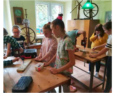
Uczniowie w nowej pracowni zdobywają wiedzę praktyczną

Co ważne, uczniowie pracują metodą CLIL, która łączy prace ręczne z nauką języka angielskiego w formie zabawy i praktycznego stosowania zwrotów anglojęzycznych. SP Dąbie