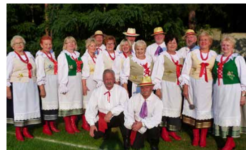
MUZYKA LUDOWA W ARTYSTYCZNYM WYDANIU