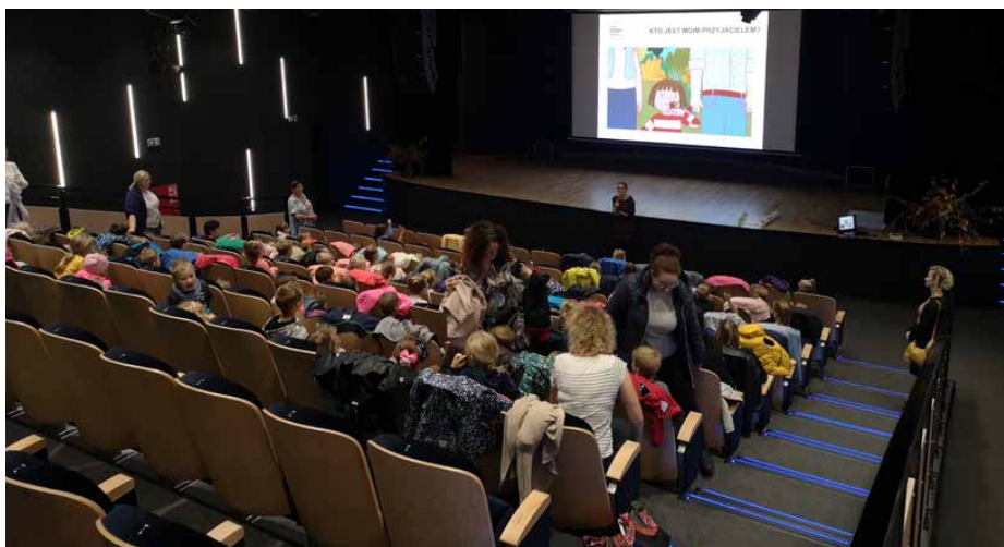
Filmy poprzedzone są ciekawymi prelekcjami

AKADEMIA FILMOWA TO NOWY PROJEKT GMINNEGO OŚRODKA KULTURY, SKIEROWANY DO UCZNIÓW I PRZEDSZKOLAKÓW. PODCZAS CYKLICZNYCH SPOTKAŃ, KTÓRE ODBYWAJĄ SIĘ W CENTRUM USŁUG SPOŁECZNYCH W STRYŻOWICACH, MŁODZI MIESZKAŃCY GMINY OGLĄDAJĄ PROJEKCJE FILMOWE, POPRZEDZONE KRÓTKIMI PRELEKCJAMI.