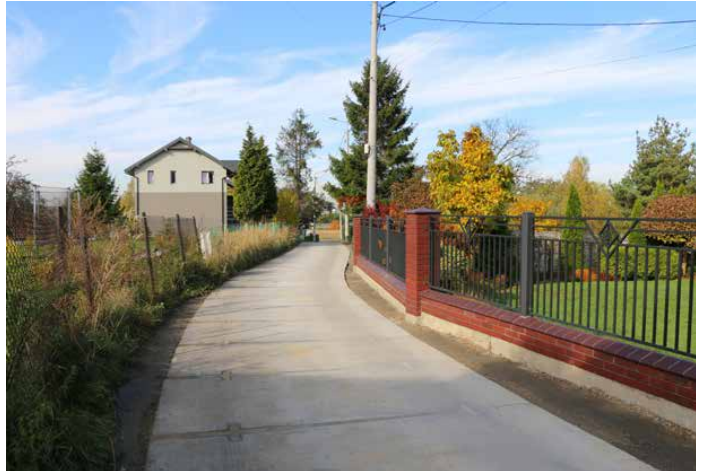
Wyremontowana ulica Graniczna w Sarnowie

Wykonawcą przedsięwzięcia była firma ZRB Tyskie Drogi Sp. z o.o. z Tychów, a jego koszt wyniósł 144 400,20 zł, z czego 103 000 zł zostało pokryte z budżetu gminy Psary, a 41 400,20 zł z budżetu miasta Będzin. Red.