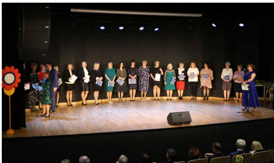
Wyróżnieni zostali pracownicy placówek oświatowych