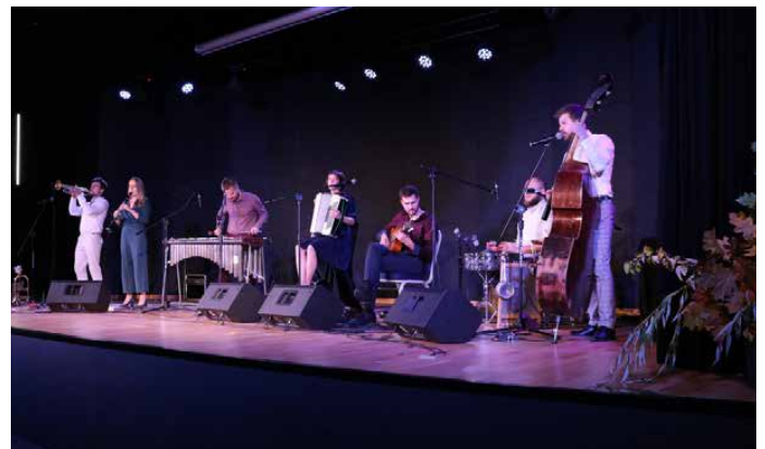
Wydarzenie uświetnił koncert Warszawskiej Orkiestry Sentymentalnej

Impreza była również doskonałą okazją, by zaprosić wszystkich mieszkańców do aktywnego uczestniczenia w życiu kulturalnym gminy oraz korzystania z nowej oferty wydarzeń, przygotowanej na rok kulturalny 2019/2020. GOK