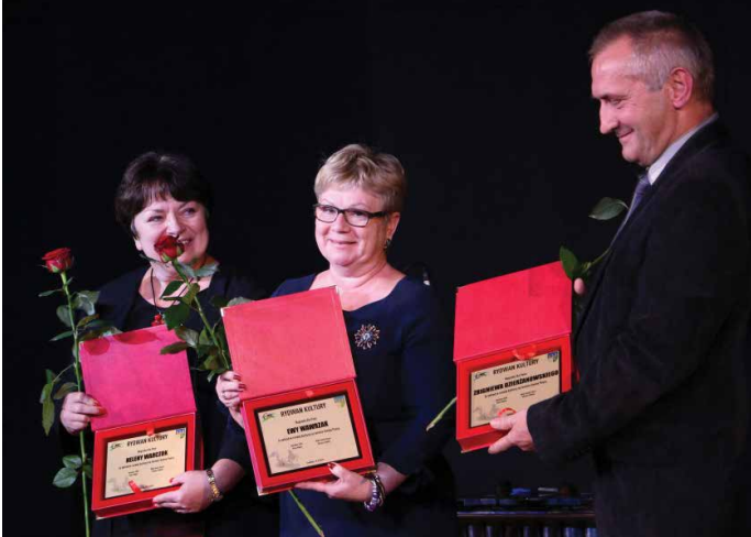
Laureaci tegorocznych „Rydwanów Kultury”

13 PAŹDZIERNIKA W CENTRUM USŁUG SPOŁECZNYCH W STRYŻOWICACH ZAINAUGUROWANO NOWY ROK KULTURALNY 2019/2020. PODCZAS UROCZYSTOŚCI ZOSTAŁY WRĘCZONE „RYDWANY KULTURY” ORAZ ODBYŁ SIĘ KONCERT WARSZAWSKIEJ ORKIESTRY SENTYMENTALNEJ.