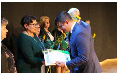
W GMINIE PSARY UCZCZONO DZIEŃ EDUKACJI NARODOWEJ