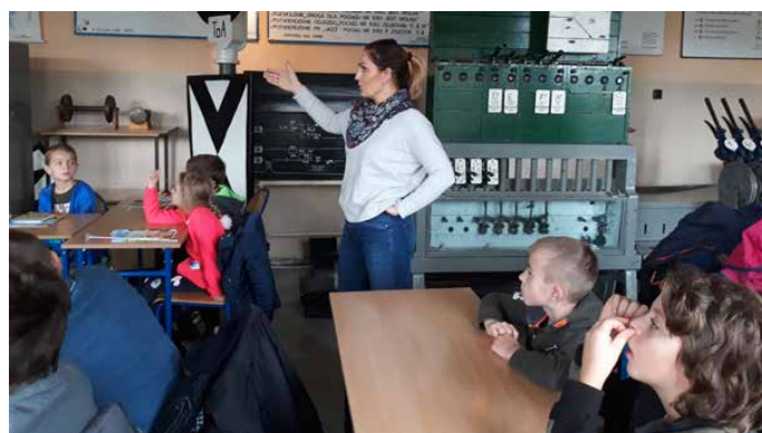
W ramach kampanii „Szlaban na ryzyko” uczniowie odwiedzili Technikum Kolejowe w Sosnowcu

Dla wielu było to zupełnie nowe doświadczenie. Emocje powoli opadają, jednak na pewno nie na długo! Mając u swego boku tak ogromne wsparcie rodziców z pewnością pojawią się nowe pomysły i atrakcje. Szkoła dziękuje i ma nadzieję na dalszą, równie owocną współpracę. SP Psary