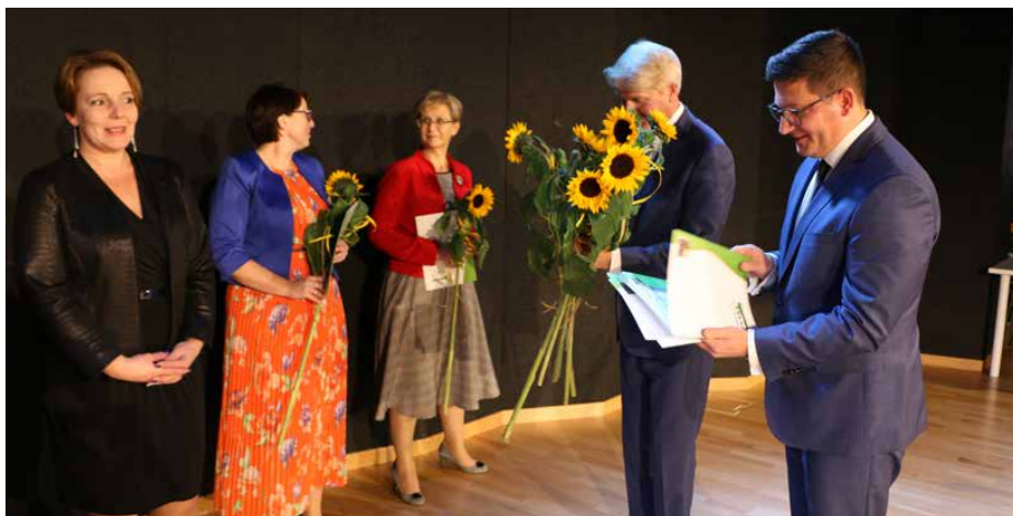
Tegoroczny Dzień Edukacji Narodowej świętowano w Centrum Usług Społecznych

W TYM ROKU TRADYCYJNE OBCHODY DNIA EDUKACJI NARODOWEJ – POLSKIEGO ŚWIĘTA OŚWIATY - ODBYŁY SIĘ 11 PAŹDZIERNIKA W CENTRUM USŁUG SPOŁECZNYCH W STRYŻÓWICACH.