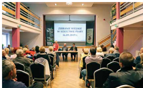
MIESZKAŃCY PODZIELILI FUNDUSZ SOŁECKI