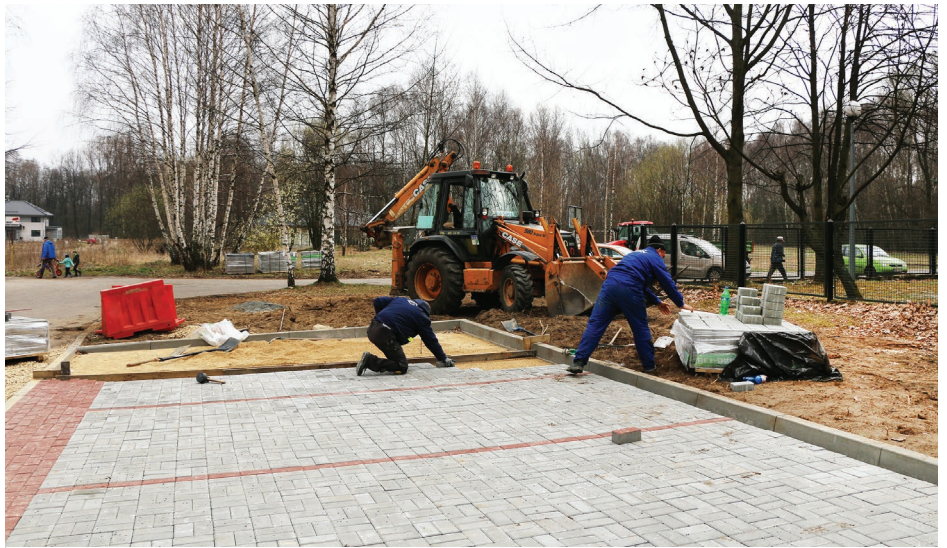
Pracownicy ZGK w trakcie budowy miejsc parkingowych

Dzięki budowie miejsc postojowych ulegnie poprawie komfort i bezpieczeństwo mieszkańców naszej gminy, którzy korzystają z usług medycznych w Ośrodku Zdrowia. Red.