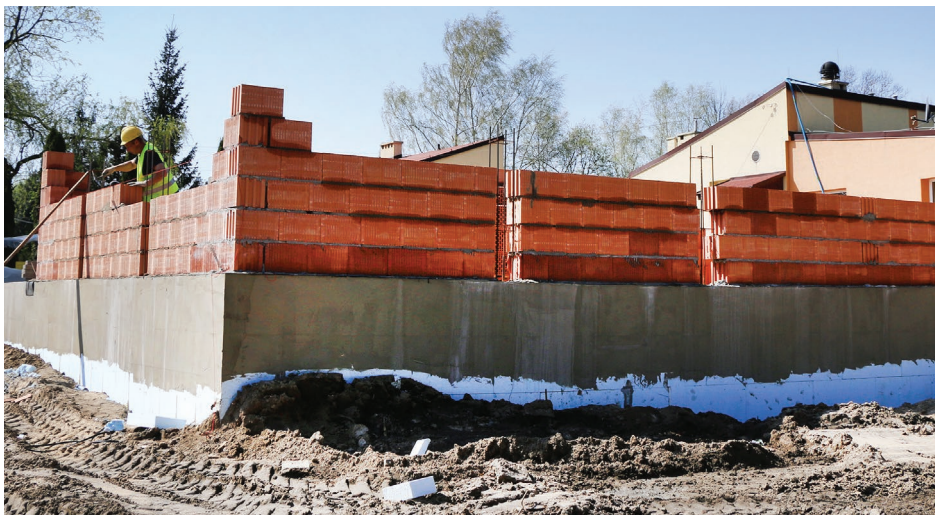
Budowa przedszkola w Gródkowie przy szkole podstawowej

Oprócz realizacji zadania infrastrukturalnego Gmina zamierza również