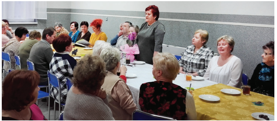
Spotkanie Klubu Seniora Gołąsza - Brzękowie