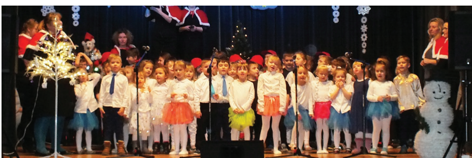
Występy przedszkolaków z Przedszkola Publicznego w Strzyżowicach

Na koniec wieczoru w piosence finałowej w rytmie wirujących płatków śniegu wszystkie przedszkolaki śpiewały po angielsku piosenkę „Snow flakes” z ży-