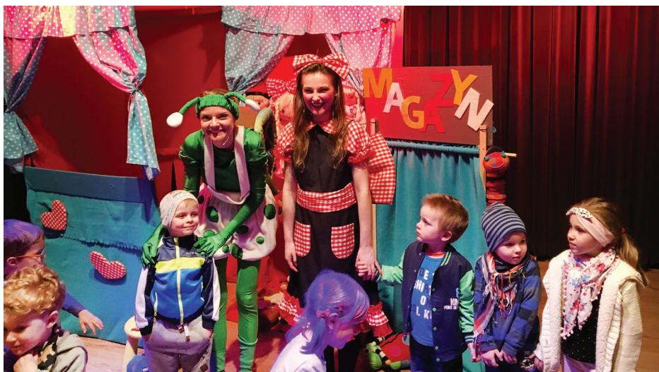
Teatrzyk „Pan Antenka i srebrny kubraczek” w GOK w Gródkowie

W styczniu w Górze Siewierskiej mali widzowie wraz z trzema wesołymi mólami podążali „Tropem zaginionej opowieści...”, w poszukiwaniu zbioru wierszy polskich poetów dla dzieci. W lutym w Malinowicach uczestnicy wyruszyli w bajkową „Cudowną podróż” w poszukiwaniu świętego Mikołaja. Z kolei w marcu w Gródkowie w spektaklu „Pan Antenka i srebrny kubraczek” widzowie przeżyli pełną przygód wycieczkę po sklepowych półkach z zabawkami. Łącznie we wszystkich trzech spektaklach wzięło udział prawie 300 dzieci, które mogły skorzystać z tej oferty bezpłatnie. Wszystkie spektakle angażowały młodych widzów do bezpośredniego udziału w nich. GOK.