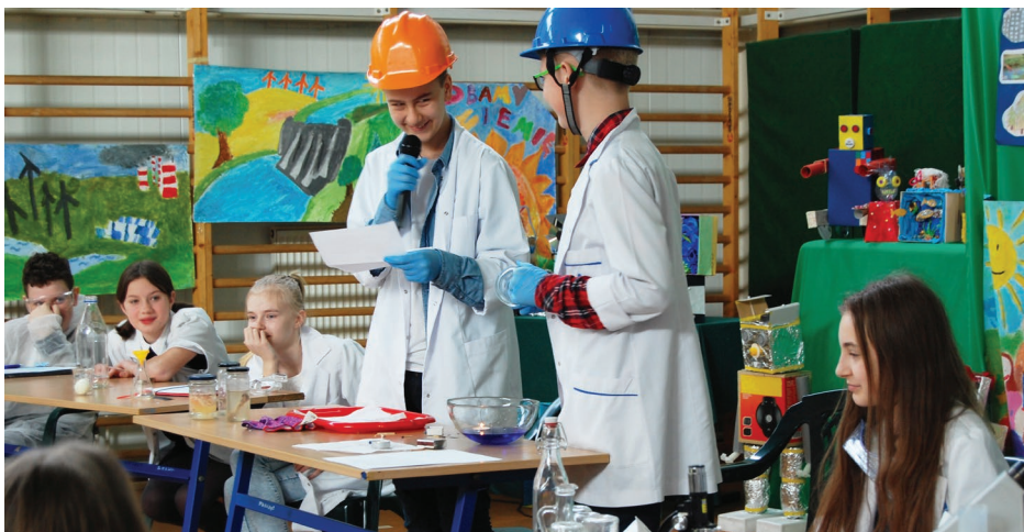
X Wiosenna Sesja Naukowa w SP w Sarnowie

Jedna z grup przekonywała, że przyroda zbudowana jest z drobin - atomów, które są w nieustannym ruchu, prezentując zjawisko dyfuzji w powietrzu i cieczy. Inna pokazała jak w butelce po wodzie mineralnej osiągnąć podciśnienie i jakie skutki może ono wywołać w naszym otoczeniu. Było badanie zawartości tlenu w powietrzu oraz symulacja „tornado” w butelce wraz z jednoczesnym opisem tragicznych skutków takich zjawisk w powietrzu. Był naoczny skutek oddziaływania kwaśnych opadów na organizmy