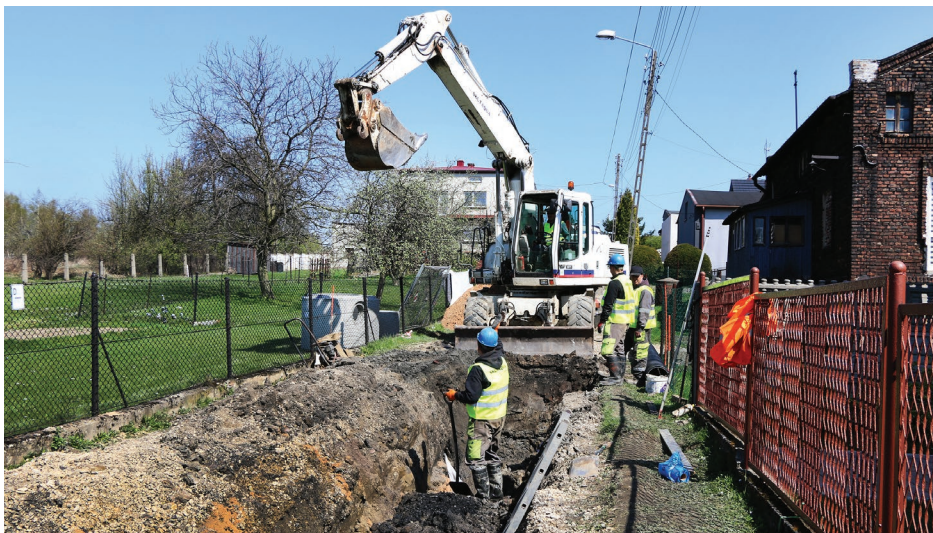
Budowa odwodnienia na ul. Wspólnej w Psarach i Gródkowie

Budowa ulicy Wspólnej w Psarach i Gródkowie obejmuje modernizację drogi gminnej o długości blisko 806 m i szerokości 3,5 m z obustronnym krawężnikiem. Nawierzchnia jezdni zostanie wykonana z kostki betonowej, a pobocza gruntowe zostaną wzmocnione kruszywem na szerokości ok. 0,5 m. Powstaną także zatoki umożliwiające wymijanie się pojazdów wykonane z