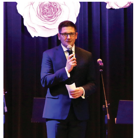
Wójt Gminy Psary złożył wszystkim paniom serdeczne życzenia