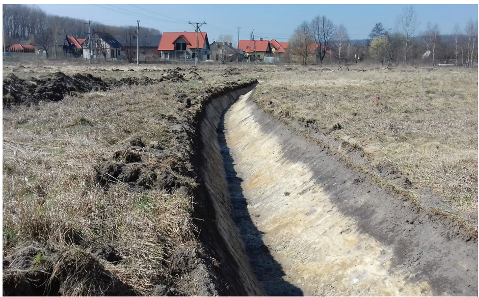
Przebudowa rowów na ul. Słonecznej w Malinowicach

Zgodnie z projektem zlikwidowane zostaną istniejące zaniedbane rowy, a w ich miejsce powstaną nowe o szerokości dna 0,4 m i nachyleniu skarp 1:1,5. Przewidziane jest również zarurowanie 5 odcinków przebudowanego rowu, o łącznej długości 54,5 m, rurami betonowymi WIPRO o średnicy 500 mm. Termin zakończenia prac planowany jest na połowę kwietnia, a koszt robót wyniesie ok. 61 000 zł brutto. Wykonane odwodnienie pozwoli na sprzedaż działek znajdujących się w drugiej i trzeciej linii zabudowy na Osiedlu Malinowice II już w czerwcu br. Red.