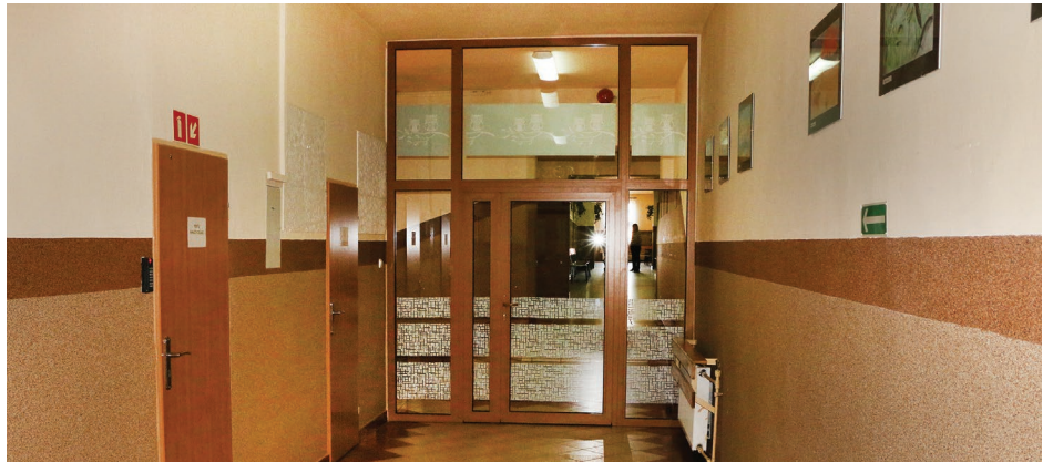
Zabudowana część korytarza w gimnazjum w Psarach, która będzie oddzielała część dla dzieci młodszych

ki Komunalnej, a jego koszt wyniósł 27 300 zł brutto. Do końca tego roku szkolnego nowe pomieszczenia przeznaczone dla przyszłej klasy pierwszej zostaną wyposażone w nowe meble,