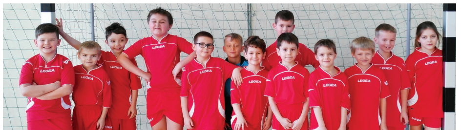
Reprezentanci Gminnej Akademii Piłki Nożnej

W czasie zimowej przerwy nasi młodzi piłkarze nie próżnowali i brali udział w wielu turniejach halowych. Dlatego już wiosną tego roku najstarsi zawodnicy rozegrają swoje mecze na stadionie LKS Iskra Psary, pozostali natomiast kontynuować je będą na boisku Orlik przy Gimnazjum w Psarach. Najmłodszy zaś adepci piłki z 2010 rocznika po bardzo owocnym debiucie, w którym pokonali Zew Kazimierz 11:8 rozpoczną swe zmagania w Ogólnopolskim Turnieju Deichmanna, który odbędzie się w Mysłowicach. Przez sześć kolejnych niedziel w bardzo przyjaznej i rodzinnej atmosferze rywalizować będą z drużynami z pobliskich miast, co pozwoli im zdobyć niezbędne w dalszym