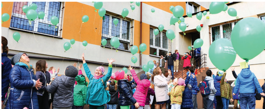
Moment wypuszczenia balonów przez uczniów SP Strzyżowice

O godzinie 10:00 zielone balony poszybowały w powietrze. Każdy z nich miał dołączony bilecik z danymi