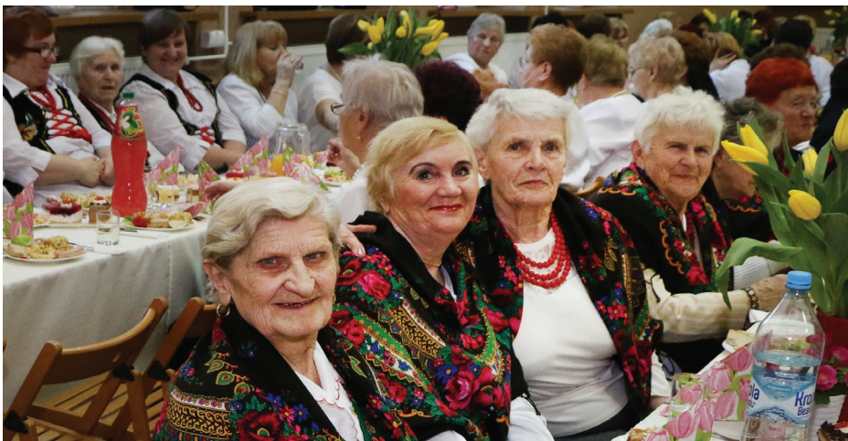
Czonkinie KGW Psary na Gminnym Dniu Kobiet

pań z naszej gminy ma okazję i niewątpliwą przyjemność razem się spotkać w radosnej, serdecznej atmosferze w murach zawsze gościnnego Gminnego Ośrodka Kultury Gminy Psary. Red.