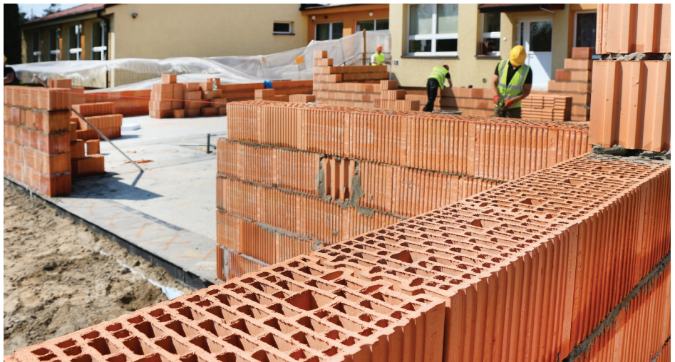
Budowa przedszkola w Gródkowie przy szkole podstawowej

Aktualnie powstały już ławy i ściany. c.d. na str. 3