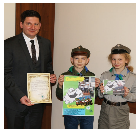
II Zagłębiowska Drużyna Harcerska „Leśni”

segregować, a nie palić śmieci, informują jakim zagrożeniem jest smog i jak wpływa na zdrowie i życie dzieci oraz dorosłych. - Jesteście kochającymi rodzicami i dziadkami? Nie palcie w piecach odpadkami. Smog szkodzi zdrowiu dużym i małym, więc zwalczajmy go z zapalem. Piece gazowe niech zastąpią węglowe – a powietrze, którym oddychamy, będzie zdrowe! - apelują harcerze. Apelują i zachęcają do oglądania. „Bajka o Smogu” dostępna jest m.in. na www.youtube.com/GminaP-sary Red.