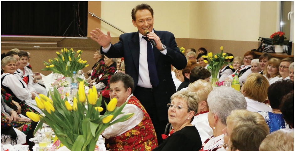
Jacek Borkowski podczas występu w Gminnym Ośrodku Kultury w Gródkowie

Poczęstunek zebranym zapewnił GOK Gminy Psary, a oprawę artystyczną spotkania stanowił bogaty występ muzyczno-kabaretowy znanego aktora Jacka Borkowskiego oraz koncert w