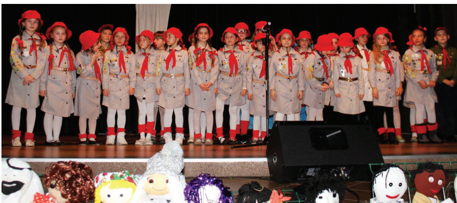
Występy artystyczne podczas koncertu „Wszystkie kolory świata” w GOK w Gródkowie

została ze specjalnie przygotowanym programem artystycznym „Morskie opowieści”, co stanowiło podsumowanie akcji.