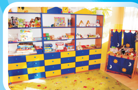
Kącik zabaw w szkole w Sarnowie.

Zapraszamy do zapoznania się z opiniami ekspertów dotyczącymi pójścia dzieci sześciolatków do szkół na stronie Ministerstwa Edukacji Narodowej w zakładce Życie Szkoły: www.men.gov.pl