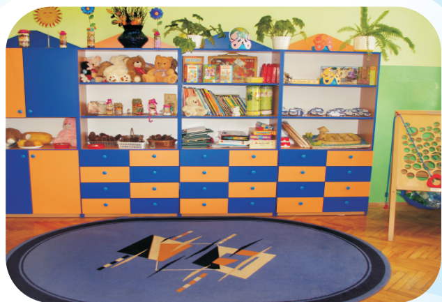
Sala zajęć dla kl. I w szkole w Sarnowie.